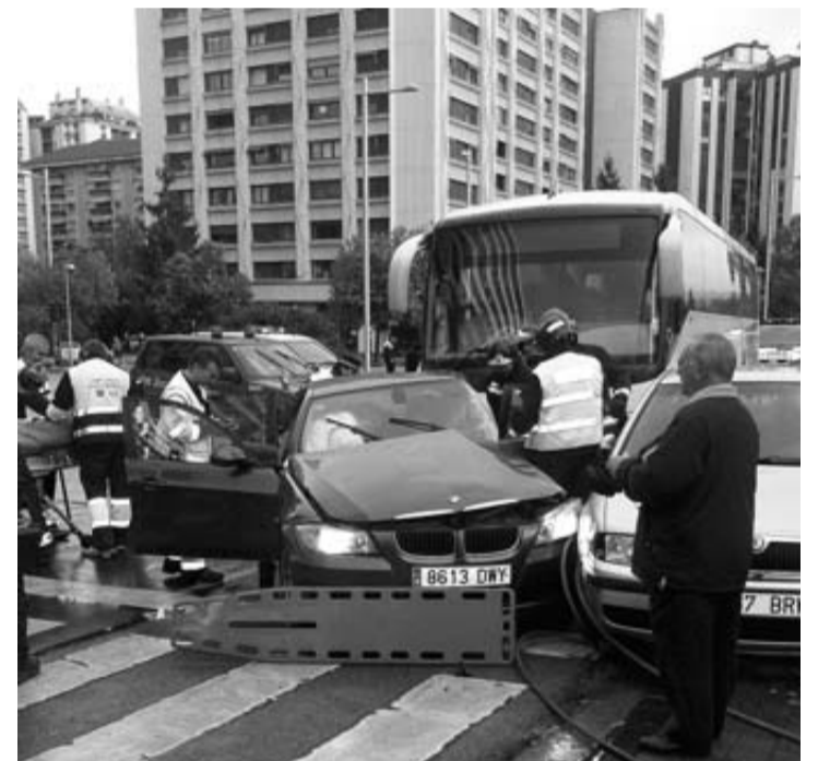
Bomberos y médicos, junto al coche de madre e hijo y el autobús.

Sos Navarra movilizó a los bomberos de Cordovilla. El choque en el lado de la conductora provocó que éstos tuvieran que levantar el techo del turismo para rescatar a la mujer, que fue evacuada junto a su hijo.