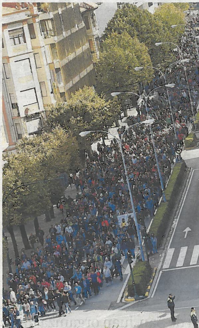
Manifestación celebrada en la huelga general del 26-S.

● Reducción de jornada. Este tipo de expedientes ha experimentado un crecimiento espectacular respecto al año pasado, ya que casi se han multiplicado por tres entre febrero y septiembre respecto a los mismos meses del año pasado. Si en este tiempo se han presentado 120, en 2011 fueron 39. En esta clase de ERE, a diferencia de lo que sucede con un expediente de suspensión, los empleados acuden todos los días a sus puestos de trabajo, pero durante menos horas. En cambio, en los ERE de suspensión, la plantilla deja de ir a la empresa los días que ella dicta. Estos ERE son habituales en el sector servicios y oficinas.