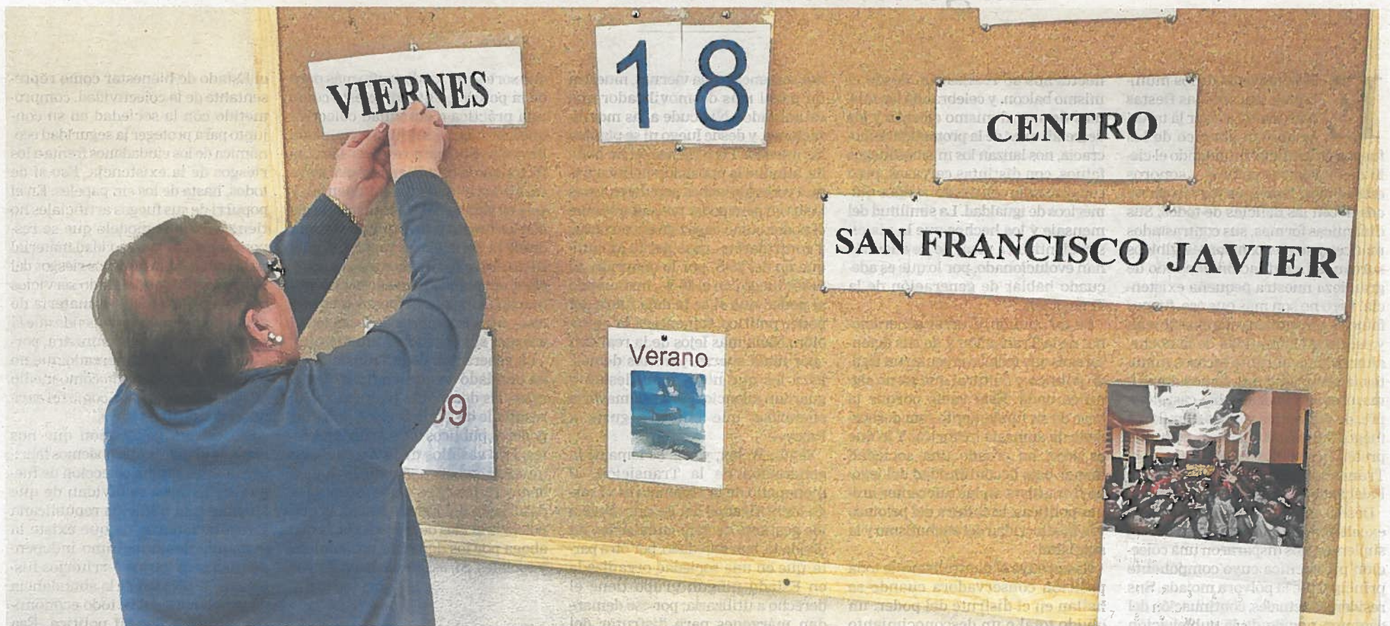
Una mujer participa en una de las actividades de la Unidad de la Memoria del Centro Psicogeriátrico San Francisco Javier.

CÁNCER DE MAMA NUTRIDA PRESENCIA EN LA CARRERA SOLIDARIA ORGANIZADA POR SARAY P. 8