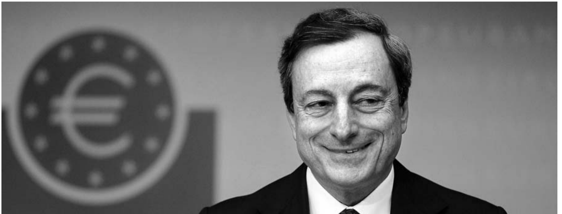
El presidente del BCE, Mario Draghi, durante una rueda de prensa en la sede de la institución en Frankfurt (Alemania), el pasado 6 de junio.

En medio de la tormenta, el italiano, imperturbable, sigue adelante con su revolución silenciosa al frente del BCE.