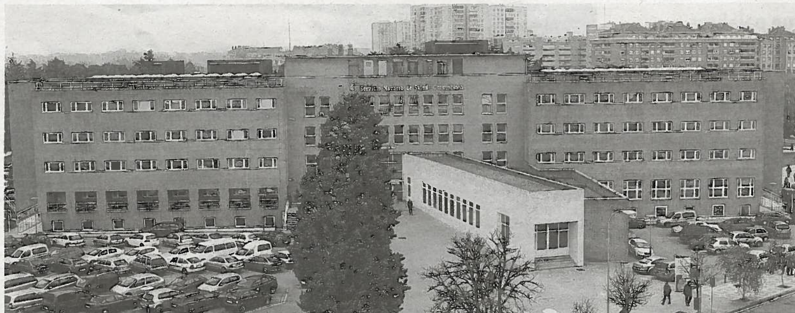
Edificio de consultas externas Príncipe de Viana.