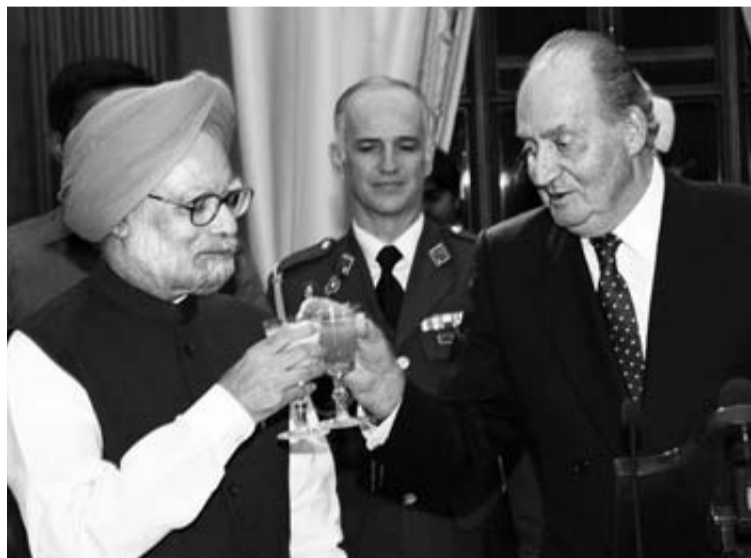
El Rey brinda con el primer ministro indio, Manmohan Singh.

Don Juan Carlos se declaró "satisfecho" con el balance de la visita oficial a la India, y subrayó