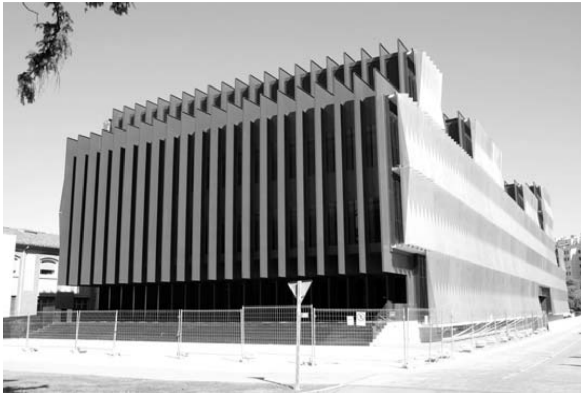
Edificio del Centro de Investigación Biomédica donde se ubicará el Laboratorio Unificado de Navarra.