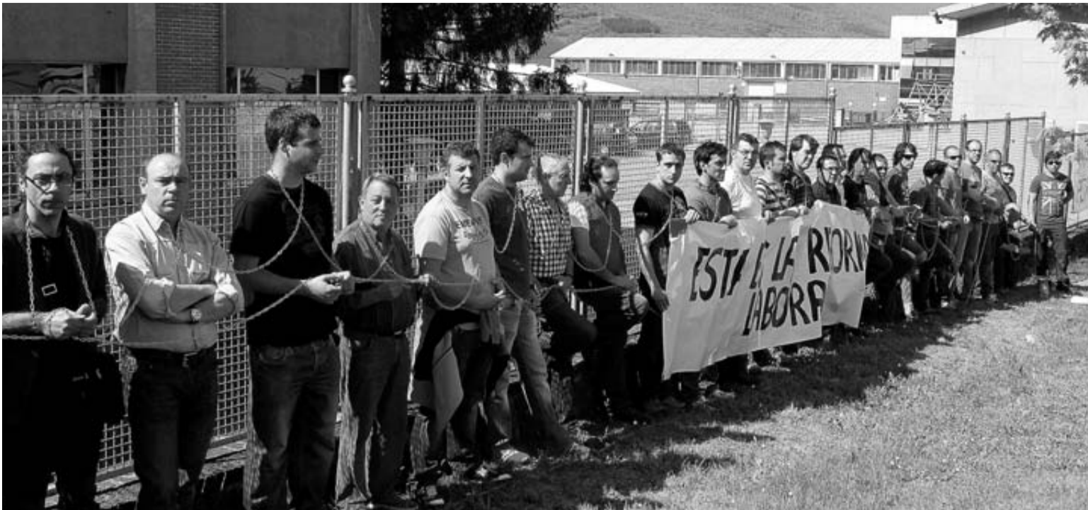
Protesta de los trabajadores de Inasa, en una imagen de archivo.