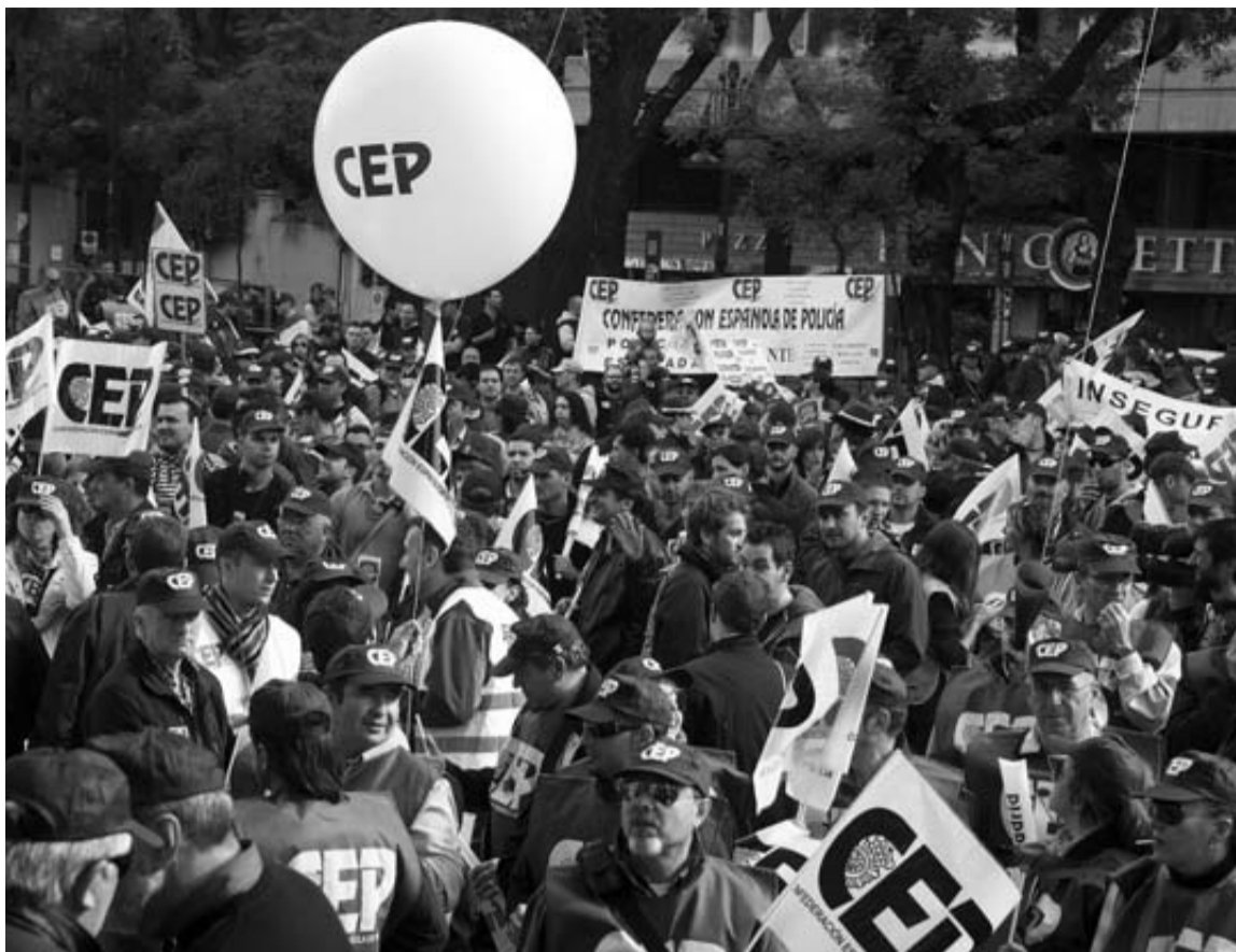
Policías se manifiestan en el paseo de la Castellana de Madrid contra la política de recortes del Gobierno.