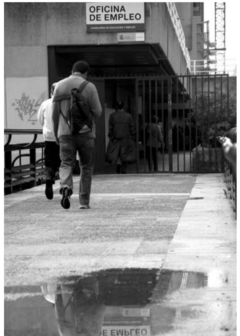
Gente entrando en una oficina del INEM en Madrid, el pasado viernes.

Precisamente el pasado miércoles, el Consejo General del Poder Judicial (CGPJ) rechazó estudiar un informe, encargado por este mismo organismo, que revisa