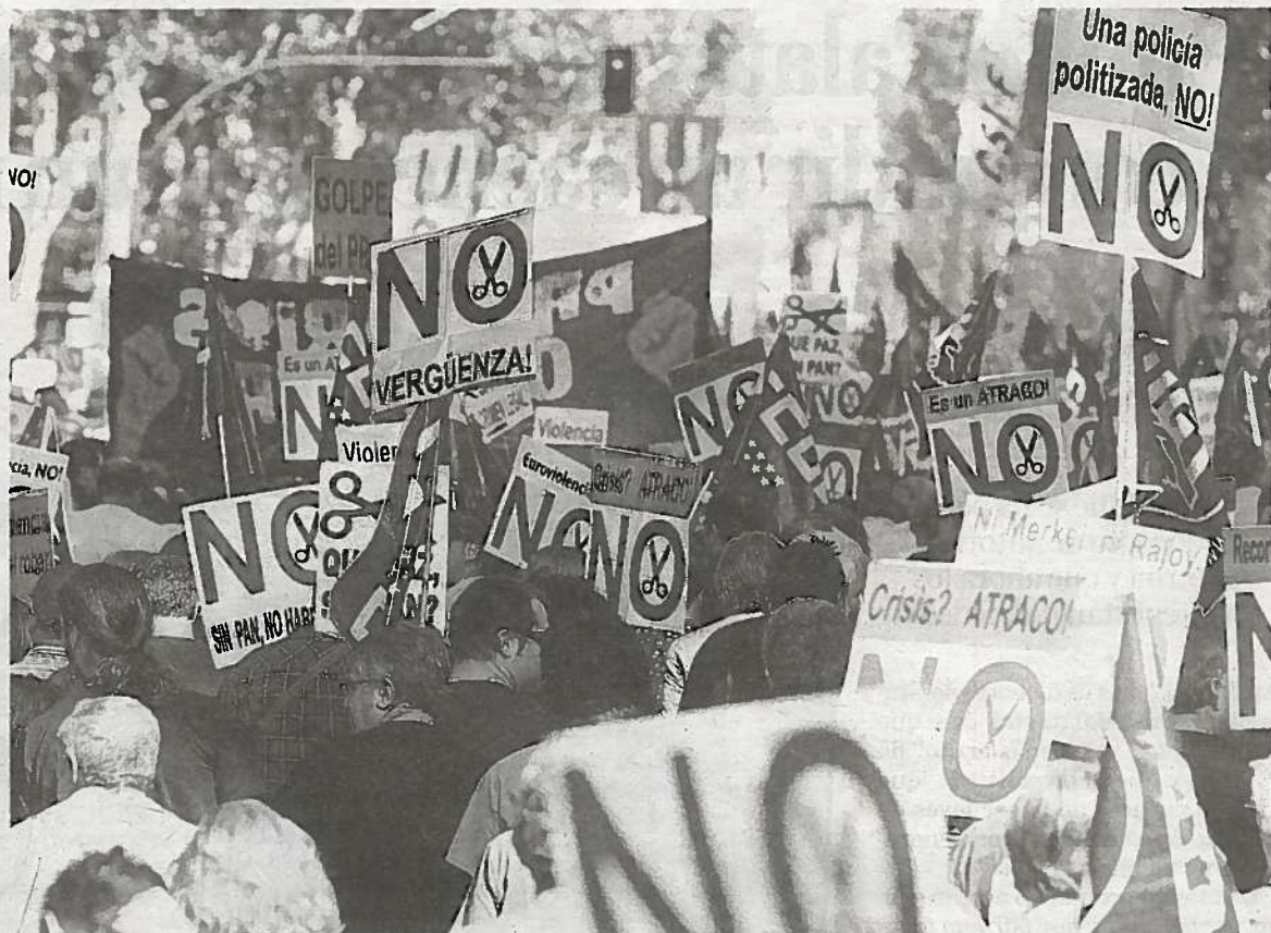
Fotografía de archivo de la manifestación contra los presupuestos generales del Estado, en Madrid.

Sin duda. Si el gobierno ha dictado más de veinte Decretos Legislativos en menos de seis meses, uno que proteja a los deudores hipotecarios podría aprobarse mañana mismo.