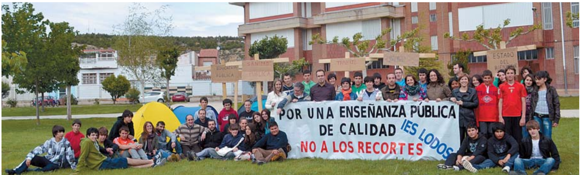
Los profesores y algunos alumnos en el patio del instituto de Lodosa delante de las tiendas de campaña con la pancarta y las cruces de madera de protesta.

Además de todo esto, se ha resaltado la importancia de contar con métodos de análisis efectivos para cuantificar los riesgos estudiados. La existencia de métodos más sensibles y precisos redundará en una mayor eficacia del trabajo de muestreo y permitirá tomar un menor número de muestras para detectar de manera prematura un posible riesgo. Este menor número de muestras, y por tanto de análisis, se traducirá en un ahorro económico de gran interés para productores y autoridades. Durante los próximos meses y hasta el final del proyecto (en julio de 2013) se validarán y armonizarán los métodos de muestreo y los métodos analíticos desarrollados.