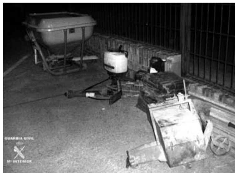
Objetos incautados a los sospechosos del robo en Andosilla.

Tras identificar a los ocupantes realizaron un registro superficial del interior y en la parte trasera, en el habitáculo de carga, encontraron una motosierra, una mochila atomizadora (sulfa-