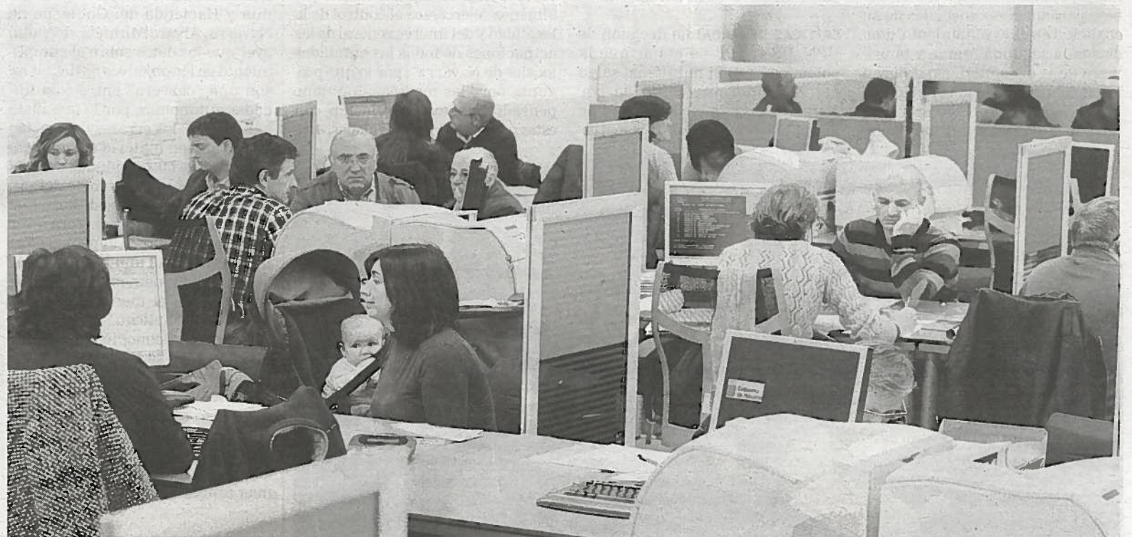
Varias personas, haciendo su declaración de la renta de 2011 durante el primer día de la campaña.

monio coincidiría además con el final del recargo al IRPF que el Gobierno de Navarra aprobó el pasado mes de febrero, con una fórmula muy similar a la que ha puesto en marcha el Estado aunque con márgenes ligeramente inferiores para los contribuyentes navarros, y que desde el inicio se defendió como una medida extraordinaria y temporal para los ejercicios 2012-2013. Fecha para la que queda también el Impuesto del Patrimonio, que desaparecerá siempre y cuando el Ejecutivo no cambie unas previsiones económicas que todavía siguen siendo demasiado inciertas.