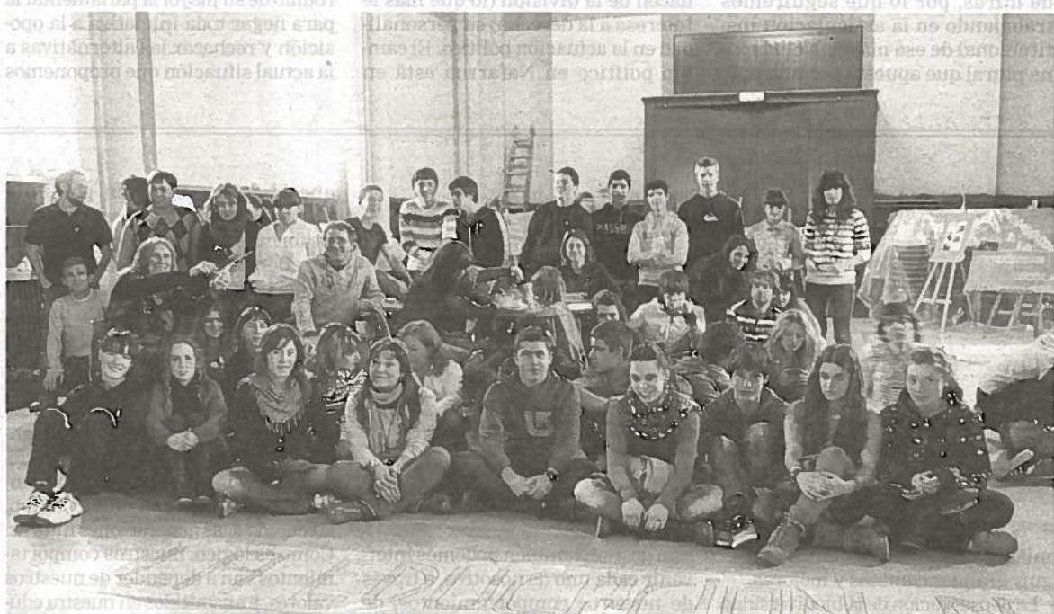
Sentada de estudiantes y docentes del IES Sierra de Leyre de Sangüesa.

nada de huelga, al menos una veintena de centros educativos celebraron diversas acciones y asambleas en las que participaron docentes, familias y estudiantes. Según informaron los sindicatos y el blog ezdagosalgainosevende.wordpress.com , las escuelas Bernart Etxepare, Patxi Larrainzar, San Jorge, Ermitaberri, Camino de Santiago, Erreniega y Catalina de Foix y los institutos de Mendillorri, Mendavia, Lodosa, Eunate, Irubide, Sierra de Leyre, Itu-