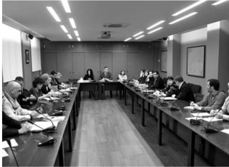
Imagen de la Mesa General de Función Pública. DN

Pérdida de 3.000 empleos CC OO rechazó ayer en la Mesa General de Función Pública el paquete de medidas en materia de personal y advirtió de que varias de esas medidas podrían provocar entre 2011 y 2013 una reducción de plantillas de más de 3.000 personas en el conjunto de las Administraciones públicas. La no reposición de las jubilaciones ya supone, según el sindicato, la reducción de 400 puestos anuales de su plantilla orgánica. Cita también la pérdida de 350 empleos ya entre el personal de enfermería, "sin cuantificar todavía el efecto de la nueva organización de servicios". Cifra en 500 la pérdida de empleos en Educación y 100 más derivados del aumento de jornada.