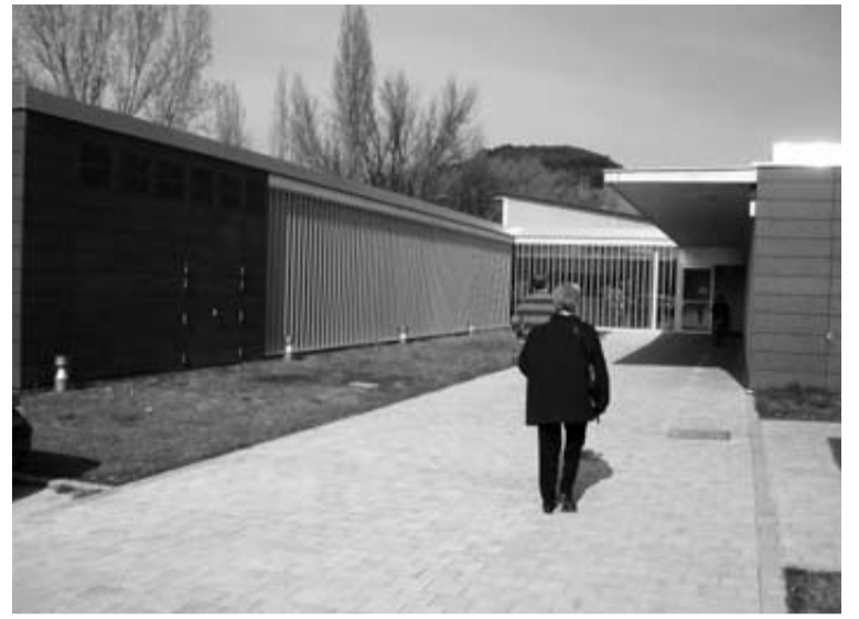
Acceso al centro de salud de Sangüesa.

"Y, aparte, está el hecho de que muchos médicos o enfermeras no son de aquí, por lo que o tendrán que alquilar un piso, pues tienen que estar localizables en la zona, o acabarán durmiendo en el centro de salud, como hasta ahora, pero sin cobrar por estar de guardia allí. Un despropósito desde todos los puntos de vista", considera.