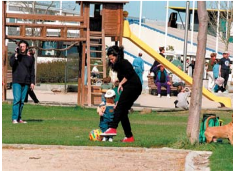
Imagen de un parque infantil.

Por otro lado, si se incluyen las familias que soliciten nuevas