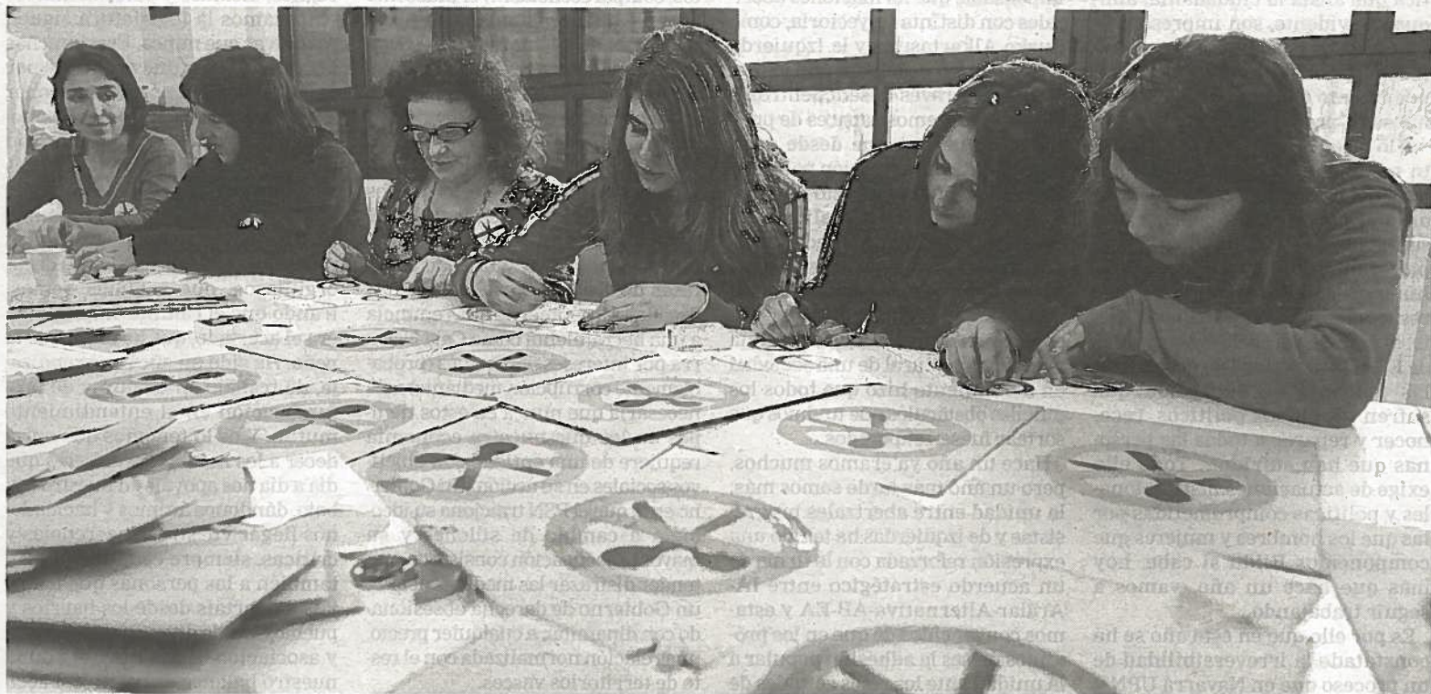
Profesoras del IES Askatasuna de Burlada elaboran pegatinas y cartulinas para la manifestación de este mediodía.

ES LA PRIMERA JORNADA DE PARO CONVOCADA POR 8 DE 9 SINDICATOS EN LA ENSEÑANZA PÚBLICA