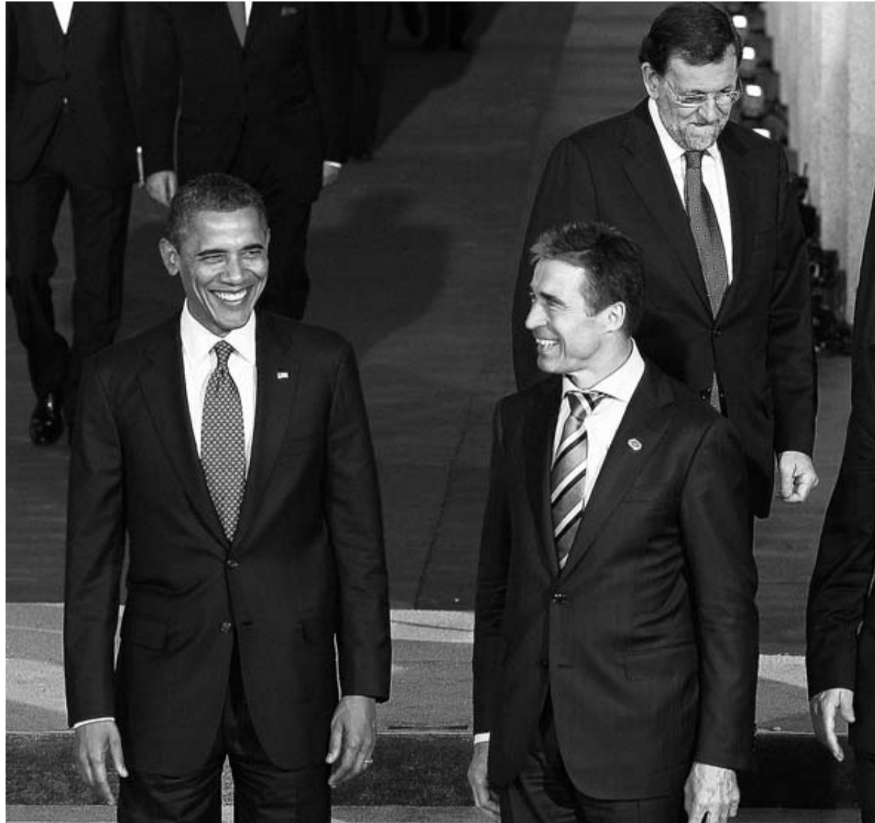
Anders Fogh Rasmussen y Mariano Rajoy observan el gesto de Barack Obama en el inicio de la cumbre.

Aún así, el 'número dos' de la Comisión, insistió en la necesi-