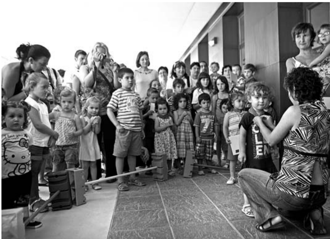
Imagen de archivo del final de curso del año pasado de la escuela infantil Arieta.

Pese a contemplarse en principio como condición del baremo, Educación lo replanteó luego y dejó la decisión en los consistorios titulares de cada 0 a 3. Estella no había aclarado qué pauta iba a seguir hasta ayer, cuando se decidió por dejar de momento las cosas como están y sufragar la parte de todos los matriculados sean del municipio o de otros cercanos que –como Ayegui o pueblos de Yerri, entre otros– desplazan a los pequeños hasta Arieta.