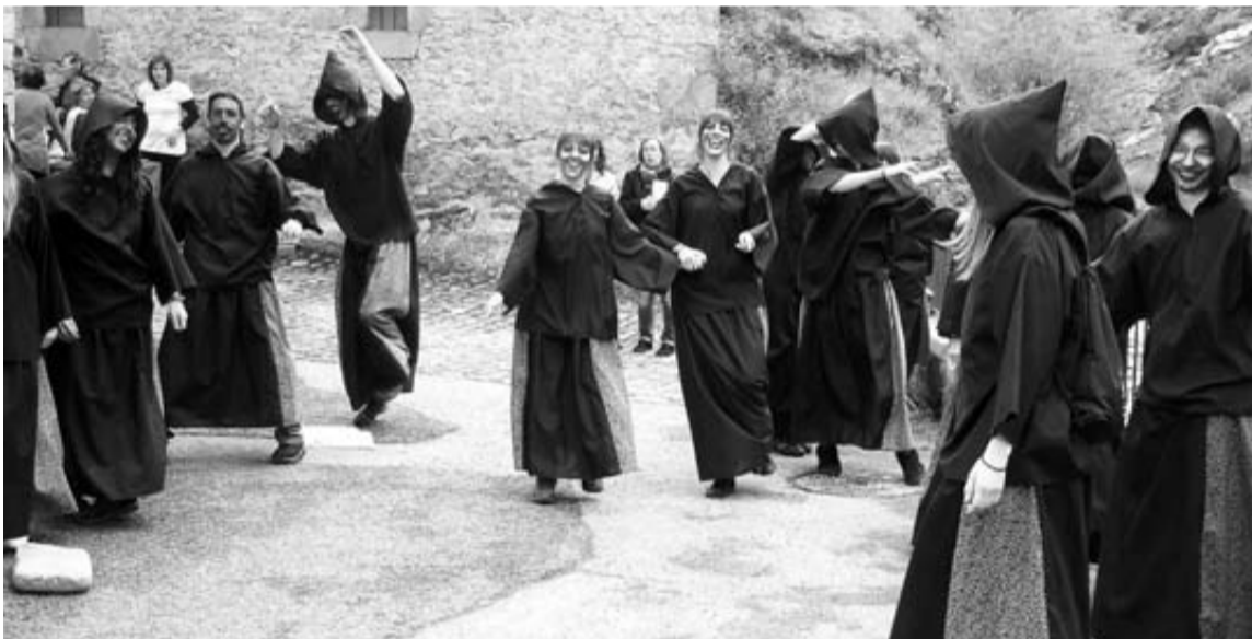
Jóvenes de Vidángoz, vestidos de brujos como en la bajada de la Bruja Maruxa de las fiestas de agosto. DN

El pleno del Ayuntamiento de Sangüesa también aprobó una declaración institucional que declaró a la localidad como 'Ciudad solidaria con el alzheimer'. Así, Sangüesa quiere "servir de ejemplo a otros municipios y apoyar la sensibilización de la sociedad, instituciones y políticos sobre este problema sociosanitario de primera magnitud". Afecta en España a 3,5 millones de personas. "Sangüesa apoya la iniciativa liderada por la Alianza por el Alzheimer que reivindica la puesta en marcha de una Política de Estado de Alzheimer", dicen. El pasado domingo 13, pasó por la ciudad el periodista navarro Guillermo Nagore, que camina entre Finisterre y Jerusalén (7.000 km) para concienciar sobre este tema.