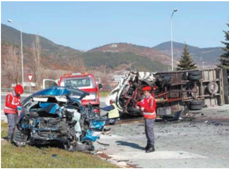
Policía Foral atiende uno de los accidentes ocurridos en el tramo.