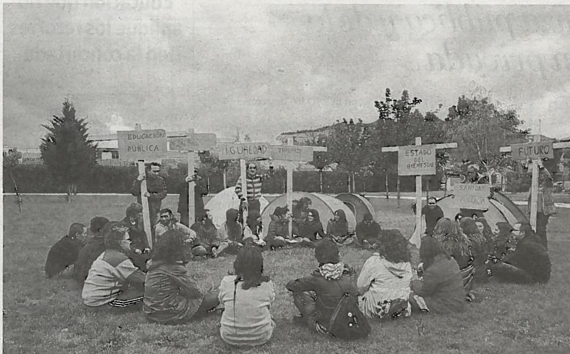
Varios profesores del IES Pablo Sarasate de Lodosa durmieron ayer en tiendas de campaña.

lada partirán del Bar Unzu de esta última localidad y se juntarán a la altura del Seminario con los que salgan desde Mendillorri.