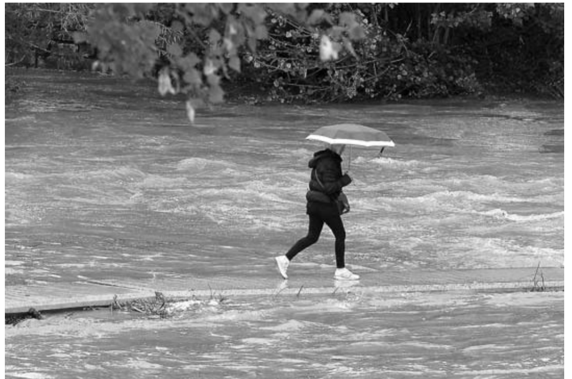
La crecida del río Arga ayer casi tapaba las pasarelas junto al Club Natación de Pamplona.

Todo apunta a que el fin de semana, y a diferencia del pasado, se vivirá con buen tiempo. Probablemente las temperaturas descenderán unos grados respecto a los 30º que se alcanzan el viernes, pero la probabilidad de alguna lluvia o tormenta será, en principio, baja.