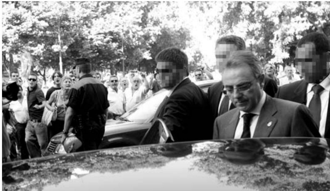
Miguel Sanz, con varios escoltas, en su etapa de presidente del Gobierno de Navarra.

Por otra parte la Policía Foral está investigando otra posible agresión sexual en Zizur durante este fin de semana. Se habría cometido en un bar la noche del sábado al domingo, aunque los datos recabados no son determinantes.