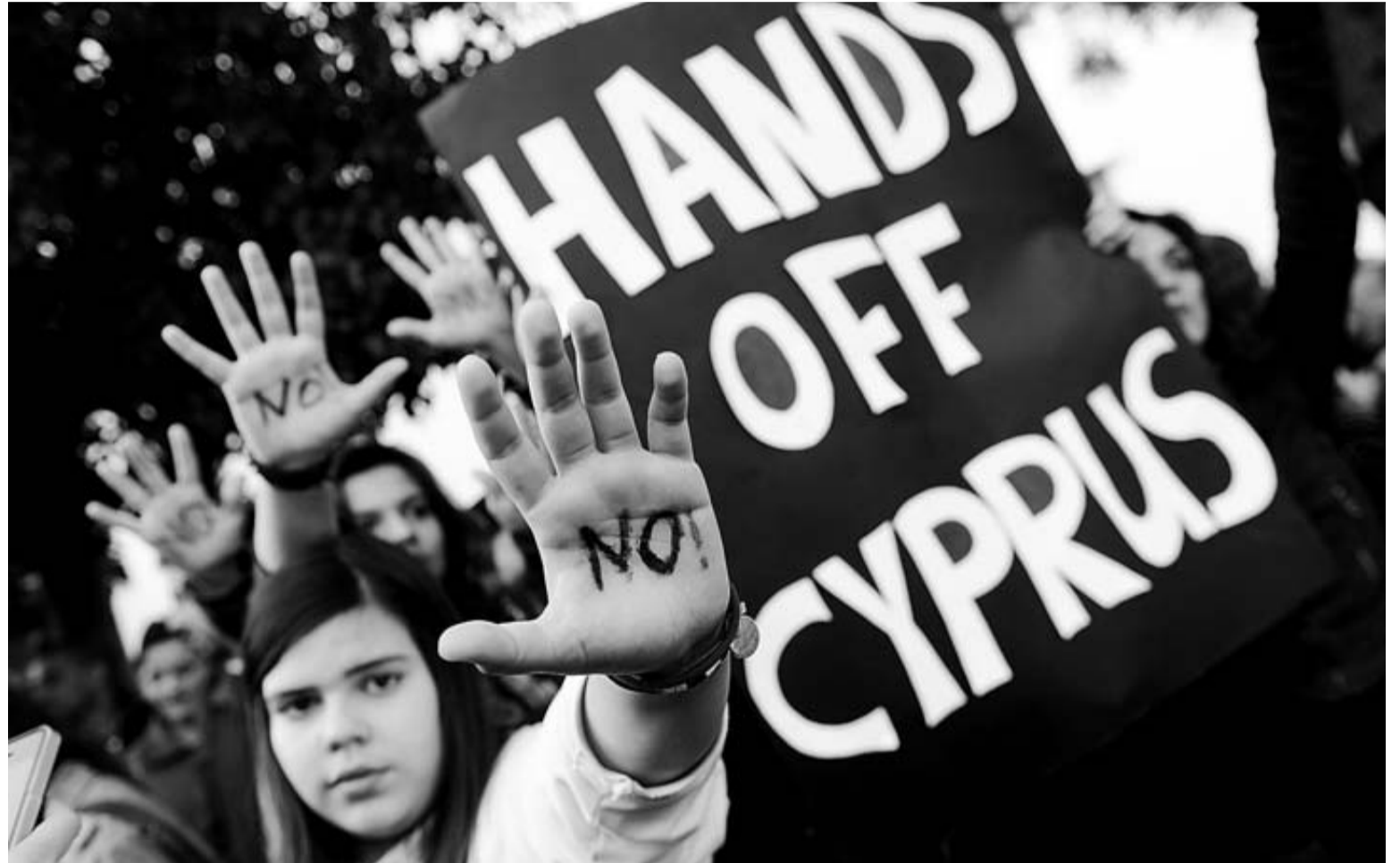
'Chipre no se toca', escrito en un cartel durante una protesta en Nicosia contra las medidas para salvar a la banca chipriota.

Los socios del euro se vieron obligados a dar marcha atrás después de constatar la irritación provocada tanto en Chipre como en el resto de Europa. Hasta ahora, el club de la moneda única no había traspasado la línea roja de querer hacer pagar a los pequeños ahorradores por la recapitalización de la banca de su país. En el caso de la isla mediterránea, que cuenta con apenas 800.000 habitantes, su rescate se debe al hundimiento de un sector financiero desproporcionado que supera en ocho veces el PIB nacional. El malestar también es-