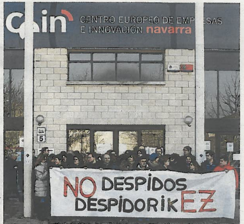
El ERE en Cein fue uno de los ejecutados en febrero.

● Empleados más. En dos meses, casi 3.500 trabajadores se han visto perjudicados por algún tipo de ERE, 1.100 más que en el mismo periodo del año pasado, cuando los afectados fueron 2.394.