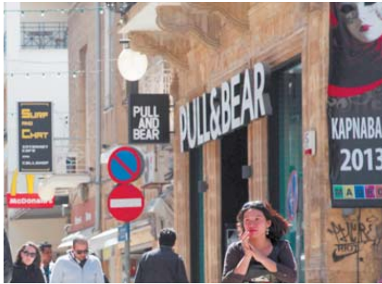
La calle Ledra, centro comercial de Nicosia.

Alemania recela enormemente de Chipre porque se sospecha que la banca del país blanquea dinero de magnates rusos dedicados a actividades de dudosa legalidad. El Gobierno de Merkel y otros países