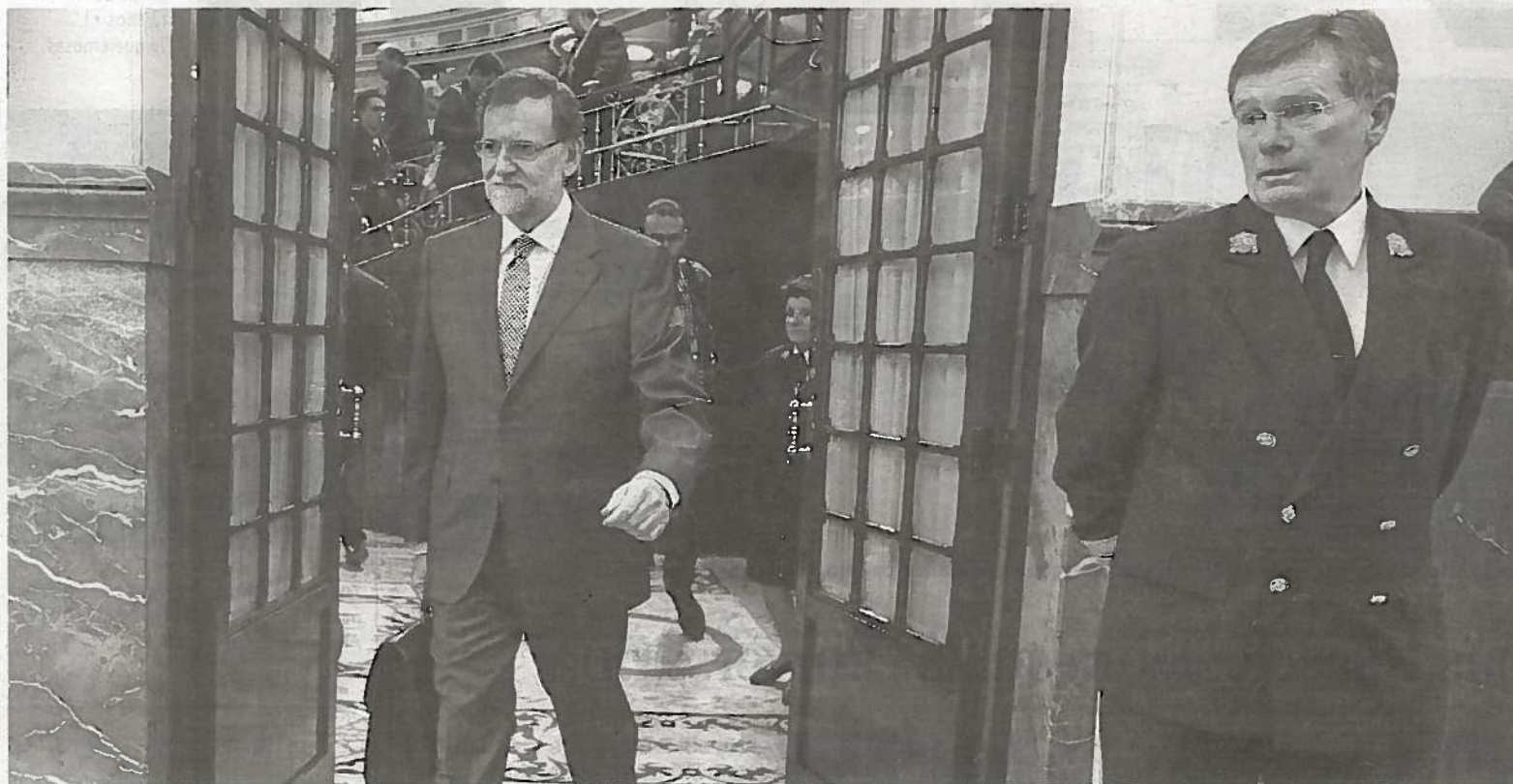
Mariano Rajoy deja el Congreso de los Diputados.

'CORRALITO' EL RESCATE A CHIPRE ENFURECE A SU POBLACIÓN Y CONTAGIA A LAS BOLSAS P. 34-35