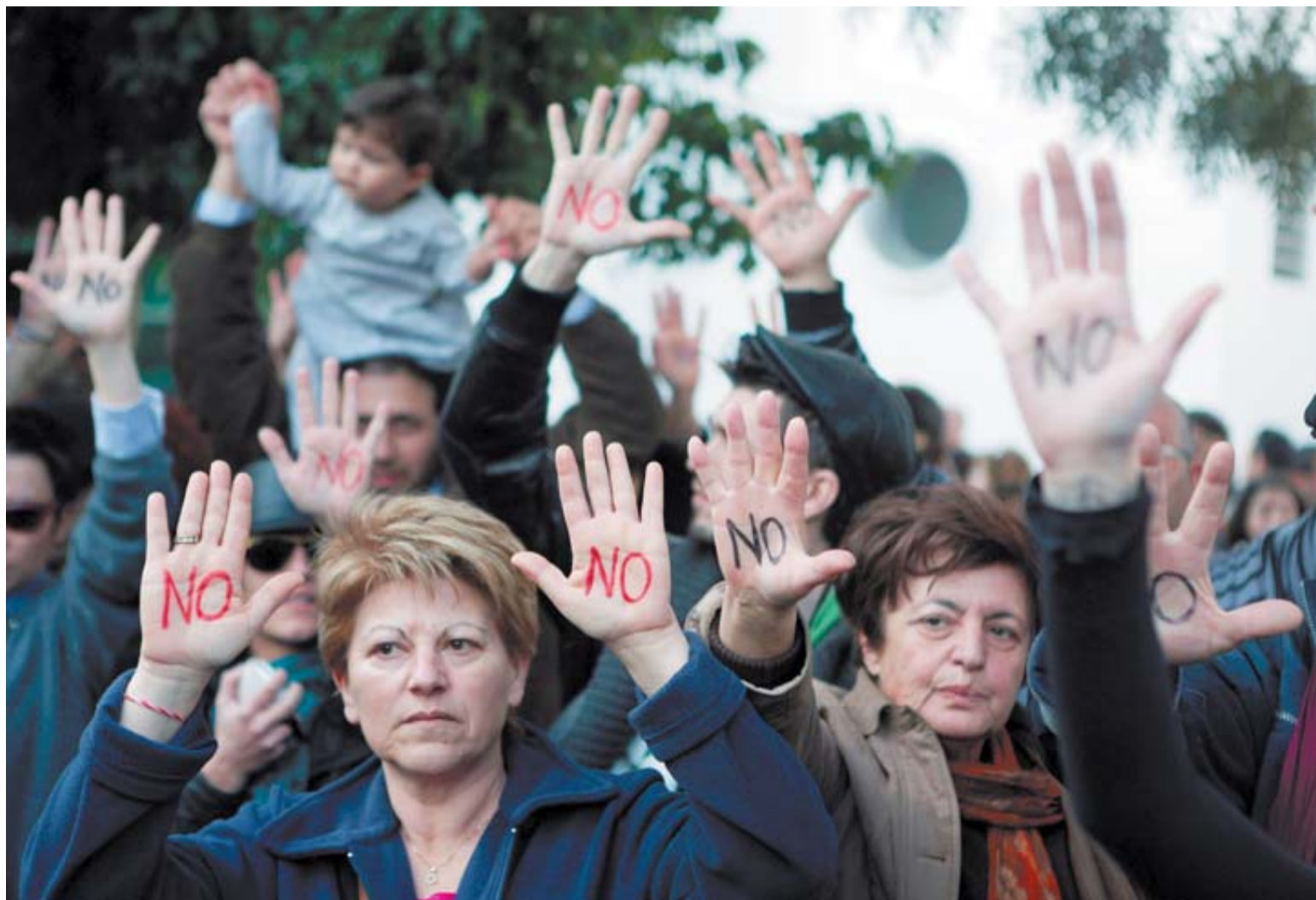
Un grupo de personas se manifiesta ante el parlamento de Chipre, en Nicosia, con un 'no' escrito en la mano.