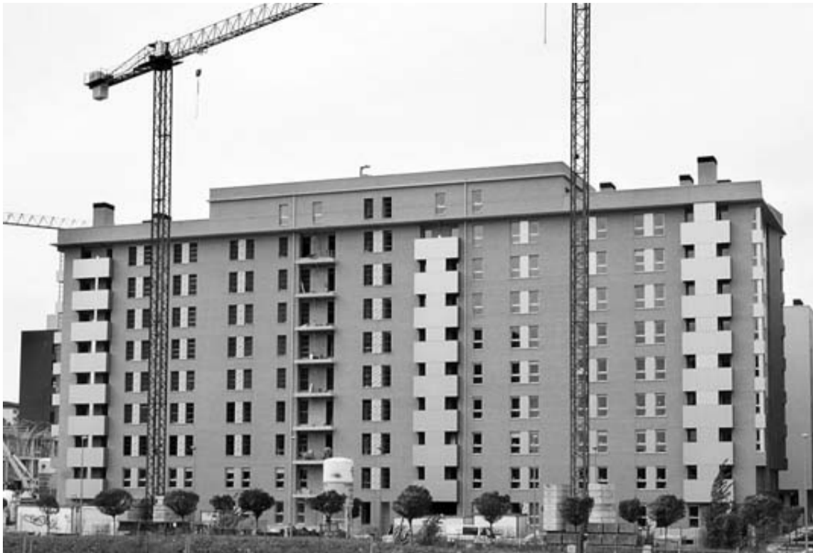
Imagen de un bloque de viviendas en construcción.