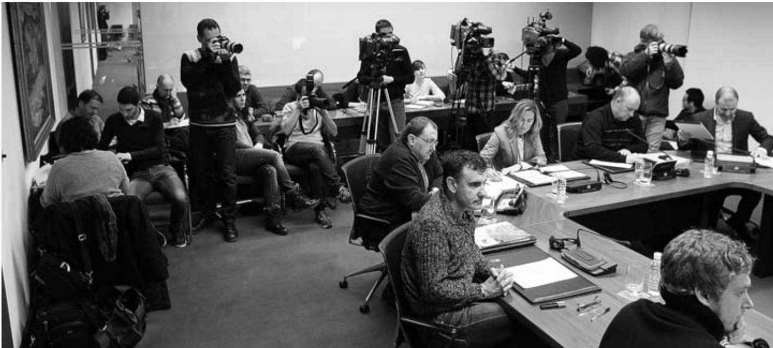
Al fondo, los periodistas, y en primer plano, parte de los parlamentarios, en la sala pequeña de comisiones en la que se celebró la sesión.