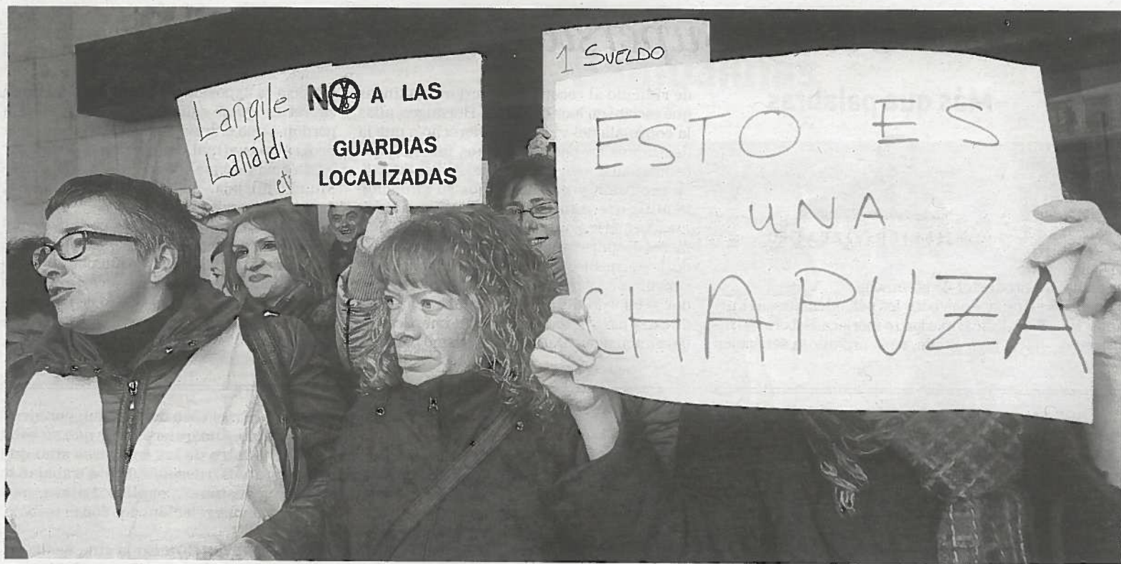
Personal sanitario del Servicio de Urgencias Rurales, ayer en la concentración de protesta ante la sede del SNS-O.