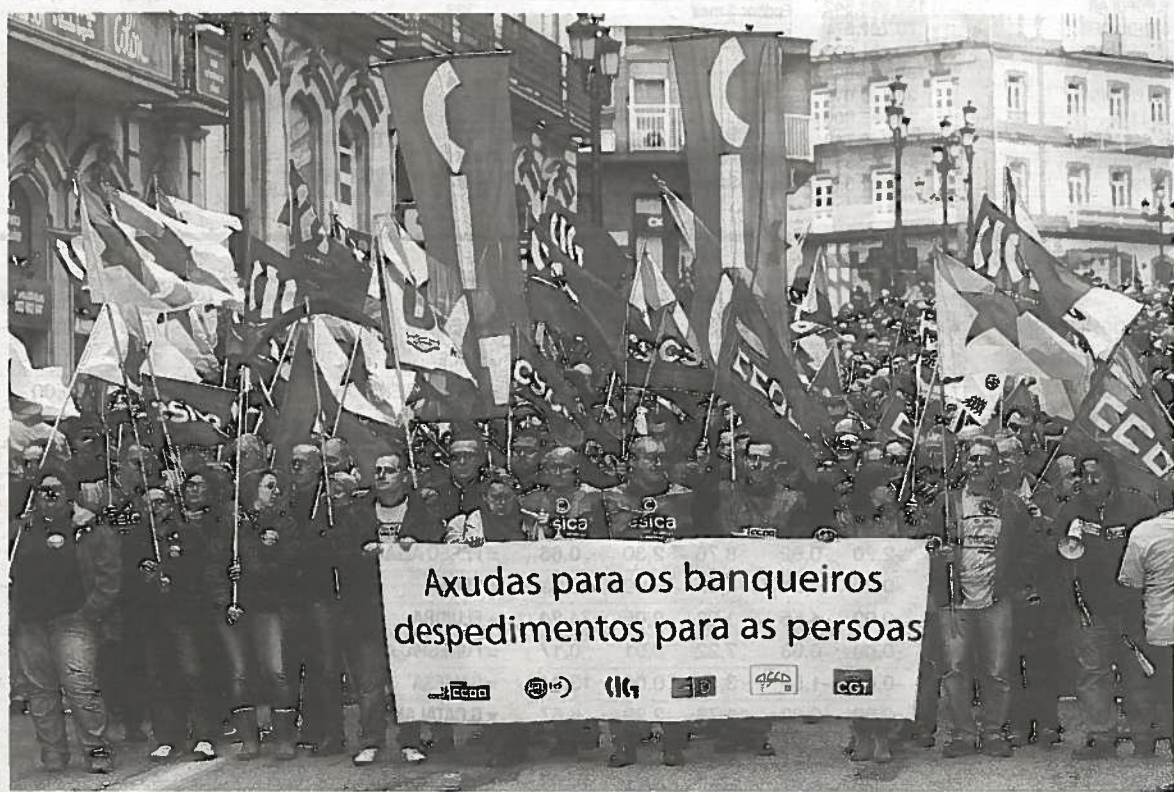
Protesta de los trabajadores de Novagalicia Banco ayer en las calles de Vigo.

Las partes pactaron también prejubilaciones voluntarias a partir de los 54 años, lo que beneficiará a alrededor 1.700 empleados, es decir, el 39% de los afectados por el ERE. La