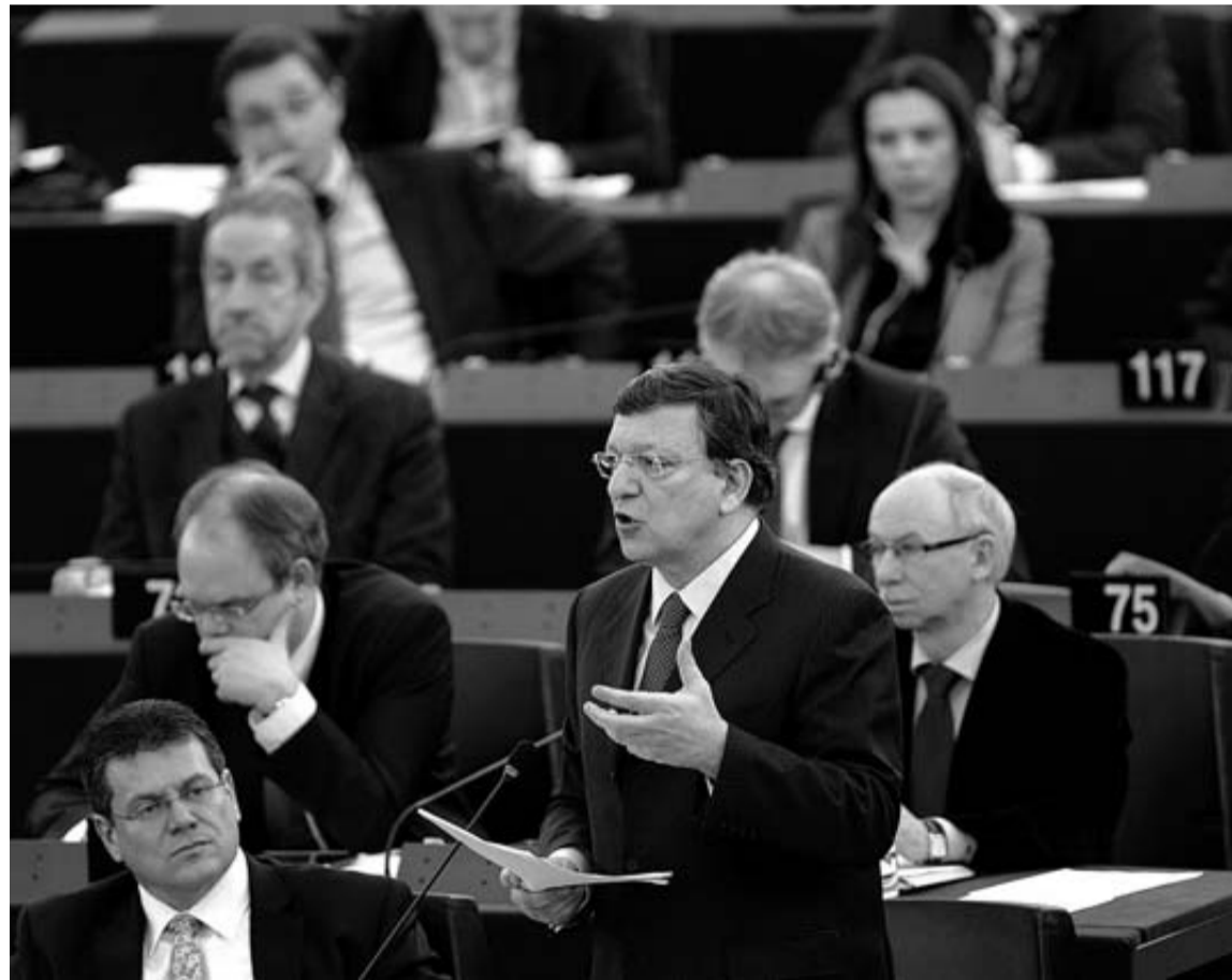
El presidente de la CE, José Manuel Durao Barroso, en su discurso de ayer ante el Parlamento Europeo.

Pese a las referencias a España, la zona euro parece más inquieta por las elecciones en Italia. Estos comicios, que se celebran los días 23 y 24 de este mes, se siguen mucho más de cerca por la incerti-