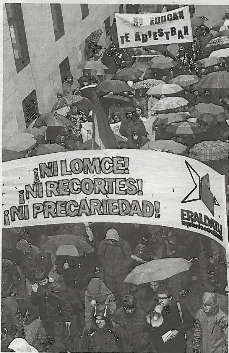
Los estudiantes, a su paso por Santo Domingo.

En el turno de los grupos, Bildu, NaBai e I-E criticaron la reducción de la partida y la sustitución del convenio por la convocatoria de ayudas, ya que creen que va a empeorar los servicios de euskera mientras que UPN y PPN defendieron la decisión del Gobierno. El PSN dijo entender la "sensación de incertidumbre e inquietud" de las técnicas y afirmó que seguirán de cerca la aplicación del cambio "para ver si se garantiza que el servicio es el más adecuado".