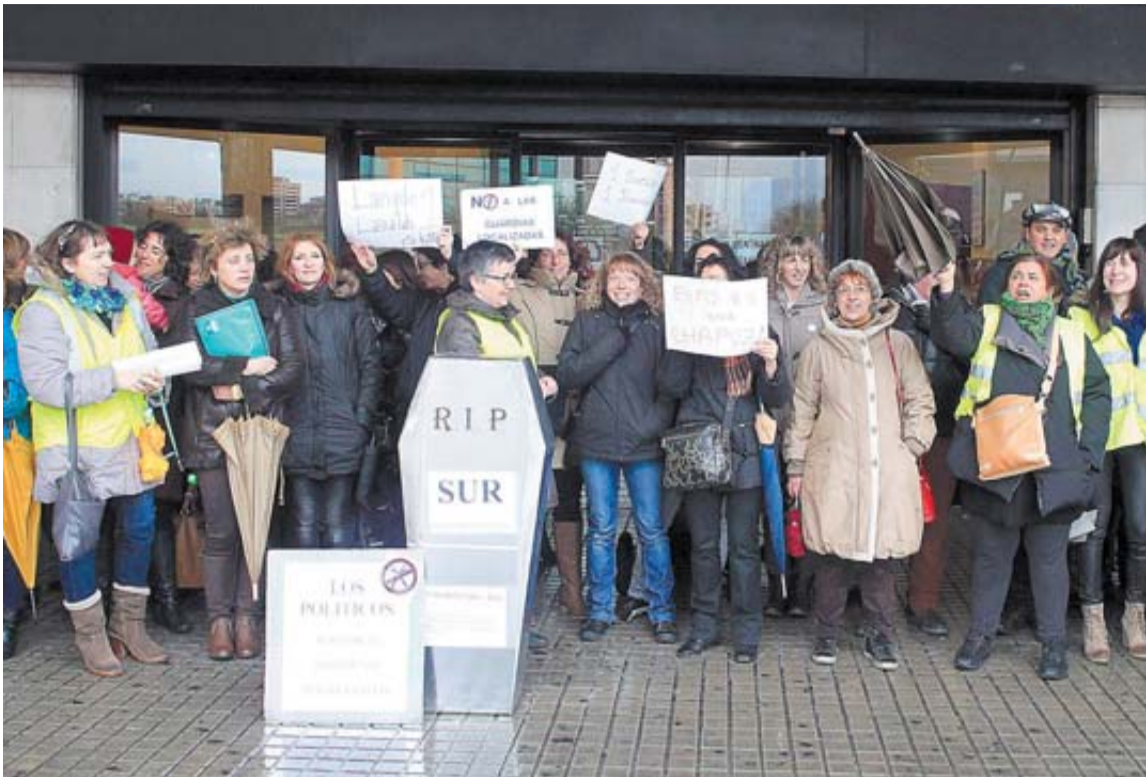
Sanitarios de las urgencias rurales (SUR) concentrados ayer en el ambulatorio de Conde Oliveto.