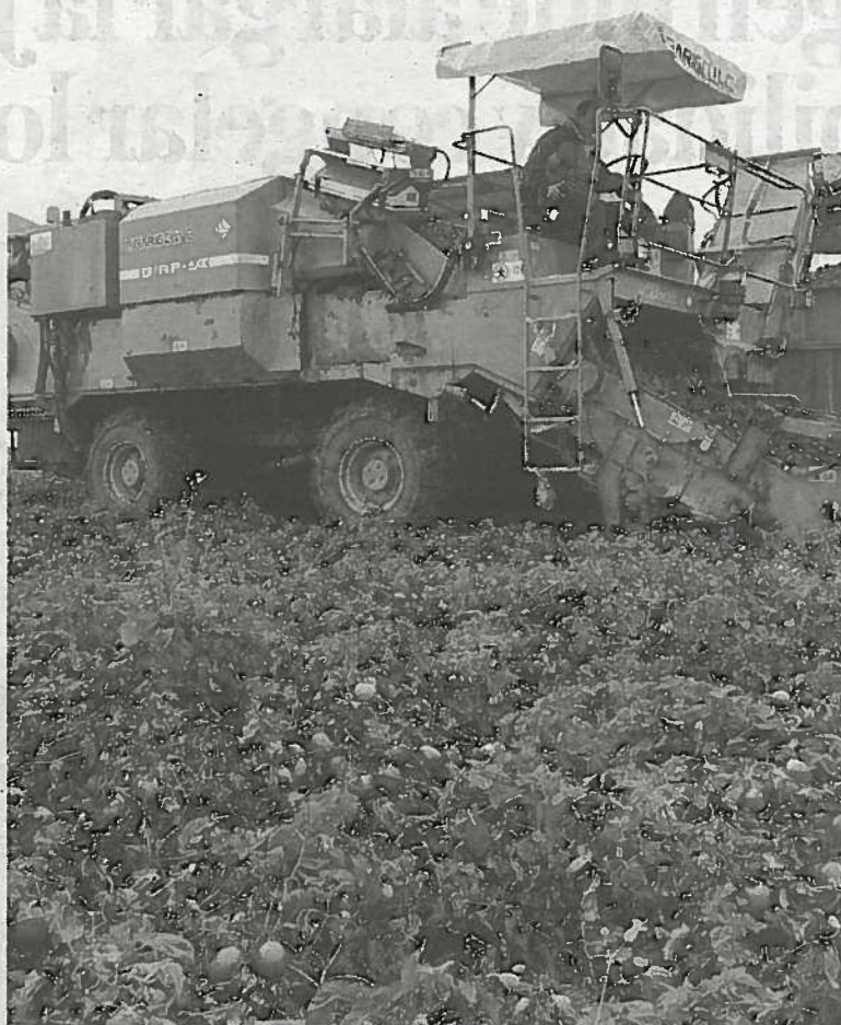
Una plantación de tomates en Milagro.

ENTRE 200 Y 250 EUROS La subvención consistía en un importe de 250 euros por hectárea si utilizaban plásticos de una anchura igual o superior a 1,20 metros y de 200 euros por hectárea, si su anchura era menor a 1,20 metros. En cualquier caso, la cuantía de la subvención no podía superar el 60% del sobrecoste que suponía el uso de este tipo de mate-