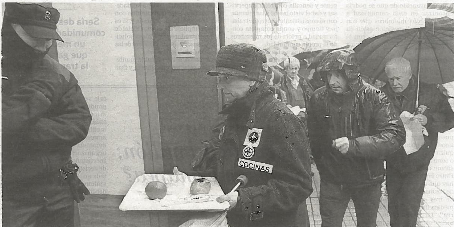
Un policía foral observa el menú entregado en Salud: un pan quemado, puré de espinacas apelmazado, una loncha de jamón york y una naranja.

La incidencias continuaron ayer con equivocaciones en las comidas y falta de dietas en la cena, en concreto en el Hospital de Navarra hubo enfermos que, de no ser por el personal sanitario del centro, se hubieran quedado sin cenar al tratarse de ingresos tardíos o traslados entre plantas.