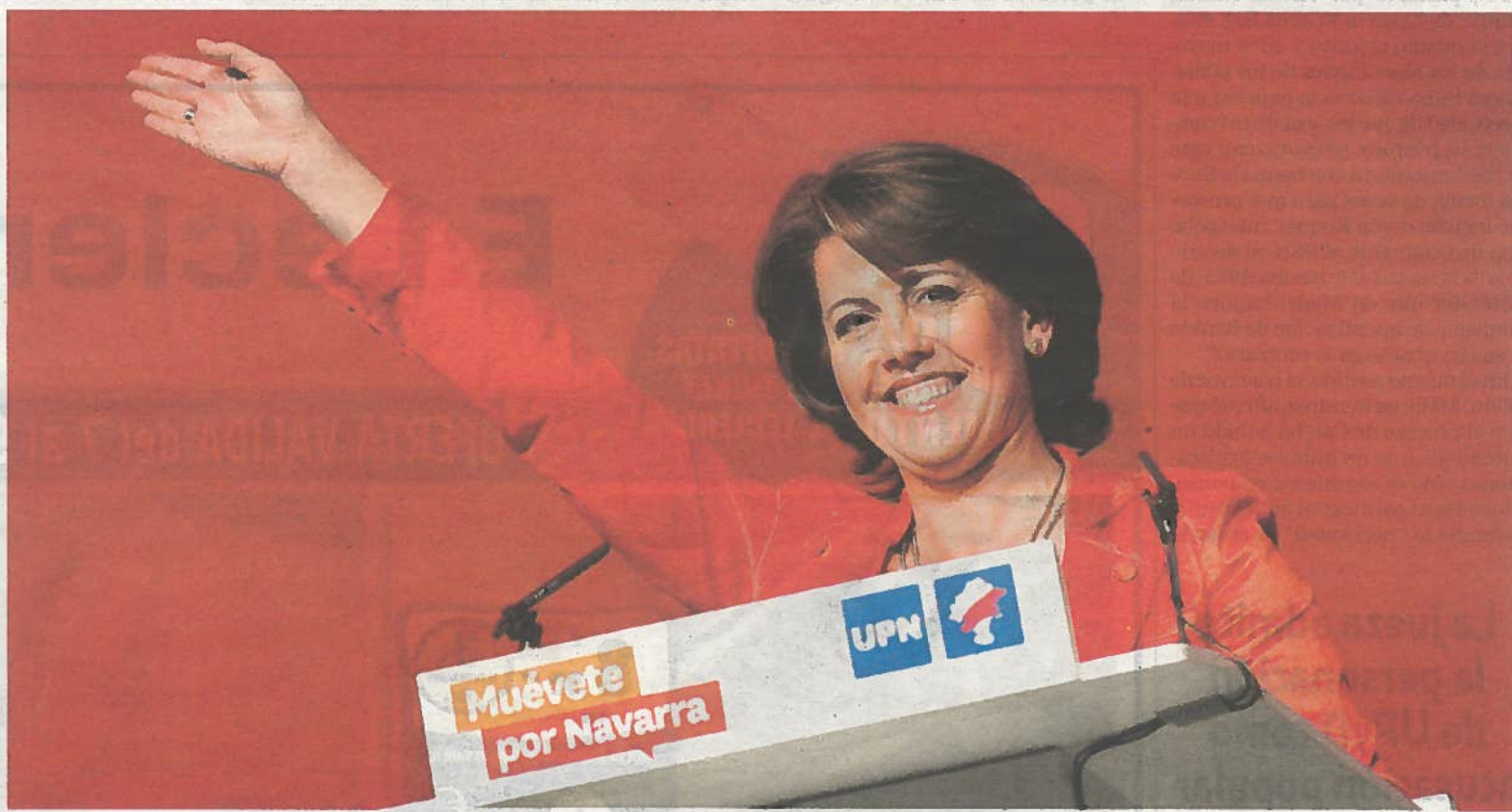
Yolanda Barcina, en el mitin central de UPN de las elecciones autonómicas de mayo de 2011.

En UPN son conscientes de que la falta de sintonía con los socialistas les condena a sufrir en el Gobierno y quien sabe si a perderlo si persiste el desencuentro.