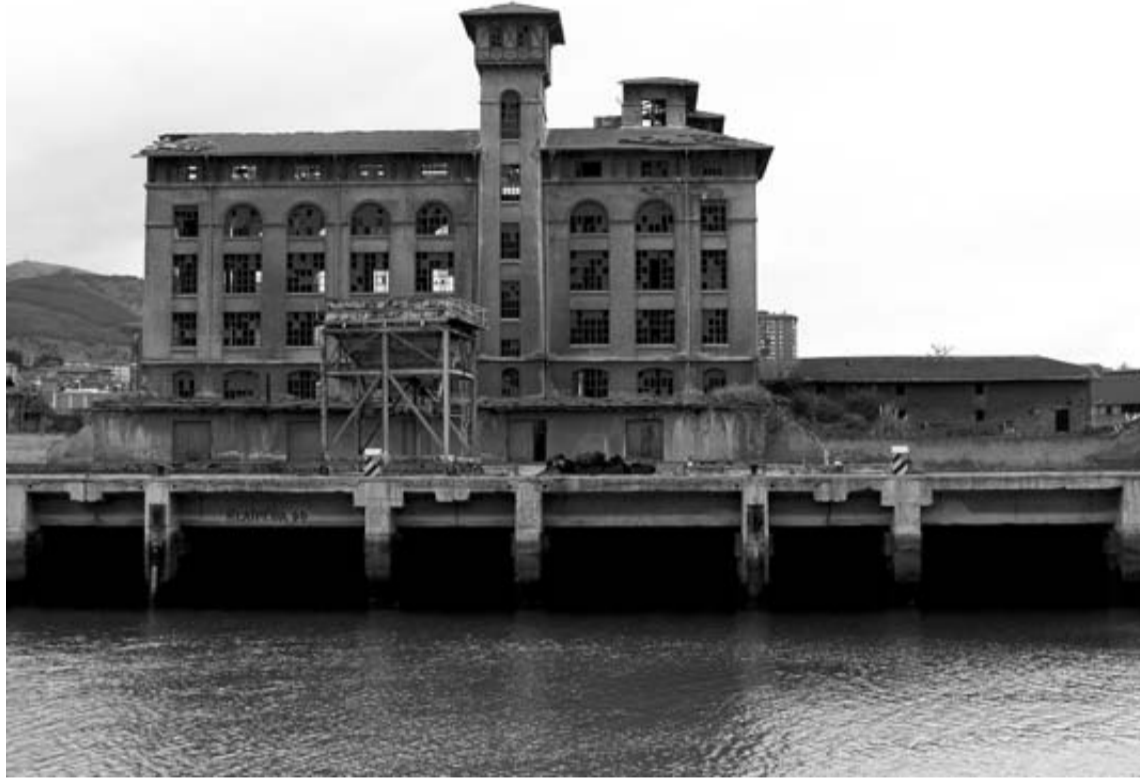
La harinera en Zorroza, en una imagen de El país de los pájaros de hierro .