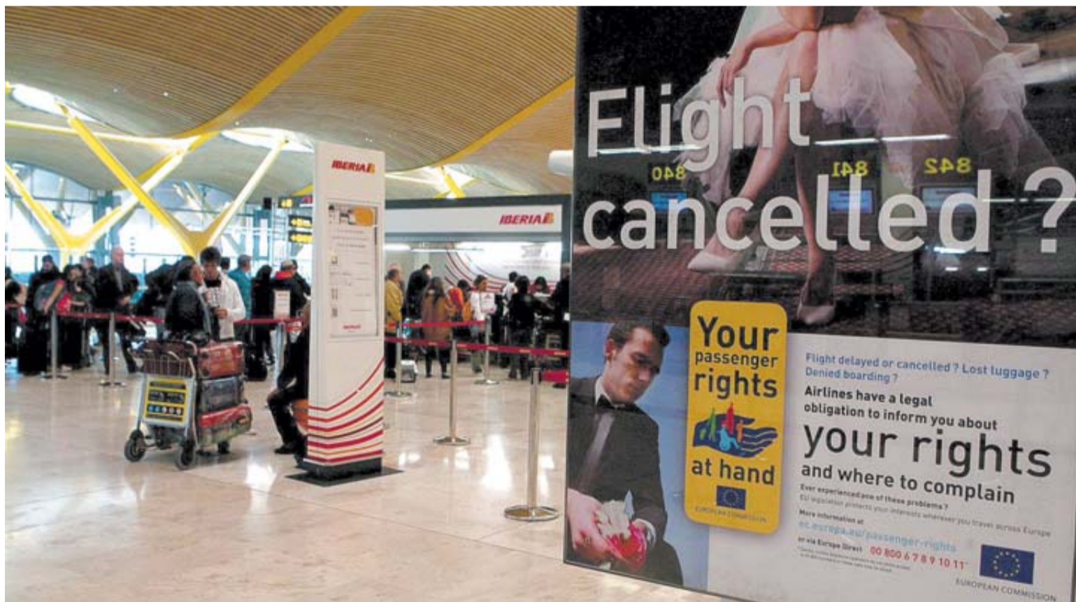
Imagen de la T4 de Barajas en la última huelga de pilotos del SEPLA, el pasado 9 de enero de 2012.

Vistos los antecedentes, el ministerio de Fomento será el que finalmente fije los servicios mínimos, que probablemente incluyan todas las conexiones con Canarias y Baleares, un 50% para los vuelos nacionales de más de cinco horas y los extranjeros de menos de seis horas, y el 25% (o menos) para el resto.