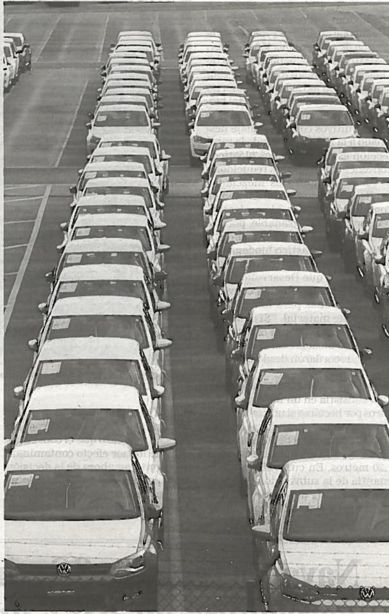
Coches aparcados en la explanada de Volkswagen.

Este reforma del sistema de pago variable iría también acompañada de una nueva vuelta de tuerca a la flexibilidad, que pasaría de los diez