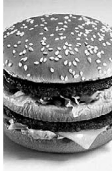
Hamburguesa 'Big Mac'.

El índice Big Mac indica que Italia sería ahora el país más caro de la zona euro. Allí, la hamburguesa costaba en enero 3,85€, frente a los 3,6€ de Francia y los 3,64€ de Alemania. Puesto en porcentajes, el indicador señala que el precio del Big Mac italiano en julio de