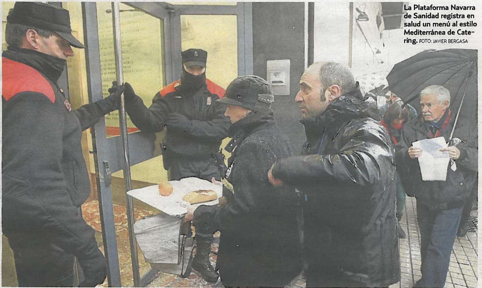
La Plataforma Navarra de Sanidad registra en salud un menú al estilo Mediterránea de Catering.