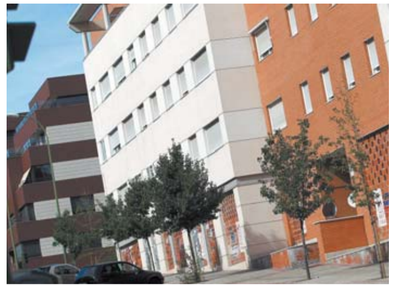
Zona de viviendas en Madrid.

Por ello, ante el incumplimiento de las obligaciones de pago de renta en contratos de arrendamiento y en los casos en los que el inquilino haya sido condenado por sentencia firme en un procedimiento de desahucio, el secretario judicial correspondiente deberá remitir dicha información a dicho registro.