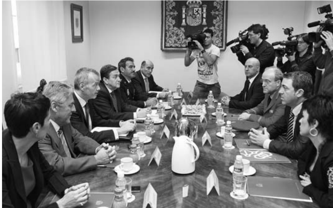
Los asistentes a la reunión ayer a la Junta de Seguridad en Pamplona.

La Policía Foral va a ser a partir de ahora quien decida qué Cuerpo se encargará de atender un suceso,