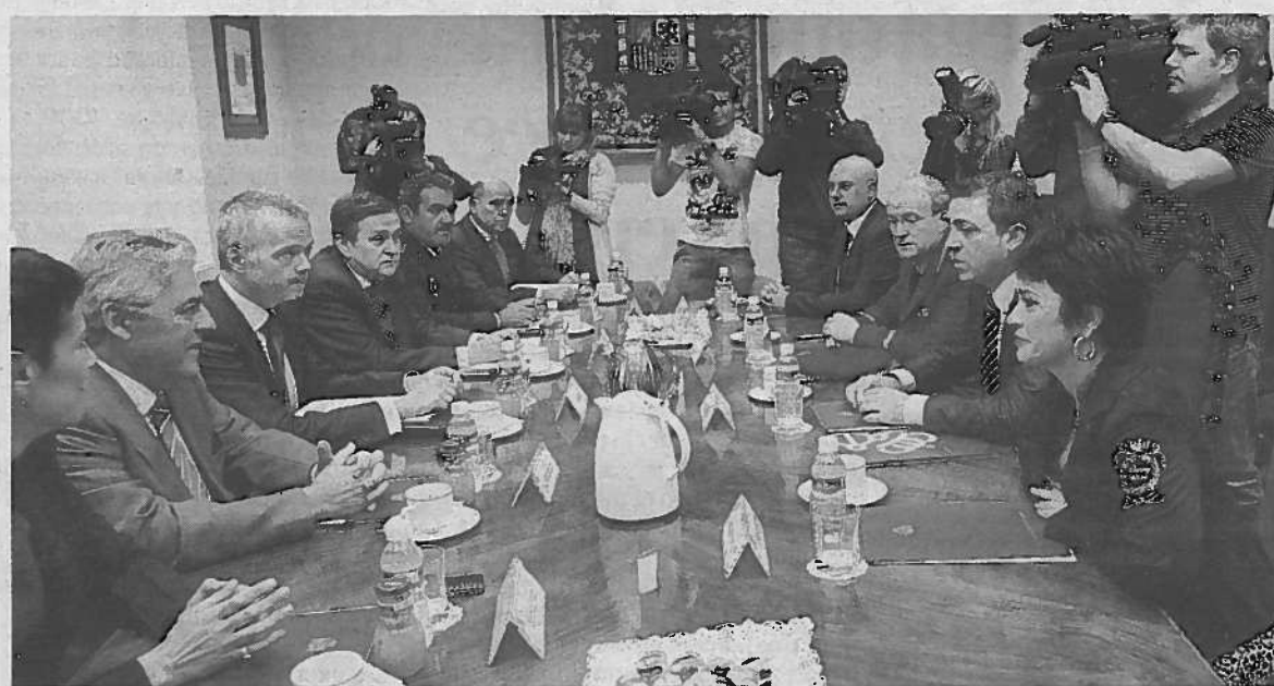
Imagen de la reunión de la Junta de Seguridad celebrada ayer en Pamplona.

Un camión atropelló a tres jabalíes en la madrugada de ayer en el término municipal de Olave, accidente que obligó a mantener cortada un tiempo la N-121-A en sentido Pamplona. El suceso, según la información difundida por el Gobierno de Navarra, tuvo lugar sobre las 5.30 horas de la madrugada y provocó un desplazamiento de la carga que transportaba el camión. Agentes de la Policía Foral se encargaron de dar paso alternativo a los vehículos, hasta que a las 8.30 horas el camión fue retirado por una grúa y pudo ser restablecida la circulación completamente. >D.N.