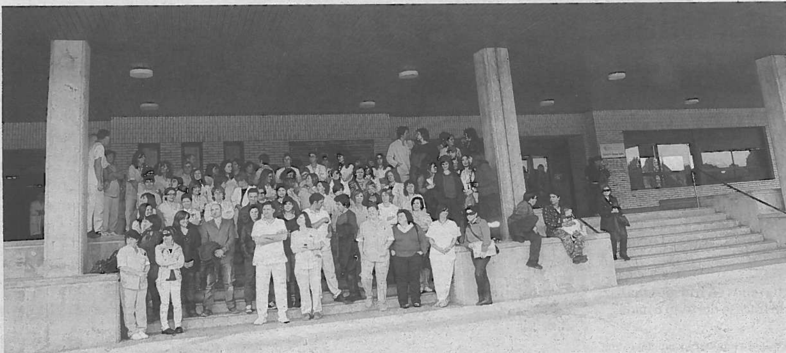
Trabajadores del hospital Reina Sofía, en una concentración contra los recortes de contratos en 2010.