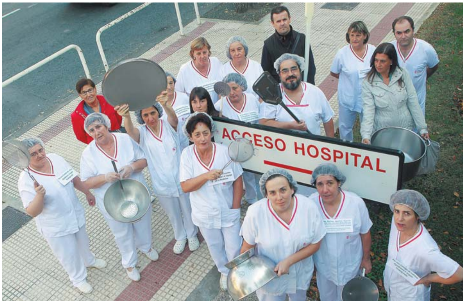
Un grupo de empleadas de la cocina del Hospital Virgen del Camino, en la rampa de Urgencias del edificio.