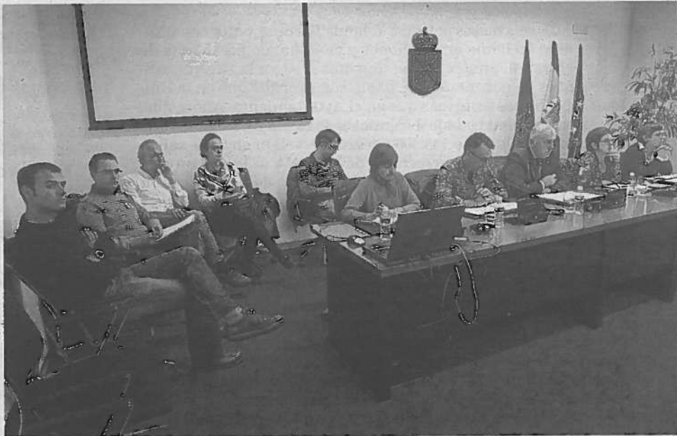
Representantes de todos los sindicatos salvo APS, que declinó la invitación.