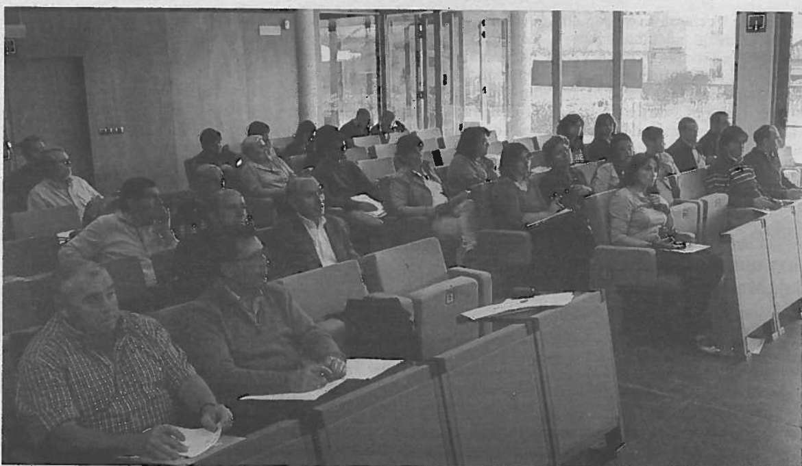
A la inauguración de 'Eureners 3' acudieron muchos representantes municipales de la Merindad.