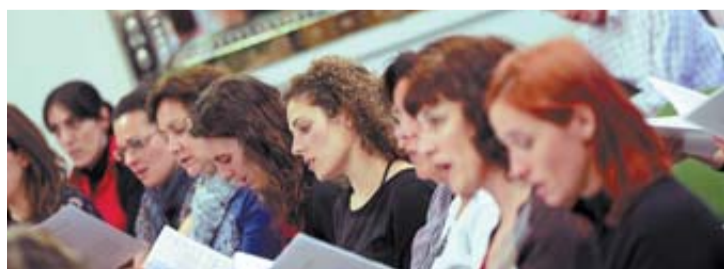
Un momento del ensayo de ayer, el último en Pamplona.