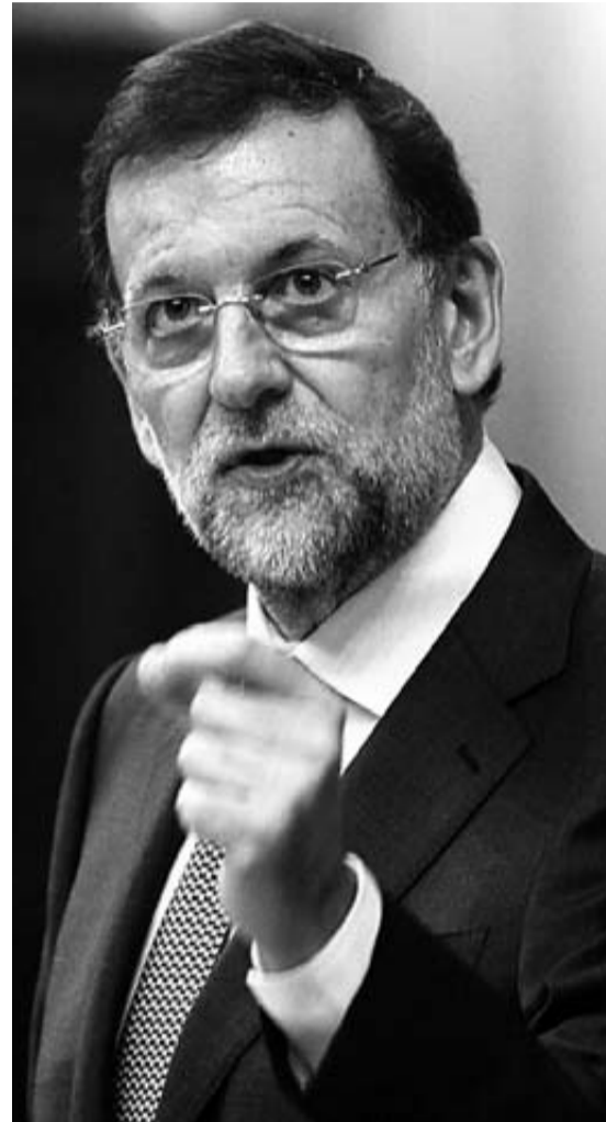
Rajoy preparó por teléfono la cita del viernes.

una llamada al consenso. PP y PSOE admiten que hay poco margen. El primero porque sostiene que el Gobierno hace lo que debe y no puede permitirse bajar el listón. El segundo porque se niega a acompañar una política impopular que podría distanciarlo aún más de su electorado. Pero al menos, habrá un contacto en un momento crítico para España.