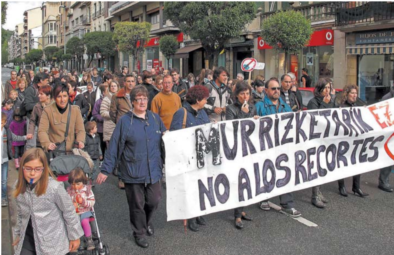
Manifestación de Remontival, IES Tierra Estella y Politécnico por las calles de Estella.