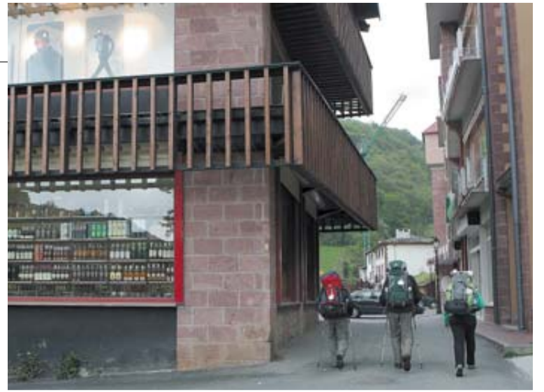
Varios peregrinos atraviesan la zona comercial de Valcarlos.

desaparecido en la zona de Roncesvalles también fue encontrado ayer, por lo que a media tarde del martes la Agencia Navarra de Emergencias desactivó el dispositivo de búsqueda. En este caso, también apareció por su propio pie y sin que hubiera sufrido ningún percance.