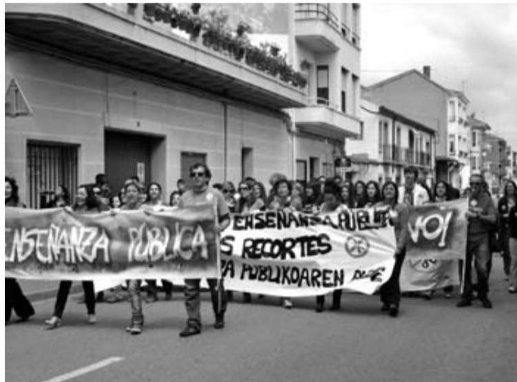
En San Adrián, los docentes llevaron la manifestación al centro. GENER

comunicado ante los vecinos que se encontraban en la zona. Luego, regresaron al instituto.