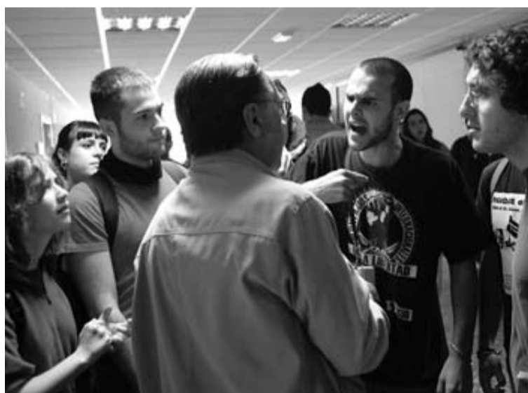
Piquetes en el interior de la Universidad Complutense de Madrid.

Al margen de números, las principales ciudades españolas de 14 comunidades autónomas albergaron concentraciones en contra del recorte del gasto público en