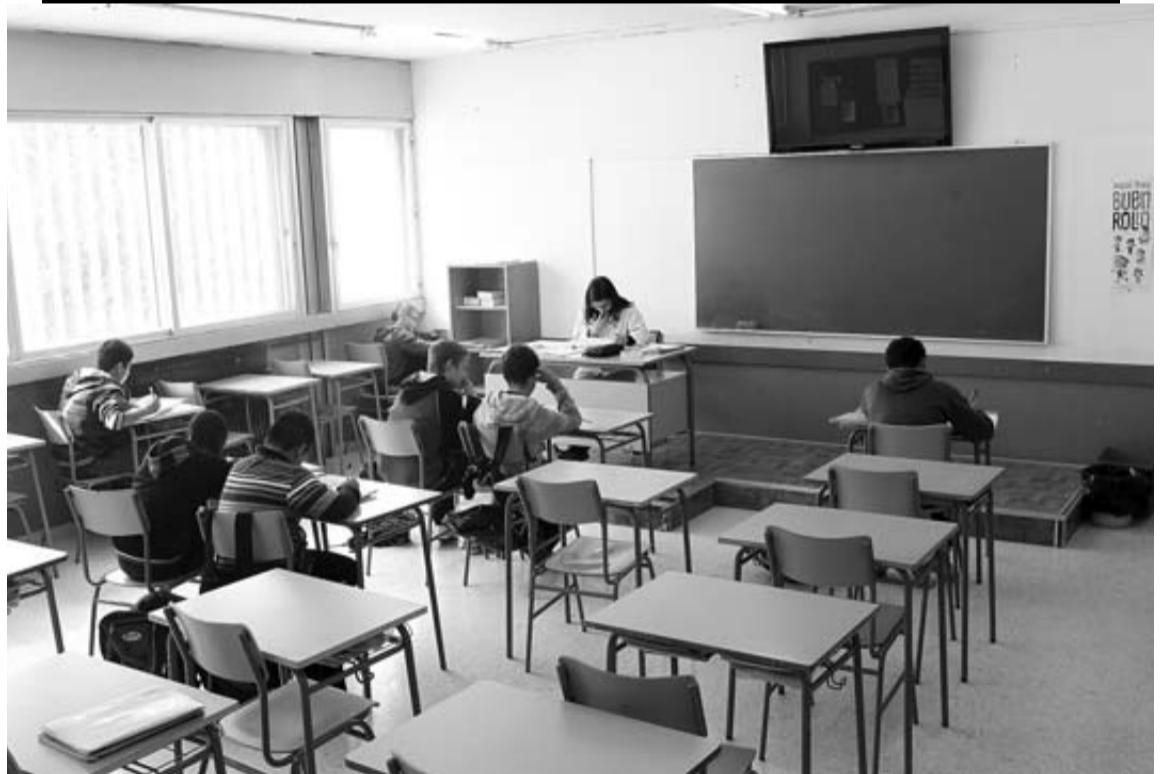
POCOS ALUMNOS EN LA ESO. En el IES Julio Caro Baroja (antiguo instituto La Granja) fueron 50 de 489 alumnos (cerca del 10%). En la foto, una profesora con siete alumnos.