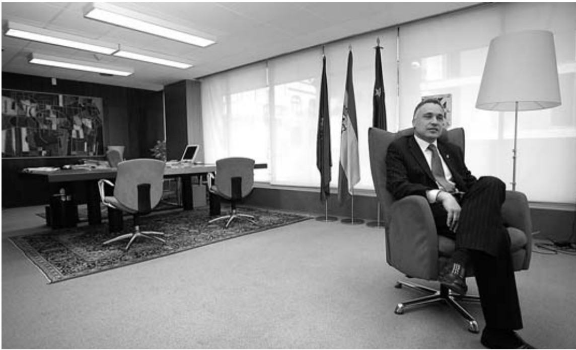
El Defensor del Pueblo de Navarra, Javier Enériz, en su despacho.