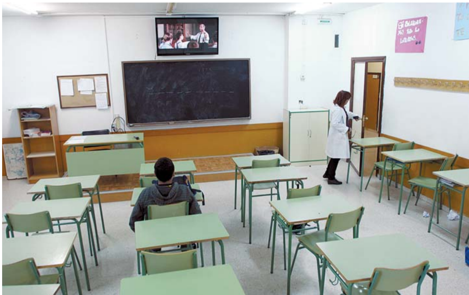
Un alumno de 3º de ESO ve una película en un aula vacía del instituto Caro Baroja (antes La Granja) de Pamplona.