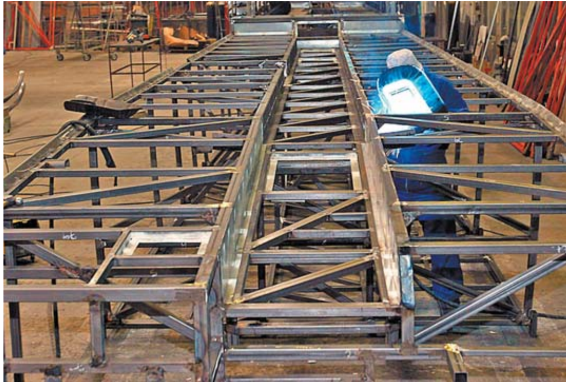
Proceso de ensamblaje de la carrocería de un autobús en las instalaciones de Sunsundegui.

El repaso al 2011 por parte de la consejera fue pareja a la descripción de la cartera de pedidos de 2012, dentro de un marco de recuperación de clientes -como Alsa o Volvo-, que puede servir de punto de inflexión en la lenta evolución de la empresa carrozera. Las gestiones emprendidas han fructificado en la venta asegurada de 90 unidades entre las solicitadas por Interbus, Samar -cliente perdido entre 2009 y 2010- y Alsa, que ha encargado a Sunsundegui el diseño de su línea exclusiva Premiun.