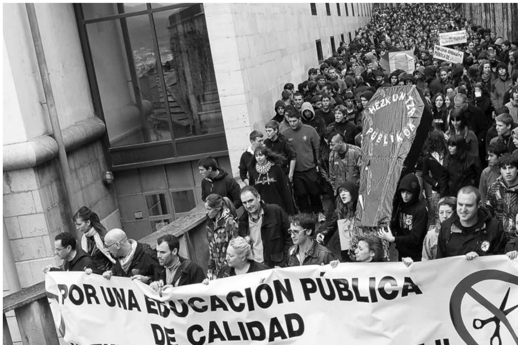
Miles de profesores, alumnos y familias se manifiestan en Pamplona contra los recortes cerca de la sede de Educación del Gobierno de Navarra.

Una vez en el Parlamento, se unieron al resto de centros poco antes del mediodía. Entre ellos, se encontraban el colegio José María Iribarren, Plaza de la Cruz, Iturrama, Escuela de Arte, Padre Moret - Irubide, Bernart Etxepare, Víctor Pradera, San Francisco, Amaiur, San Jorge, Navarro Villoslada, en Pamplona; así como Camino de Santiago, Erreniega, Catalina de Foix (Zizur), Elorri, IESO Mendillorri, El Lago, Mendigoiti (Mendillorri), Marcilla, Askatasuna, Ermitaberri (Burlada), Beriáin, Sarriuren, Olite, José María (Huarte), Politécnico de Estella,