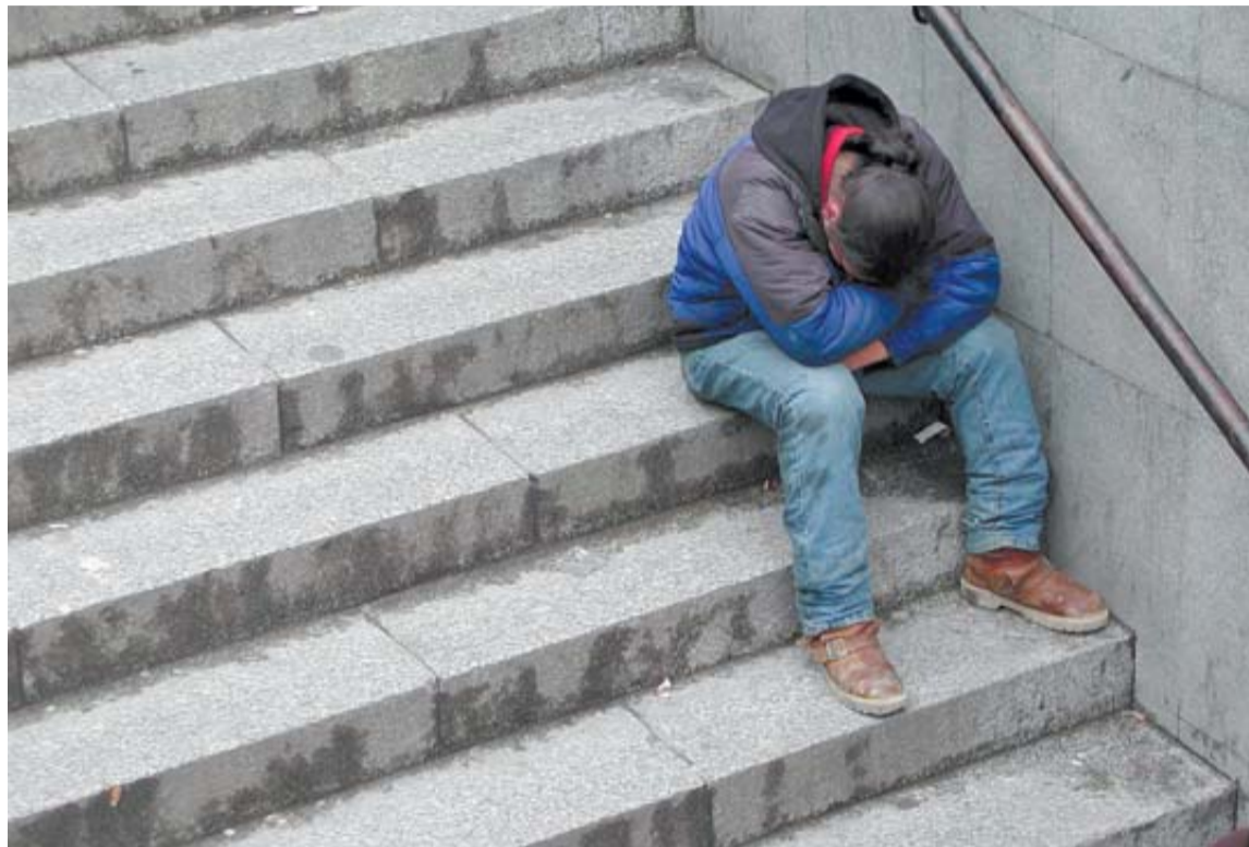
La crisis ha generado una importante "bolsa" de personas desempleadas.