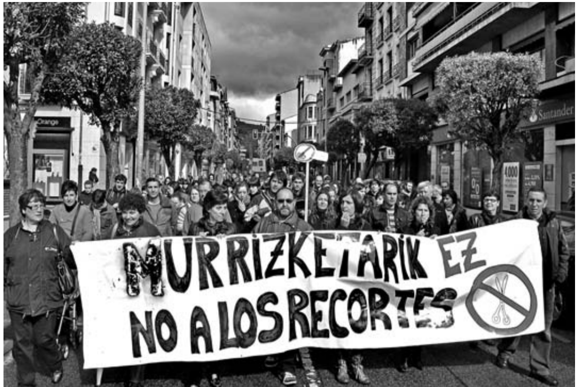
La manifestación del colegio Remontival, IES Tierra Estella e instituto politécnico en la ciudad del Ega. MTX

A las 12 de la mañana, los profesores junto con medio centenar de alumnos se congregaron a las puertas del instituto con pancartas a favor de la enseñanza pública y en contra de los recortes. Después, se manifestaron hasta el centro, llegando a la plaza del Rebote y cantando consignas denunciando la reforma educativa. En la plaza de Muerza guardaron un minuto de silencio y leyeron un