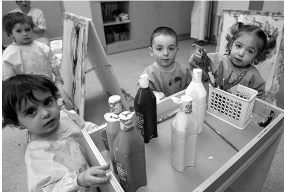
Grupo de niños en la escuela infantil Rochapea.

Hasta la fecha, la cuota de los centros públicos de 0-3 años era financiada en un 33% por el Gobierno de Navarra, otro 33% era asumido por el Ayuntamiento titular de la escuela infantil y el 33% restante era abonado por los padres. La cuota que debe abonar el municipio puede variar en función del dinero que reciba por convenio del Gobierno de Navarra y según la aportación de las familias, que depende a su vez del nivel de renta. Según los cálculos realizados por algunos ayuntamientos de la comarca la cuota municipal va desde los 800 hasta los 1.300 euros por niño al año.