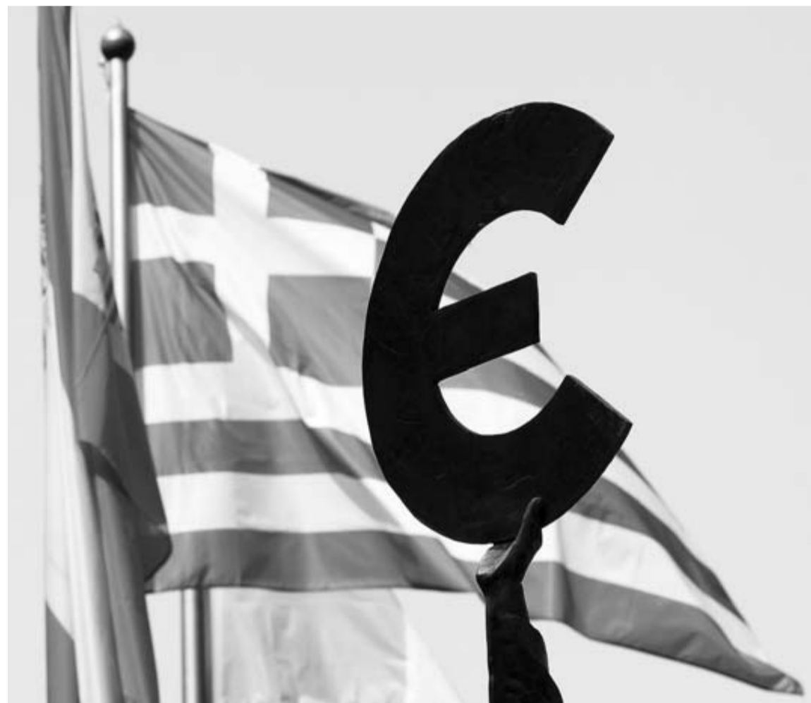
Banderas de España y Grecia junto al logotipo del euro ante el Parlamento Europeo en Bruselas.

En cualquier caso, parece claro que el crecimiento formará tándem con la austeridad como gran receta europea para salir de la crisis.