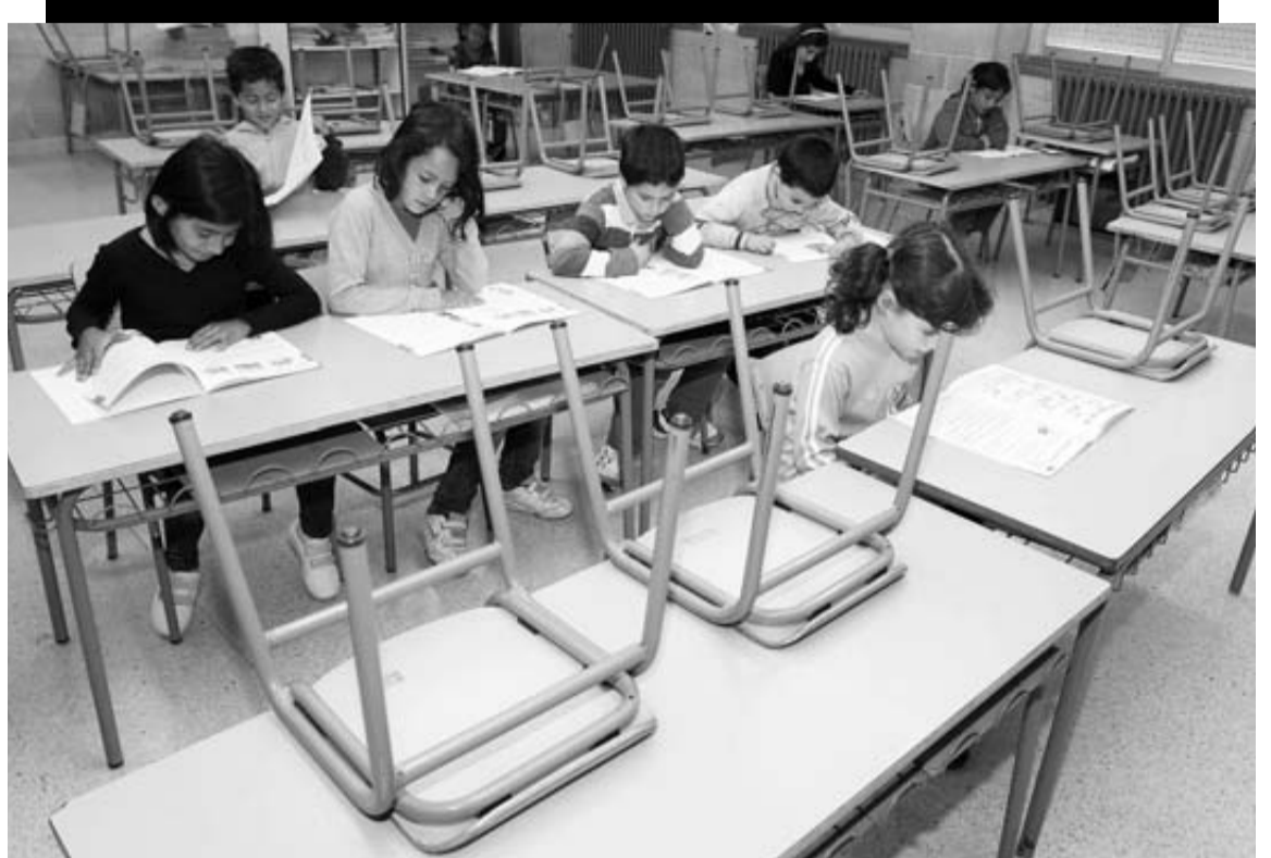
LA MITAD DE LOS NIÑOS EN PRIMARIA. En el CP Hilarión Eslava (Burlada) faltaron 201 de 410 alumnos (el 49%). En la imagen, la mitad de los escolares de una clase de 2º de Primaria (7 años).