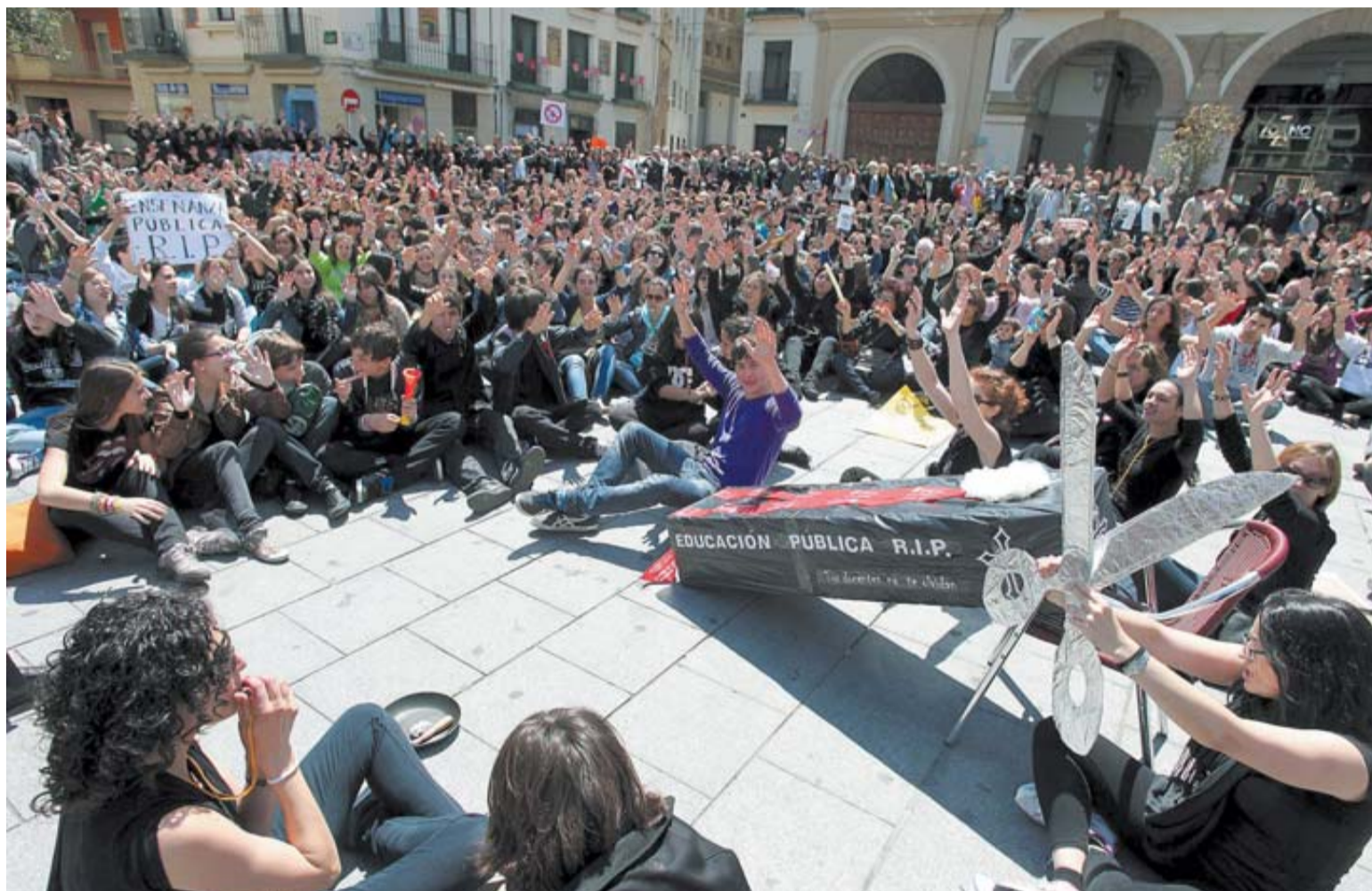
Aspecto que presentaba ayer la plaza de los Fueros de Tudela al término de la manifestación.