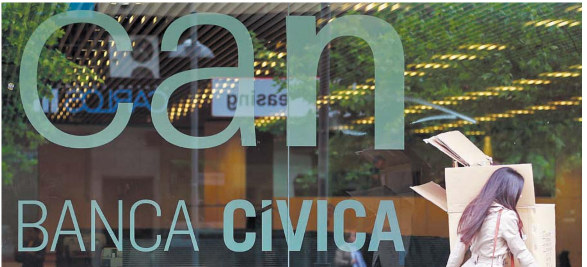
El acuerdo alcanzado incluye bajas voluntarias en Banca Cívica.

Suspensiones temporales. Entre uno y dos años. Con un sueldo bruto del 25% mientras dura la suspensión. El acuerdo contempla que el trabajador volverá al centro de trabajo que tenía como referencia o al más próximo.