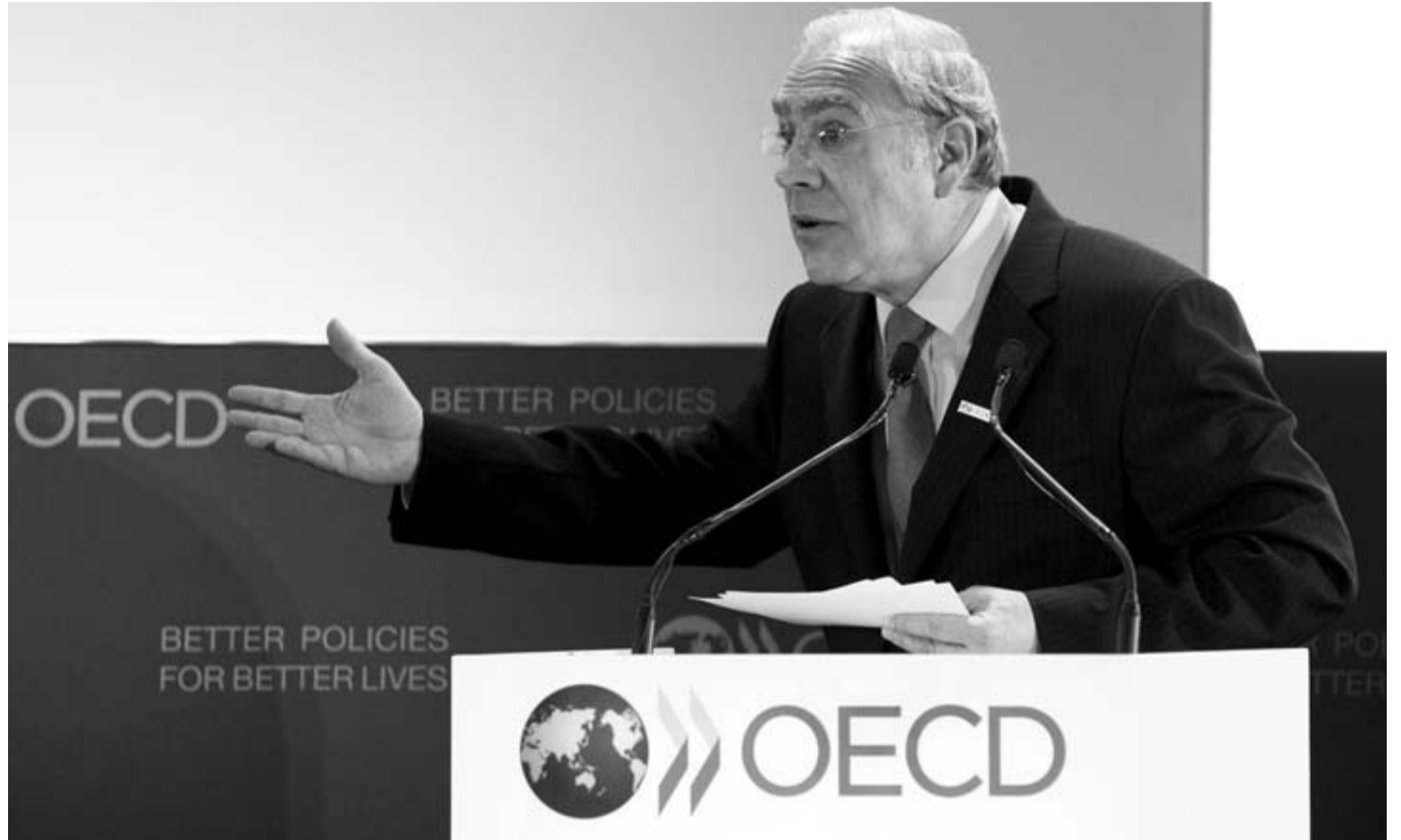
El secretario general de la OCDE, el mexicano José Ángel Gurría, en la presentación del Informe de Perspectivas.