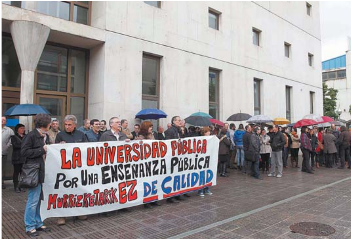
Profesores, estudiantes y personal no docente se manifestaron ayer en la UPNA.