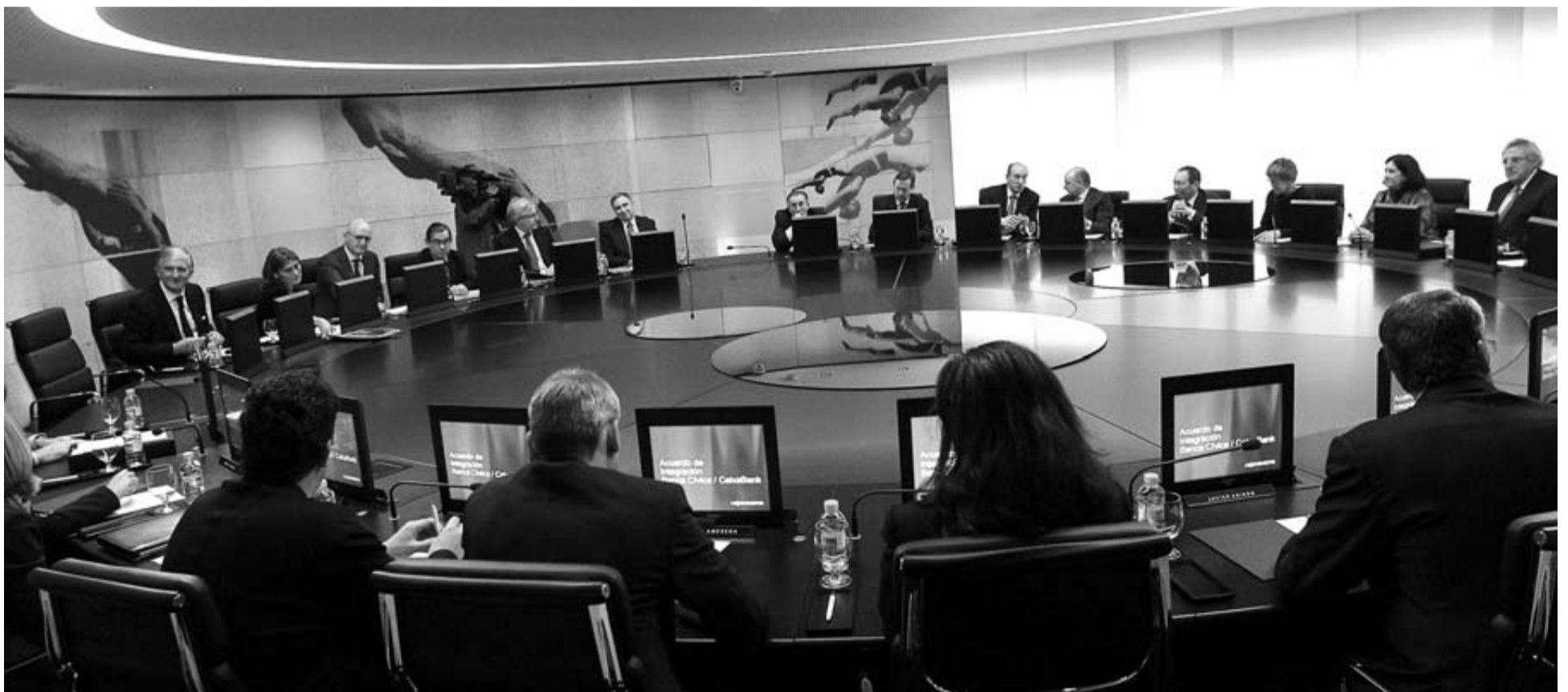
Imagen de la reunión del consejo general de CAN celebrado ayer en la sede de la entidad.