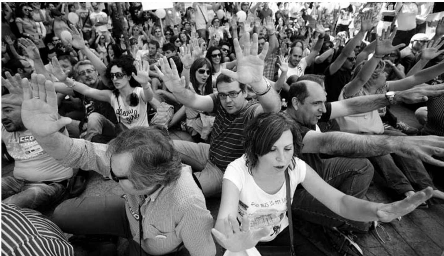
Profesores, estudiantes y representantes sindicales protestan en las calles de Murcia.