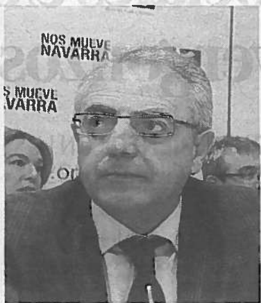
Miguel Sanz (UPN) Presidente entre 1996 y 2011

● Detalles. Dimitió al ser acusado de corrupción por tener una cuenta en Suiza relacionada con la trama navarra del caso Roldán. Fue finalmente absuelto por la prescripción del delito.