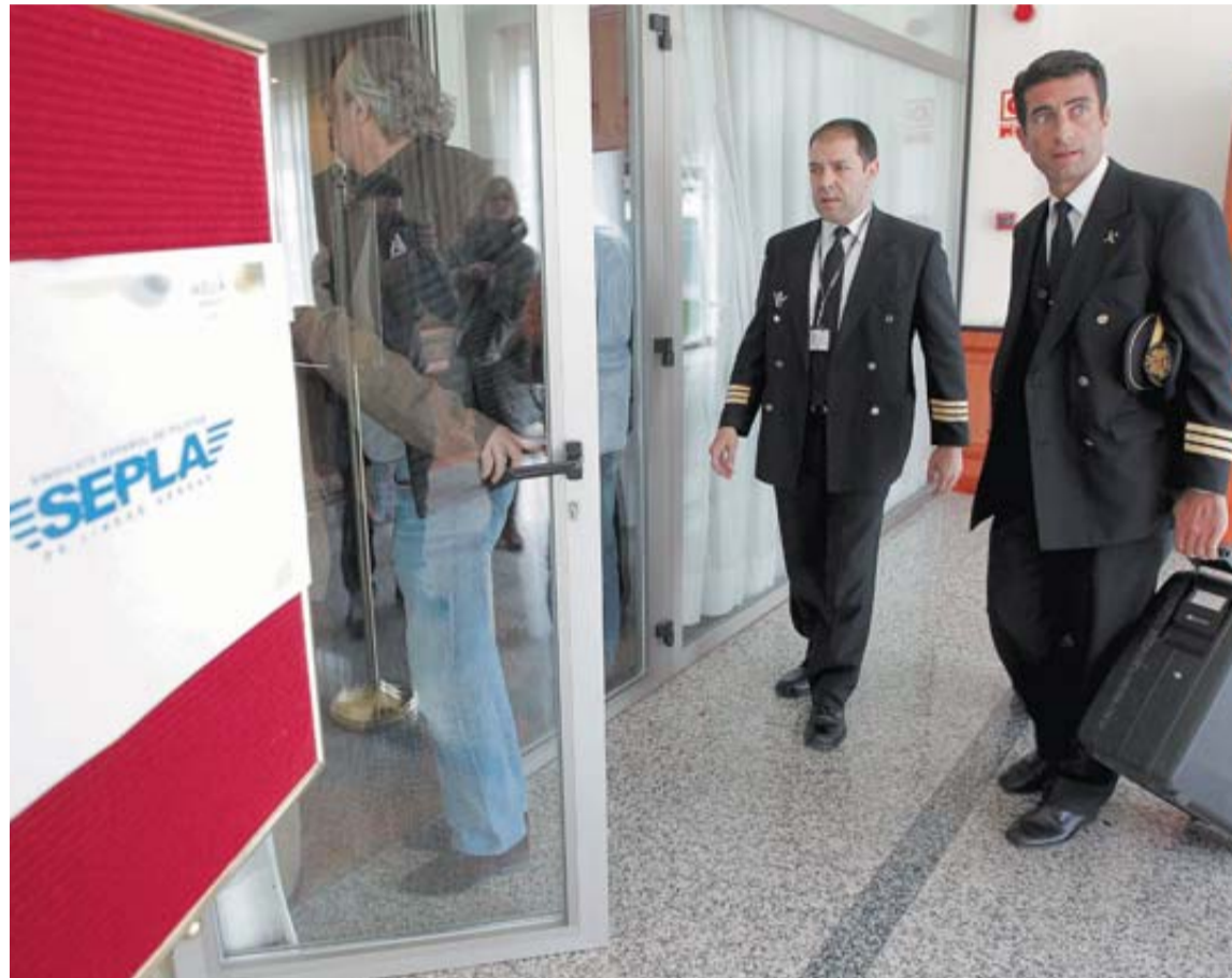
Dos pilotos, a su llegada a la asamblea del Sepla celebrada ayer en Madrid.

Los 1.500 pilotos que tiene la compañía (el 7% de la plantilla) se desmarcaron del pacto propuesto por el mediador, Gregorio Tudela, que incluía el despido de 258 de ellos dentro del plan global de ahorro de costes, por entender que no ofrecía "garantías suficientes" sobre el futuro de Iberia. Tampoco estaban de acuerdo con que recogiera condiciones distintas para ellos que para otros colectivos, por ejem-