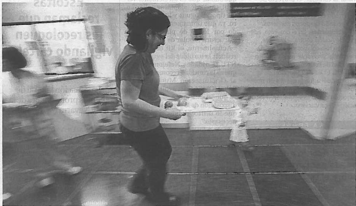
Reparto de dietas en el Complejo Hospitalario de Navarra (CHN).