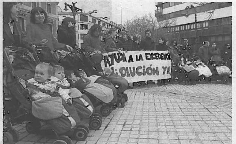
Familias afectadas protestan frente al Parlamento.

Este recorte dejó fuera a la mitad de los 850 solicitantes. "No pedimos que se mantengan las ayudas sino que se dé una solución y alguien del Gobierno asuma esta responsabilidad. Se trata de voluntad política", aseguraron estas familias, que recordaron que cuando pidieron estas ayudas lo hicieron "confiados" en que se mantendrían los 396 euros al mes durante la excedencia. "Una decisión que suponía perder dinero, pero ganar en cuidado y atención a