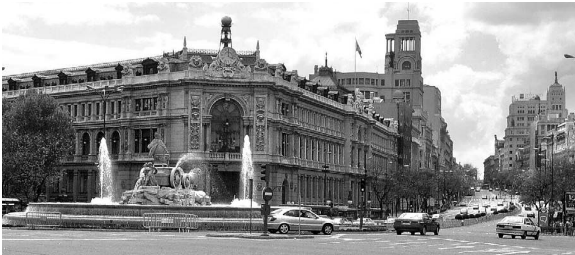
Sede central del Banco de España en la madrileña plaza de Cibeles.