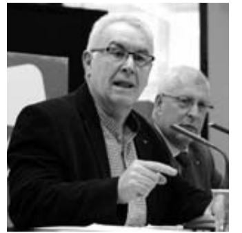
Cayo Lara, ayer en Madrid.

El juez Castro, por decisión propia, cita a declarar a la infanta Cristina el 27 de abril en calidad de imputada por el delito de tráfico de influencias.