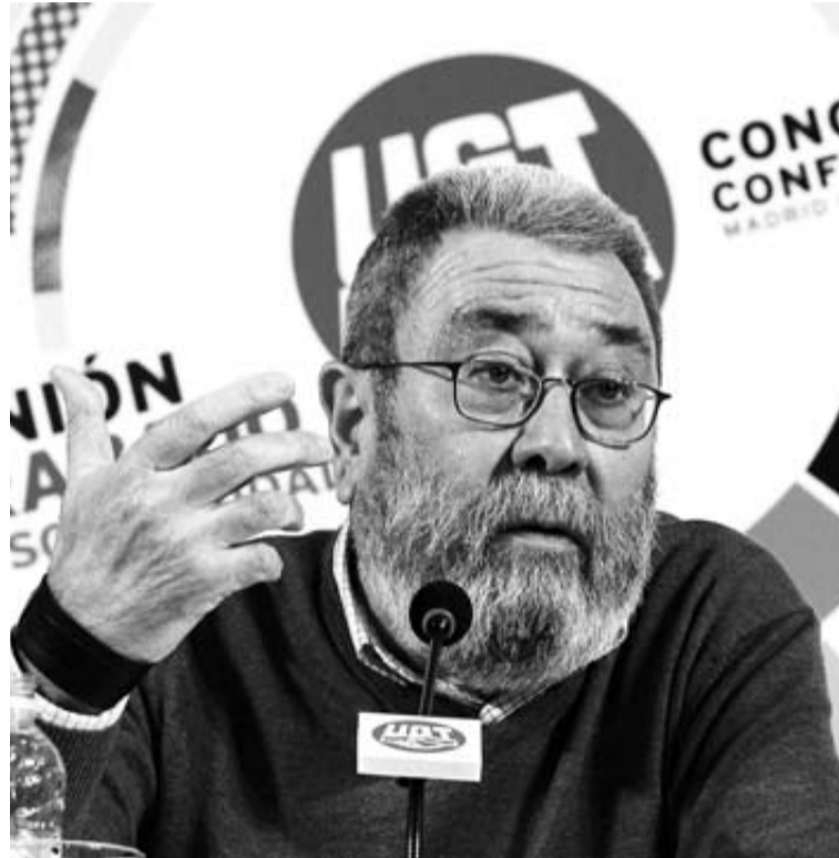
Cándido Méndez, ayer durante la rueda de prensa en Madrid.

El líder sindical sostiene que la "reflexión colectiva" en el seno de la organización ha pesado "sobremedida" en su decisión de presentarse una vez más a la reelección del cargo de secretario general, además de aportarle "un elemento de confianza". Sin embargo, Méndez quiso subrayar la particularidad "democrática" que supone el hecho de que las candidaturas se presenten una vez debatida y ana-