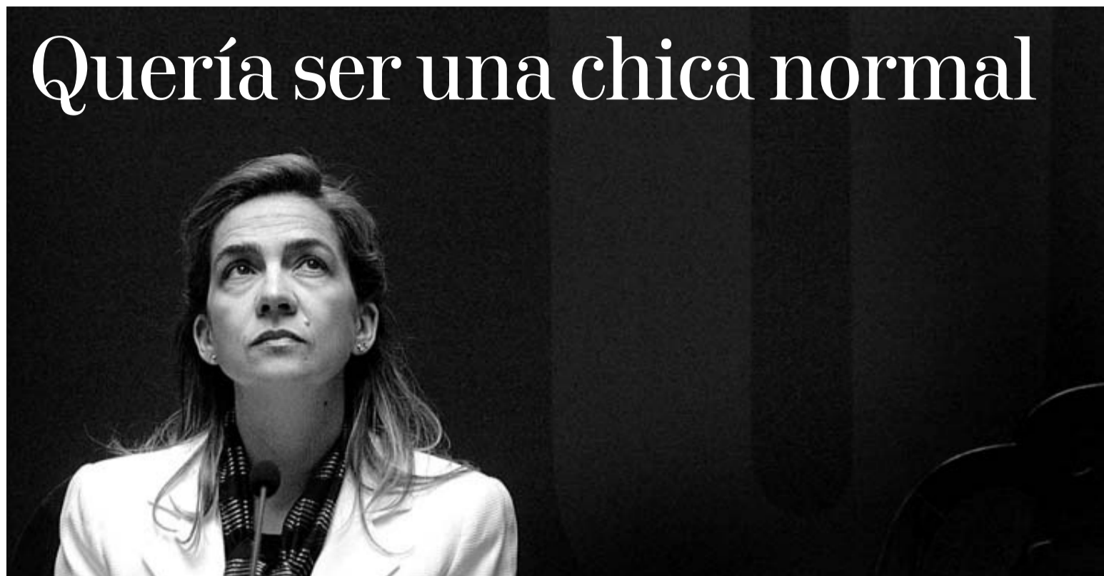
Cristina de Borbón y Grecia, infanta de España.

No abre la boca en público, pero los que la conocen admiten que el proceso ha terminado por derribar el castillo que se había montado la infanta al margen de una familia en la que vino al mundo el 13 de junio de 1965. Esa llegada le puso delante de las cámaras desde que era una niña traviesa, alegre y divertida, pero ya siendo adolescente, demostró que sabía cumplir, pero que no era lo suyo. Se hizo más independiente, más hermética. Después de completar sus estudios de Secundaria en Madrid, la Casa del Rey decidió que cursara Ciencias Políticas. Ese trago no fue fácil para ella, pero terminó con éxito. Un año después, se formó en un