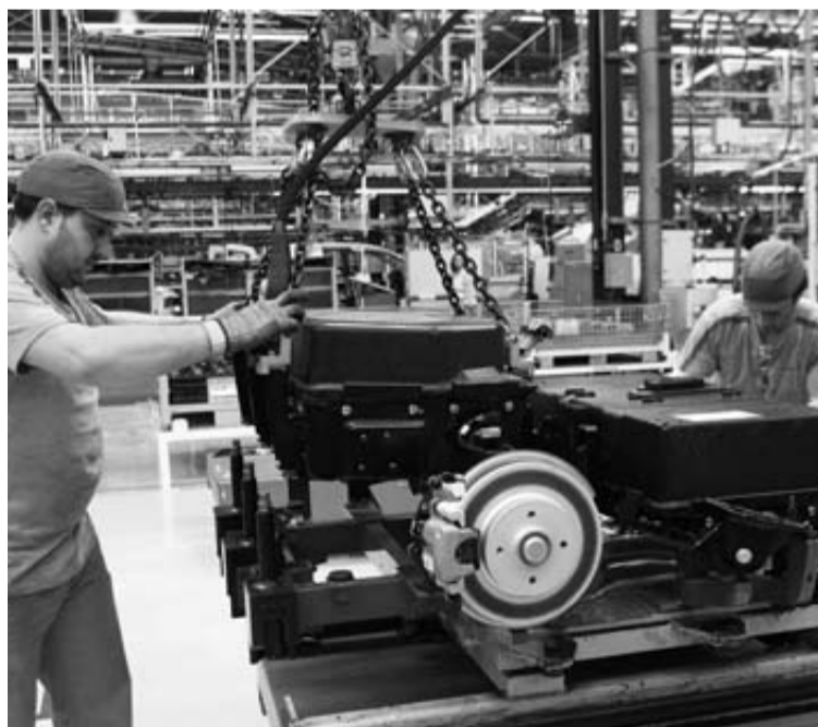
Dos operarios colocan las baterías de una Citroën Berlingo.

El presidente de la Xunta de Galicia, Alberto Núñez Feijóo,