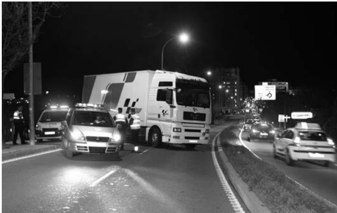
El camión que atropelló a la vecina de Villava, cruzado en la Cuesta de Beloso, a la altura del hotel.

El accidente ocurrió poco antes de las nueve de la noche. La mujer, que residía sola en Villava, caminaba en dirección a Burlada por la acera. A la altura del Hotel Muga de Beloso Alma Pamplona hay que atravesar la carretera por un paso de peatones. Y ella así lo hacía cuando le atropelló el camión, que precisamente salía del hotel. Antes de incorporarse a la carretera, los vehículos deben hacer un stop en una cuesta arriba y vigilar si llega circulación desde la izquierda. La peatona lo hizo por la derecha, lo que hace