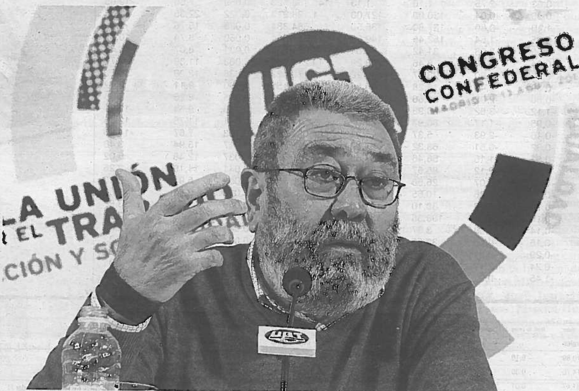
El secretario general de UGT, Cándido Méndez, durante la presentación del congreso.

La situación de los hogares avanza 2,7 puntos, mientras que la valoración del empleo sólo lo hace en un punto. Si se compara con marzo de 2012, la valoración de la economía del país es hoy 5 puntos inferior, las opciones que ofrece el mercado del trabajo están 6 puntos por debajo y la situación de los hogares se ha deteriorado 5 puntos. >EFE