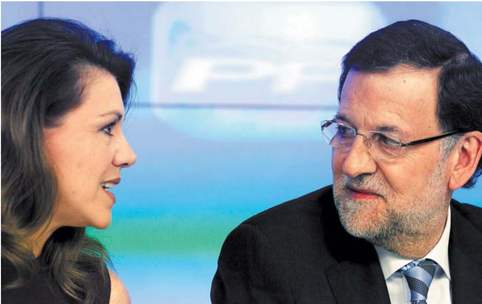
María Dolores de Cospedal y Mariano Rajoy se miran durante la junta directiva nacional del PP celebrada ayer en Madrid.