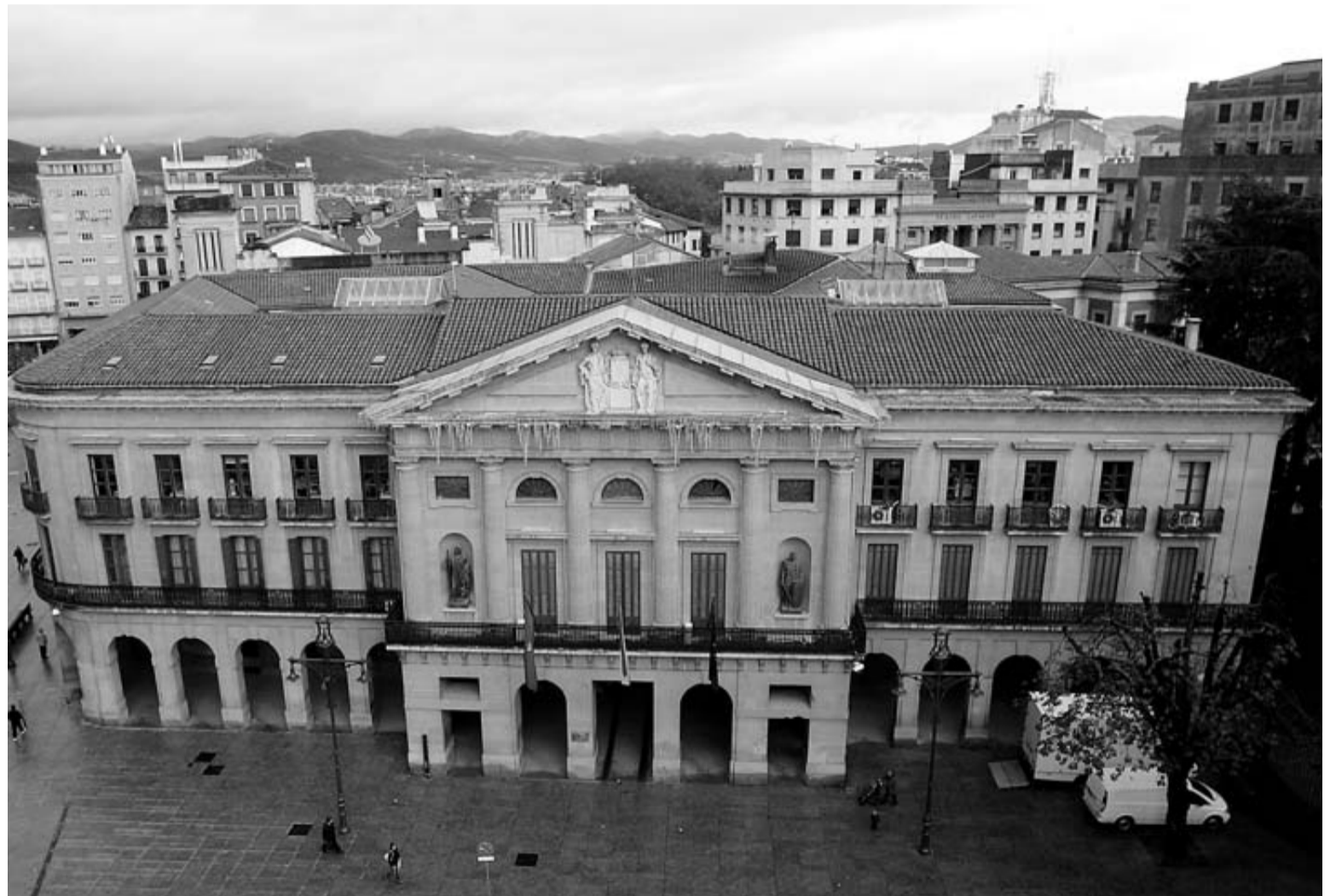
Vista del Palacio de Navarra, sede del Gobierno foral, en un día lluvioso.