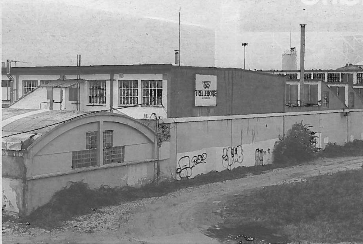
Instalación de la empresa, ubicada en el barrio pamplonés de Buztintxuri.

Inepsa anuncia este ERE después de que el 31 de marzo concluyera el expediente de suspensión temporal aplicado en los primeros meses de 2013. Este ERE fue rubricado entre la empresa y la parte social en