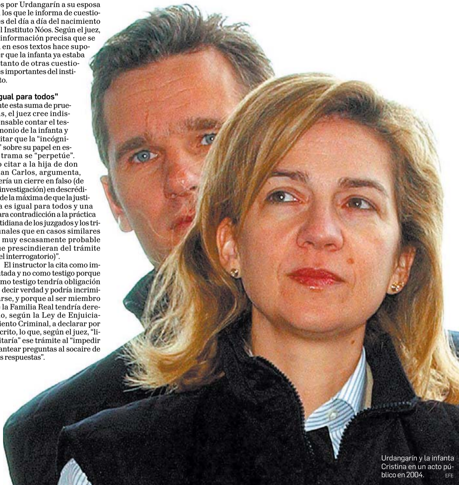
Urdangarín y la infanta Cristina en un acto público en 2004.

El instructor la cita como imputada y no como testigo porque como testigo tendría obligación de decir verdad y podría inculparse, y porque al ser miembro de la Familia Real tendría derecho, según la Ley de Enjuiciamiento Criminal, a declarar por escrito, lo que, según el juez, "limitaría" ese trámite al "impedir plantear preguntas al socaire de sus respuestas".