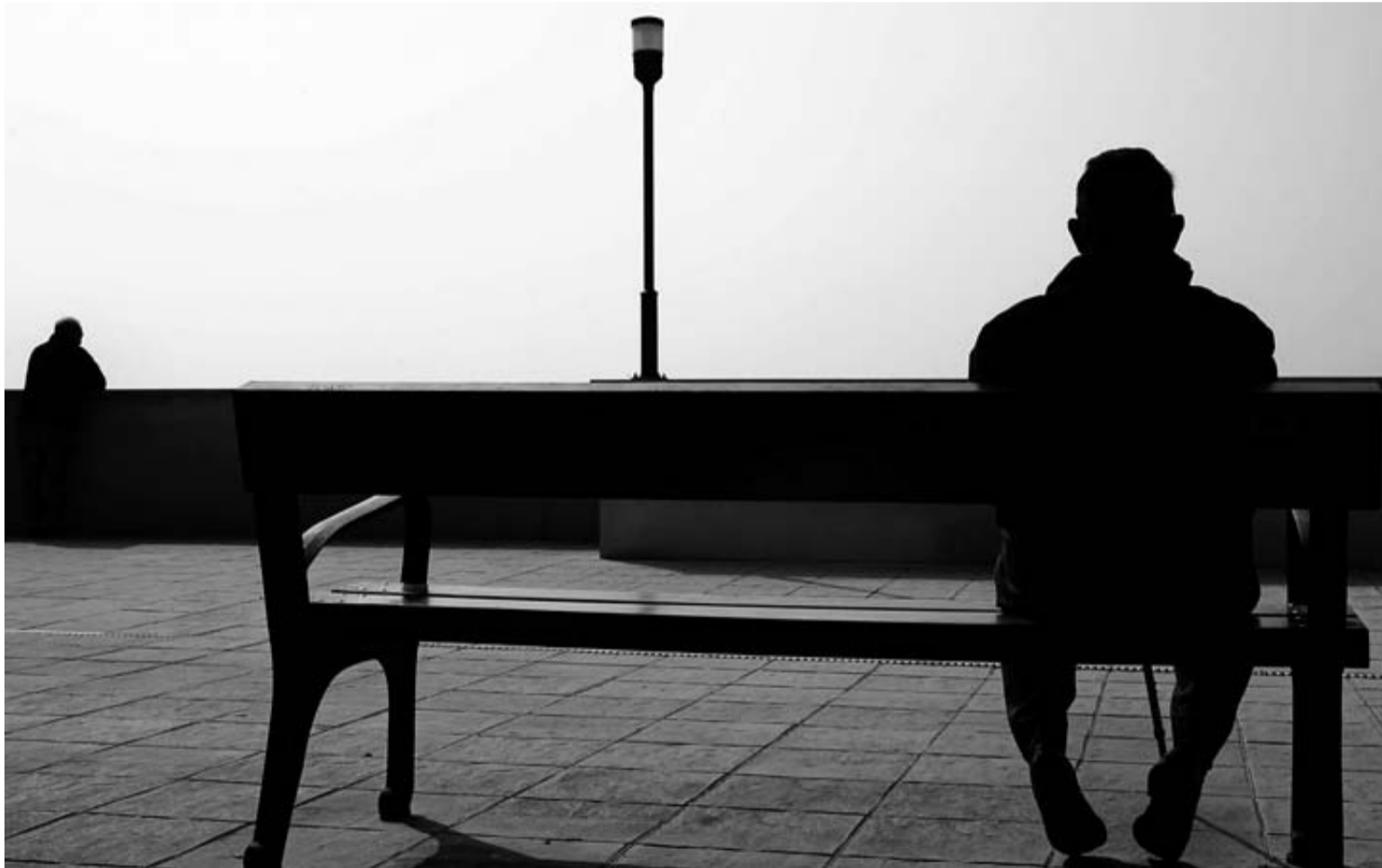
Las expectativas de jubilación han cambiado tras dos reformas consecutivas en tres años que se implantarán escalonadamente.

"Dar por bueno, con los niveles de paro más elevados de la Unión Europea, que se pueda compatibilizar el cobro del 50% de la pensión con el empleo no es envejecimiento activo, sino condenar a más gente joven al paro", cuestiona ELA en un informe, para quien esta medida "se enmarca dentro de una filosofía de pensiones bajas y trabajos precarios" en que los mayores "podrán vivir dignamente mientras tengan salud".