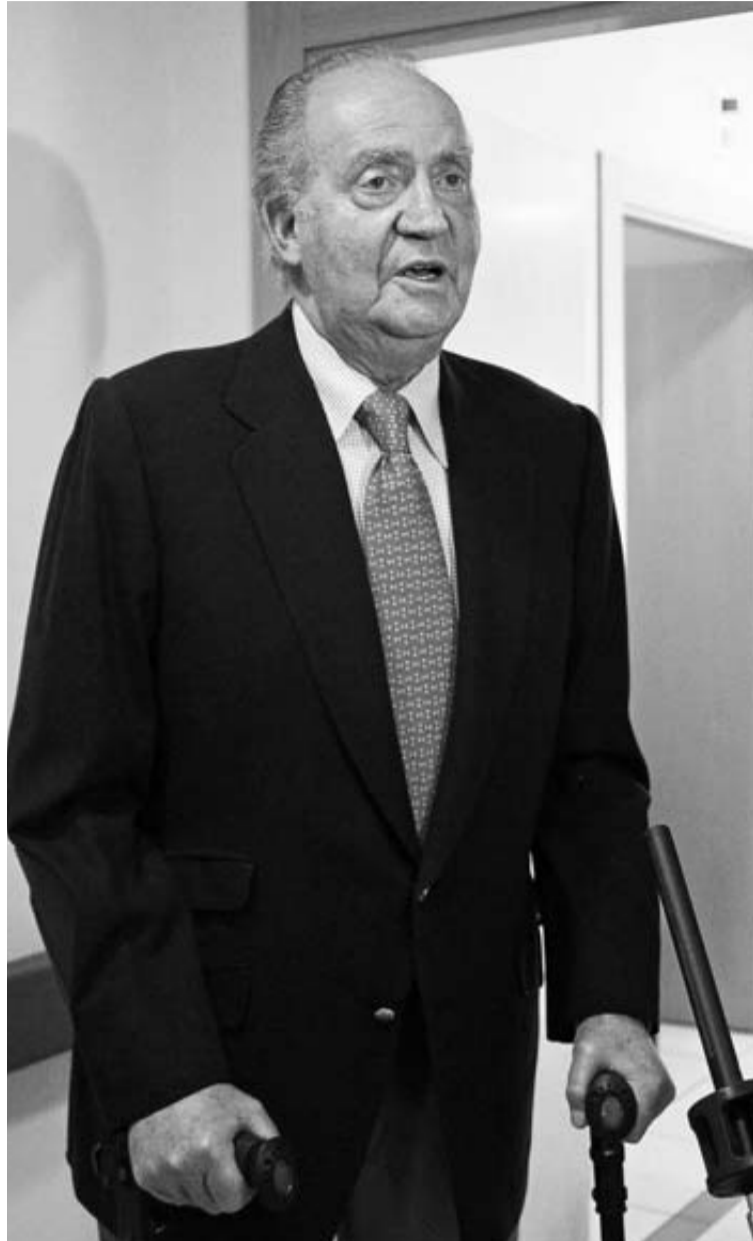
El Rey pide perdón a su salida del hospital el 18 de abril, tras ser operado por su accidente en Botsuana.