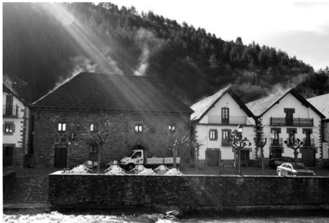
Ochagavía se despertó ayer con frío, pero con el sol mañanero se evaporó la escarcha de los tejados. VIDONDO

Con el fallecimiento de la vecina de Villava son 9 las personas que han perdido la vida este año por accidentes de tráfico. Es además la segunda mujer que muere atropellada en Pamplona. La anterior fue una vecina de Berriozar de 72, a la que arrolló un coche que salía de un garaje subterráneo de la calle Yanguas y Miranda.