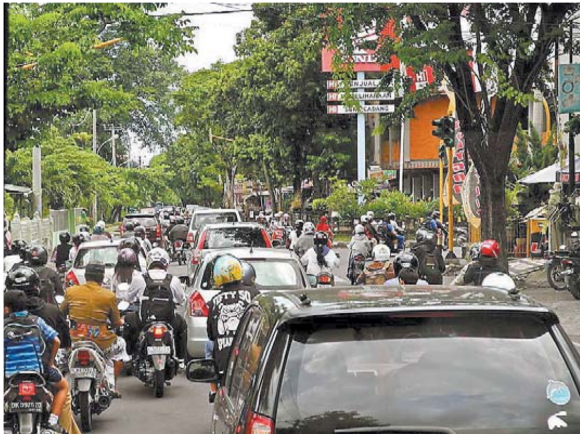
Imagen de tráfico en Bali, una de las islas de Indonesia.

El seguro de viaje que había contratado Eneko Seco tiene una cobertura máxima de 12.000 euros, insuficiente para afrontar todos los gastos médicos que conlleva su tratamiento: "En Bali la sanidad es privada. Al principio, los médicos