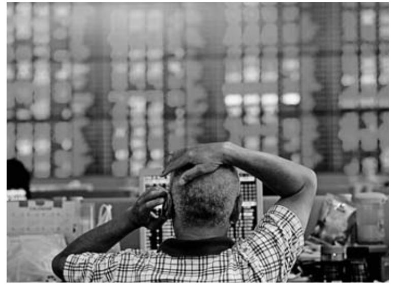
Las bolsas asiáticas sí acusaron los ataques. Aquí, la de Bangkok. ERE

Telefónica jugó en contra El selectivo español se quedó atrás respecto al resto, pese a que 19 de sus 35 valores terminaron en positivo. En su contra jugó uno de los grandes, Telefónica, que terminó el día con un descenso del 1,41%, só-