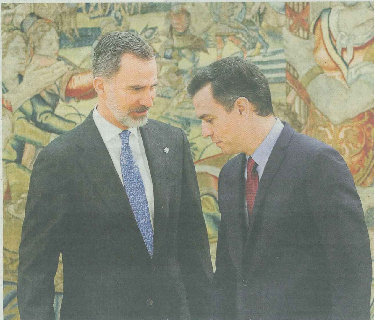
El rey Felipe VI y el presidente del Gobierno, Pedro Sánchez, charlan tras prometer este el cargo.