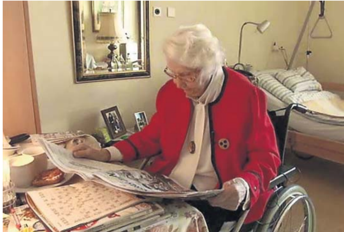
Una mujer en la habitación de una residencia.

A fecha de 1 de octubre del año anterior, había 89 personas que esperaban en su domicilio a acceder a una plaza pública o concertada. De ellas, 69 se encontraban obteniendo otra prestación o servicio y las 20 restantes sin cobrar ninguna ayuda por distintos motivos (falta de valoración económica, ausencia de dependencia, etc.). Por zonas geográficas, 63 de ellas esperaban en el área de la capital.