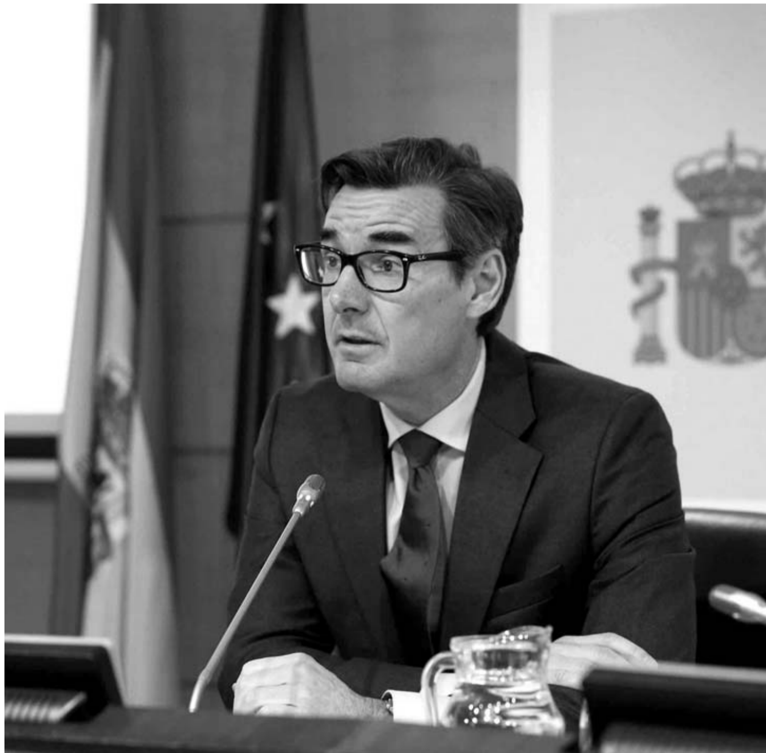
Carlos San Basilio Pardo, secretario general del Tesoro, presentó ayer en Madrid la Estrategia de Financiación para 2020.

En cuanto a las emisiones netas, es decir, al dinero nuevo en circulación en forma de deuda pública previsto para este año, San Basilio comunicó que estima que alcance los 32.500 millones de euros, por debajo de los 35.000 millones previstos para 2019 hace un año por estas fechas. De todas maneras, el volu-