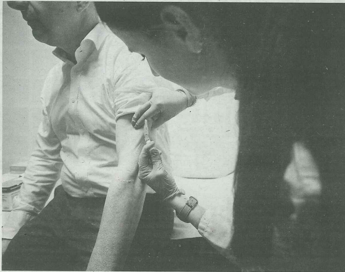
Una enfermera pone la vacuna de la gripe a un hombre al inicio de la campaña.

● Veinte pacientes ingresados y sigue “la circulación intensa” del virus respiratorio sincitial ● Salud prevé que la actividad asistencial suba en las próximas semanas