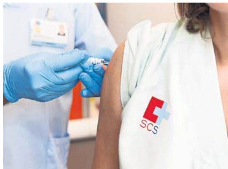
Una persona recibe la vacuna frente a la gripe.

La semana pasada se atendieron 684 personas con síndrome