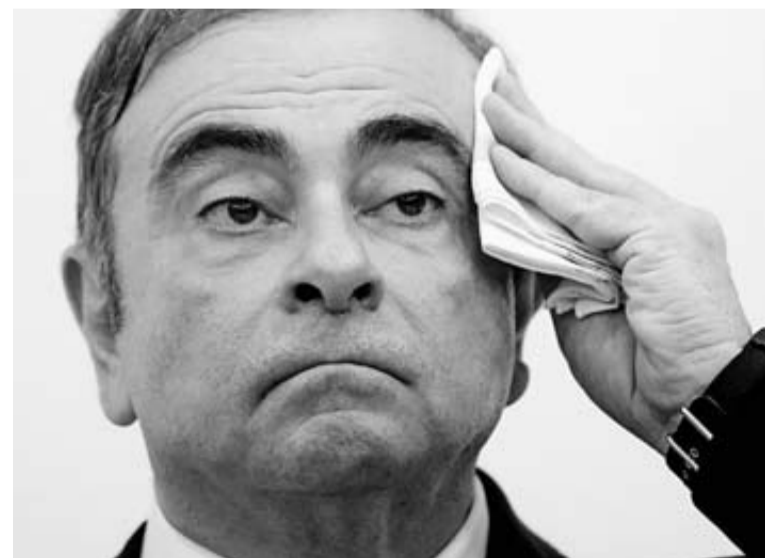
El ex presidente de Nissan ayer ante la prensa en Beirut.

El expresidente del consorcio automovilístico, de 65 años, agradeció a las autoridades libanesas "no haber perdido la fe" en él, que tiene la nacionalidad del país árabe, la francesa y la brasileña, y afirmó que fue "rehén" de un país al que le dedicó su vida profesional. Sin embargo, a su futuro judicial se le aproximan ya algunos nubarrones a los que tendrá que enfrentarse. El fiscal general de Líbano le ha citado para tomarle hoy mismo declaración después de recibir la co-