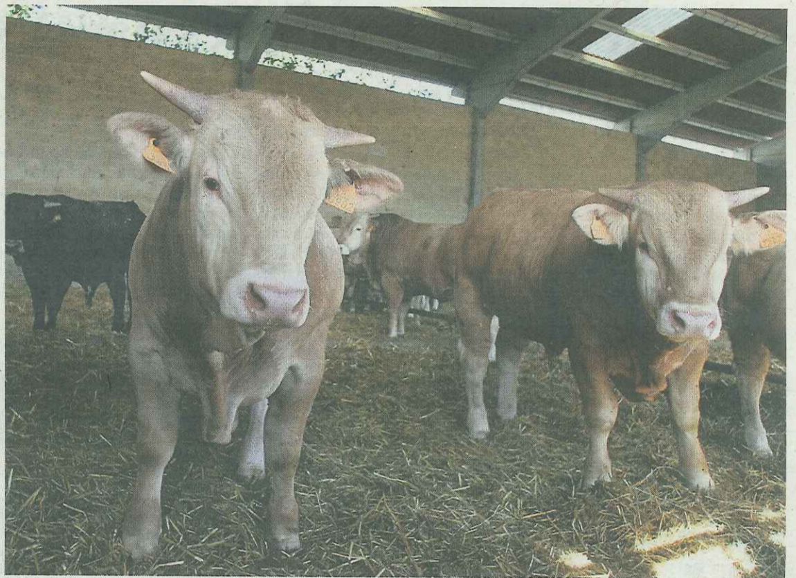
Vacas en una explotación ganadera.

Dirigido y enfocado preferentemente a instaladores profesionales, la tienda ofrece una amplia gama de material y soluciones, relacionadas con fontanería y saneamiento, calefacción, baño y grifería, climatización, tubería y aislamiento, fijación y herramienta, energías renovables, electricidad, iluminación, telecomunicaciones o domótica. Es el centro número 66 de la empresa navarra. – D.N.