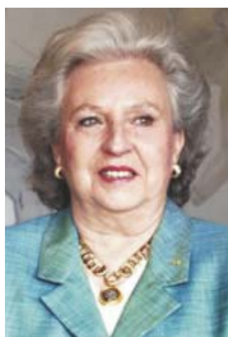
Pilar de Borbón.