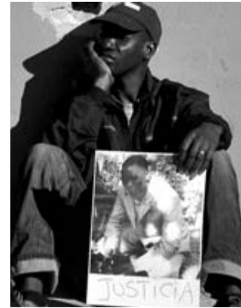
Cartel con la foto del fallecido.

El barrio del Besós de Barcelona, con 25.000 vecinos y gran presencia de emigrantes africanos y pakistaníes, vivió ayer horas de tensión tras la muerte a tiros de un joven senegalés. El crimen ocurrió en la noche del martes, cuando una discusión al principio intrascendente por un partido de fútbol callejero derivó en una pelea entre grupos en la que supuestamente un joven de etnia gitana, de 28 años, disparó mortalmente al joven senegalés, de 32. Al parecer, los tres hijos salieron de su casa al ver a su padre discutir y uno de ellos disparó mortalmente a la víctima con