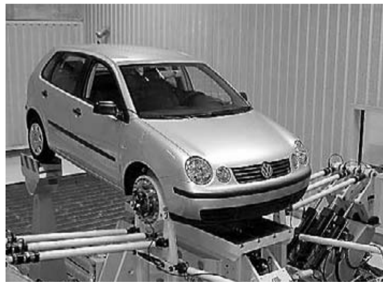
Uno de los proyectos de investigación de Citean.

Al analizar el crecimiento del número de entes públicos por comunidades, Cataluña es la que lidera la clasificación, con un 71,5 % más, seguida de Canarias (46,2 %), Navarra (41,2 %), Andalucía (40 %), Madrid (38,3 %), Aragón (38 %) y Asturias (36,2 %).