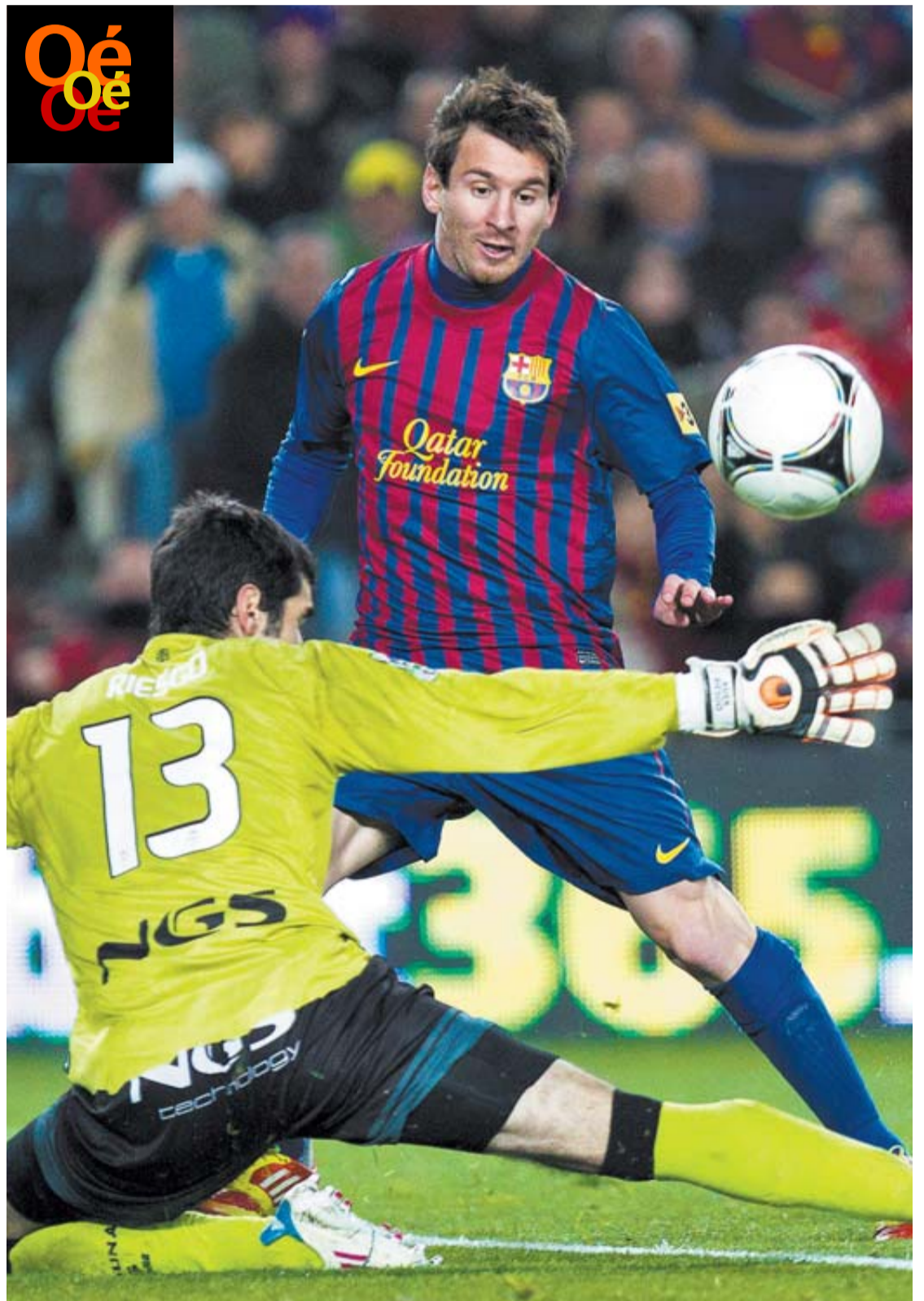
Una de las ocasiones en que Messi estuvo a punto de engrosar su cuenta goleadora ante Riesgo.