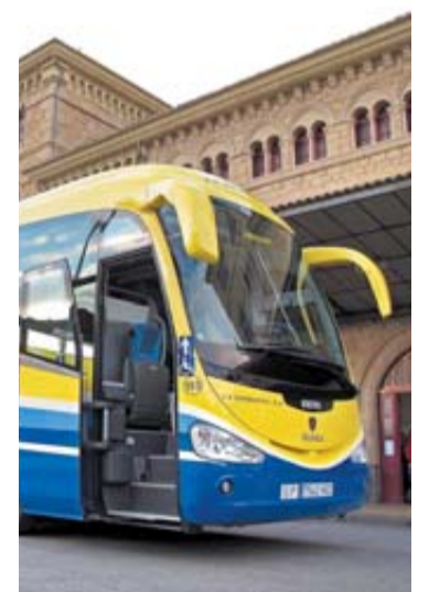
Imagen de un autobús.

Esta medida, la de la reducción del 30%, se estableció mediante resolución el 17 de octubre de 2008. Un año después, el 15 de junio de 2009, se modificó dicha resolución para reducir la edad mínima requerida para ser titular del carné de transporte joven de 16 a 14 años y establecer la compatibilidad de la reducción aplicada a los titulares de este