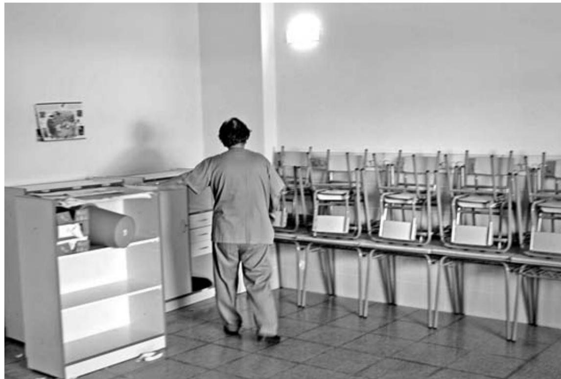
La limpieza de las zonas de más uso, como aulas y baños, seguirá siendo diaria.

Entre los servicios que no se van a modificar y que continuarán rea-