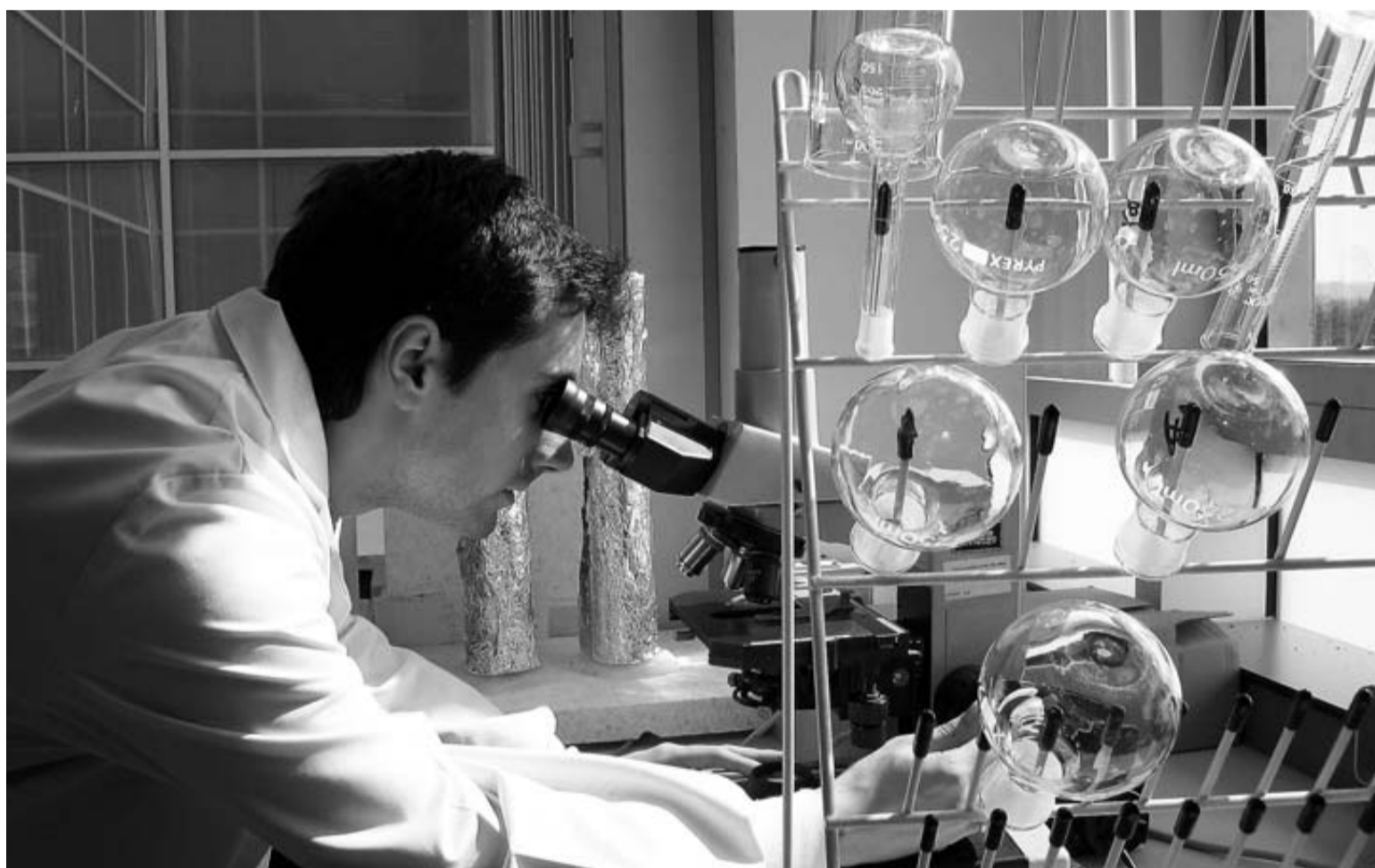
Una persona investiga en un laboratorio.

También quiere mejorar su eficiencia y hacerlos más competitivos