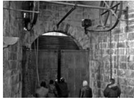
Preparativos en el Portal de Francia.

vienen por el Camino de Santiago hacia la Casa de Misericordia, su mejor albergue considerando la edad. ¿Quién se acordaba de la Maniobra de Derché? ¿Funcionaría? Funcionó. Y perfectamente. Bastaba con un engrase de euros para la rehabilitación. Noventa y cinco años después, el puente se movió tal y como lo había dejado Pinaqui en 1875, en una Pamplona de 25.000 habitantes que se parecía más, sin comparación, a la ciudad medieval que a la de 2012. Así hacían las cosas en aquel tiempo, cuando se fabricaban para siempre.