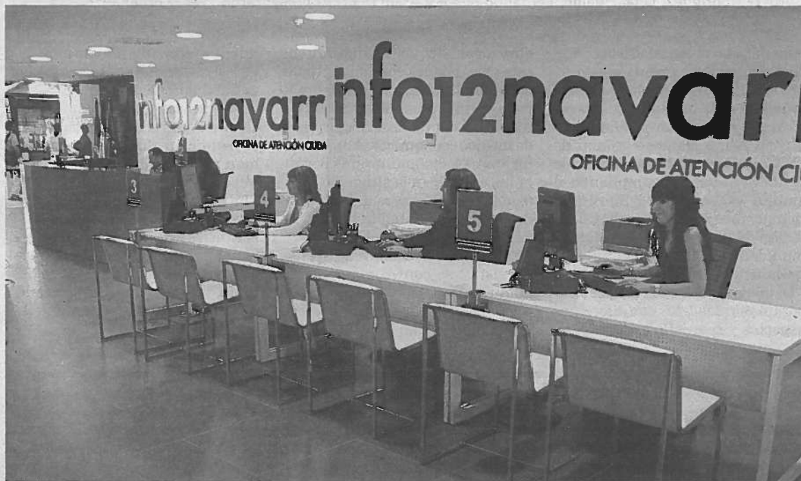
Interior de la oficina Inf012, situada en la plaza de Los Fueros y ofrecida al Ayuntamiento.