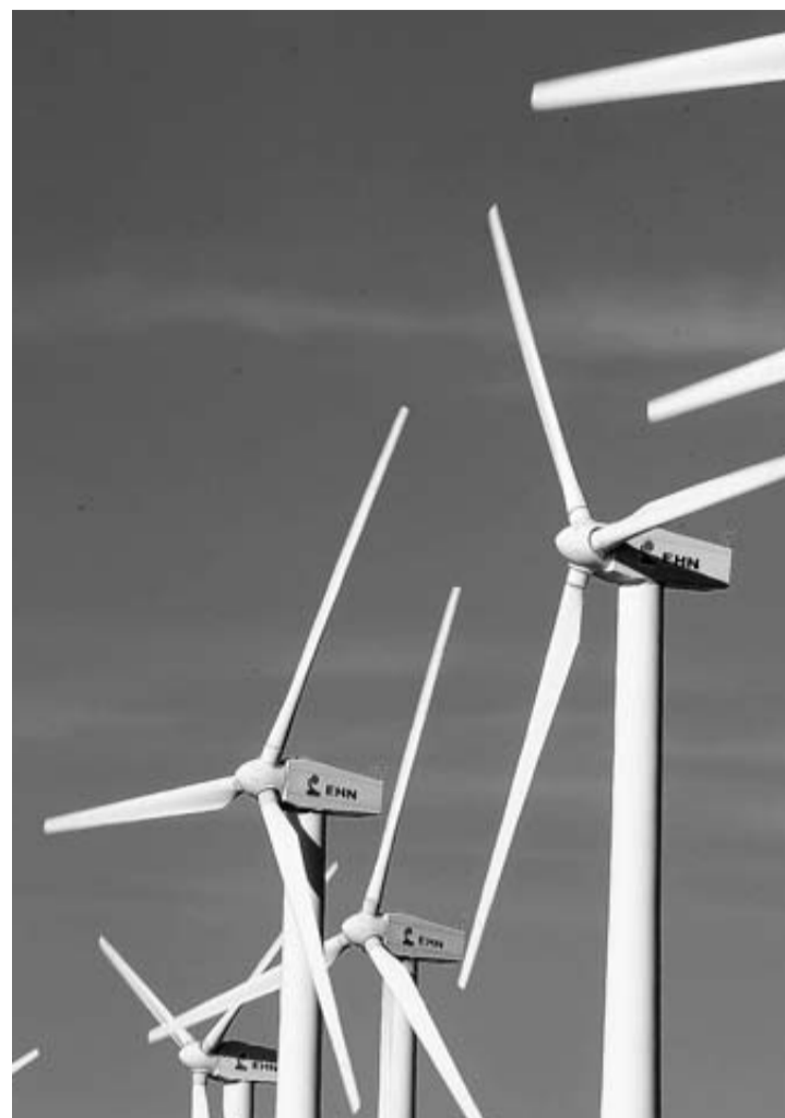
Molinos de viento en El Perdón, en una imagen de archivo.

Esta regulación de empleo es un paso previo a la realización del estudio promovido por el Ejecutivo foral.