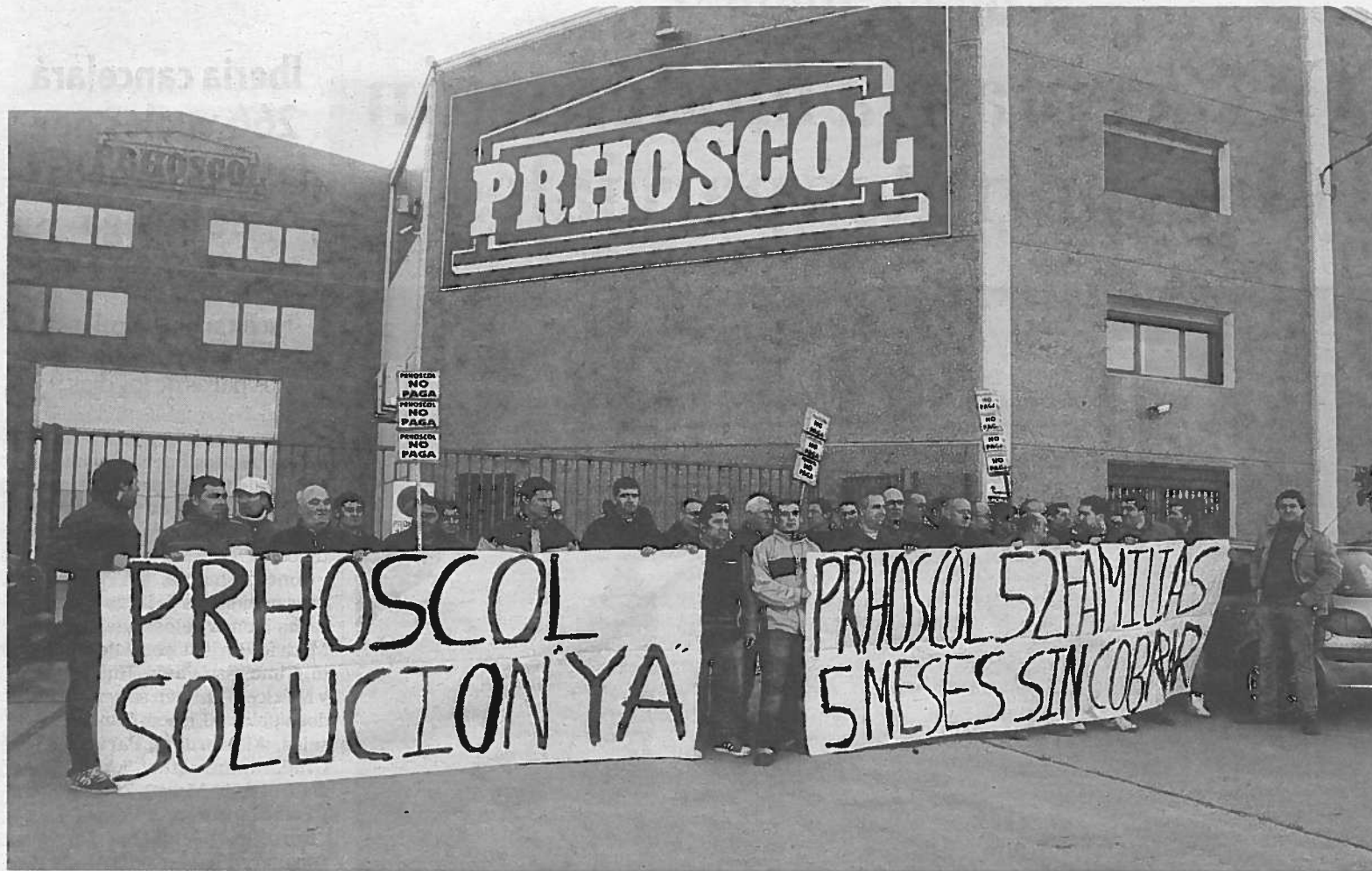
Los trabajadores de Prhoscol se concentraron ayer frente a la fábrica, en Viana, y reeditaron la protesta en Logroño por la tarde.