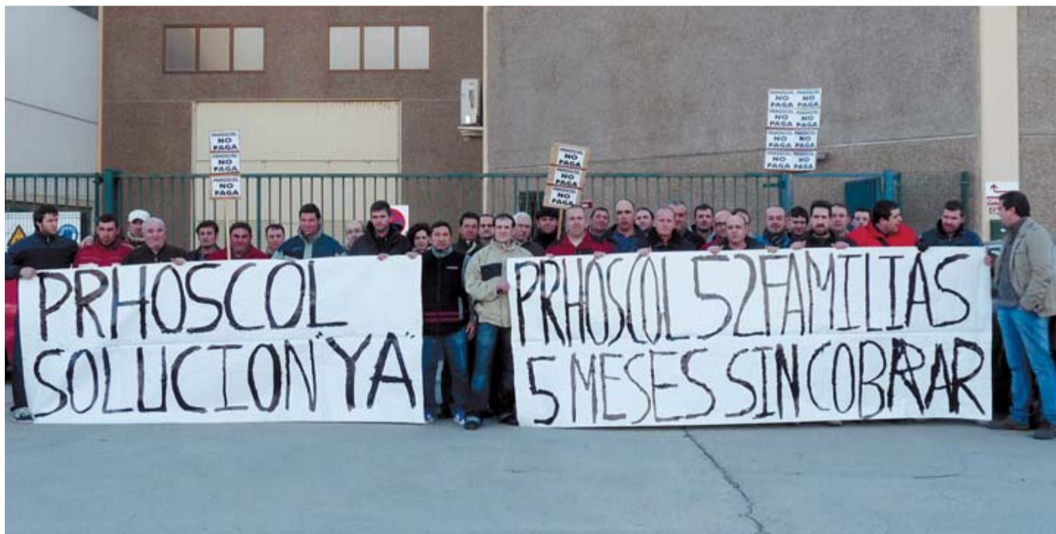
Un momento de la concentración realizada ayer por los trabajadores en la puerta de la factoría de Viana.

Con estos precedentes y el volumen de trabajo que, aseguran los empleados, tuvieron desde enero hasta septiembre de 2011 pensaban que habían dejado atrás el fantasma de la crisis. Hasta que en septiembre se desmanteló la dirección. “Y la paga de ese mes la recibimos en diciembre. Sí que es cierto que durante el resto del año percibíamos el sueldo con retraso, el 15 o el 10% no llegaba hasta final del siguiente mes. Pero es que ahora nos dicen directamente que no hay dinero”. Los trabajadores han descubierto que también han desaparecido los 22.000 euros de la cuenta de fondo asistencial, con la que la empresa cubría el 25% para que el personal de baja percibiera la totalidad del sueldo.