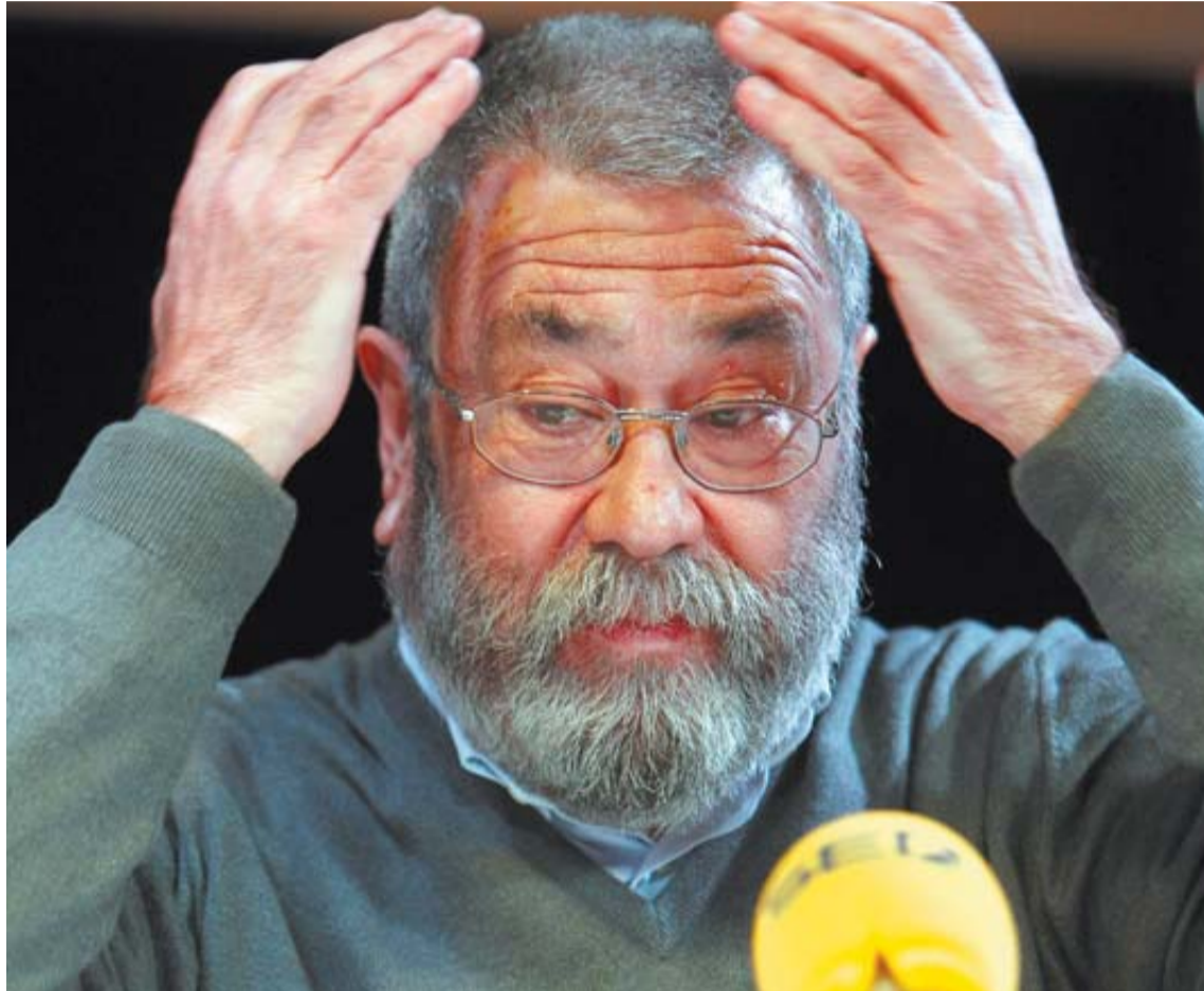
Un gesto de Cándido Méndez en el curso de la entrevista.

La medida sería reversible en cuanto las circunstancias mejoraran, y el secretario general de UGT defendió que la aplicación de esta fórmula no puede equipararse a una situación de 'miniempleo' o de empleo precario.