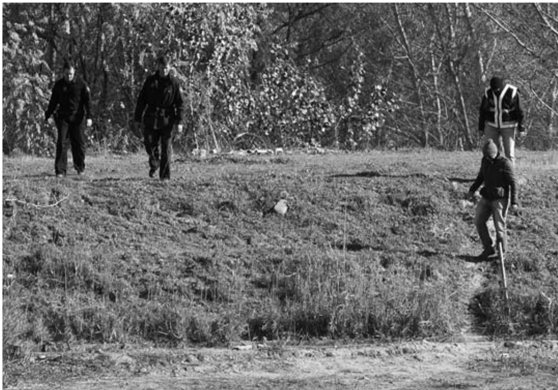
Agentes de policía rastrean las inmediaciones del río Guadalquivir.

La policía reanuda en pozos y colectores la búsqueda de los dos niños de 7 y 2 años desaparecidos en Córdoba hace casi tres meses