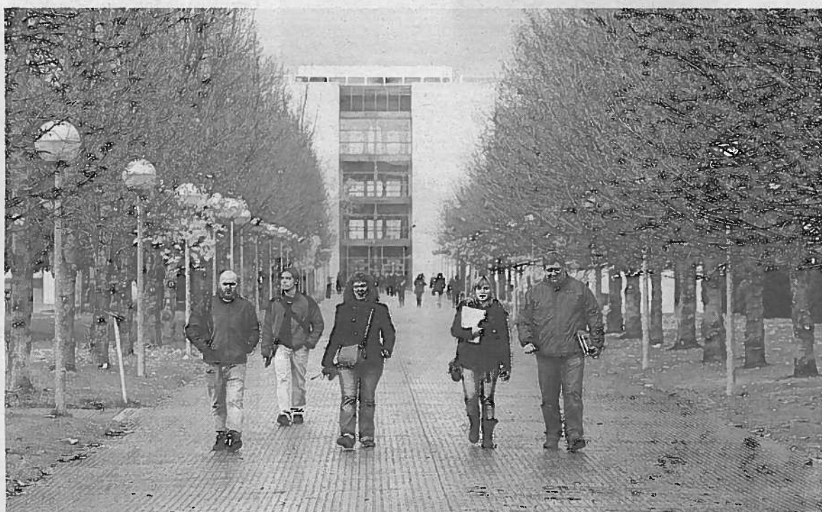
Estudiantes caminan por el campus de Arrosadía.

Como todo es superable, un día después, casi nueve millones de seres humanos con ojos y orejas dieron cuenta del Barça-Milan. Ahí me temo que les he cazado a muchos de ustedes y que me hubiera cazado a mí mismo si el evento no llega a coincidir con mi programa de la radio. Por eso mismo, renuncio a ponerme Rottenmayer en el juicio. Me limitaré a señalar que, en el fondo, se trataba de lo más cercano que nos queda al ejercicio de la libertad: elegir qué vemos en la tele.