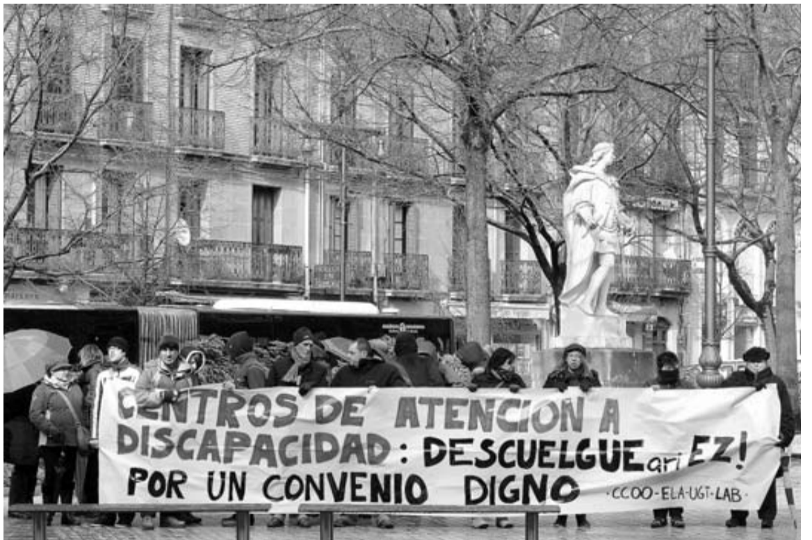
Representantes de centros que atienden a discapacitados protestaron ayer tarde ante el Parlamento. E.BUXENS

El consejero respondió así a una petición del PSN para que diera cuenta de los "posibles recortes" en dependencia. No fue el único tema de un jornada que se inició a las 4 de la tarde y se alargó durante casi cuatro horas. Tam-