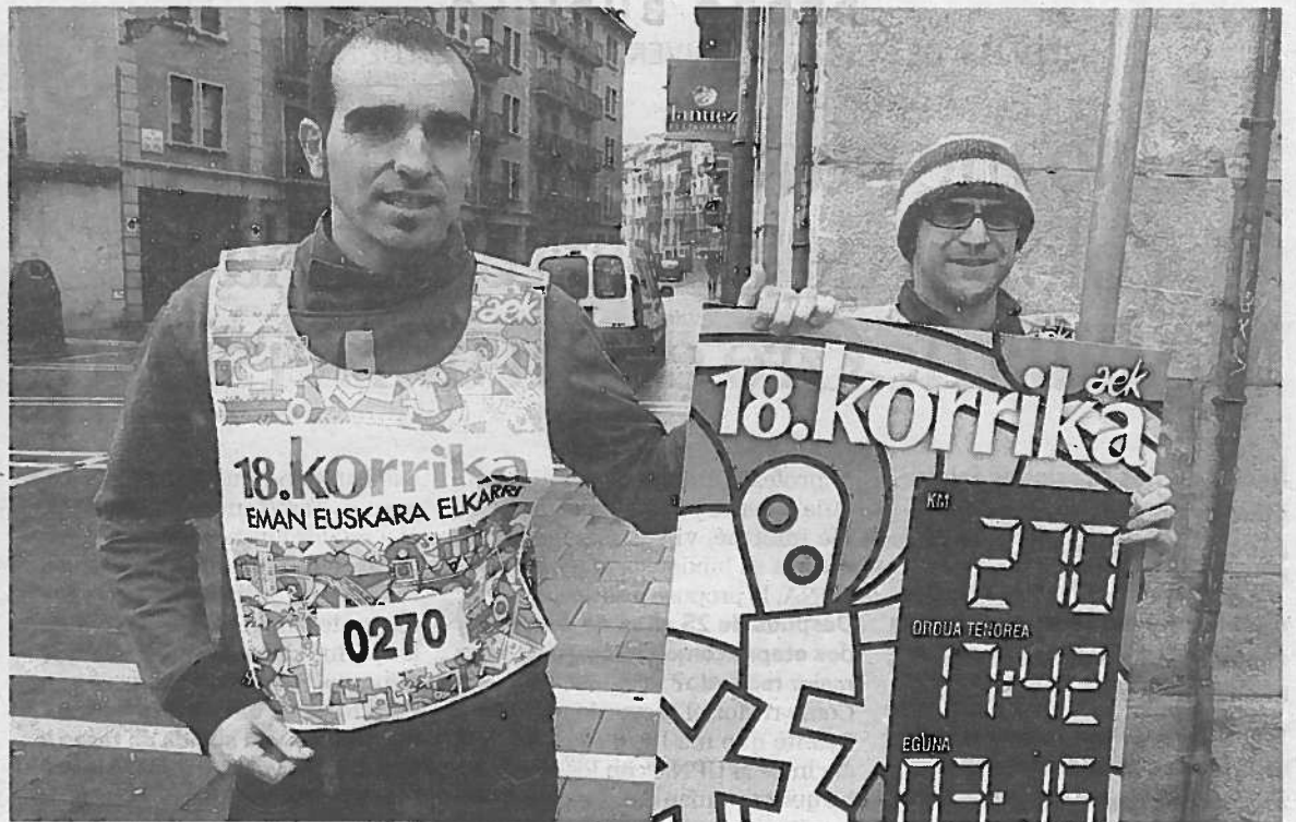
Korrikaren aurkezpena, 'Eman euskara elkarri' lelopean, atzo Iruñean.

● Asteartea. San Adrian, Sartaguda, Lodosa, Sesma, Los Arcos eta Mues.