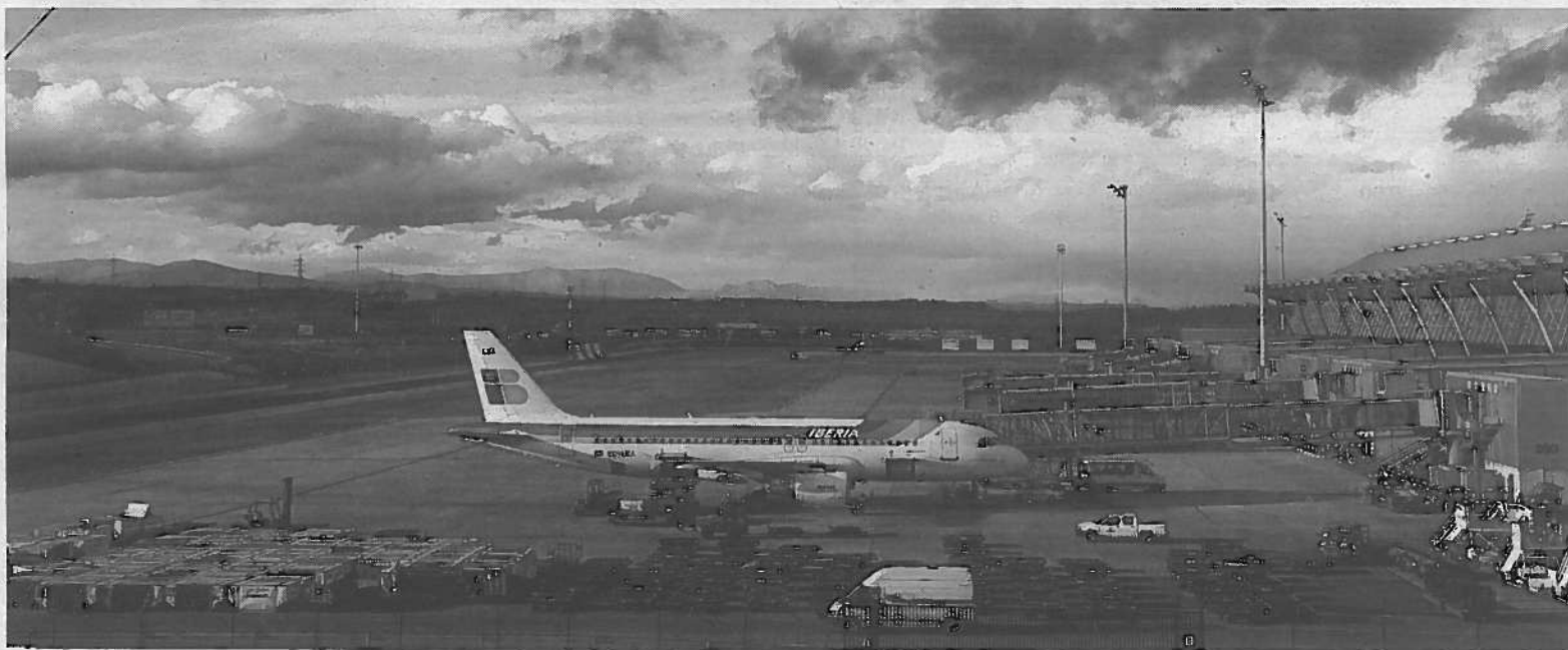
Uno de los aviones de la aerolínea Iberia, que ayer alcanzó un acuerdo con los sindicatos que paralizó la huelga anunciada.

Para 2014 se prevé un déficit para el Estado -sin contar con las demás administraciones y la seguridad social- de 6.400 millones de euros, de 296.900 millones de euros presupuestados. >EFE