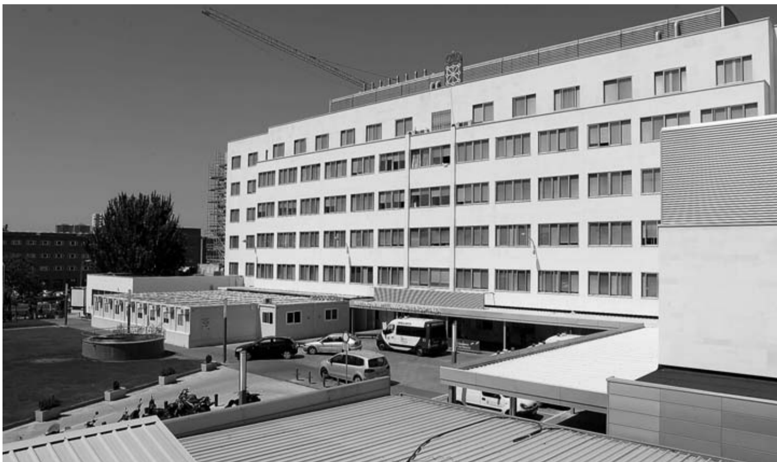
Edificio del hospital Virgen del Camino de Pamplona.

"La Caixa" y ENISA (Empresa Nacional de Innovación) convocan los Premios EmprendedorXXI. Pueden participar empresas españolas con menos de 7 años de actividad en dos categorías, una para proyectos con menos de 2 años en el mercado ("emprendes"), y otra para empresas innovadoras ya consolidadas o con una trayectoria entre 2 y 7 años ("creces"). El plazo para enviar candidaturas finalizará el próximo 21 de abril. Los ganadores "emprendes" participarán en un curso de la Universidad de Cambridge y recibirán 5.000 euros. El premio "creces" es de 150.000 euros para las tres mejores empresas de cada sector (50.000 euros para cada uno). La inscripción, en la página web, www.emprendedorxxi.es