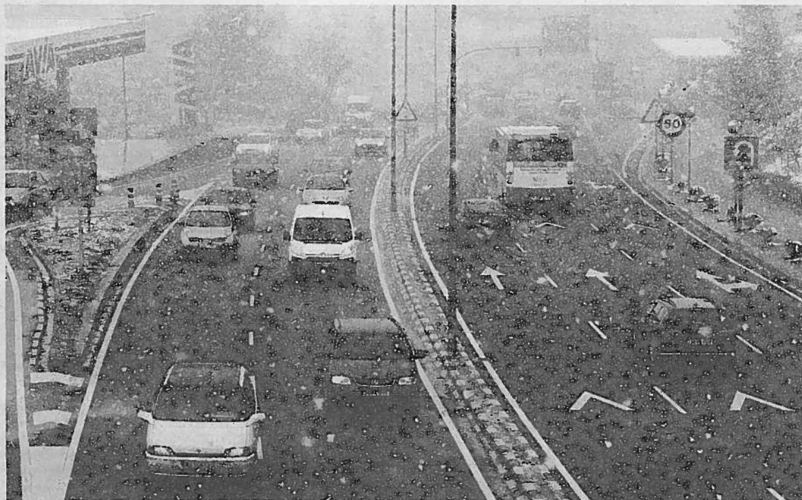
Salida de Pamplona a la altura de Zizur ayer sobre las 14.00 horas, cuando arreció el temporal.

Los primeros copos comenzaron a caer ya en la noche del martes, pero el momento álgido de la nevada no llegó hasta el mediodía de ayer, momento en el que en Pamplona los copos cayeron de forma continua y acompañados por fuertes y heladoras rachas de viento. La circulación en la capital no se vio afectada, mientras que en la Autovía de Leizaran, A-15, un accidente sin heridos, en el que se vieron implicados dos camiones y cinco