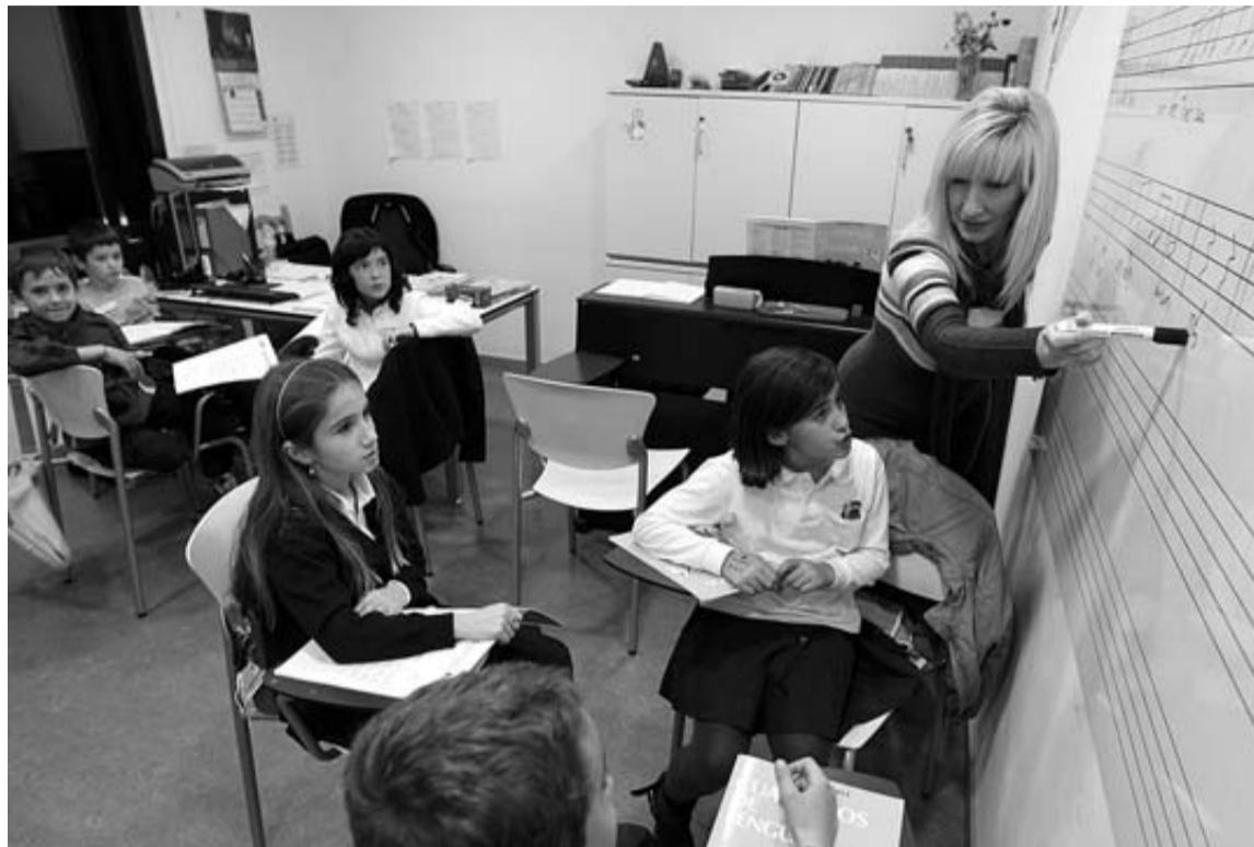
Alumnos de Lenguaje Musical de la Escuela de Música de Noáin-Valle de Elorz Julián Gayarre, atienden a su profesora en clase, en una imagen tomada el curso pasado.