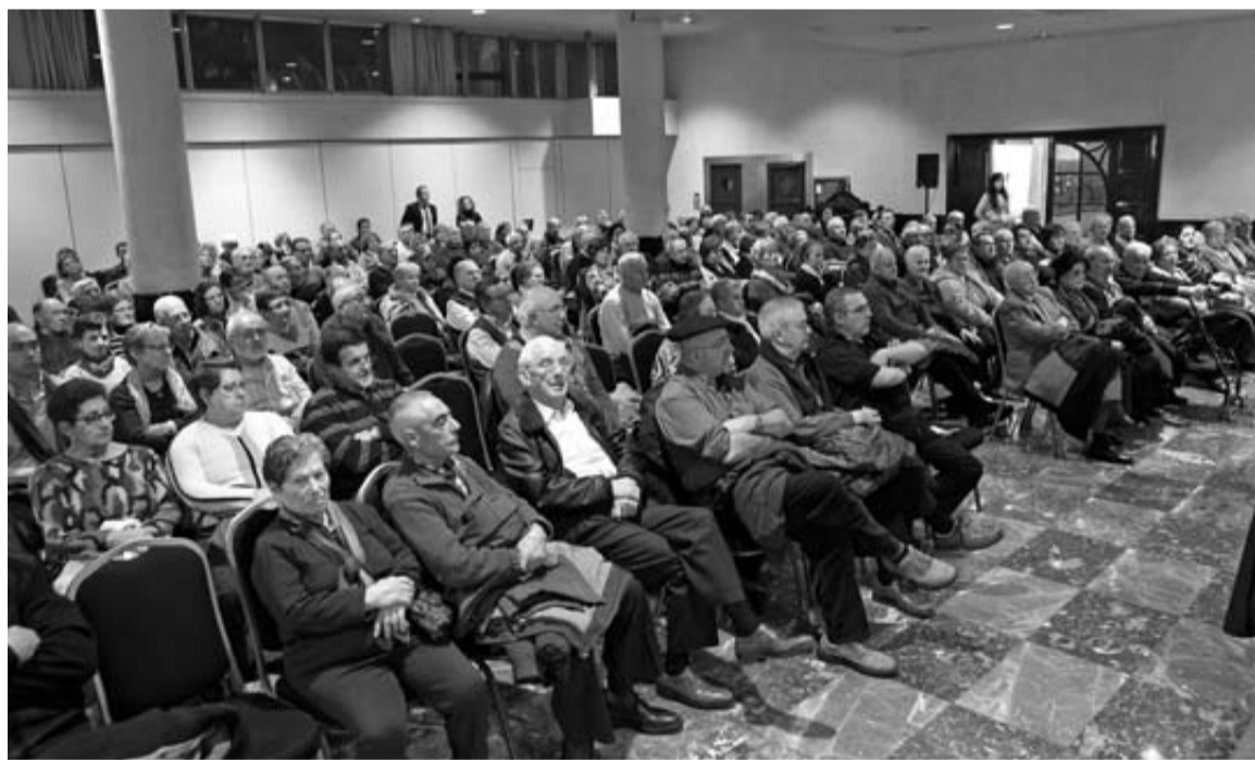
Imagen de los asistentes a la asamblea general celebrada ayer en el Hotel Tres Reyes de Pamplona.

La empresa Incita (Instituto Científico de Innovación y Tecnologías Aplicadas.), dedicada al diseño de software y tecnología, ha presentado un expediente de regulación de empleo temporal para 68 de sus 351 empleados. La suspensión, que durará un año, responde a la integración de Incita y el Grupo TB Solutions, y afectará a las delegaciones que la empresa tiene en Pamplona, Zaragoza, y Madrid. "Tras la integración, la compañía necesita una reorganización interna", explican desde la propia compañía. Esta medida se aplicará desde el próximo 1 de enero y finalizará en 2013. "La medida nace con la voluntad y el objetivo de reincorporar al personal afectado en cuanto se cierren acciones comerciales actualmente en marcha. Incita continúa con su estrategia de crecimiento y 2013 presenta importantes previsiones de desarrollo tanto a nivel nacional como internacional".