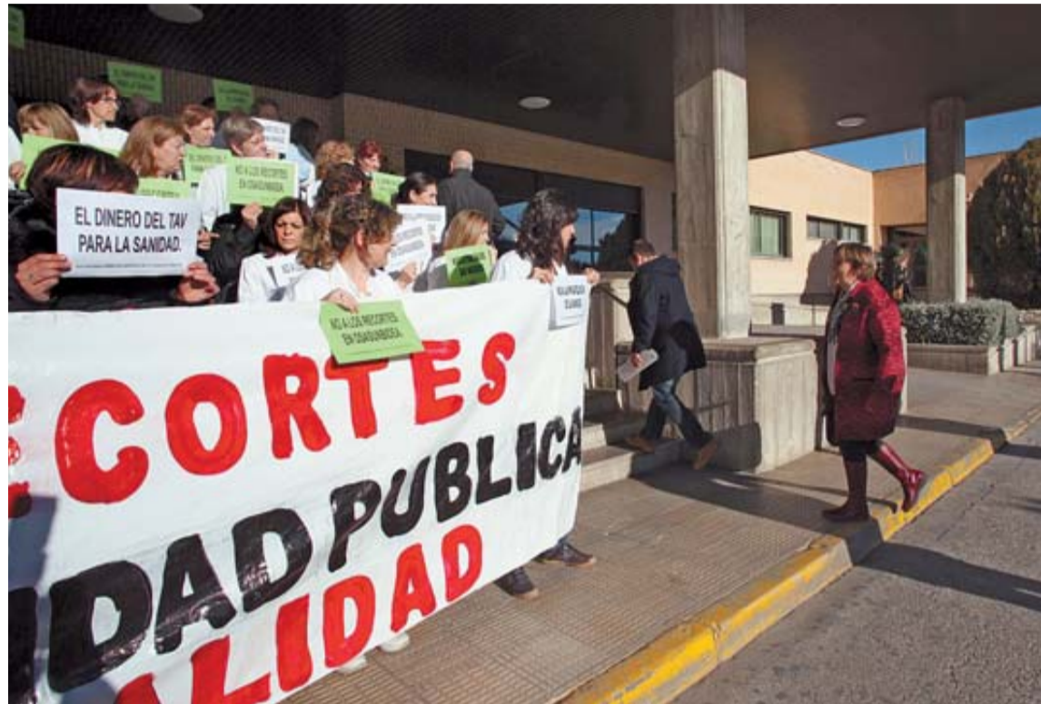
Personal del hospital de Tudela se concentró a la llegada de la comisión de Salud del Parlamento.

El director añadió que comparte "plenamente" la unificación de