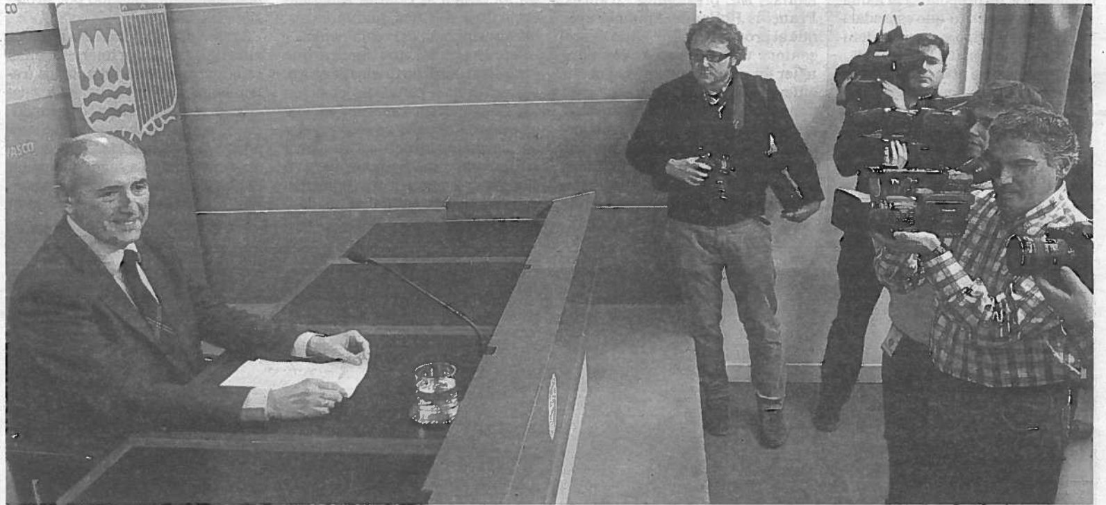
Josu Erkoreka, nuevo portavoz del Gobierno Vasco, antes de anunciar ayer los planes de su Ejecutivo con la paga extra.

Dos nuevas concentraciones en protesta por los recortes están convocadas para hoy en la plaza Merindades de Pamplona, frente a la Delegación del Gobierno de España en Navarra. A las 11 de la mañana el sindicato LAB llama a protestar por "la ofensiva contra los servicios públicos". Una hora después será el turno de los sindicatos presentes en los órganos de representación del personal de la Administración General del Estado en Navarra (ACAIP, CCOO, CSIF, ELA, FEDECA, GESTHA, LAB, SIAT-USO y UGT), quienes se concentrarán para denuncia "la política de recortes de los derechos laborales y salariales" que padecen estos trabajadores, quienes no tendrán ni extra de Navidad ni anticipadas las de 2013. >D.N.