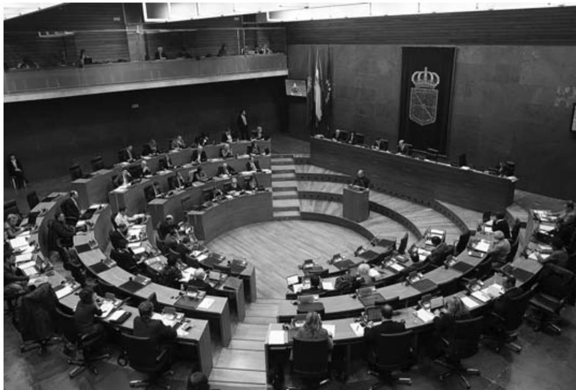
El hemiciclo del Parlamento de Navarra, durante una sesión plenaria.

Así figura en la comunicación que el Ministerio de Cristóbal Montoro ha enviado esta semana al Gobierno navarro, con el análisis que realizó en septiembre de varias proposiciones de ley, entre las que está la propuesta de Bildu de crear "un complemento personal transitorio por pérdida de poder adquisitivo" para los trabajadores públicos, equivalente a la extra que recibieron en julio. Se abonaría antes de final de año. La