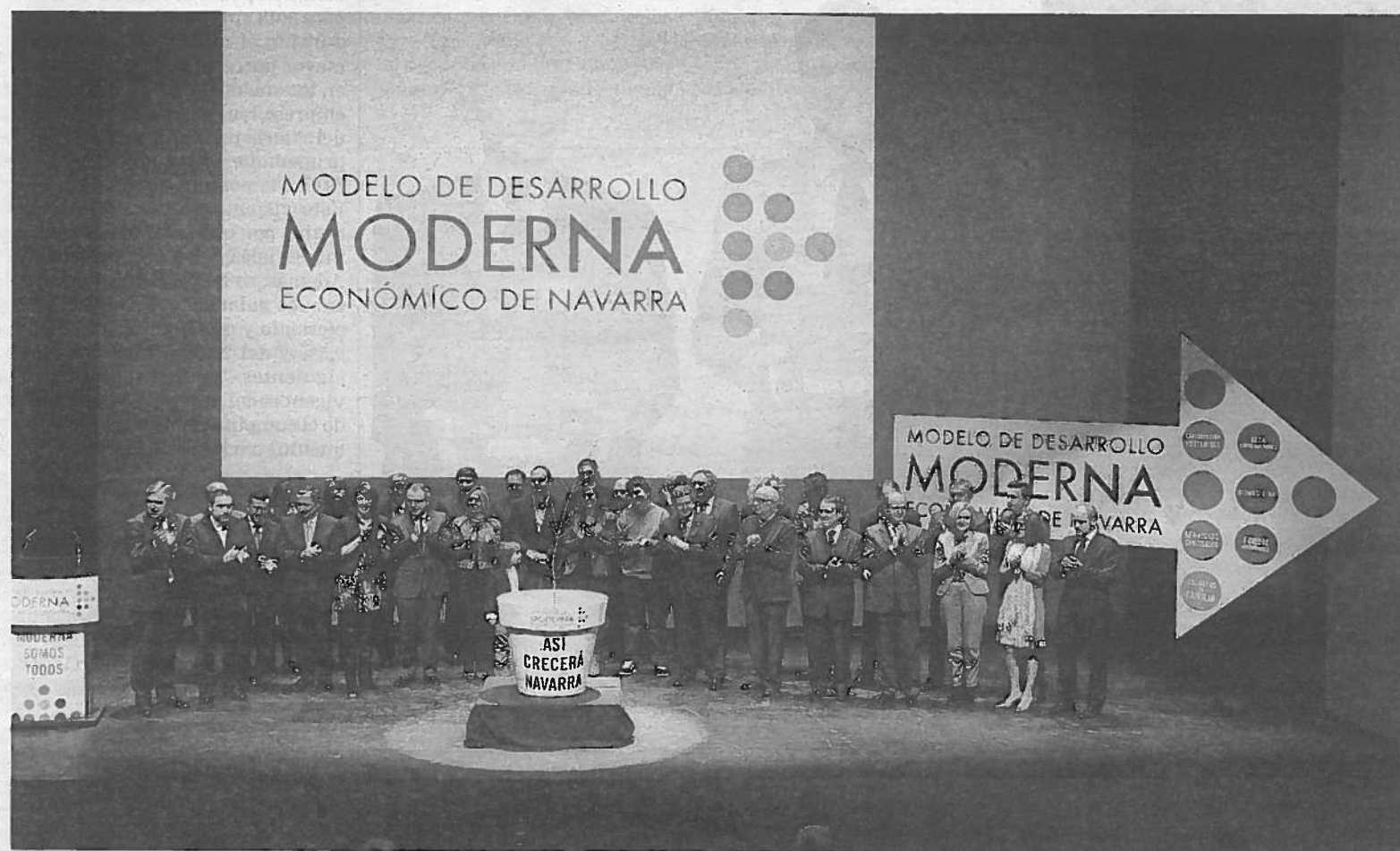
Presentación del Plan Moderna en Baluarte en marzo del año pasado.

EXAMEN AL PLAN DE DESARROLLO DE NAVARRA (Y II)