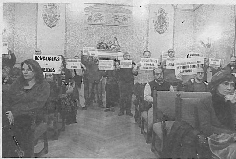
Protesta de trabajadores municipales en un pleno anterior.

Desde los sindicatos criticaron duramente ayer, entre otras cosas, la intención del equipo de gobierno