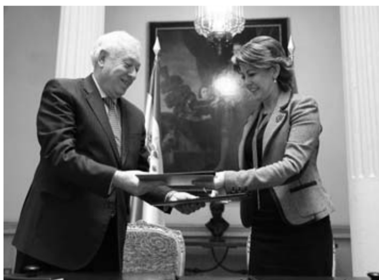
García Margallo y Barcina, tras la firma del protocolo, ayer en Madrid.

Esa propuesta de Bildu fue rechazada por el Parlamento en septiembre. Sólo la apoyaron NaBai e I-E. En contra votaron UPN y PP y se abstuvo el PSN. Sin embargo, el informe es relevante, dado que Bildu ha vuelto a proponer una norma para que en 2013 se vuelva a las 1.592 horas, algo que podría aprobar mañana el Parlamento, si el PSN vota a favor. El Gobierno foral ha decidido ampliar al año que viene las 37,5 horas mediante un decreto, sin pasar por el Legislativo.