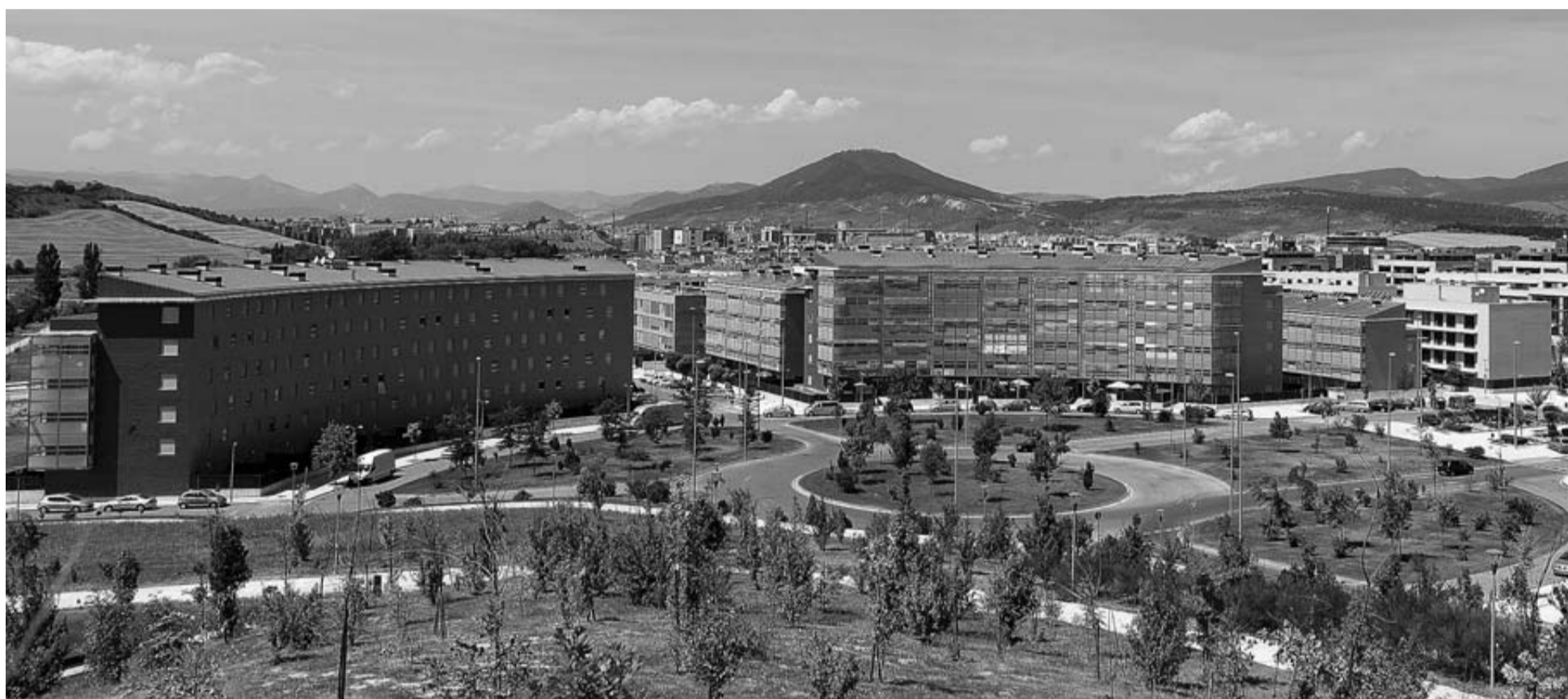
Vista panorámica de edificios de viviendas protegidas en Sarriguren.

El beneficio para el promotor por cada vivienda es de 18.000 euros de media