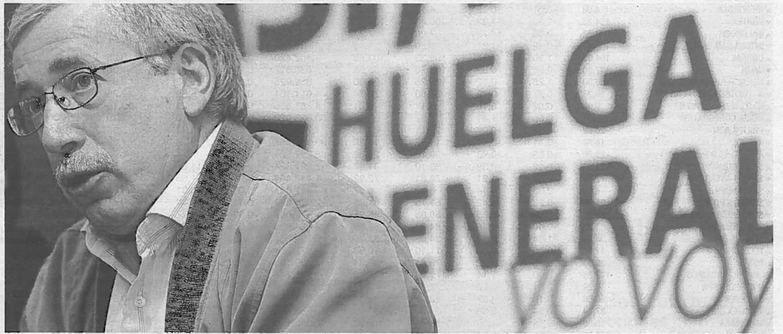
Ignacio Fernández Toxo, en una de sus visitas a Pamplona para preparar la huelga de 2010.