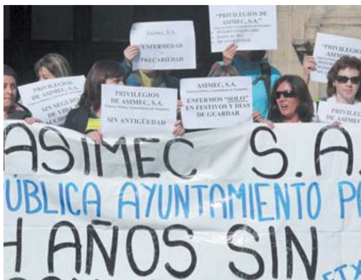
Trabajadoras de Asimec, concentradas en octubre.