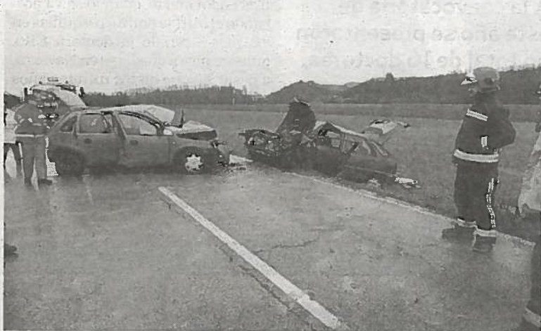
El Opel Corsa de la madre, a la izqda, y el coche del hijo (dcha).

vehículo de su propio hijo. Al parecer la colisión se produjo cuando el Opel Corsa de la mujer iba a efectuar un adelantamiento sobre un tercer vehículo, un Toyota tipo ranchera, que conducía un vecino de Galar de 58 años, que resultó ileso. Sin embargo, no pudo culminar la maniobra y colisionó de manera frontal contra el Citroen ZX en el que viajaba su hijo y, como consecuencia del impacto, el turismo de la mujer golpeó también la parte trasera del vehículo ranchera, que quedó mirando hacia el otro sentido al que circulaba. Los tres conductores iban solos en sus vehícu-