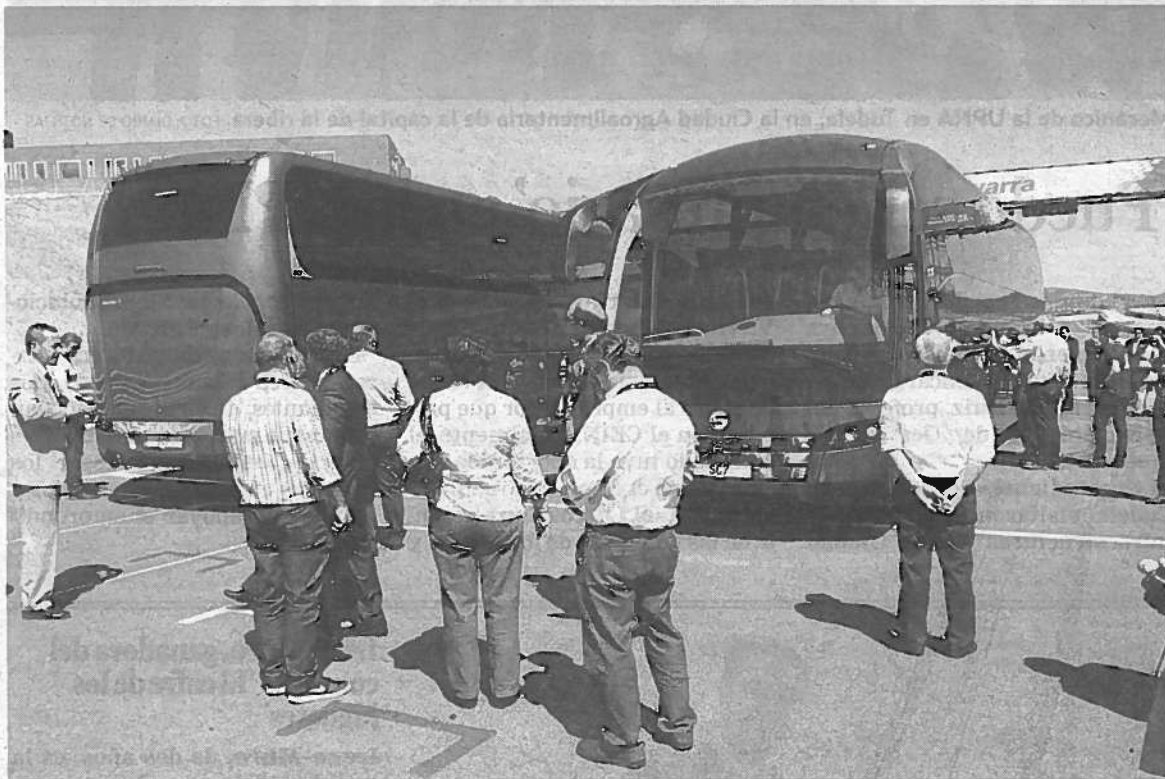
Presentación de los autobuses de Sunsundegui, en el Circuito de Navarra en junio.

la firma alsasuarra en 2009, recurrió la pasada semana a un precurso de acreedores para tener la posibilidad de que en el plazo de tres meses pueda negociar la deuda que tiene con sus acreedores y que no sea un juez de lo mercantil el que lo haga. Además, al estar en precurso también evita que cualquiera de sus clientes reclame vía denuncia el dinero que se le debe.