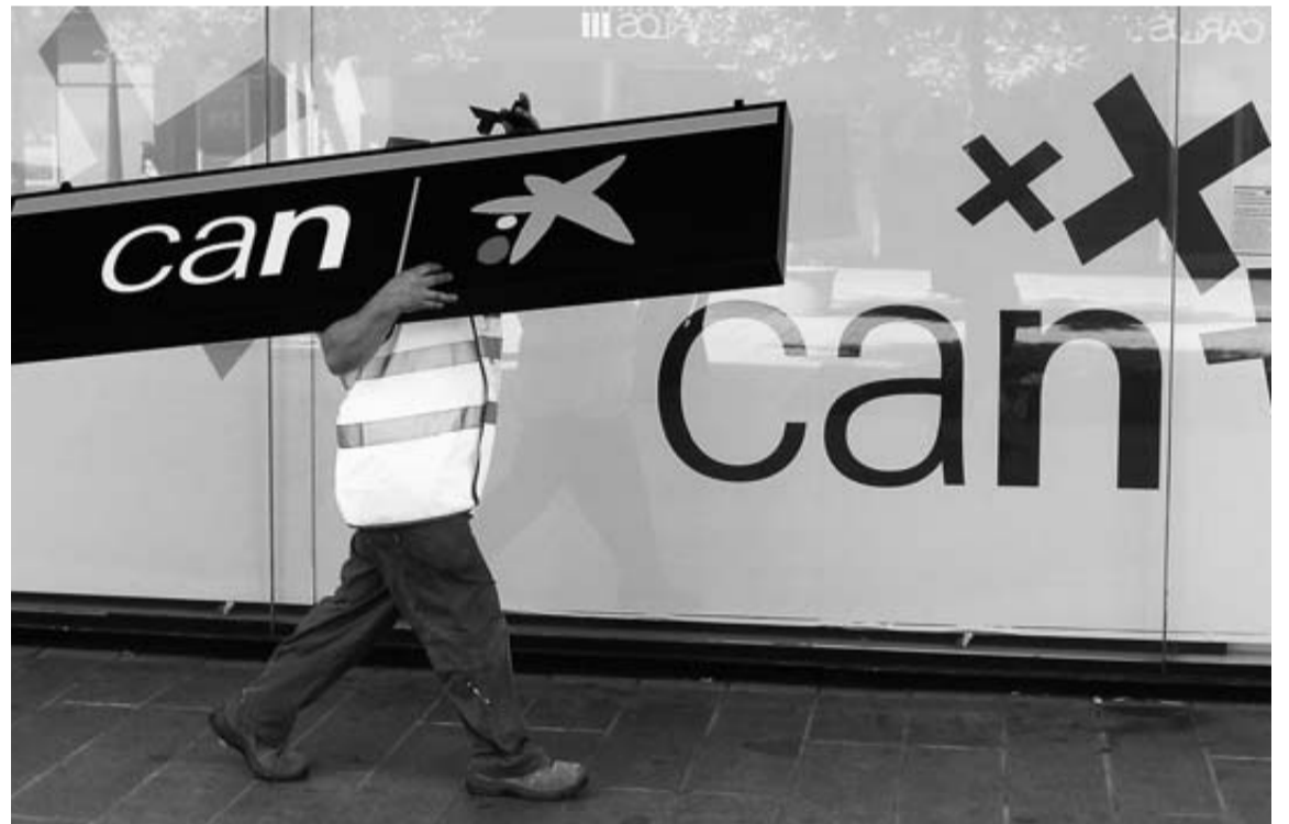
Un operario lleva sobre sus hombros uno de los carteles de CAN, tras la llegada de Caixabank.

El PP se desmarcó del disenter general al señalar que la iniciativa para la elaboración de los estatutos y, con ellos, del patronato de la fundación "corresponde al Gobierno de Navarra". Eloy Villanueva instó al Ejecutivo y, expresamente, a la presidenta Barcina a que dé "los pasos adecuados para que en la CAN no se den los errores del pasado" y que elija "a profesionales competentes e independientes".