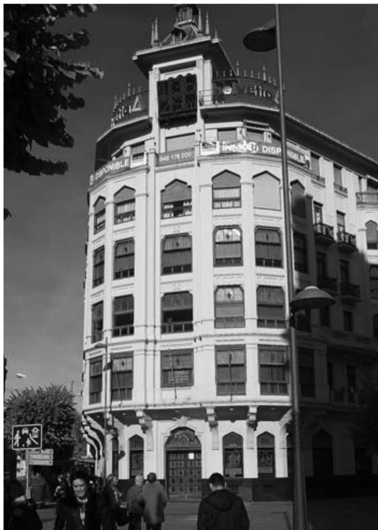
El edificio de "la Vasco", con letreros de "disponible".