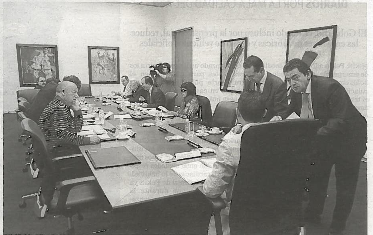
Los miembros de la Mesa y Junta, reunidos en una sesión anterior.