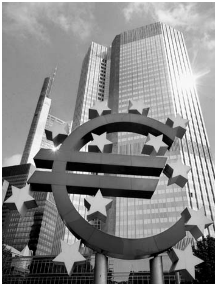
La sede del Banco Central Europeo en Fráncfort.

El pago de fondos europeos Sin embargo, ni está asegurada la confianza ni el desapalancamiento de la banca con el BCE deja de tener un riesgo. Y ese peligro radica en que la mejora de la posi-