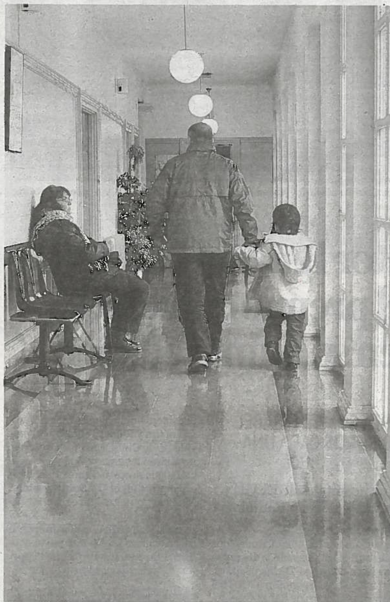
Pacientes, en el centro de salud de Lesaka.

"Algo no cuadra. Hay una incompatibilidad entre la reforma que quiere la consejera, Marta Vera, y la jornada de 35 horas aprobada por el Parlamento. Para aplicarla necesita