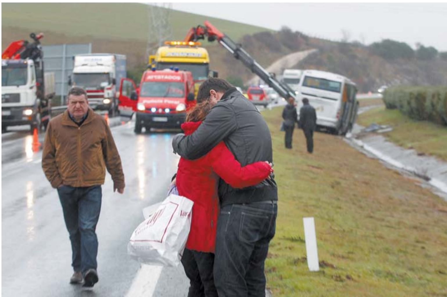
Una de las viajeras se abraza a su hijo, que acudió a recogerle al lugar del accidente; a la derecha, el microbús ya levantado por una grúa. BUXENS