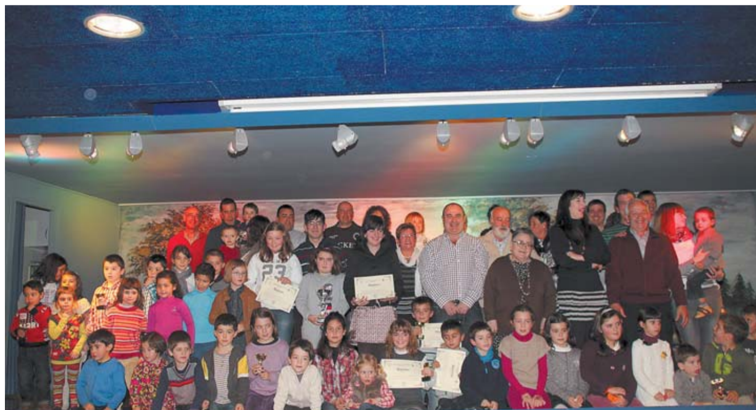
Premiados ayer en Tafalla con motivo del concurso de Belenes organizado por la Asociación de Belenistas de Tafalla.

La Asociación de Belenistas de Tafalla entregó el pasado sábado los premios correspondientes a su ya tradicional concurso de Belenes.