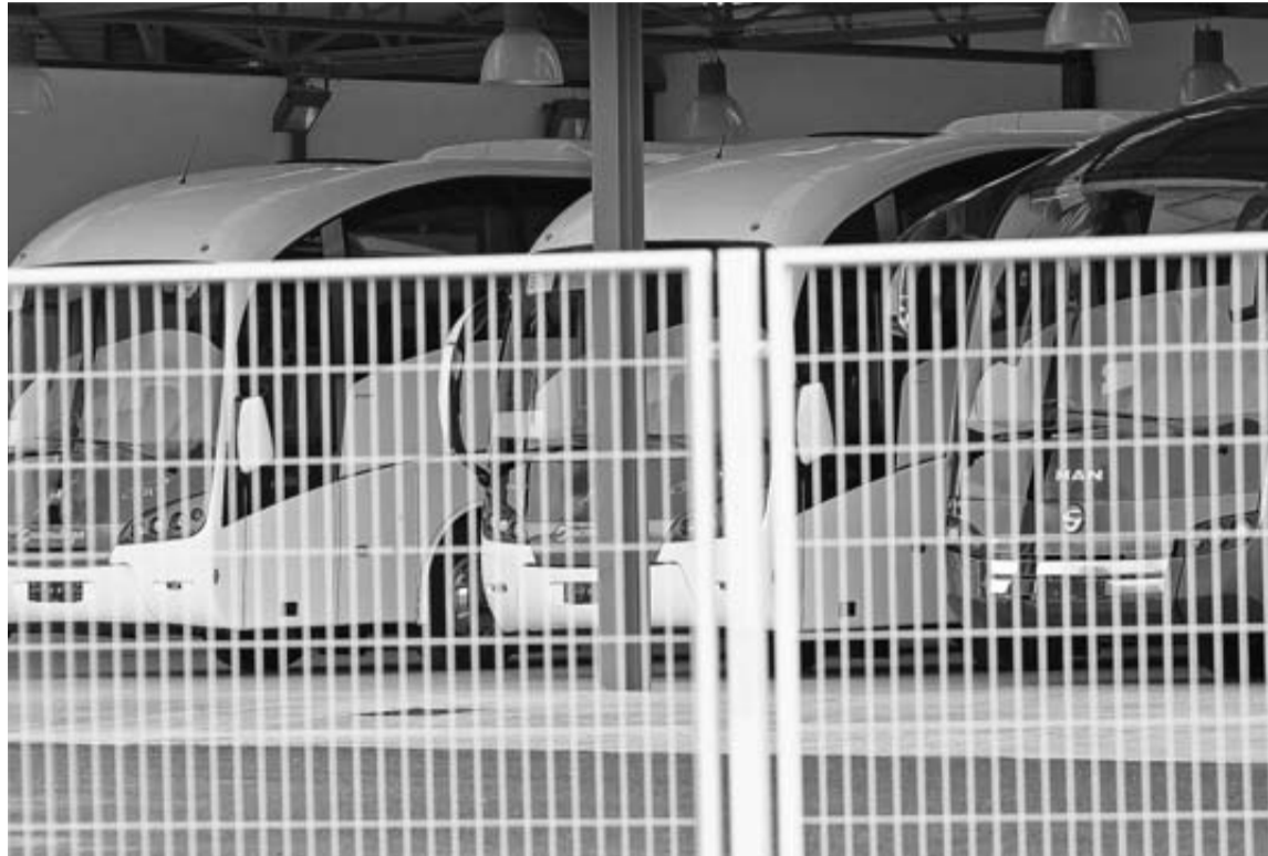
Al fondo, modelos de autobús fabricados en la empresa Sunsundegui de Alsasua.

La búsqueda de soluciones a una "situación insostenible y crítica" en Sunsundegui, con 36 millones de deuda y sin garantías de recibir más ayudas públicas, ocupa los esfuerzos de Gobierno, dirección y sindicatos -ELA, UGT y LAB- para disuadir la amenaza de cierre que se abate sobre la empresa y de pérdida de 236 puestos de trabajo. El primer paso se dio ayer con la reapertura de la línea de montaje y un compromiso para terminar los pedidos de autobús que se obtengan, como señalaron fuentes sindicales. El pasado miércoles la paralización de un pedido de tres chasis desató la inquietud en la plantilla. LAB habló de suspensión de la producción, mientras el Gobierno redujo el asunto a un he-