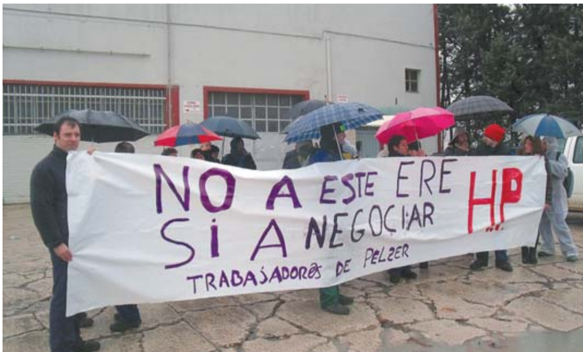
Primer paro en Pelzer del Norte, ayer, en Tafalla.

En las reuniones mantenidas con la dirección durante el periodo de consultas, el comité exigía, para la firma del ERE, la garantía del mantenimiento de la