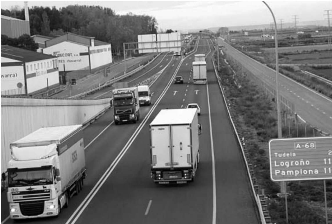
Tráfico de camiones en las carreteras navarras.