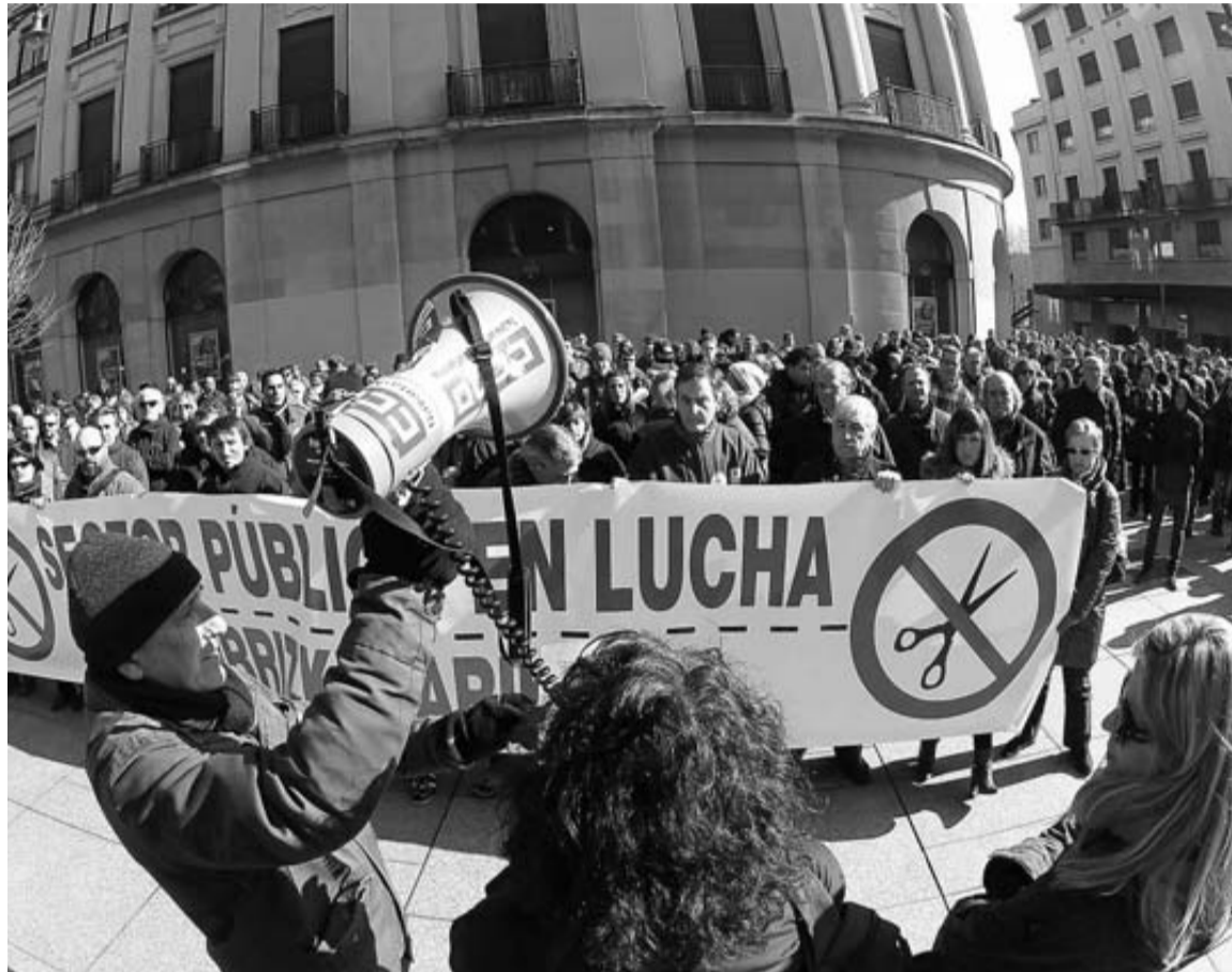
Trabajadores del sector público en una concentración laboral este año.