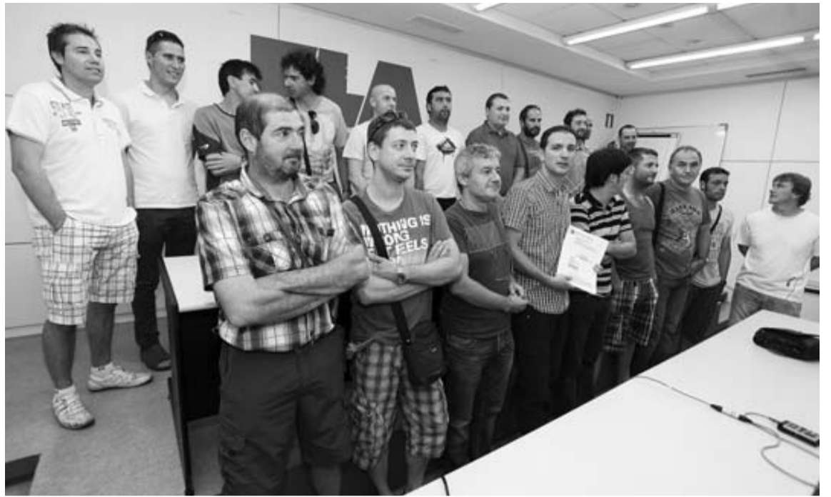
Despedidos de Koxka y dirigentes de ELA celebran la sentencia del Supremo que anula 26 despidos. CALLEJA

ELA reclamará esta misma semana a Koxka que se haga efectiva la sentencia con su inmediata reincorporación y el pago de los salarios de tramitación de estos años de ausencia forzosa. El fallo aún no es firme. Cabe recurso, en 20 días, al Constitucional. Pero Pascual no cree que la empresa recurra, como tampoco hizo