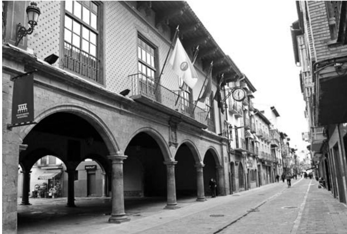
En la imagen, la fachada de la Casa Consistorial de Sangüesa.

El proyecto reconoce las mancomunidades, destacó Esparza. Se permitirá la agrupación local para prestar determinados servicios que, de ese modo, podrán seguir estando en manos de los ayuntamientos. El consejero recordó que en esa línea va a ir dirigida la reorganización local que se va a llevar a cabo en los próximos meses en Navarra. Indicó que los alcaldes le han transmitido que quieren una financiación estable, que les permita seguir prestando esos servicios que hoy dan a sus ciudadanos, y la mejor vía para que eso sea viable, dijo, es la agrupación. Aunque no son muchos, recaló, sí hay algunos ayuntamientos navarros que tendrían problemas para afrontar por sí solos esas prestaciones, lo que les causaría problemas con la futura ley nacional. El con-