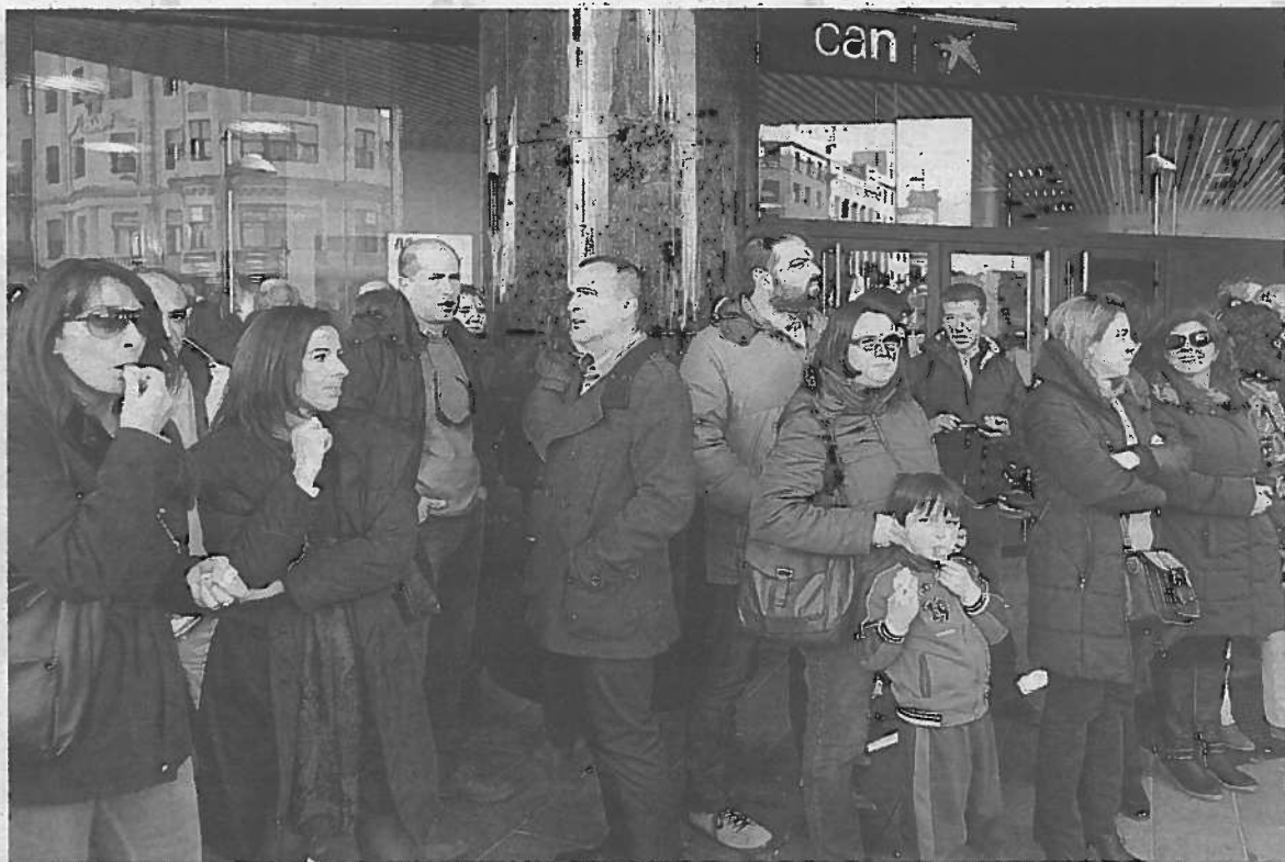
Concentración contra el recorte de plantilla en CaixaBank.

El banco encabezado por Isidro Fainé también mejoró la indemnización de las bajas voluntarias, ya que a los 45 días por año, con un tope de 42 mensualidades y un mínimo de dos