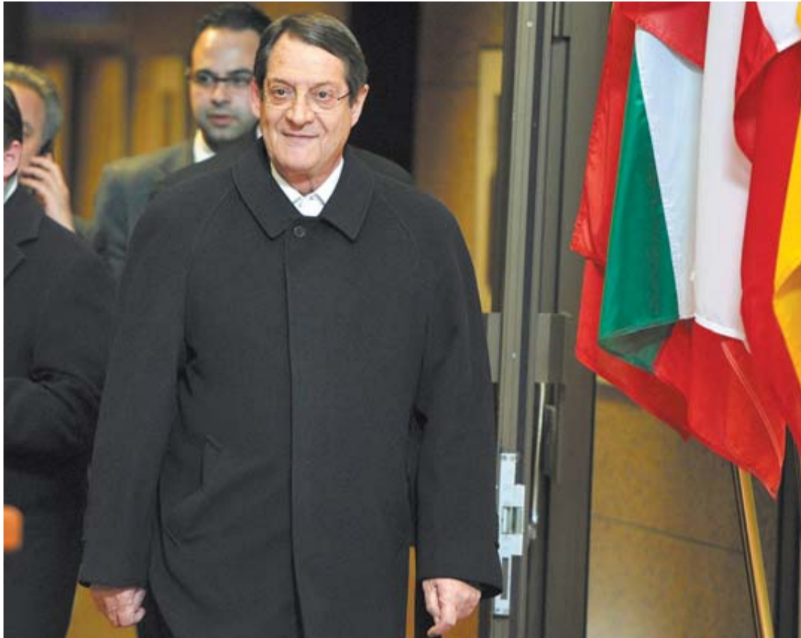
El presidente de Chipre, Nicos Anastasiades, abandona la reunión del Eurogrupo de madrugada.

"Lo que hemos hecho en este caso es lo que yo llamo hacer retroceder los riesgos"