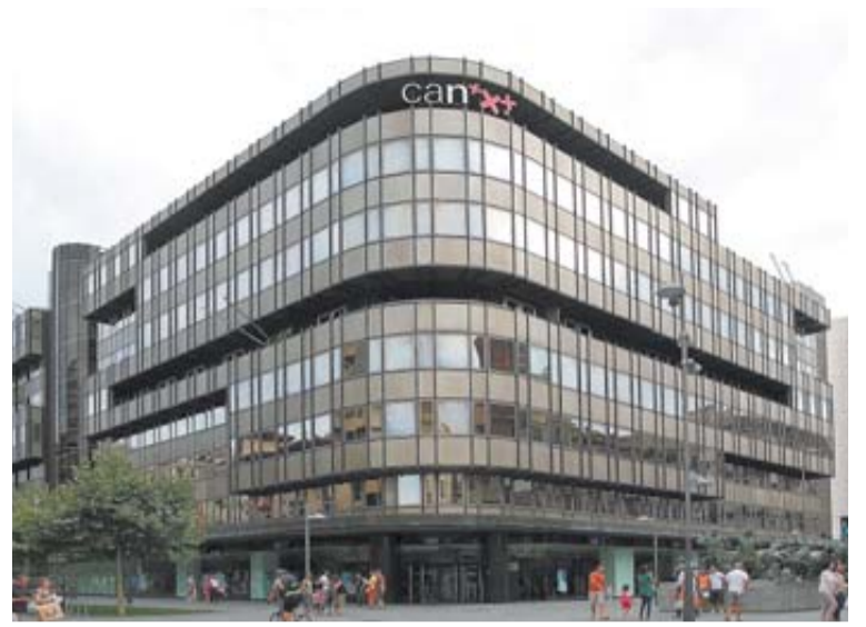
Exterior de Caixabank en Pamplona, en imagen de archivo. NOEMÍ LARUMBE

CCOO, SECPB y UGT (que cuentan con la mayoría (96,83%) en la mesa de negociación, "la dirección está bloqueando la negociación" y condicionan los avances a la retirada de los despidos.