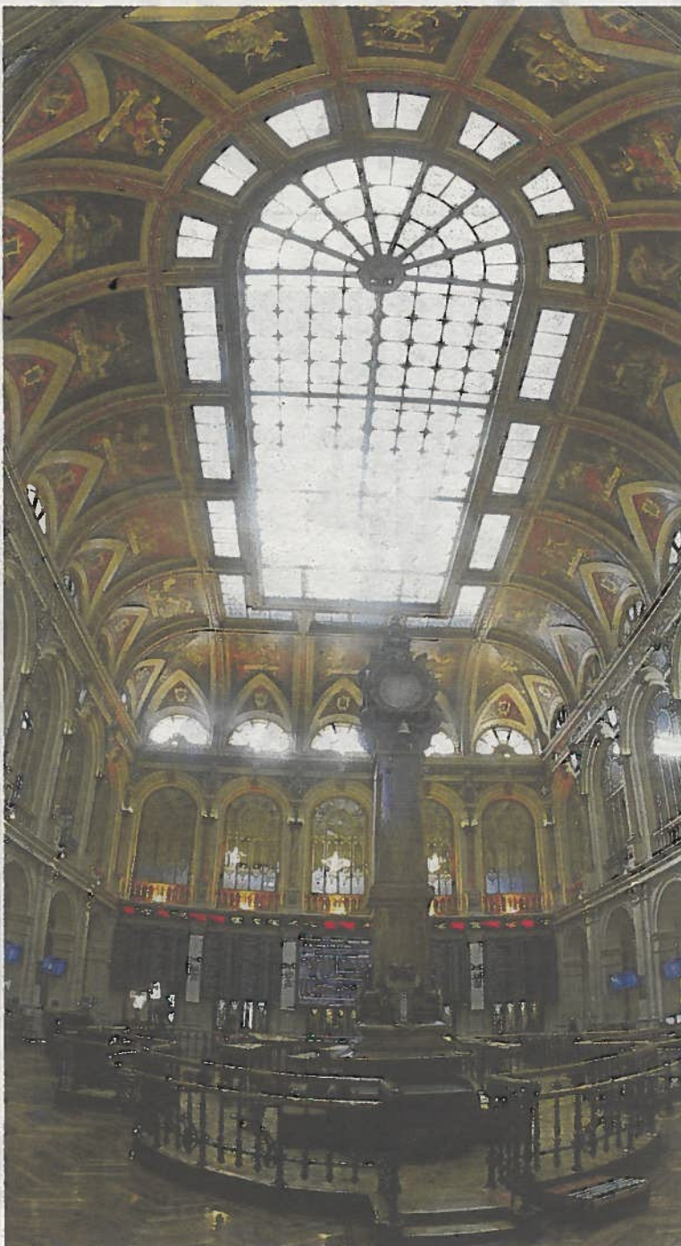
El parqué de la Bolsa de Madrid registró poca actividad. FOTO: EFE

Mañana, vuelve a enfrentarse al mercado en una nueva puja de bonos a 6 meses, en la que espera adjudicar 8.500 millones, mientras que el miércoles prevé colocar entre 5.000 y 7.000 millones de euros en títulos a 5 y 10 años. >EFE