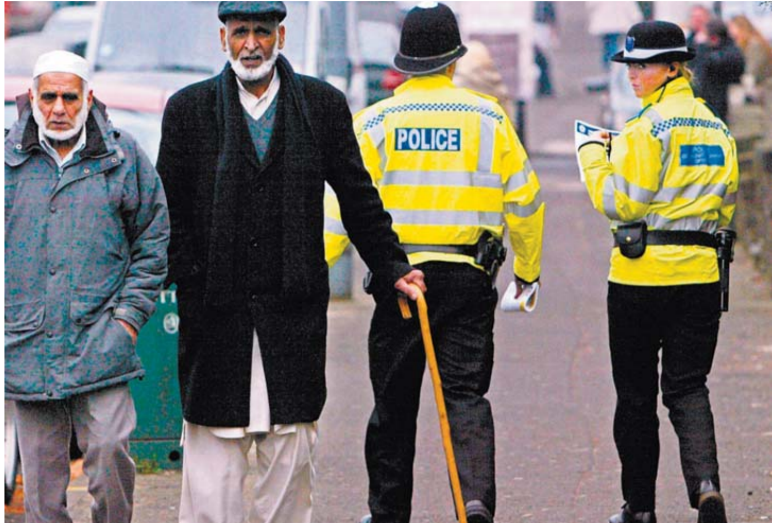
Una agente de la Policía observa a dos inmigrantes en la ciudad de Birmingham.

“No podemos detener estos controles transitorios a Rumanía y Bulgaria, pero lo que sí está en nuestras manos es asegurarnos de que los que vienen aquí de la UE -o más lejos- lo hagan por las razones correctas. Porque desean contribuir en nuestro país y no debido a que se sientan atraídos por nuestro sistema de beneficios o por la oportunidad de utilizar nuestros servicios públicos”, dijo con contundencia en un discurso pronunciado en la Universidad de Suffolk, al sureste de Inglaterra. Las líneas de su mensaje ya se dejaron entrever el viernes, cuando el líder liberal y número dos de la coalición gubernamental, Nick Clegg, dio un vuelco a su política proinmigración al exigir