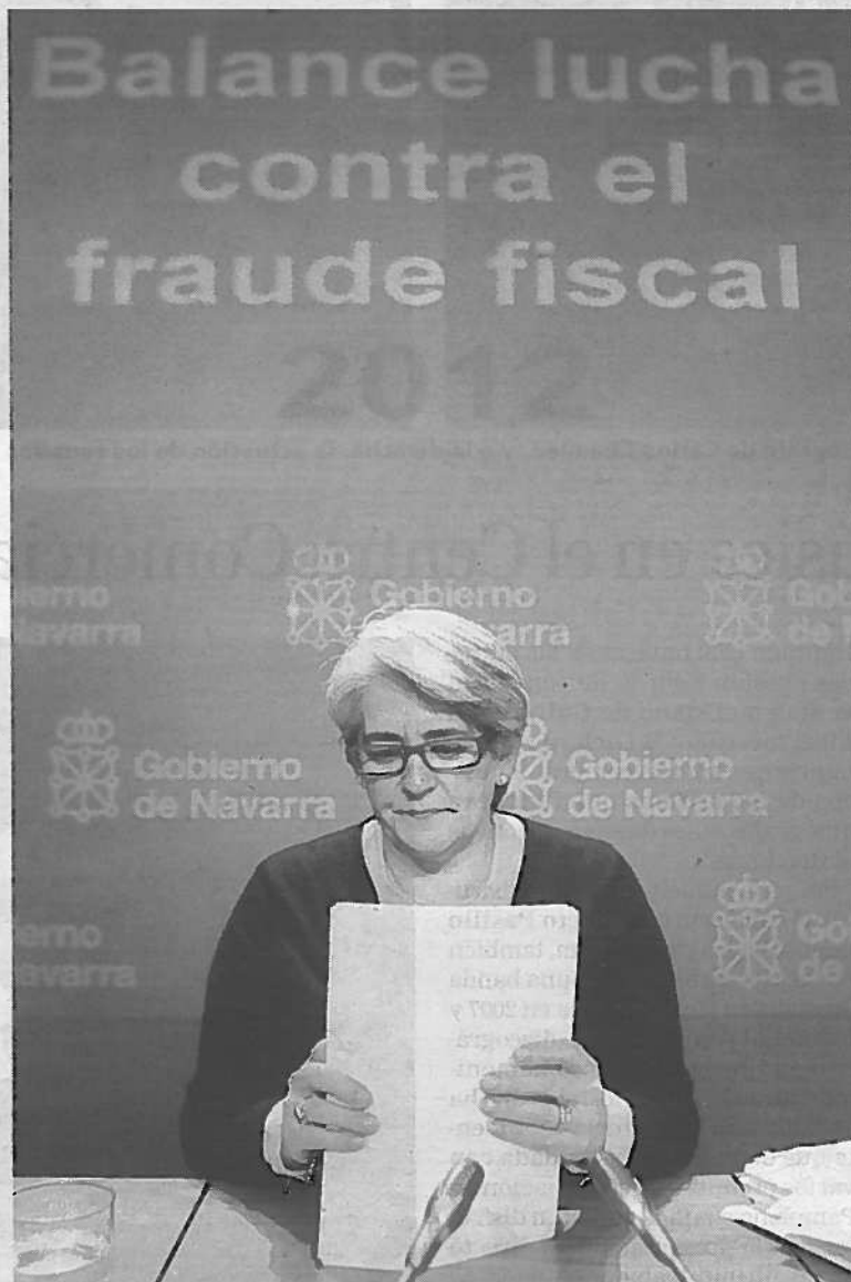
La vicepresidenta Lourdes Goicoechea.

Entre los sectores más defraudadores sobresalen la industria manufacturera, el comercio al por menor de tabaco, el comercio al por mayor de chatarra y el sector servicios. Goicoechea explicó que el incremento