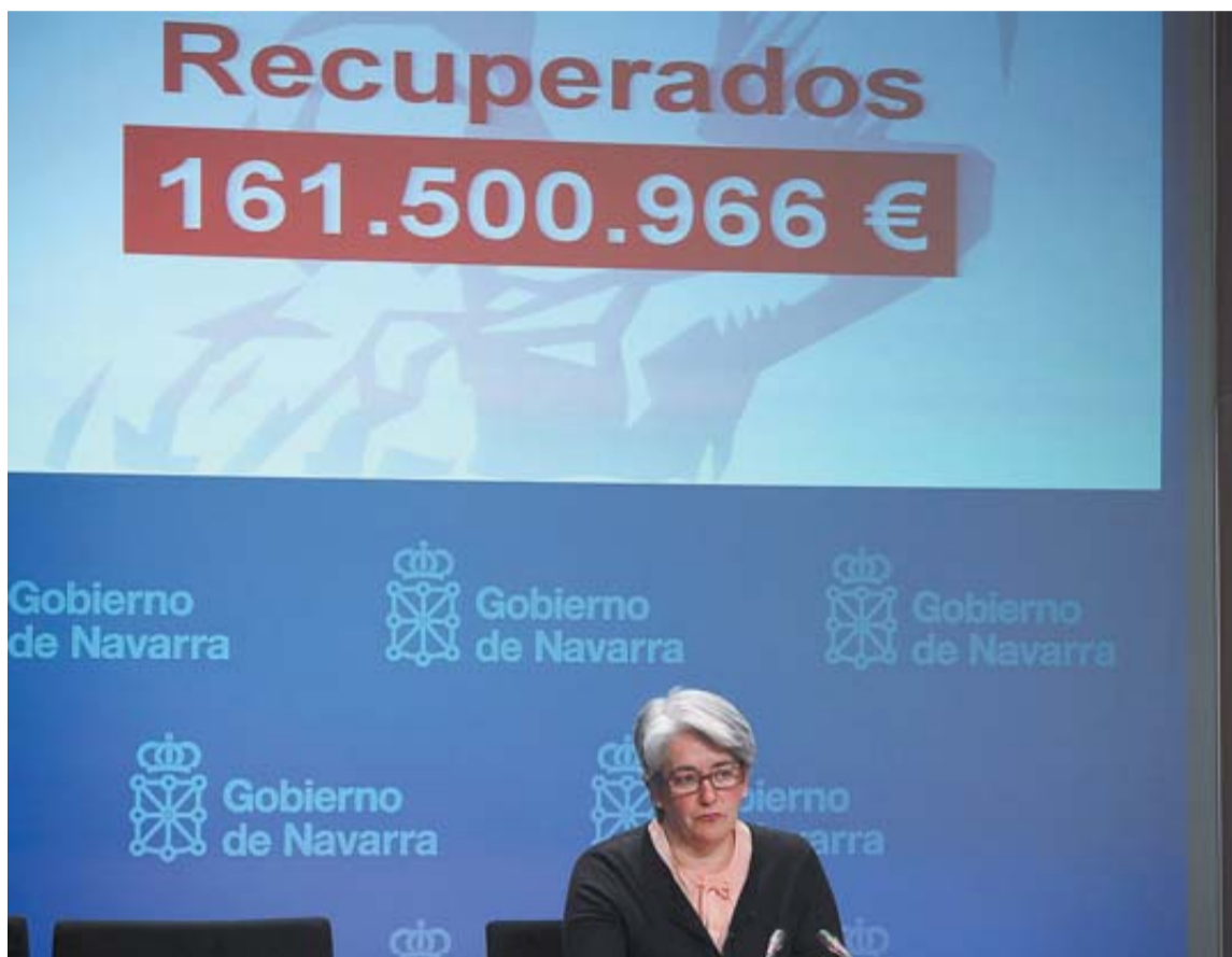
La vicepresidenta y consejera de Economía, Lourdes Goicoechea, ayer en rueda de prensa.