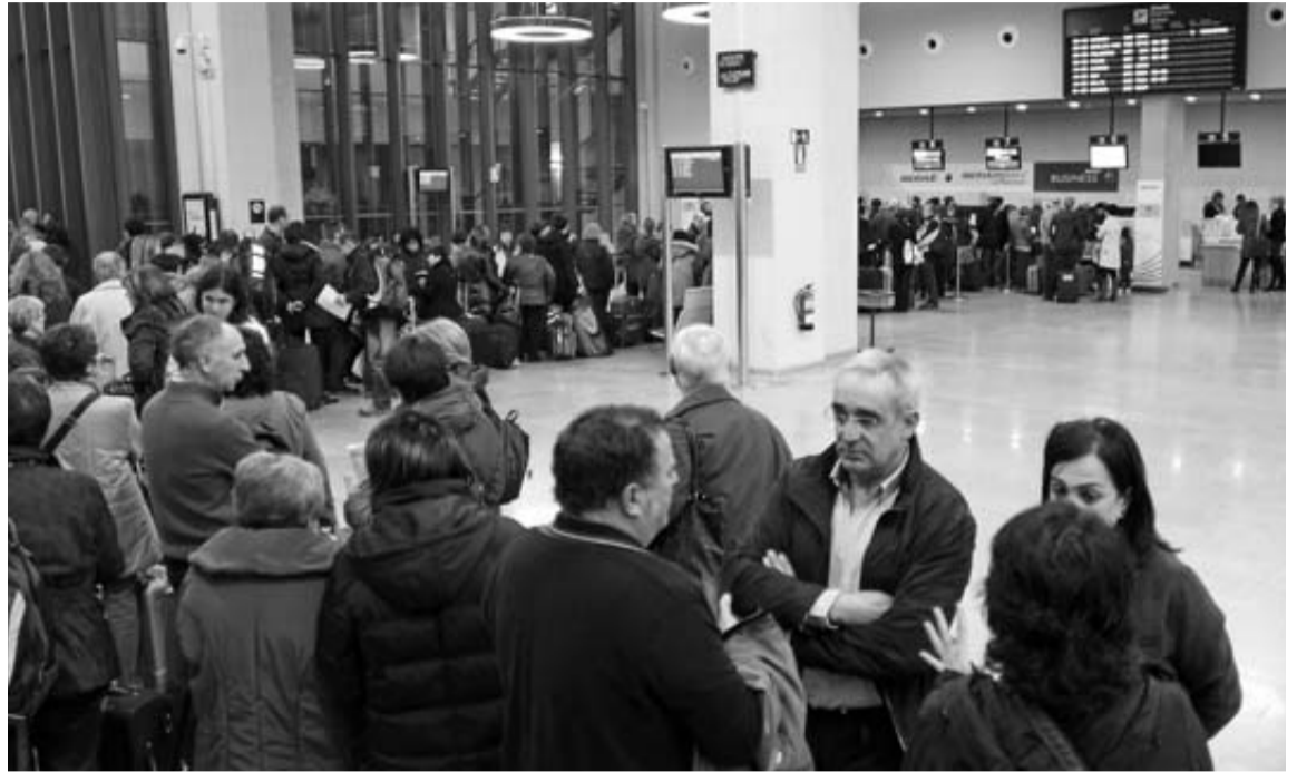
Imagen que presentaba la terminal del aeropuerto de Noáin la pasada Semana Santa.

Los 700 navarros que volarán en estos chárter deberán estar en el aeropuerto navarro hacia las seis de la mañana del jueves 28 de marzo, ya que los cuatro vuelos tiene previsto el despegue en torno a las 8.00 horas. Serán cinco días y cuatro noches para romper con la rutina, hasta el lunes día 1 cuando regresen a Pamplona a media tarde. Los precios, desde los 599 euros que cuesta el vuelo y