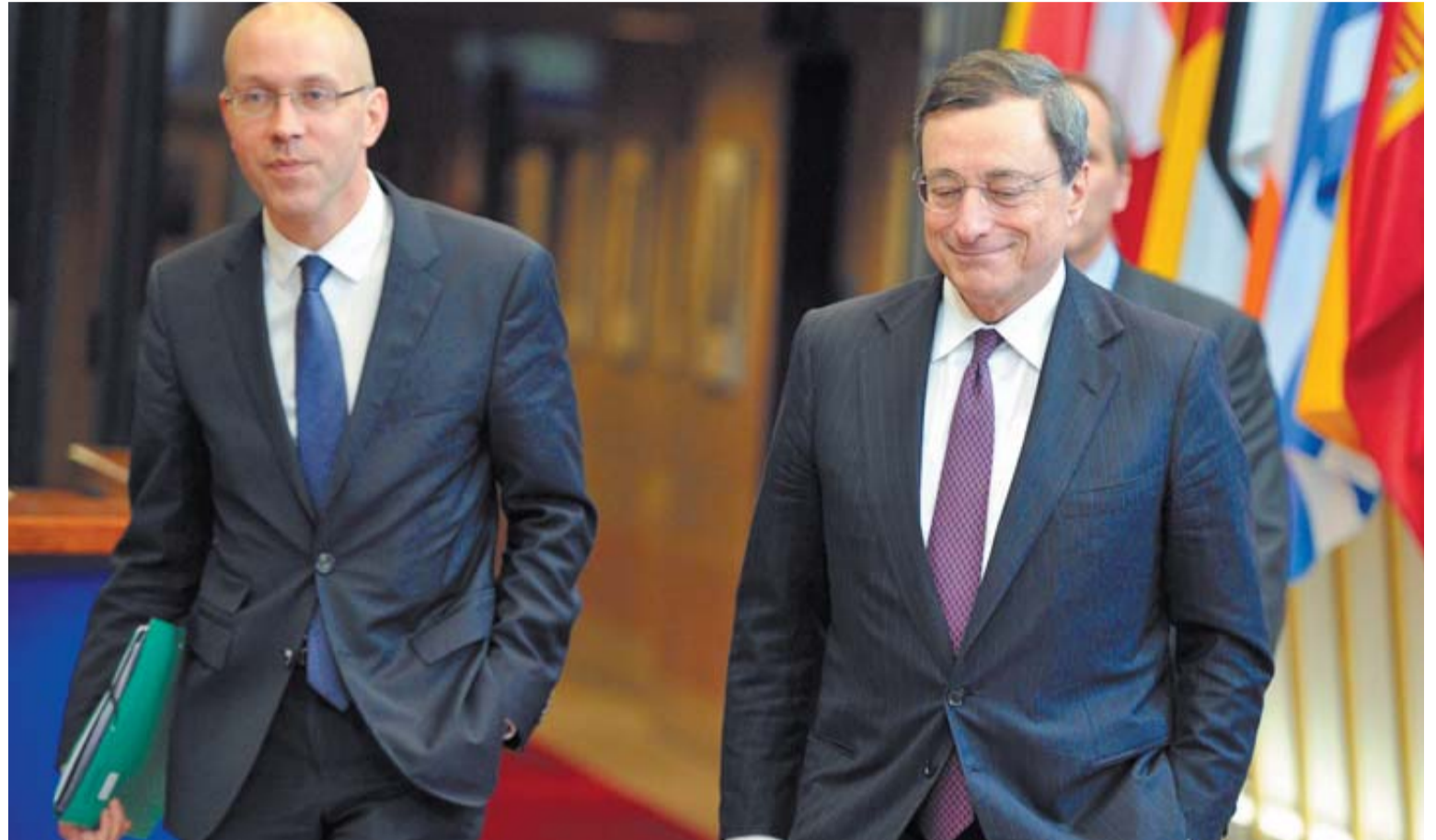
El presidente del BCE, Mario Draghi (derecha) y el miembro del consejo de la entidad Jorg Asmussen, ayer en Bruselas.

Aprovechando el desbloqueo del rescate chipriota, que rompe