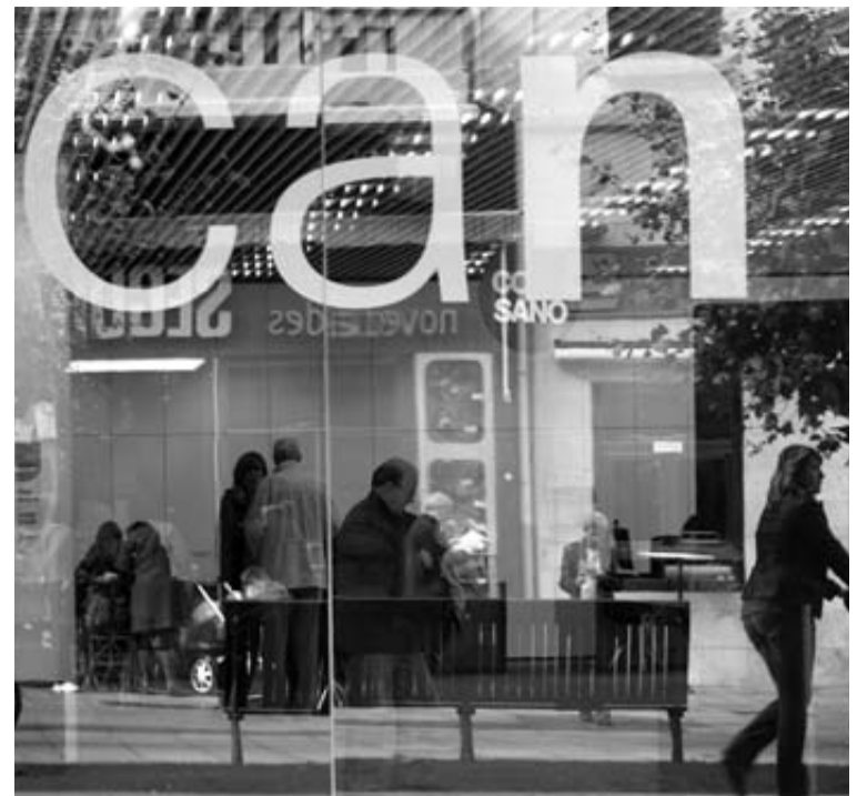
Cristalera de la sede central de Caja Navarra en Pamplona.

Por último, para esclarecer los supuestos créditos blandos denunciados por Kontuz! , la magistrada pidió el tipo de interés medio que se concedía en aquellos años. Caja Navarra responde que no dispone de esta información y que la tendrá que facilitar Caixabank.