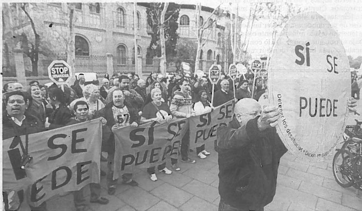
‘Escrache’ que más de 150 personas celebraron ayer en Zaragoza ante la sede del PP de Zaragoza.

Obligar a alquilar forzosamente va a llevar a pleito y la expropiación de vivienda vacía a juicio, por lo que se alarga la situación.