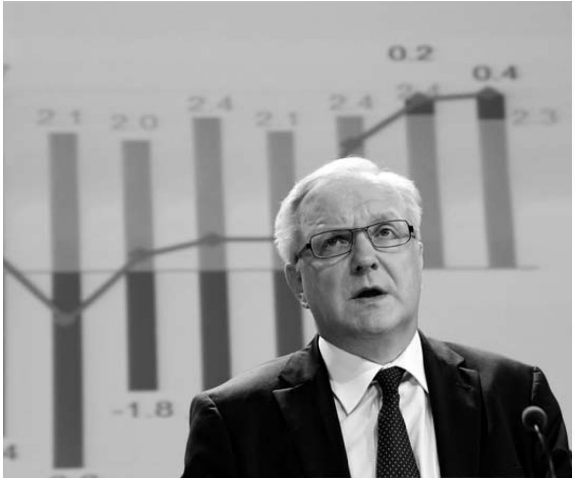
El comisario europeo de Asuntos Económicos, Olli Rehn, ayer en Bruselas.

El plan nacional de reformas Ahora, será el turno del Gobierno. Al igual que sucede con el resto de países, Rehn apuntó que las exigencias no cogerán por sorpresa a Rajoy. Desde hace meses, existe un intercambio de información que deberá plasmarse en los planes nacionales de reformas que los socios presentarán antes de final de mes. El Ejecutivo español tiene previsto detallar sus medidas el próximo día 26, una fecha que también citó el comisario. Según agregó, este nuevo paquete contemplará cambios