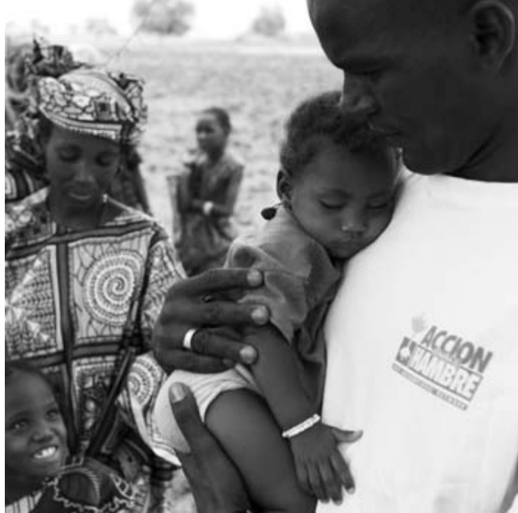
La Fundación Diario de Navarra apoyó durante el año pasado un proyecto de Acción Contra el Hambre en el Sahel africano.

Entre los primeros se pueden citar que los beneficiarios perte-