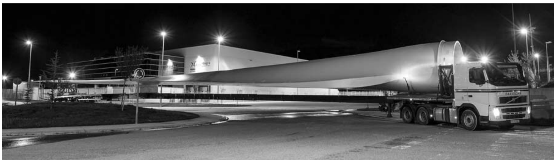
El camión que transportó la pala de 62,5 metros de longitud, aparcado junto a la sede de Gamesa en la reciente ampliación del polígono industrial de Aoiz.

Desde UGT, sindicato mayoritario en la fábrica, insistieron ayer en explicar que las peticiones de la empresa son "inasumibles". Es más, alertan de que "la dinámica de negociación" que está llevando la empresa "es peligrosa y perjudicial" para la consecución de un acuerdo. Por su parte, desde LAB, insistieron en empezar a negociar ya un marco de prejubilaciones "a medio y largo plazo". CC OO insistió también en reclamar subidas del IPC en tablas.