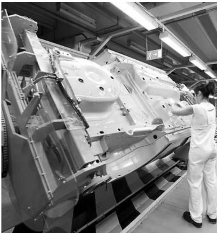
Una operaria trabaja en la línea de montaje de VW-Navarra.

En materia retributiva, la empresa insiste en plantear la congelación de tablas salariales e invitó ayer a los sindicatos a que vayan "pensando" en plantear subidas "en conceptos variables" del salario, como la paga por objetivos (colectiva) o la de rendimiento in-