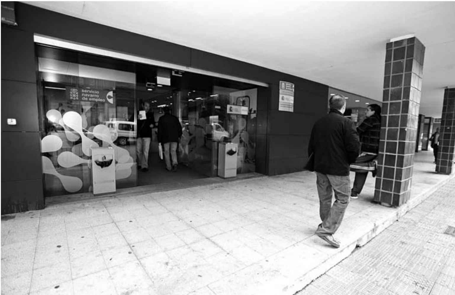
Varias personas, en una oficina del Servicio Navarro de Empleo situada en Tudela.