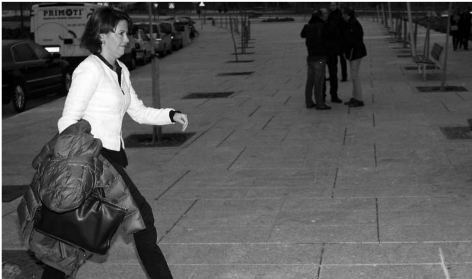
Yolanda Barcina, presidenta del Gobierno de Navarra, caminando por Pamplona.