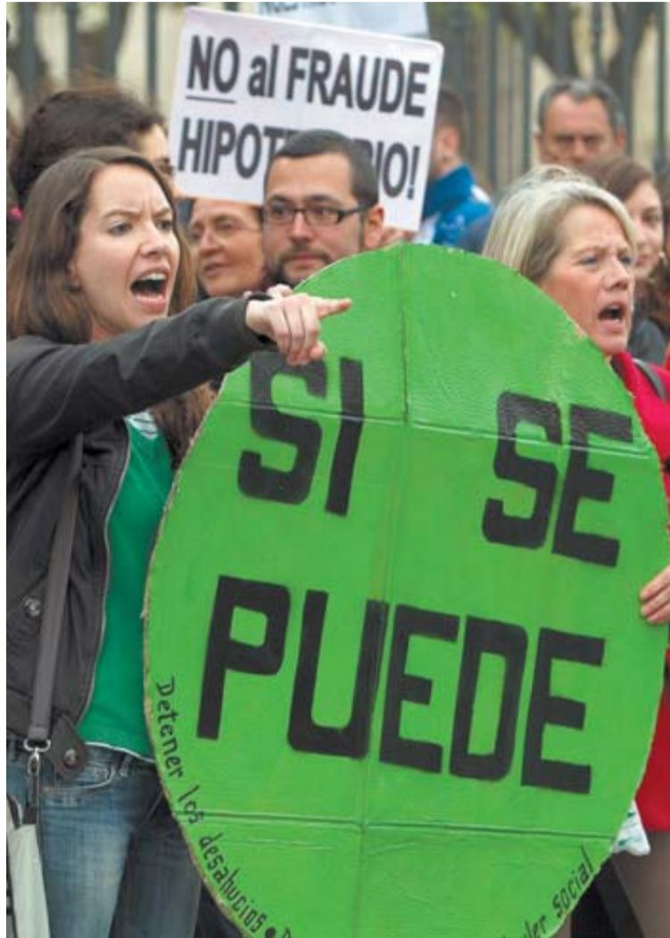
Protesta en Sevilla el martes ante la sede del PP andaluz.

Horas después el ministro Jorge Fernández Díaz se vio obligado a salir al paso en los pasillos del Congreso ante las preguntas de los periodistas. Fernández Díaz dejó claro que el departamento que dirige no permitirá ningún tipo de acoso, aunque también negó, "tajantemente", que se haya ordenado a la Policía que impida estas manifestaciones a una