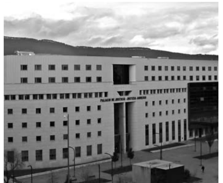
El servicio de atención a la mujer realizó 1.632 intervenciones. CORDOVILLA

Por su parte, grupos de la oposición como el PP o I-E reclamaron que el convenio que se firma para prestar el servicio sea plurianual, como aconsejó la parlamentaria popular Amaya Zarranz. Insistió en la idea José Miguel Nuin (I-E), que destacó además el compromiso personal que adquieren los profesionales que prestan el servicio.