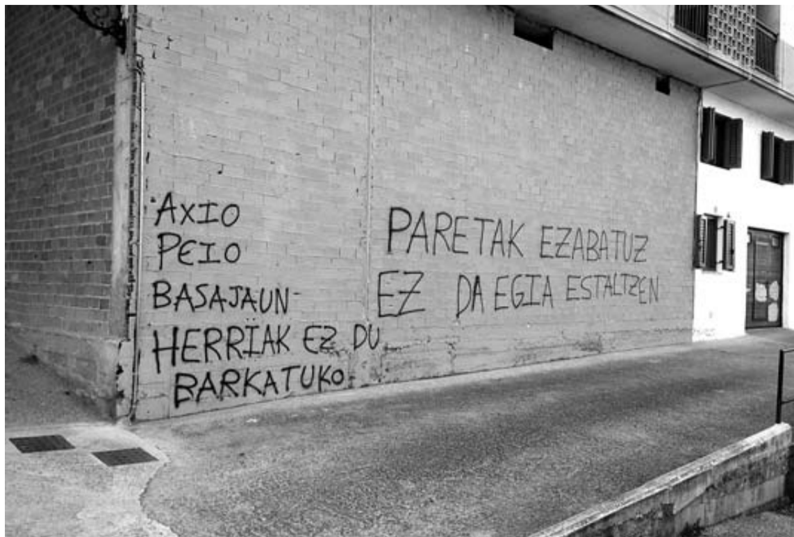
La pared con la nueva pintada, que recuerda a tres antiguos activistas de ETA con el lema en su base de 'El pueblo no perdonará' y la inscripción 'Borrando las paredes no se tapa la verdad'.

Sus cálculos apuntaban a un gasto de mil euros por borrar una decena de pintadas en paredes de Etxarri Aranatz y Arbizu. La idea barajada era retrasar esta cuantía de las transferencias del