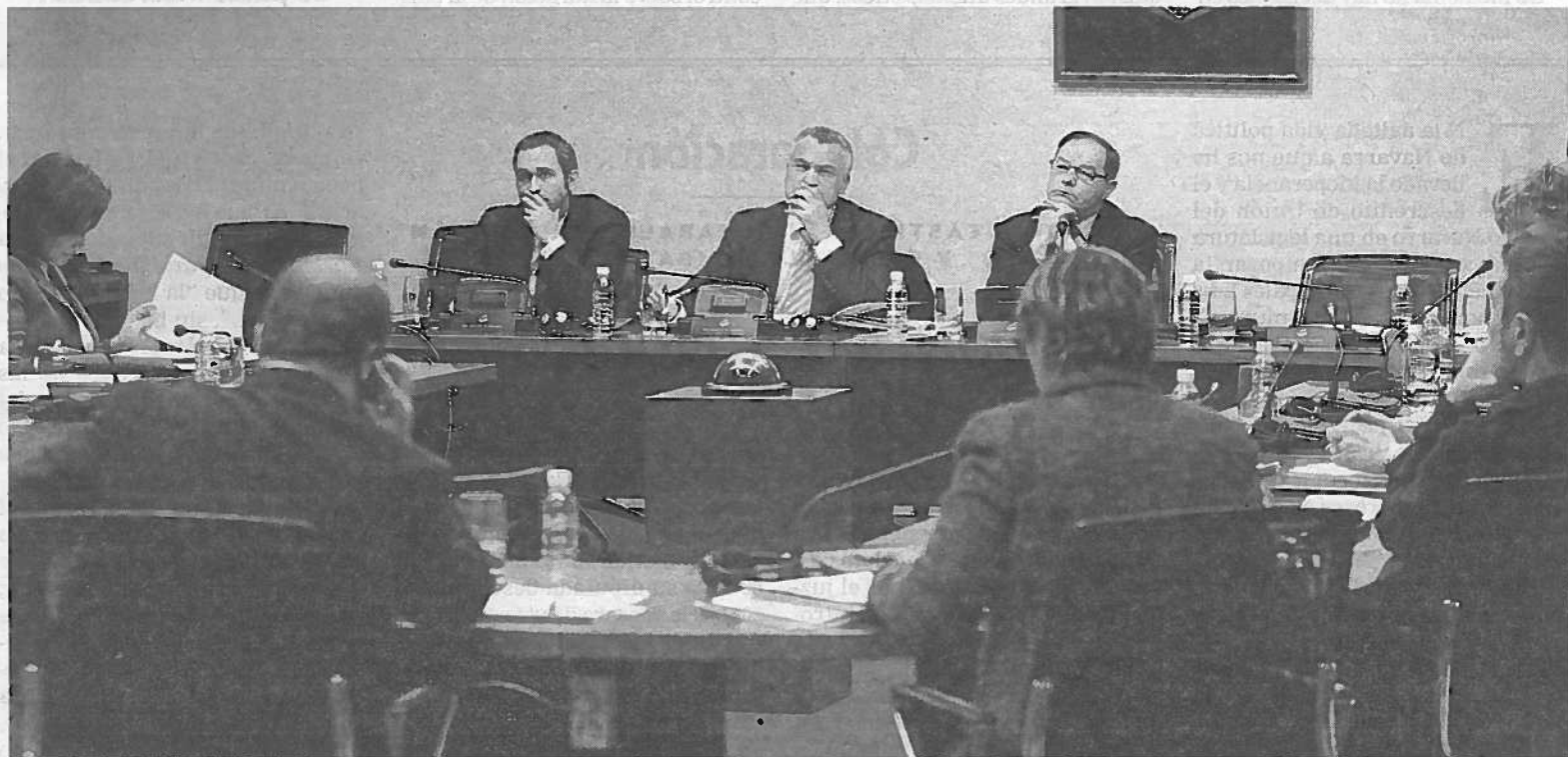
El Defensor del Pueblo, Javier Enériz, compareció ayer ante los grupos parlamentarios a petición de I-E para hablar del Real Decreto.

tración arbitre préstamos a "tipos de interés cero" o convenios con bancos para establecer, en determinados supuestos, que esa deuda "no determine la expulsión sino la reestructuración y que el Gobierno cubra con avales estas situaciones". Otra pata pasa por fomentar la política de alquiler social y poner a disposición de los afectados las viviendas de la administración, la banca, y aquellas en las que se "intermedie" con particulares mediante incentivos fiscales. En relación al decreto de Andalucía que contempla la expropiación temporal de viviendas de bancos procedentes de desahucios, considera que es una decisión "legítima que los poderes públicos pueden adoptar tranquilamente". Preciso que "este no es el camino a seguir" potenciando otras vías de mediación.