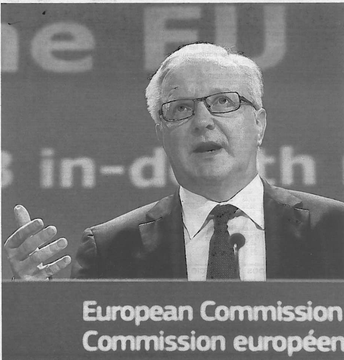
El comisario de Asuntos Económicos y Financieros de la UE, Olli Rehn. FOTO: EFE

"Esta es la dirección correcta", dijo Rehn, quien ve el análisis de la CE como un "toque de atención" para que los países con mayores desequilibrios despierten y "tomen medidas" para restaurar la competitividad y crear el fundamento para un crecer y crear empleo. >EFE