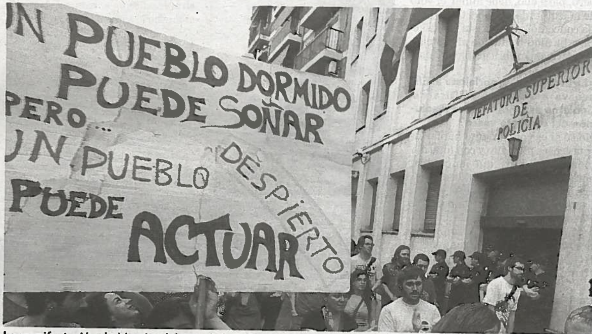
La manifestación de Murcia, delante de la Jefatura de Policía.

ha manifestado porque los ciudadanos "están perdiendo todos los derechos que tenían".