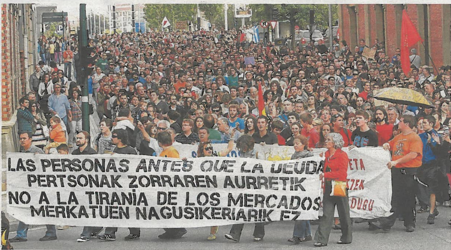
Las críticas a políticos y banqueros llenaron el centro de Pamplona en el primer aniversario del movimiento 15-M.

PSOE en Madrid y solo dos días después de presentar la aplicación del tijejetazo popular pactada con su socia de Gabinete, Yolanda Barcina, por valor de 53,9 millones. PÁGINA 9