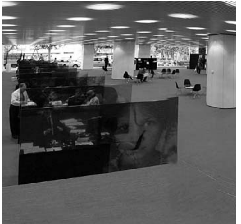
Oficinas de Banca Cívica en la sede central de Pamplona.

CaixaBank calculó ayer en 2.102 millones de euros (1.471 millones después de impuestos) el importe de sus provisiones para sus activos inmobiliarios.