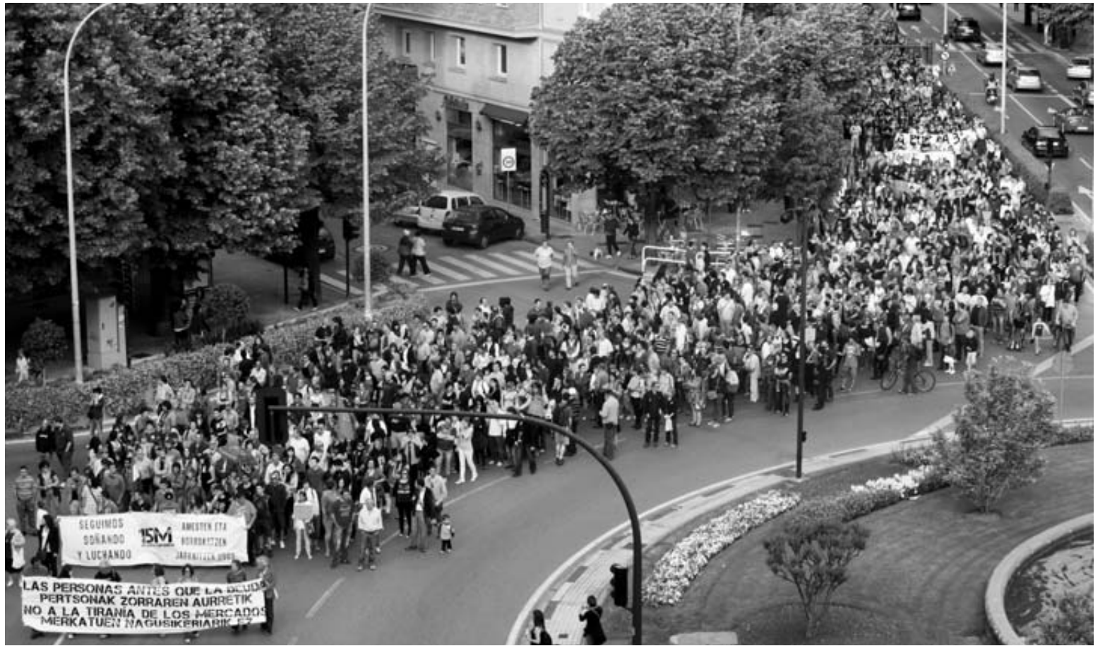
Dos pancartas encabezaban la manifestación por el centro de Pamplona.

ALUMNOS matriculados supera 2º de Bachillerato.