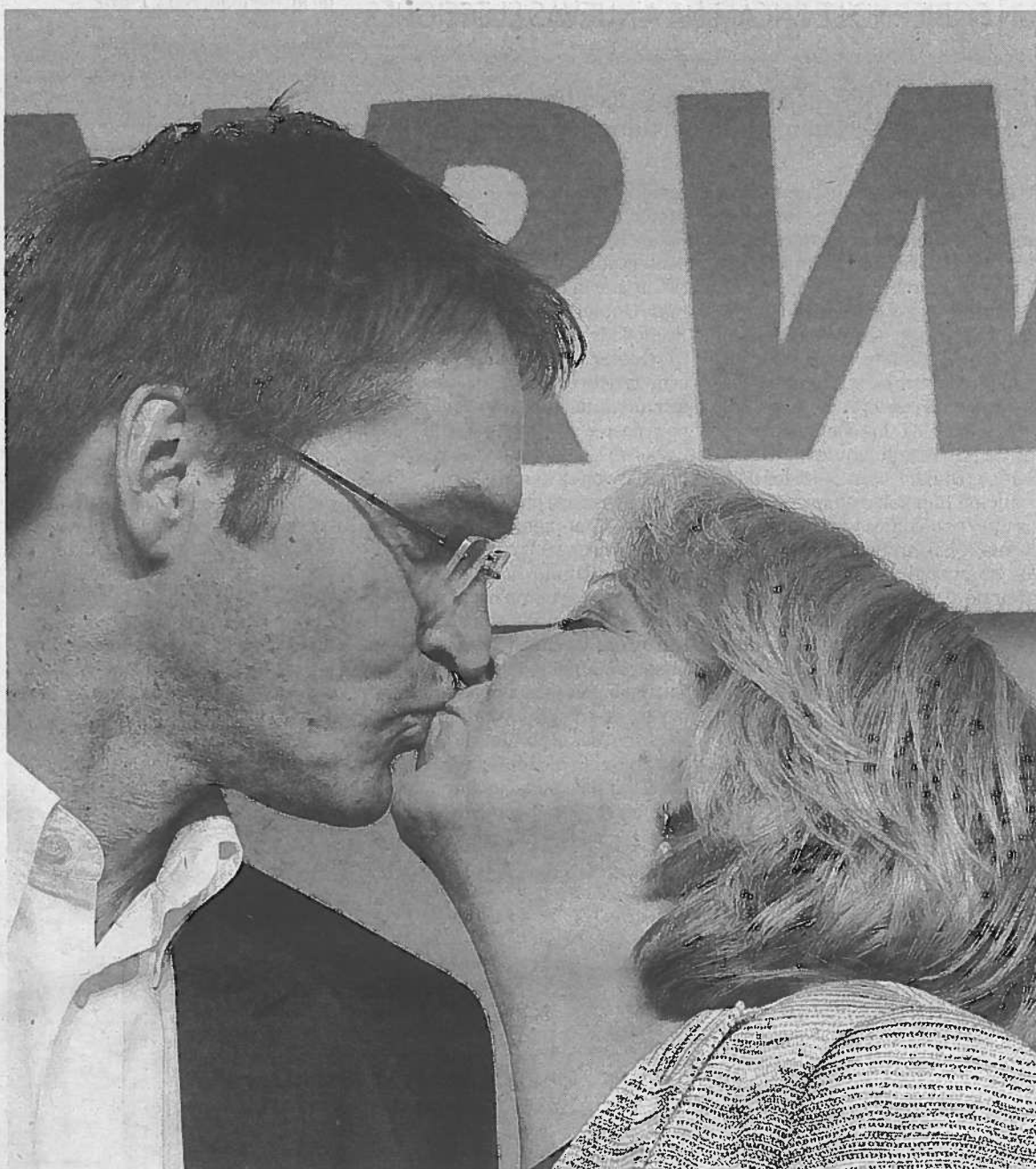
La líder regional del Partido Socialdemócrata (SPD) Hannelore Kraft besa a su marido Udo.

MAYORÍA AMENAZADA Su alianza con los liberales agoniza también a nivel nacional, ya que todos los sondeos indican unánimemente que, aunque la Unión de Merkel ganaría los comicios federales, sus actuales socios no aportarían votos ni escaños suficientes para un gobierno de mayoría. Tras la gran coalición con los socialdemócratas de su primera legislatura y su alianza con los liberales en esta segunda, Merkel se