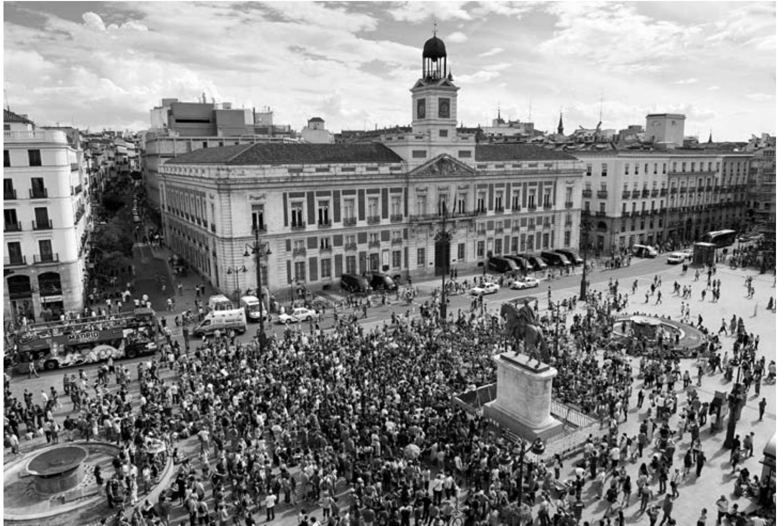
Fotografía de la concentración de los 'indignados' en la Puerta del Sol de Madrid, a las 18.12 horas de ayer.

Algunos de los indignados difundieron a través de las redes sociales la intención de volver a reu-