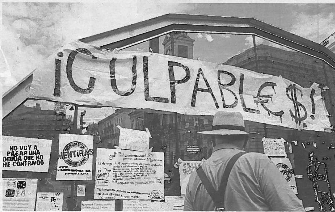
Carteles del 15-M en la marquesina del Metro de la céntrica plaza madrileña.

Una de las principales reivindicaciones fue la petición de libertad para los 18 detenidos que se resistieron a desalojar la plaza a las 04.00 horas de la madrugada de