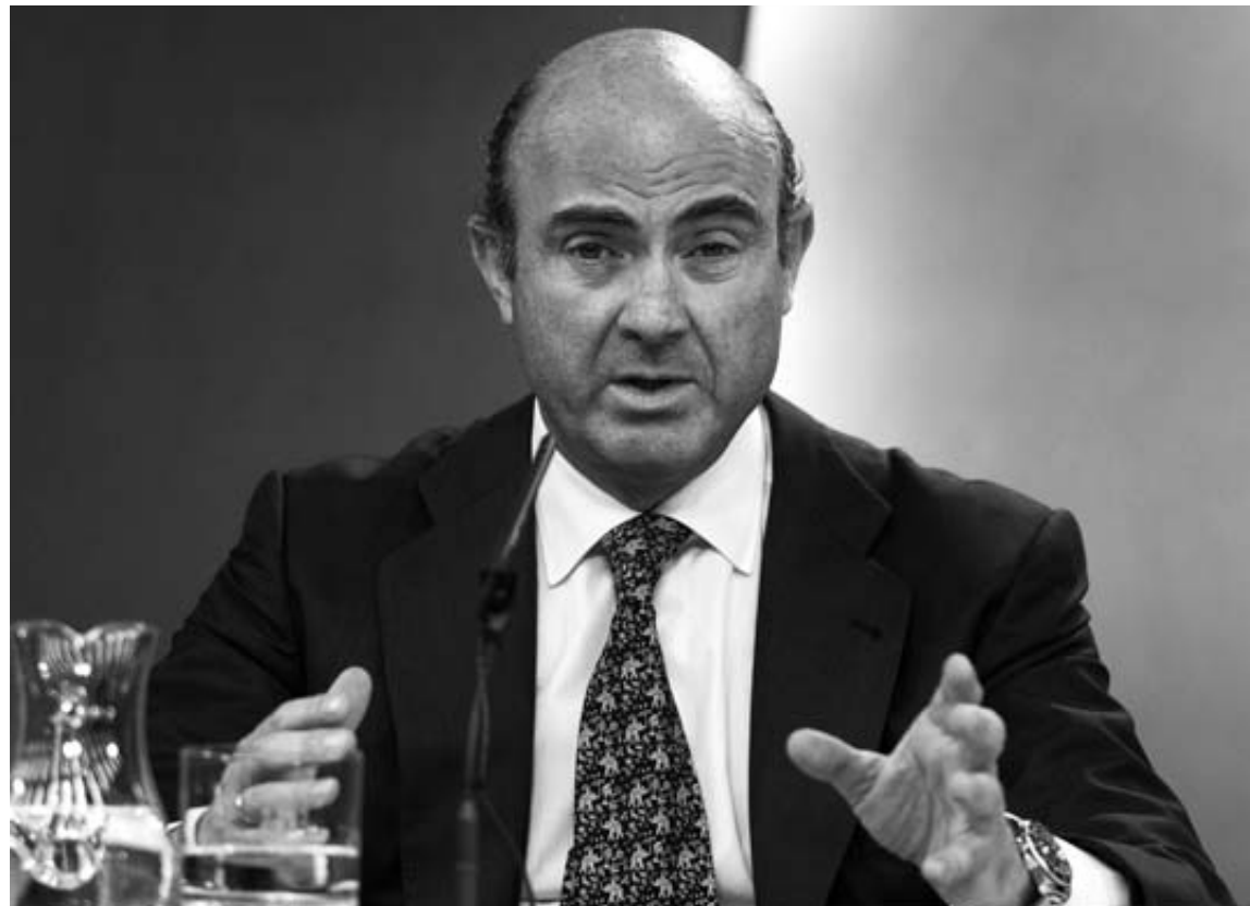
El ministro de Economía, Luis de Guindos, durante la rueda de prensa del viernes en La Moncloa.

Bancos y cajas deberán informar antes de que mañana abran los mercados del impacto que les suponen las nuevas provisiones.