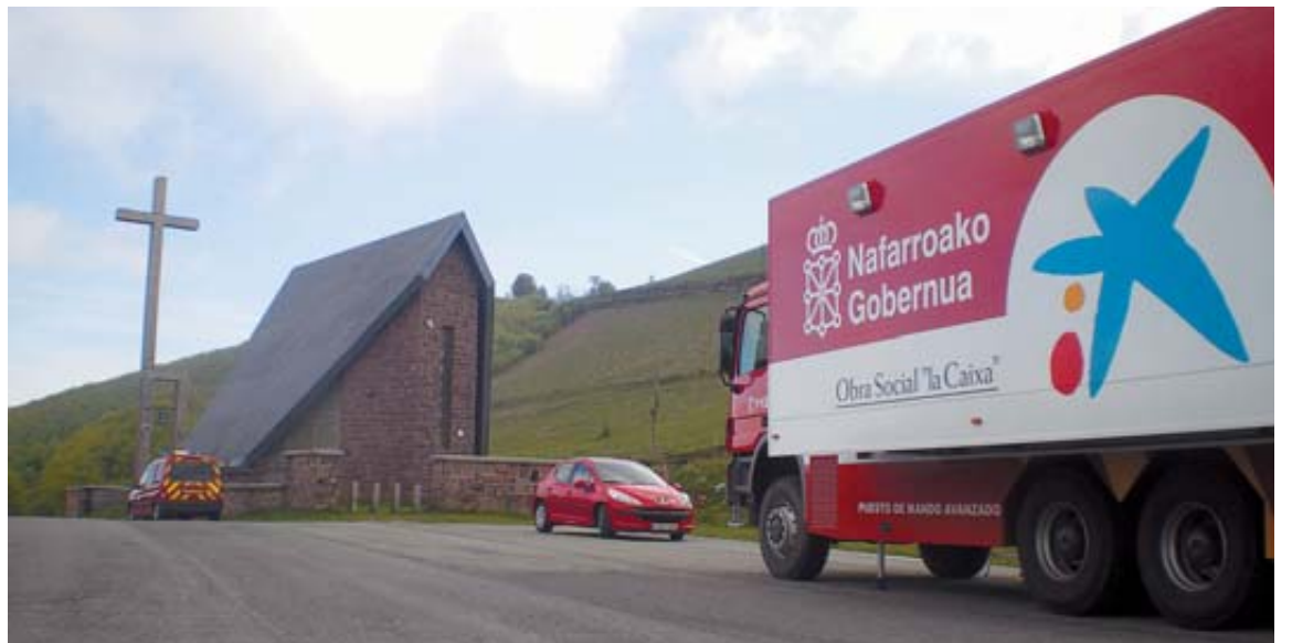
Imagen del dispositivo de emergencias localizado ayer en Ibañeta.

La ANE movilizó a efectivos de bomberos de Burguete, a bomberos voluntarios de Valcarlos, al grupo voluntario del perro de salvamento, una patrulla de Medio Ambiente de la Policía Foral, un helicóptero del Gobierno de Navarra y a efectivos de la Guardia Civil. Asimismo, colaboraron efectivos franceses por ser una zona colindante con el país galo.