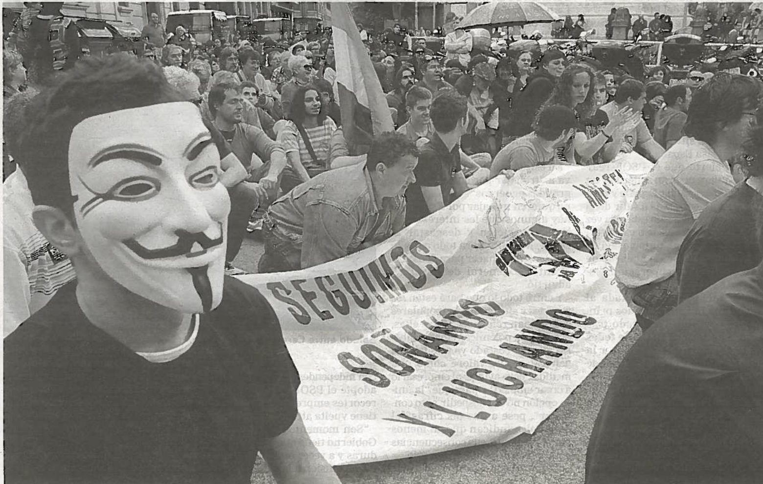
La marcha que recorrió Pamplona se detuvo en varias ocasiones organizando sentadas bajo gritos de 'No nos moverán'.