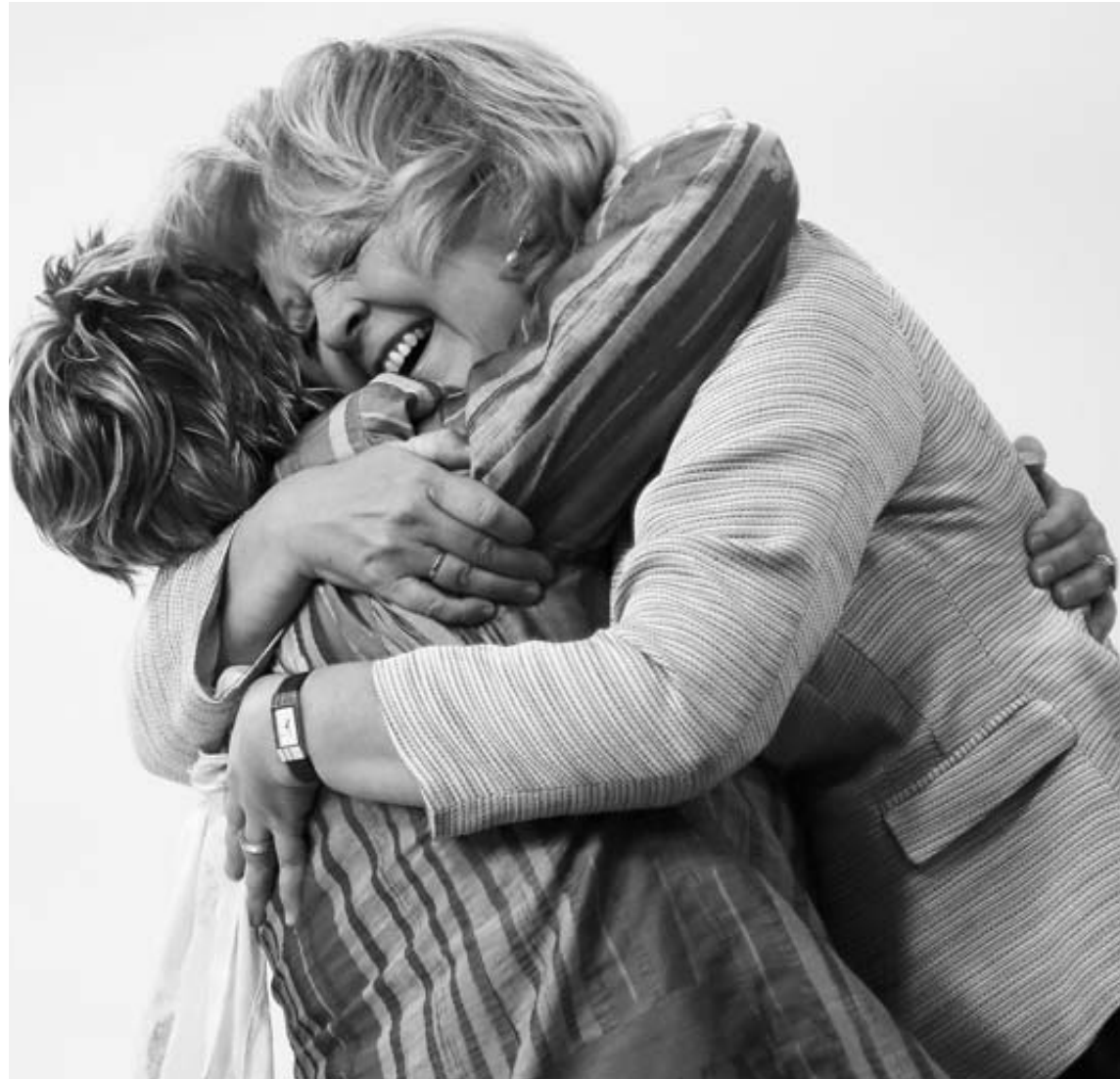
La candidata del SPD, Hannelore Kraft -dcha.- se abraza con la líder de Los Verdes, Sylvia Löhrmann.

De esta manera, la alianza roji-verde que ya regía los destinos de Renania del Norte, pero en minoría, logró el objetivo que se había fijado en esta campaña electoral: evitar los problemas derivados