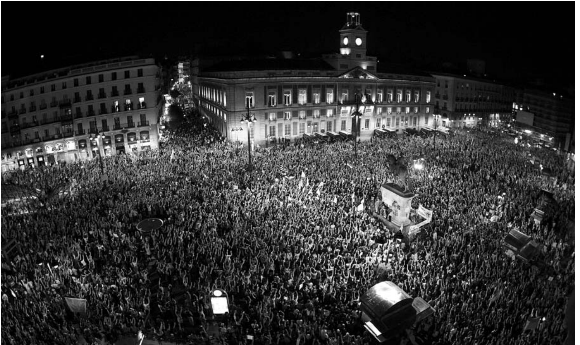
DOS HORAS DESPUÉS DEL LÍMITE HORARIO. Aspecto que presentaba la Puerta del Sol a las doce de la noche, dos horas después del límite establecido.