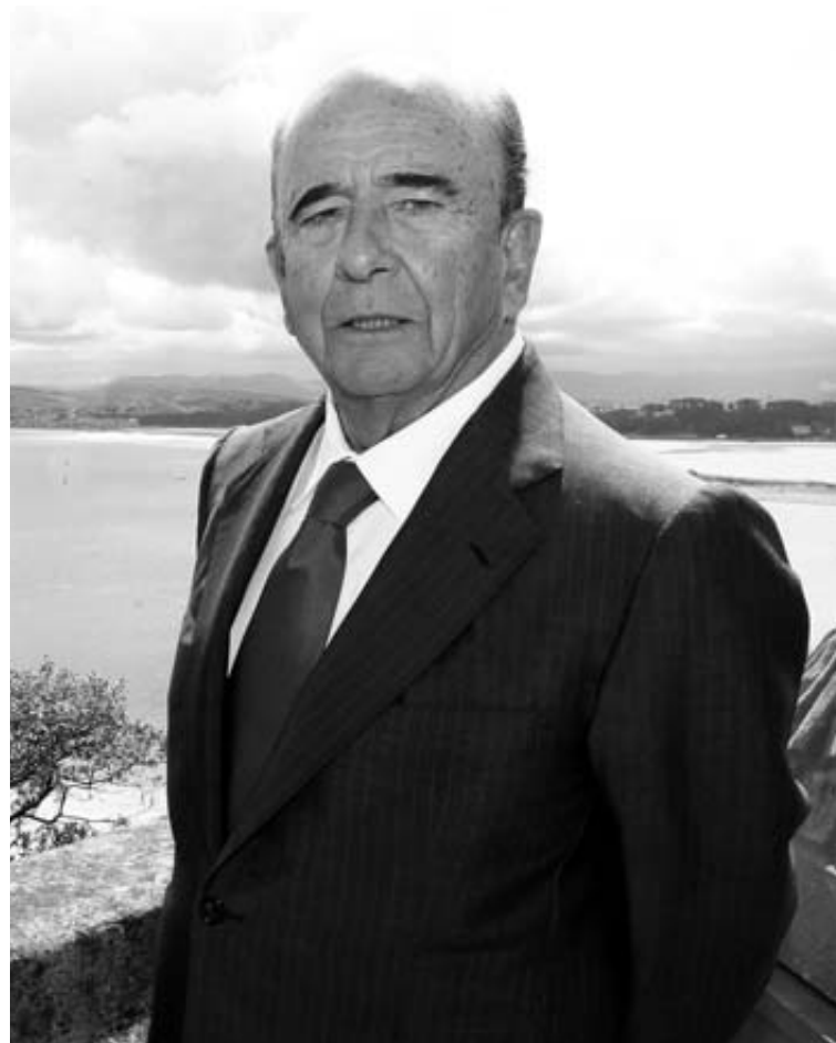
El presidente del banco Santander, Emilio Botín.

Banesto indicó que, pese a esta aportación adicional, tiene pre-