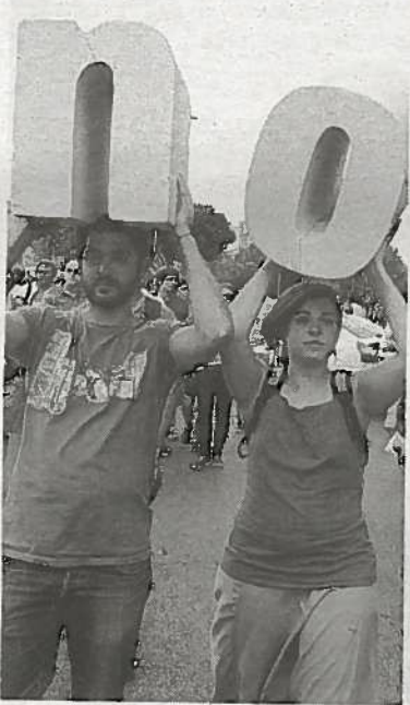
Contra la reforma laboral.