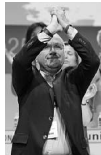
Josep Antoni Duran i Lleida.

Por su parte, Liberbank estimó en 496 millones el impacto que tendrán en su patrimonio neto las provisiones adicionales.