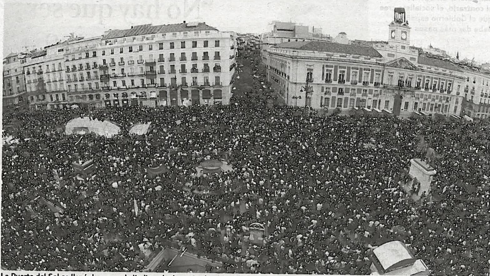
La Puerta del Sol se llenó de nuevo de 'indignados' un año después del inicio de la protesta.

Paco, que se ha unido en Atocha a una de las marchas, indicó que se