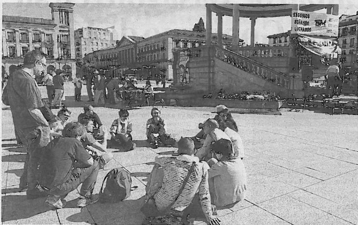
El movimiento celebró una nueva jornada con conciertos y debates sobre la crisis.