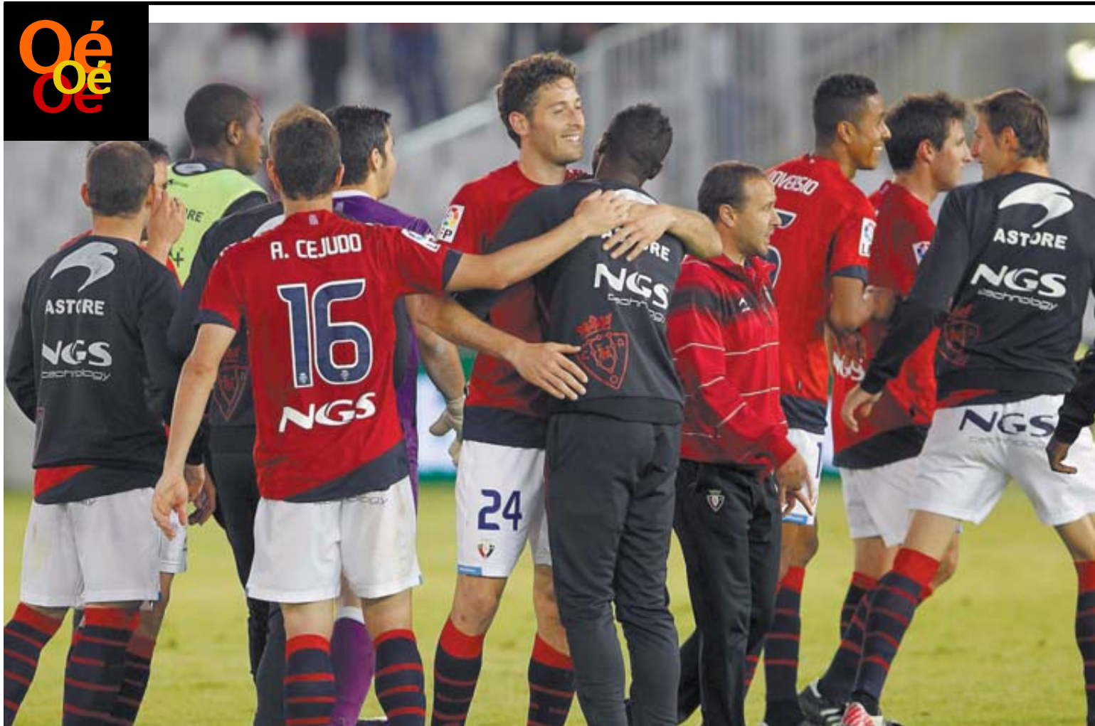
Saludos entre los jugadores al final del partido. Se han cumplido los deberes, pese a no alcanzar el objetivo europeo.