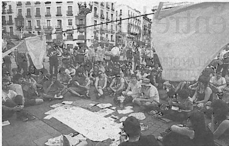
Una de las asambleas celebradas en una zona de la Puerta del Sol.

Allí, corearon durante más de media hora consignas como "La voz del pueblo no es ilegal", "No estamos todos, faltan dieciocho" y "Lo llaman democracia y no lo es". A gritos a través de un pequeño megáfono, dos de los organizadores denunciaron la "brutalidad y desproporción" con la que la Policía desalojó la plaza, en una ope-