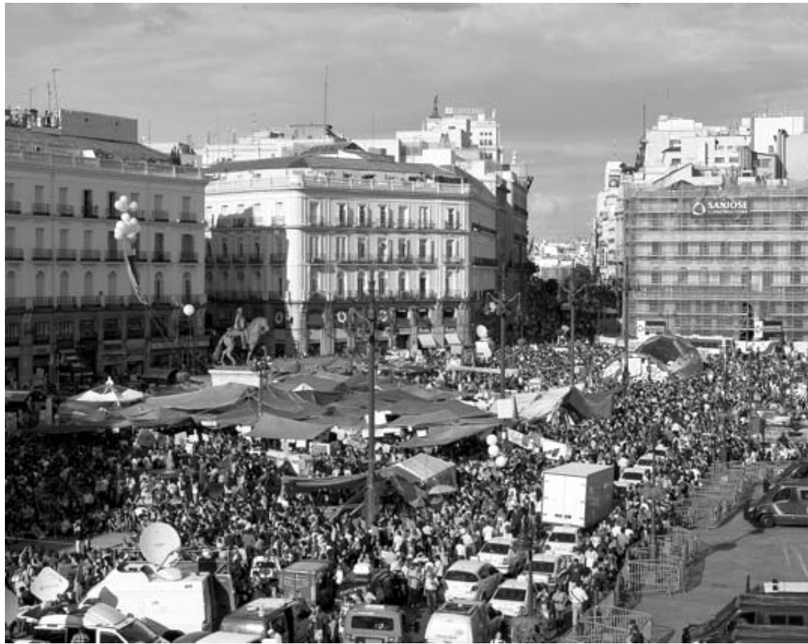
Una vista general de la Puerta del Sol el día 20 de mayo del pasado año.