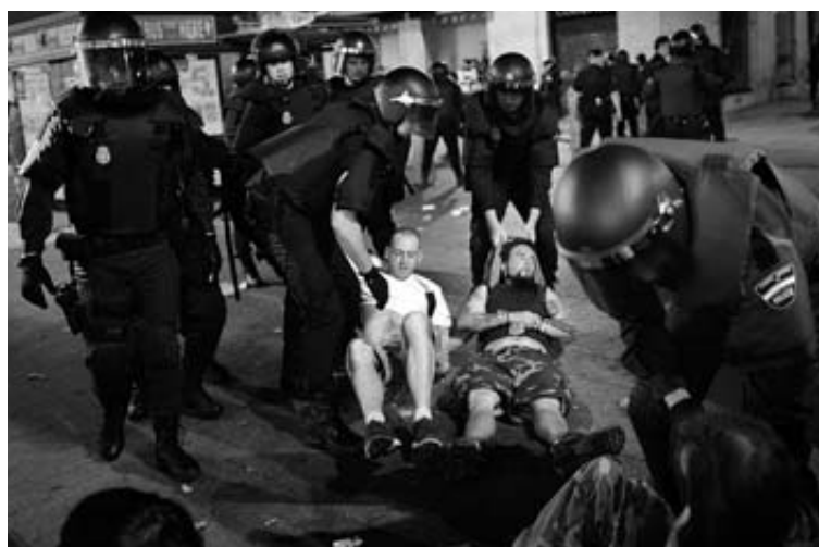
Desalojo de manifestantes en la madrugada de ayer.