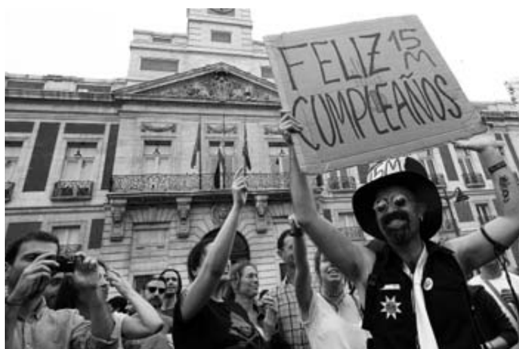
Celebrando el primer aniversario del Movimiento 15-M.

Una vez que las cuatro marchas confluyeron en la Puerta del Sol para celebrar el primer ani-