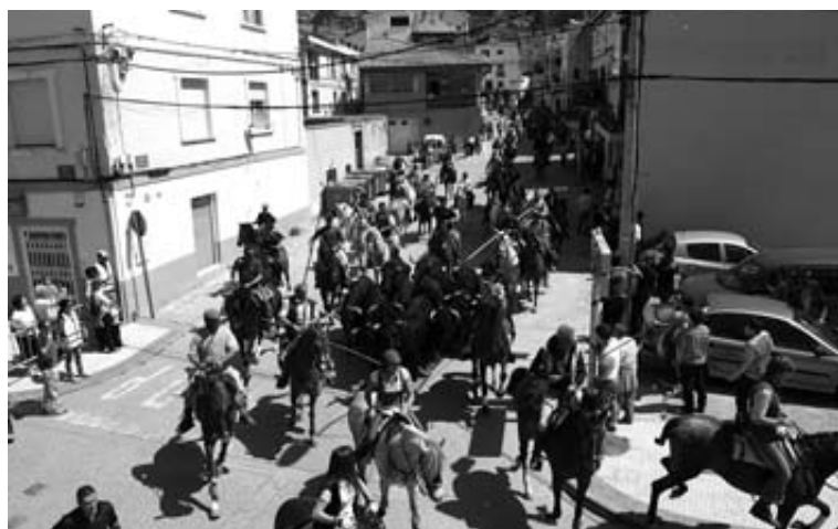
Los jinetes guían a las reses por las calles de Arguedas. RAMÓN DOMÍNGUEZ