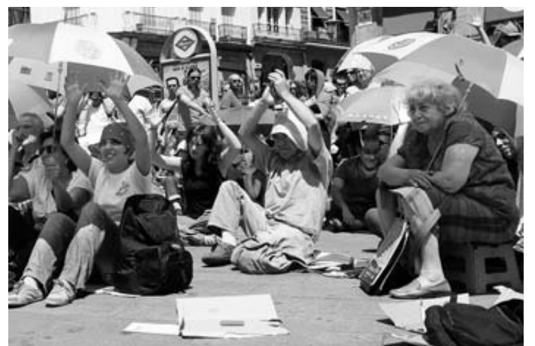
Con sombrillas, ayer por la mañana en la plaza.