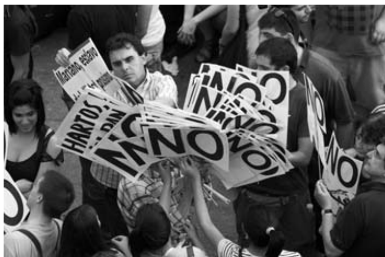
Jóvenes con carteles de crítica a los recortes, en la Puerta del Sol.