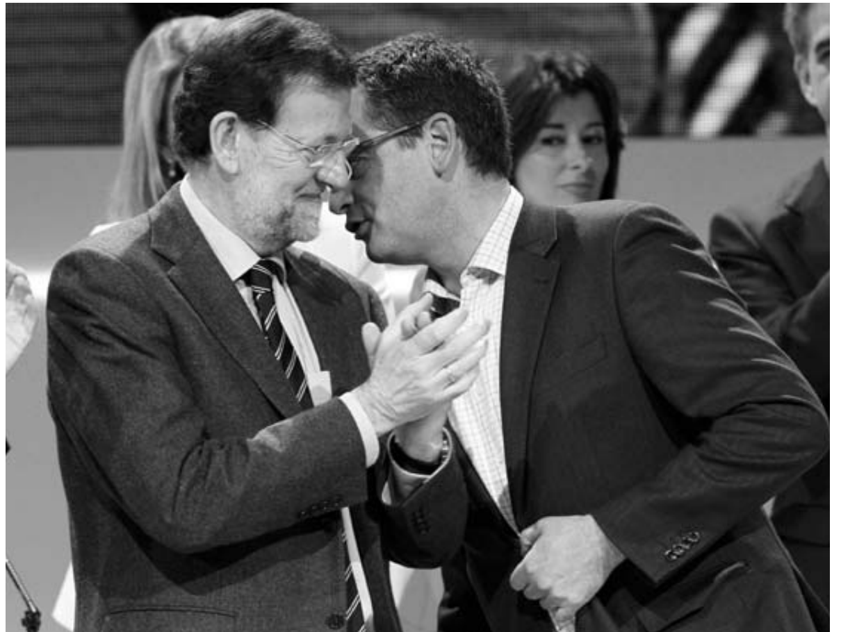
Palabras al oído de Antonio Basagoiti a Mariano Rajoy, que aplaude al reelegido líder del PP vasco.

Desde Asturias, Francisco Álvarez Cascos aseguró que el plan presentado colocará el déficit en diciembre en el 0,99%, y atribuye a Hacienda una intención partidista.