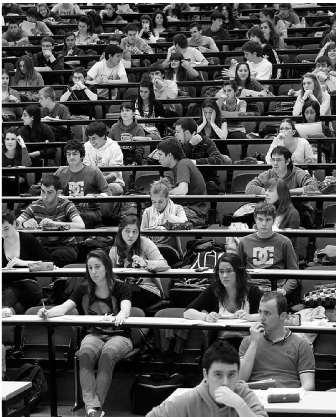
Alumnos a la espera de comenzar el examen de Selectividad, en una imagen de archivo.