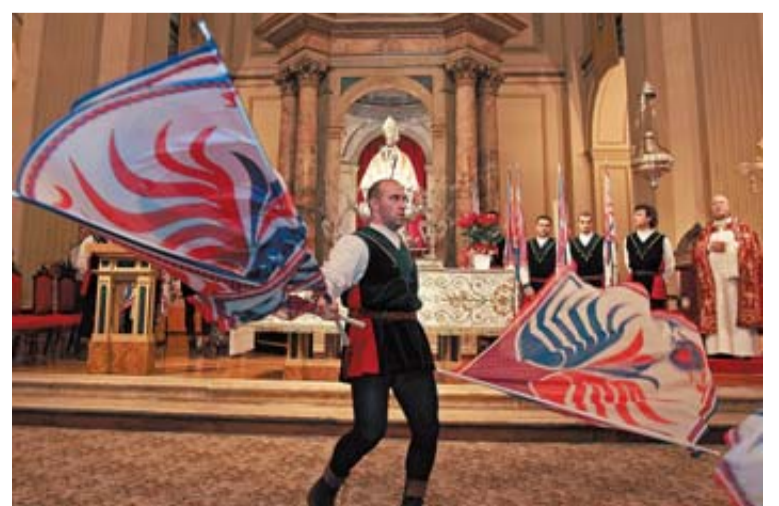
Los abanderados reales homenajearon ayer a San Fermín.