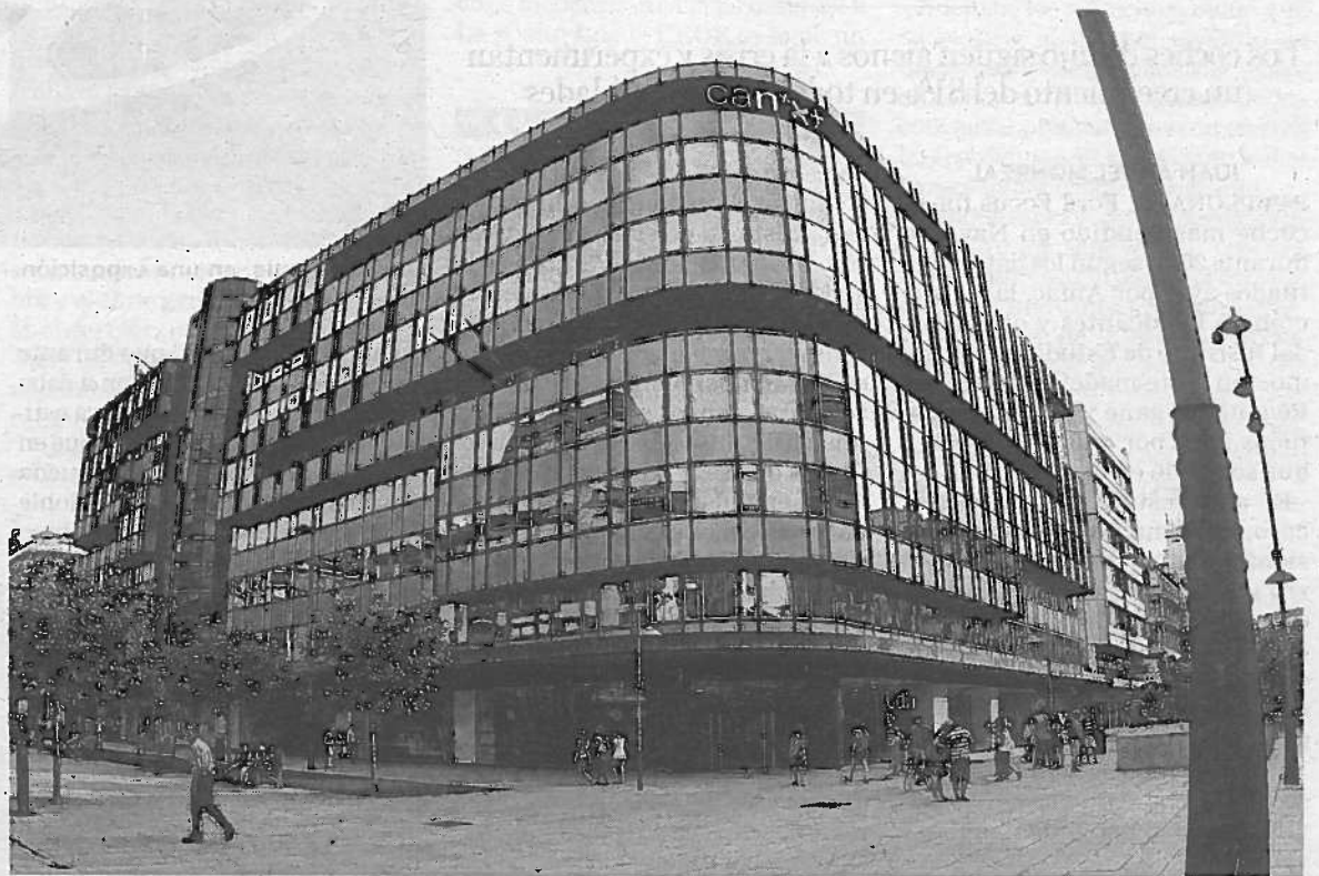
Sede central de Caja Navarra en Pamplona.

MÁS AVALES La medida es una de las primeras que toma el Ministerio de Economía, dirigido ahora por Luis de Guindos, en relación a la reestructuración del sector financiero. De Guindos, ex de Lehmann Brothers en España, mantiene excelentes relaciones con buena parte del sector financiero español. Hasta hace unos días, por ejemplo, era consejero del Banco Mare Nostrum y fue secretario de Estado de Economía con Rodrigo Rato, hoy presidente de Bankia. Asimismo, ha acudido a alguno de los Savialogos orga-