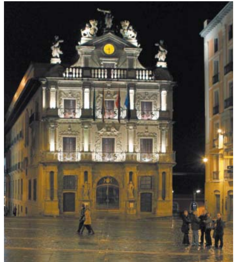
Fachada del Ayuntamiento de Pamplona.

En concreto, se determinaba que las entidades locales que tuvieran obras acogidas en los planes de infraestructuras 2005-2008 y 2009-2012 subvencionadas por el Gobierno foral, podrían concertar créditos para financiar el porcentaje de aportación que les correspondiera (sobre un 30%