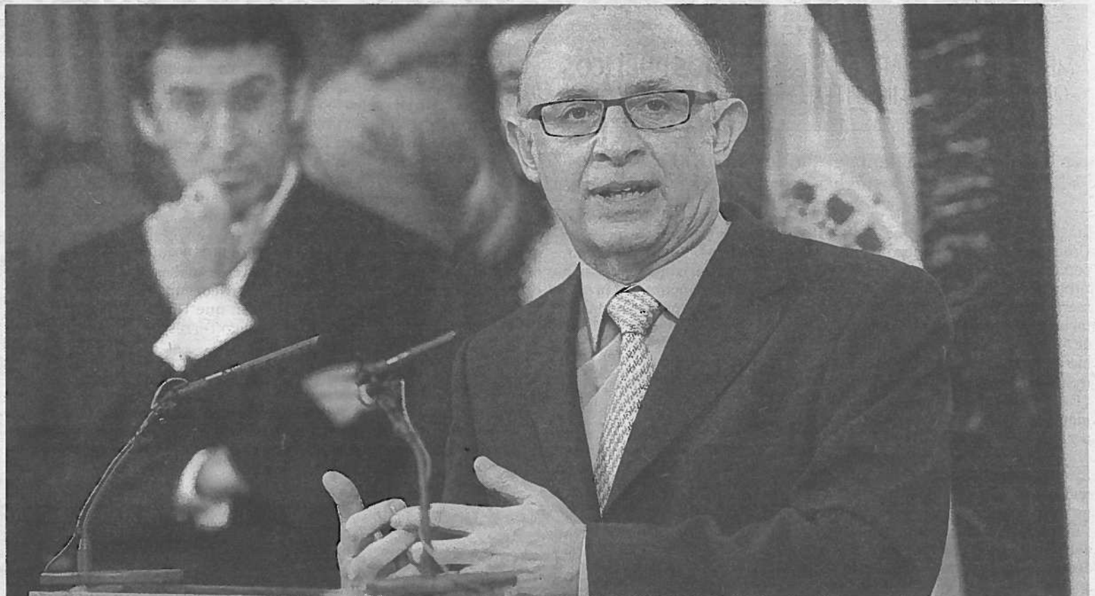
Cristóbal Montoro, en la toma de posesión de los secretarios de Estado de su Ministerio.

En su opinión, es necesario un funcionariado eficiente que a tra-