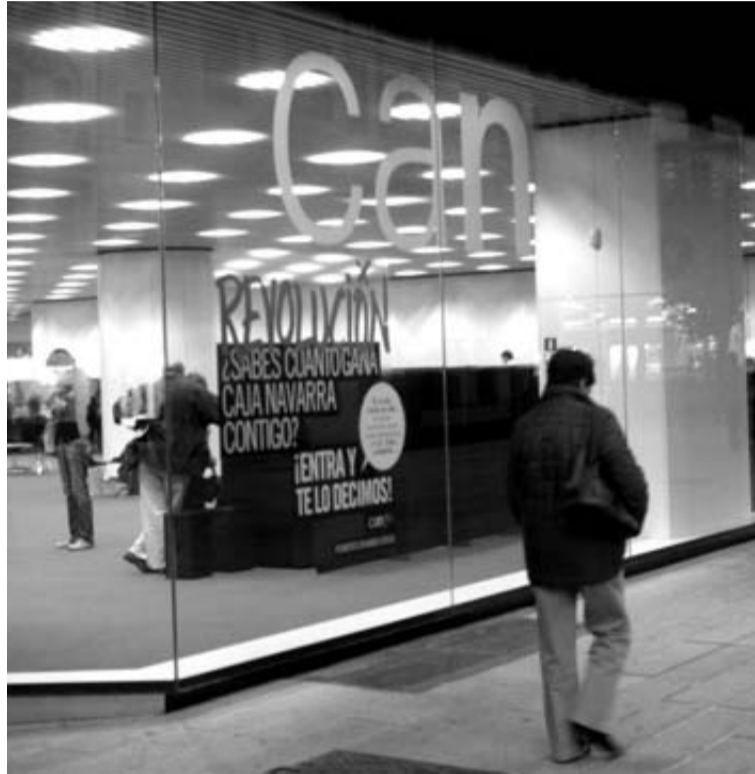
Edificio de Caja Navarra, en Carlos III.

Por otra parte, la nueva legislación puede permitir mayor facilidad para recapitalizarse. Hasta ahora la necesidad legal de mantener el 50% del capital del banco hacía difícil que las entidades pudieran ampliar capital o emitir bonos convertibles porque esta situación podía arrastrarles a perder el 50% y, por tanto, dejar de ostentar la condición