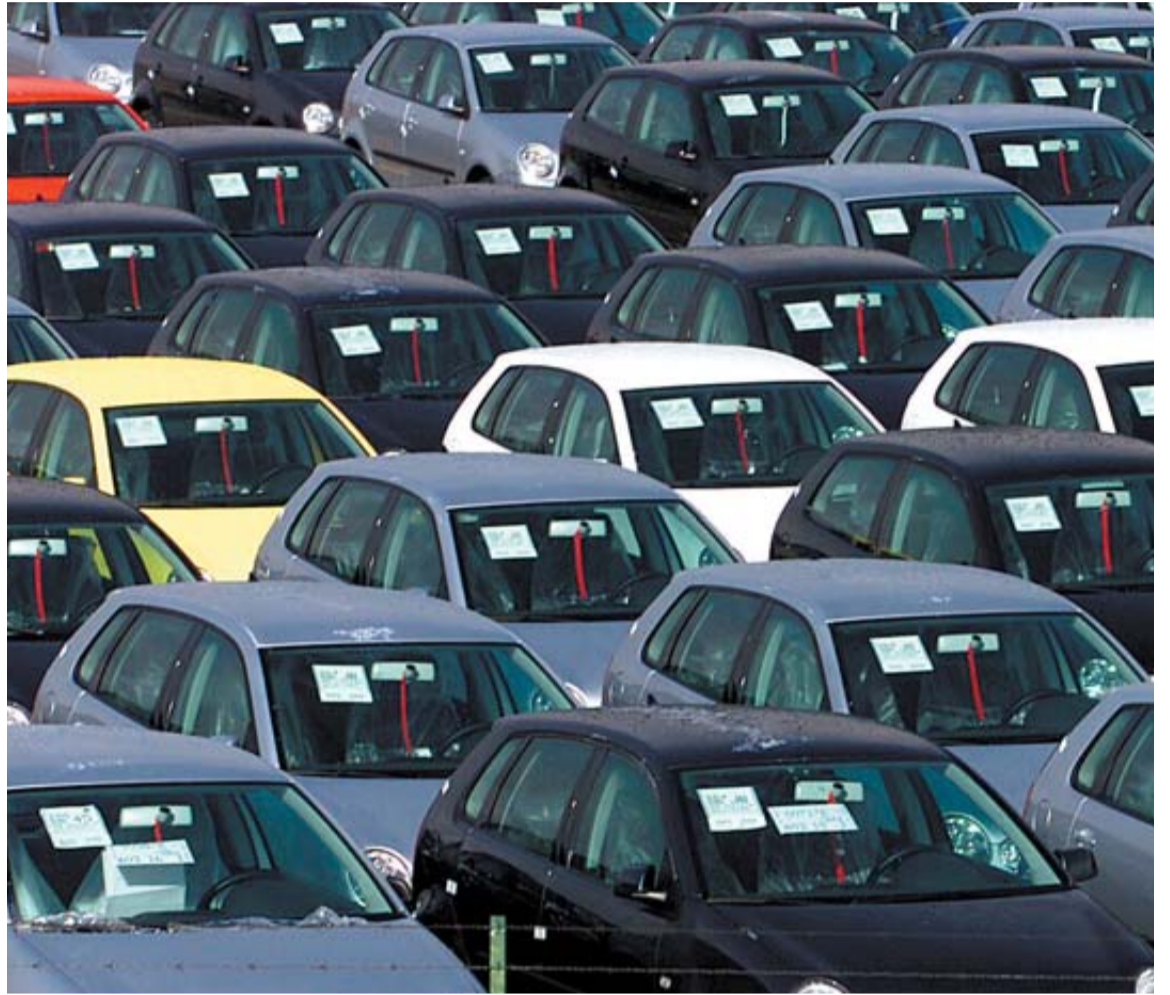
Varios modelos de Polo en el aparcamiento de la fábrica de Volkswagen en Landaben.

El conjunto de los todoterrenos no siguió esa pauta, al descender en comparación anual el 6,5%. En el mes de diciembre aislado, las ventas de coches en el mercado español se quedaron en 66.458 unidades, un 3,6% menos que en el mismo mes de 2010.