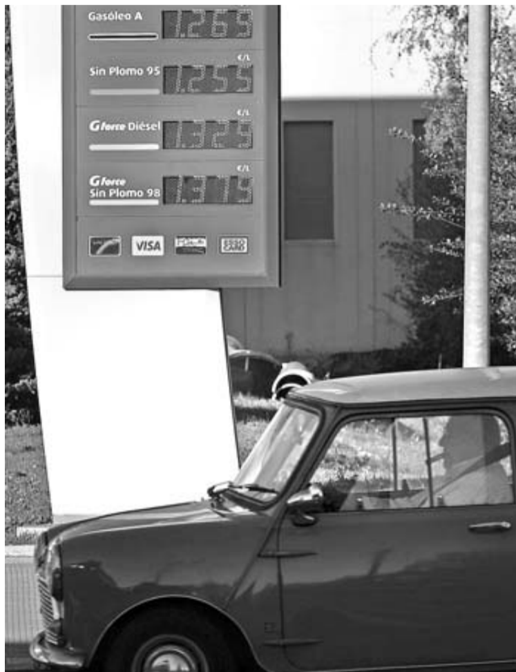
Precios en una gasolinera de Pamplona a finales de noviembre. J. SESMA

El precio del gasóleo ha subido un 10% respecto al año pasado, al pasar de 1,16 a 1,27 euros el litro. Lo mismo ha ocurrido con el precio de la gasolina, que se ha incrementado en un 3% al pasar de 1,24 a 1,28 euros el litro. Esto supone que llenar un depósito de 50 litros cuesta ahora entre 5 y 6 euros más