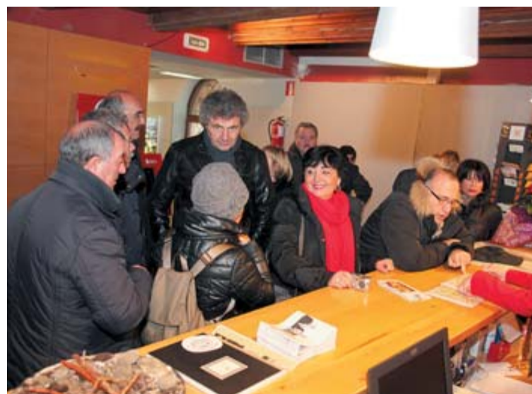
Un grupo de turistas italianos fue atendido ayer en la oficina.