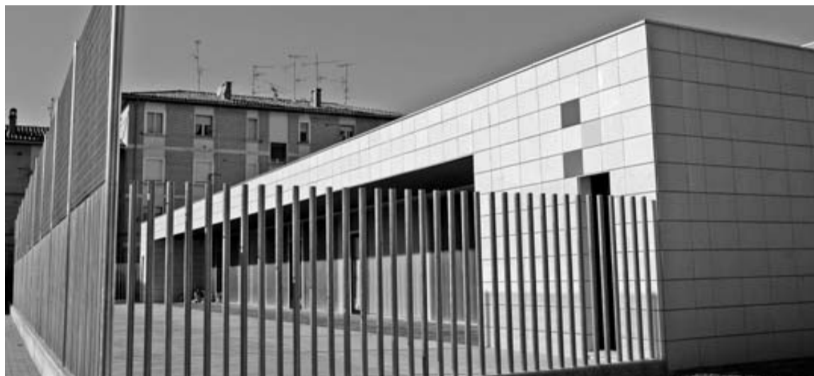
Vista exterior de la nueva escuela 0-3 años de Marcilla.

cen el turismo o la agricultura". Elizegi dijo también que la zona está protegida y que el proyecto "está en los juzgados", en alusión a un recurso interpuesto. En un momento dado, el alcalde jurado de Arraioz, Xotero Etxandi, reprochó a los trabajadores "no haber hecho nada por Baztan". Tanto UPN como Baztango Ezkerra apoyaron la cantera. "Si no se hace nada por crear empleo tendremos un mal futuro", dijo Florentino Goñi, de la segunda fuerza. Su compañero, Iñigo Iturralde, censuró al jurado de Elizondo, Xabier Torres: "Representad vuestro voto y no el del pueblo". Torres se escudó en la defensa del comunal y en que no hubieran opiniones contrarias en batzarre para sumarse al grupo disconforme con la cesión.