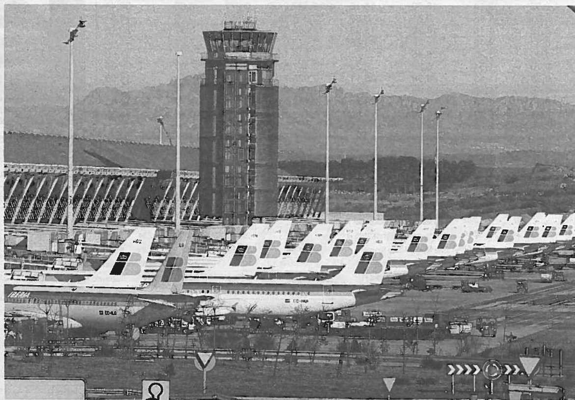
Aviones de Iberia estacionados ayer, en la T-4 del aeropuerto madrileño de Barajas.

La deuda pública española representaba un 60,1% del Producto Interior Bruto (PIB) en 2010 frente al 120% de Italia, aunque estas aumentarán por el déficit de este año. >EFE