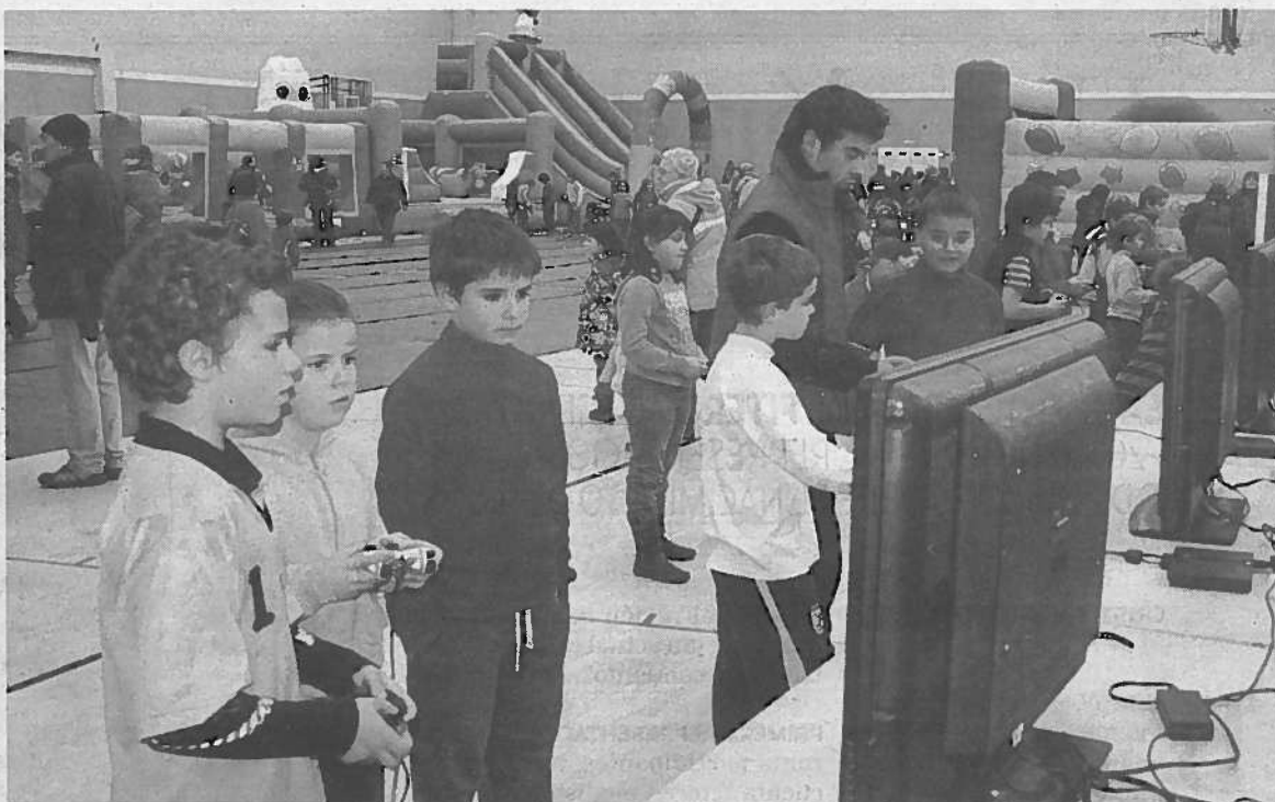
Un grupo de txikis, mando en mano, juegan con una consola frente a un monitor.

Txalo presenta hoy en la casa de cultura de Etxarri Aranz el espectáculo infantil Ipuinaren bila , un mundo de cuentos que gira por distintos continentes ofreciendo lo mejor de cada cultura. Así, dos actores con ganas de aventuras recorren el mundo, en su moto invisible, en busca de nuevas cosas que contar. Pero no faltarán las sorpresas. Será a partir de las 17:30 horas. El precio de la entrada es 3 euros. >N.M.