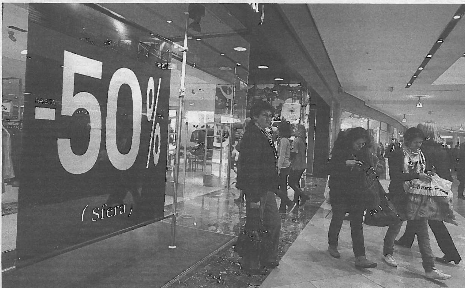
Los centros comerciales se han convertido en una referencia para las compras en Navarra.