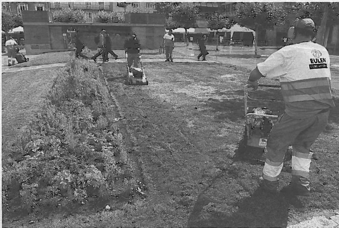
Empleados de Eulen cortan el césped en la plaza del Castillo.

Los trabajadores de ambas empresas afectadas han convocado una concentración de protesta frente al Ayuntamiento el lunes a las 18.00 horas. Aunque no se han concretado las fechas, los despidos por parte de Eulen tendrán lugar de forma "inminente", según señalan desde