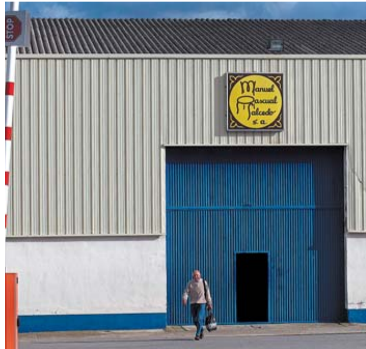
Exterior de la fábrica de Viana.