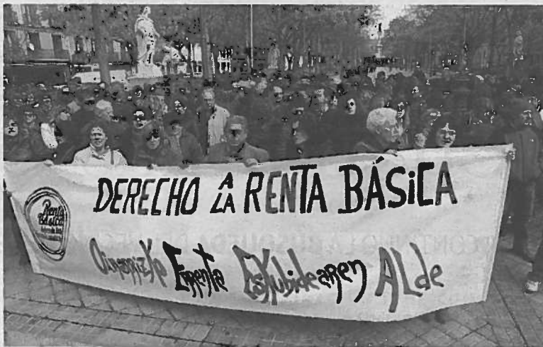
Cabecera de la manifestación celebrada ayer.