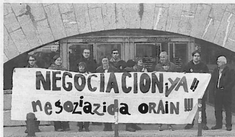
Representantes de los cuatro sindicatos, ayer en la concentración.

El Consejo de Gobierno de la UPNA también aprobó ayer la decisión de conceder el complemento de dedicación exclusiva a todos los jefes de sección si bien esta resolución beneficia sólo a tres personas (las que se incorporaron al centro desde 2009), ya que el resto de jefes de sección no lo dejaron de cobrar. Los sindicatos, según informaron fuentes de la UPNA, llevaban reclamando desde 2000 la elaboración de un estudio para ver si todos los jefes de sección debían cobrar ese plus. En 2009 se accedió a realizar el estudio pero los propios sindicatos, señalan desde la UPNA, aceptaron no retirar el complemento a los que ya se les estaba aplicando. Por ello, tan sólo tres jefes de sección, los que se incorporaron en estos dos años, han estado sin cobrarlo a la espera de la resolución del informe. El estudio, elaborado por Human, estableció que se debía aplicar a todas las plazas por lo que ayer el Consejo de Gobierno aprobó la resolución. El complemento, en el caso de esas tres personas, supone un 20% más de su sueldo. >M.O.J.