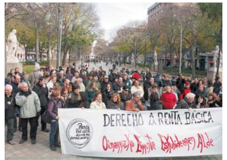
CONCENTRACIÓN. Cerca de un centenar de personas convocadas por varias organizaciones se concentraron ayer ante el Parlamento de Navarra para reclamar el 'derecho a la renta básica'.

Asimismo, I-E, en su enmienda a la totalidad del proyecto recuerda que la crisis económica actual ha llevado a que aumenten las personas y familias que se ven "abocadas a cobrar la renta bási-