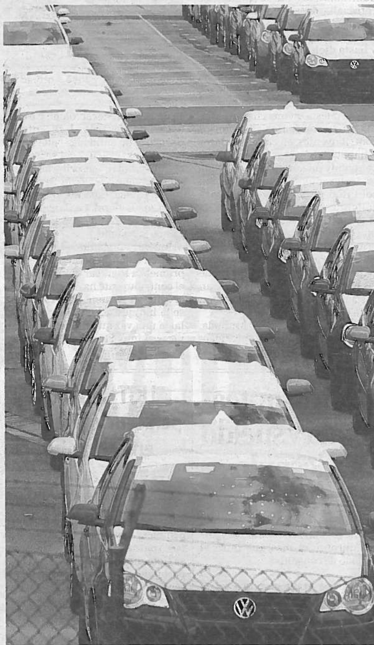
Volkswagen Polos, aparcados junto a la fábrica.

de empresa, reconocía ayer que la dirección había dicho que "con el actual programa no se puede mantener la línea en funcionamiento". "Nosotros, en cambio, entendemos que es importante que siga", dijo Manías, quien apostó por seguir generando las condiciones para "que todos los Polos que se vendan en Europa se fabriquen en Navarra". Por su parte, Chechu Rodríguez (CCOO) dijo que la producción