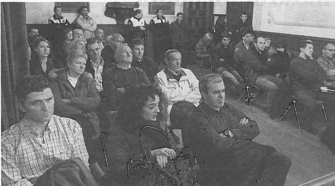
El salón de plenos, lleno de vecinos esperando el turno de ruegos y preguntas.