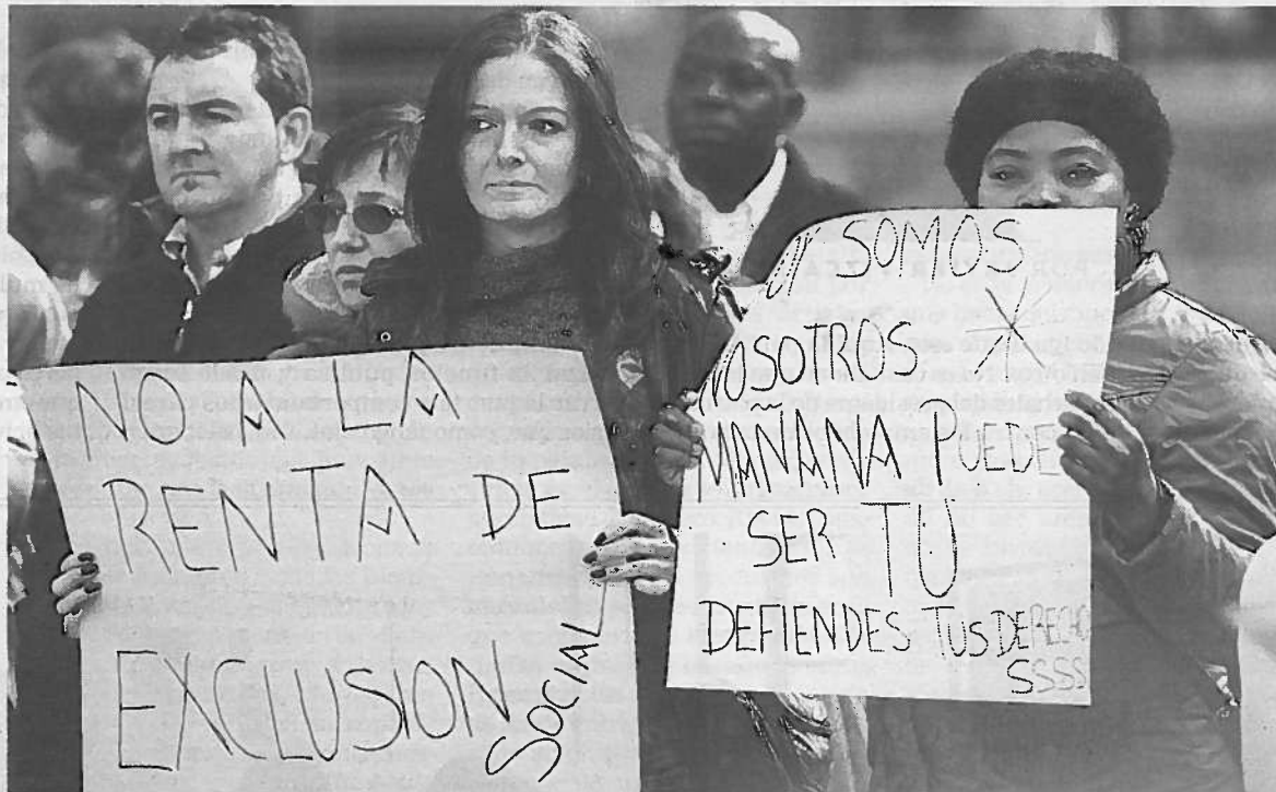
Pancartas críticas con la ley que insisten en la idea de que el desamparo puede llegar a todos.

En este contexto cobran especial importancia campañas como la de Navidad, con la que esta organización recauda el 22% de sus fondos. Casi el 100% de sus fondos proceden de la solidaridad ciudadana (cuotas de socios, donativos, colectas, tómbolas...).