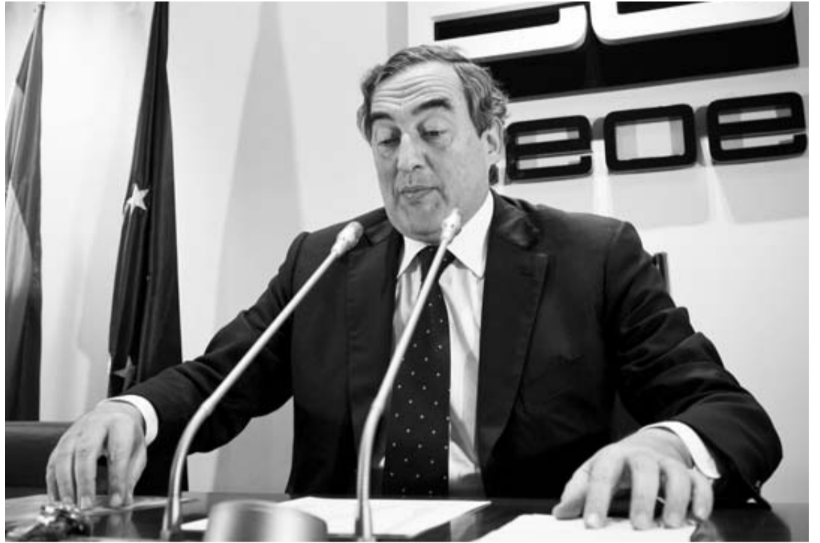
El presidente de la CEOE, Joan Rosell, en rueda de prensa el pasado miércoles.

Añadió que es algo "tramposo" utilizar el argumento que emplea la CEOE sobre que si un parado le preguntas si quiere un miniempleo o nada, decida quedarse con el miniempleo . "Si uno le pregunta a quien le van a cortar los brazos si prefiere que le corten uno solo, pues probablemente diga que sí", señaló.