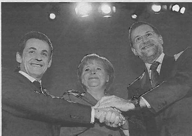
Nicolas Sarkozy, Angela Merkel y Mariano Rajoy.

Van Rompuy precisó que los líderes europeos discutirán en la nueva cumbre las últimas decisiones adoptadas para tratar de poner fin a la crisis de deuda de la eurozona en el Consejo Europeo del 8 y 9 de diciembre. "Lo más importante es el pacto fiscal y el Tratado intergubernamental", recaló. Sin embargo, dejó claro que también quiere analizar al máximo nivel cuestiones de "com-