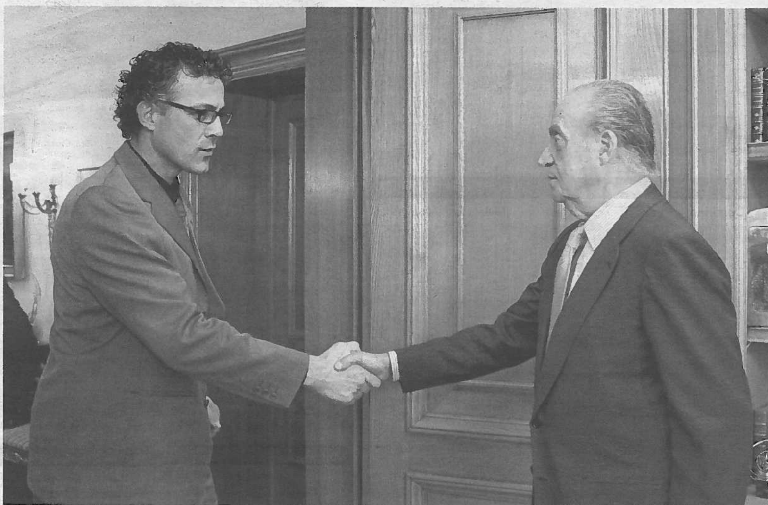
El diputado de Amaiur Xabier Mikel Errekondo estrecha la mano de Juan Carlos I, en la audiencia concedida por la mañana en La Zarzuela.

del empleo eventual: según fuentes sindicales, habrá un exceso de 250 personas (quedan en la actualidad unos 550 eventuales de los 2.050 que llegó a tener la planta). La producción prevista es la más baja desde 2009, pero también la cuarta mejor de la historia de Landaben. PÁGINA 49