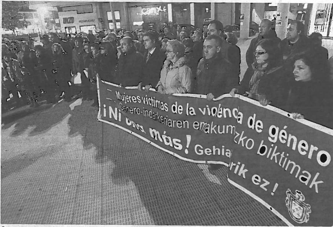
Concentración celebrada ayer por la tarde en Burlada contra la agresión.

Para condenar la agresión, decenas de vecinos de Burlada se con-