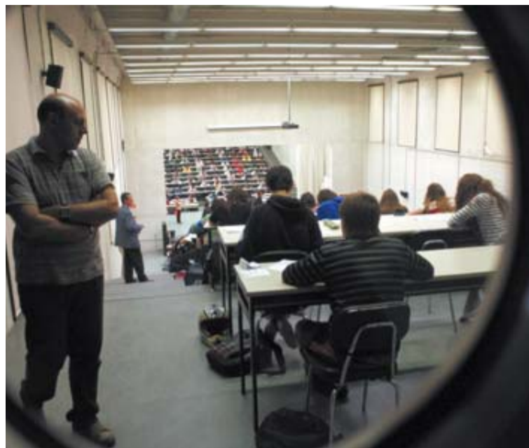
Estudiantes realizando un examen en el aula de la UPNA. CORDOVILLA

En cuanto a los ingresos que recibirá la UPNA durante 2012, el capítulo de mayor cuantía es el de Transferencias Corrientes, es decir, la subvención que le ha sido asignada por parte del Go-