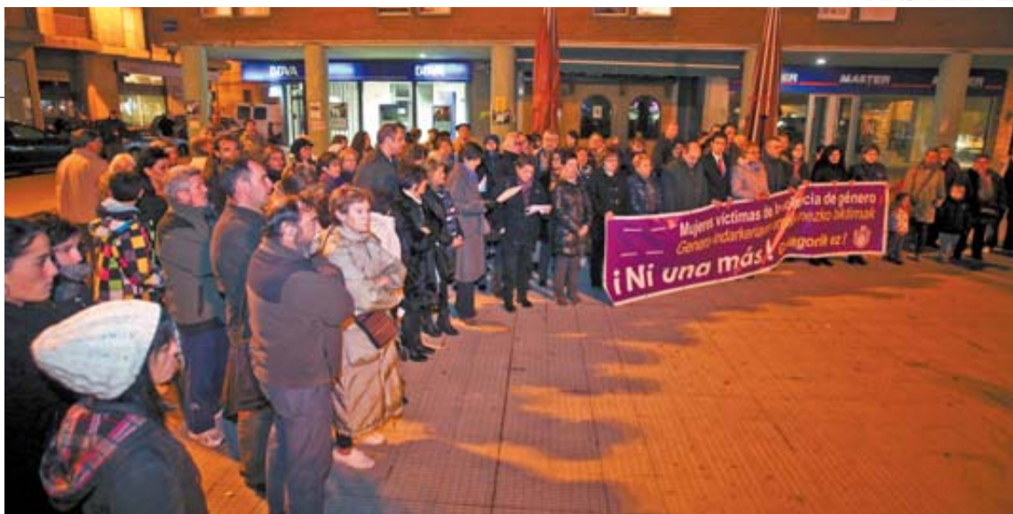
Los asistentes se concentraron en silencio tras leerse el acuerdo de condena del Ayuntamiento.

Se concentraron ayer para exigir que no haya nunca más mujeres víctimas de la violencia de género