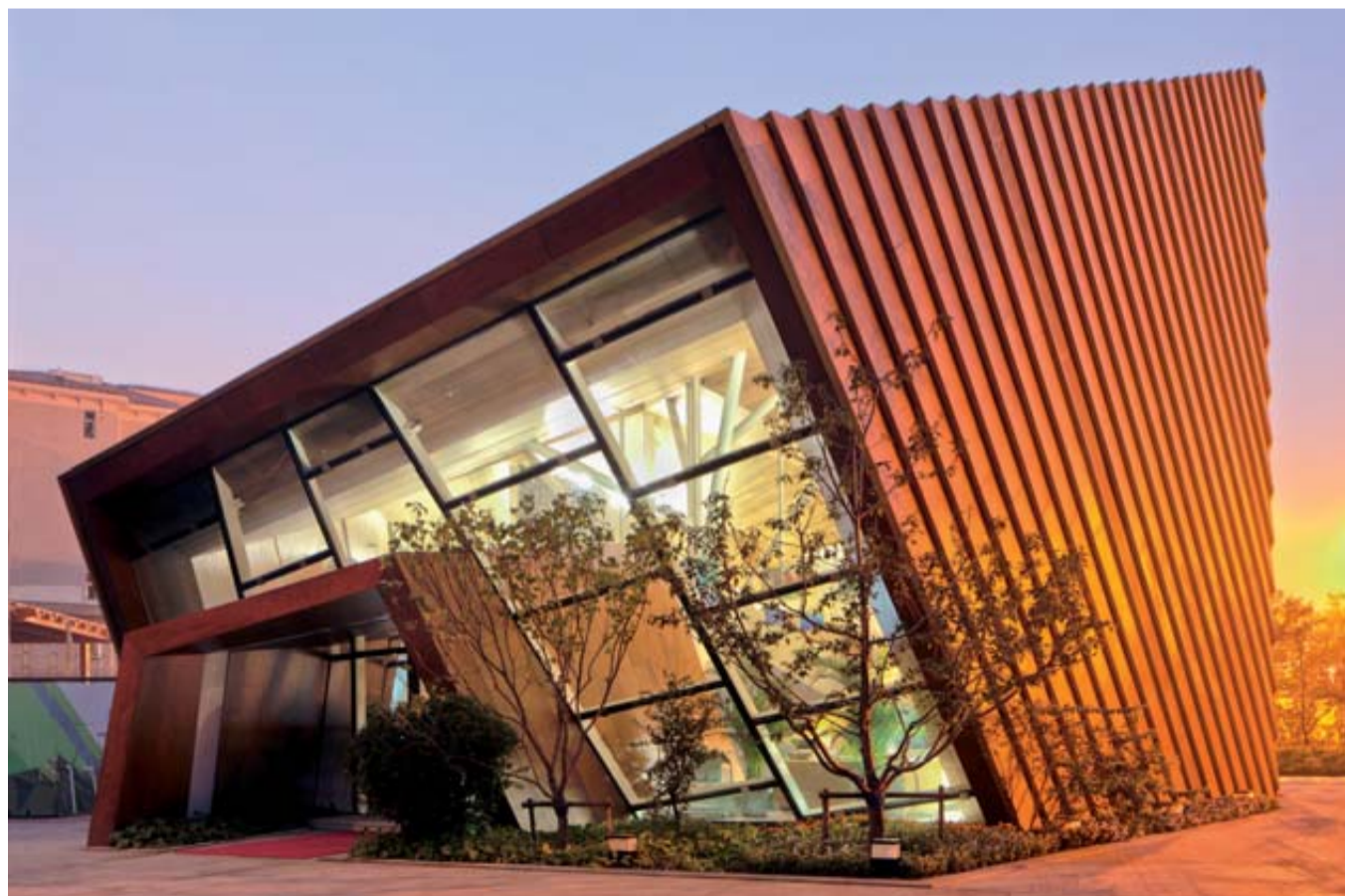
Tianjin Zero power-wasting building. Tianjin, China. Architect: Xu Rui Parklex Facade Madera natural para exterior.

Asimismo, la Cámara quiere poner públicamente de manifiesto aspectos favorables de la actividad de los empresarios y trayectorias personales dignas de reconocimiento con la finalidad de estimular la creación de nuevas empresas y el fomento de los emprendedores, tareas que constituyen objetivos prioritarios y factores clave para el crecimiento y el mantenimiento de la competitividad de las economías.