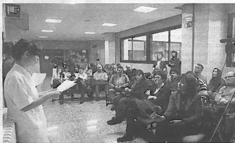
Una trabajadora del laboratorio se dirige a los concejales riberos.

● 27.807 firmas. Fueron presentadas en el Parlamento de Navarra contrarias a la centralización. Por su parte, los ayuntamientos de Ablitas, Cascante, Cadreita, Castejón, Cintruénigo, Corella, Cabanillas, Fontellas, Valtierra y Villafranca también han apoyado la moción en sus juntas de Gobierno.