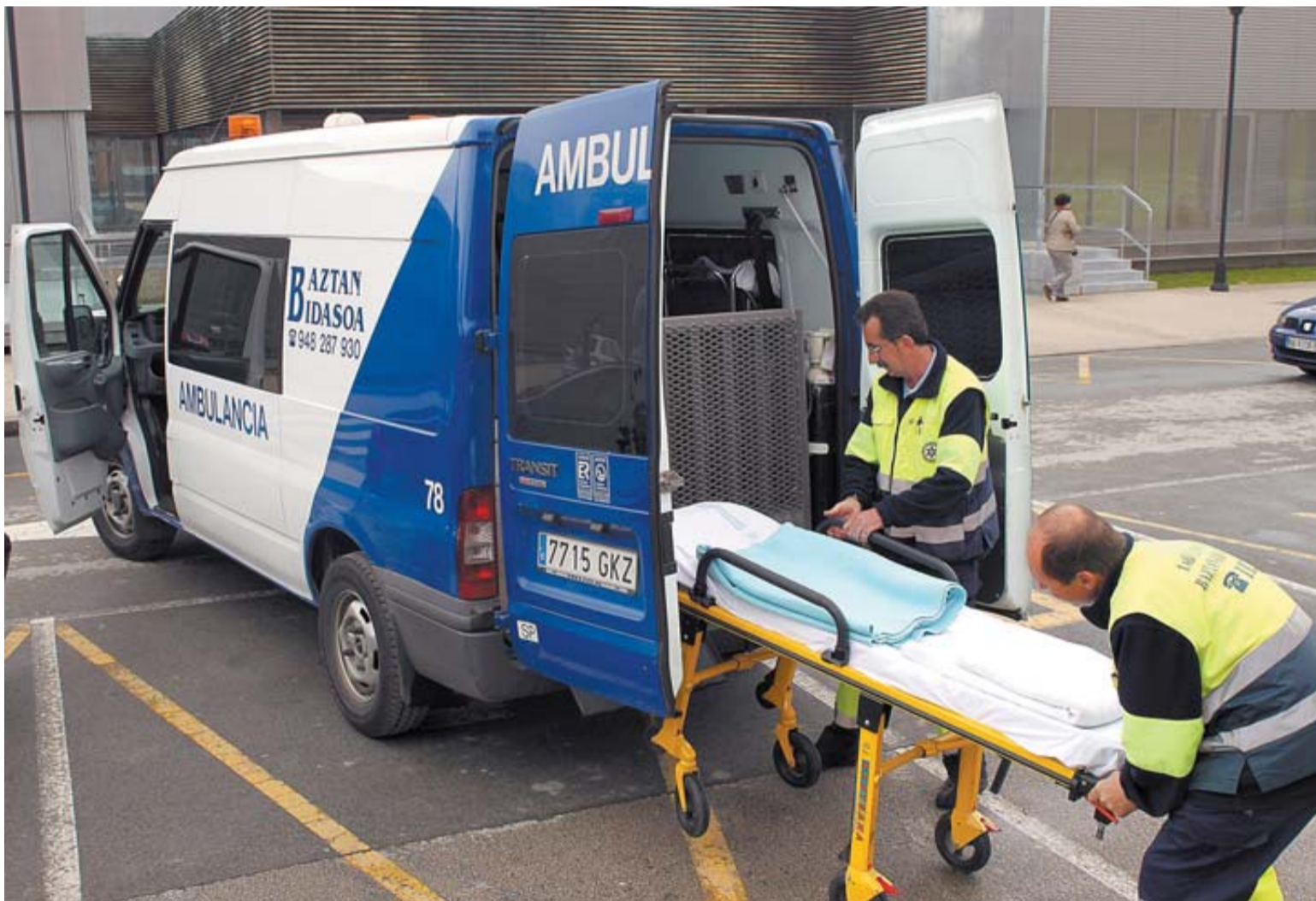
Dos trabajadores regresan a la ambulancia tras haber acompañado a una paciente en el Complejo Hospitalario de Navarra.

Tampoco queda definido si afecta a todos los servicios que integran el transporte sanitario no urgente o sólo a algunos. "Es posible que se vayan a consensuar las prestaciones que podrían entrar y las que no", indicaron. Y, de la misma forma, se deben definir con mayor exactitud las aportaciones que correrían a cargo del usuario en aquellos servicios en los que tendría que pagar.