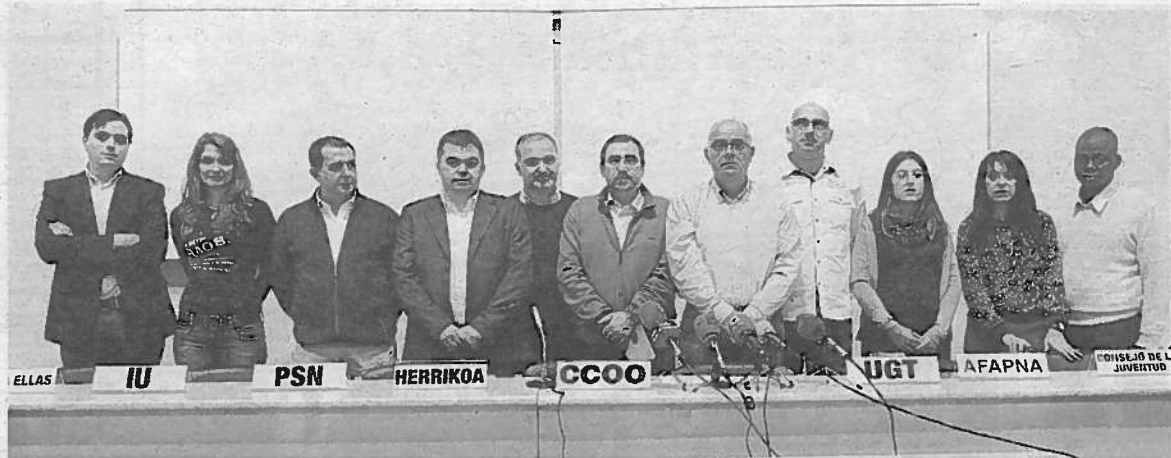
Representantes de partidos (PSN e IU), sindicatos y entidades que conforman la plataforma.

Para mostrar su rechazo, el día 29 saldrán a la calle en Pamplona y Tudela sendas manifestaciones unitarias UGT, CCOO, AFAPNA, el Sindicato de Personal Administrativo, PSN, IU, Juventudes Socialistas, Herrikoa, Ahora Ellas, el Consejo de la Juventud y FAIN bajo el lema "Con la educación y la salud no se