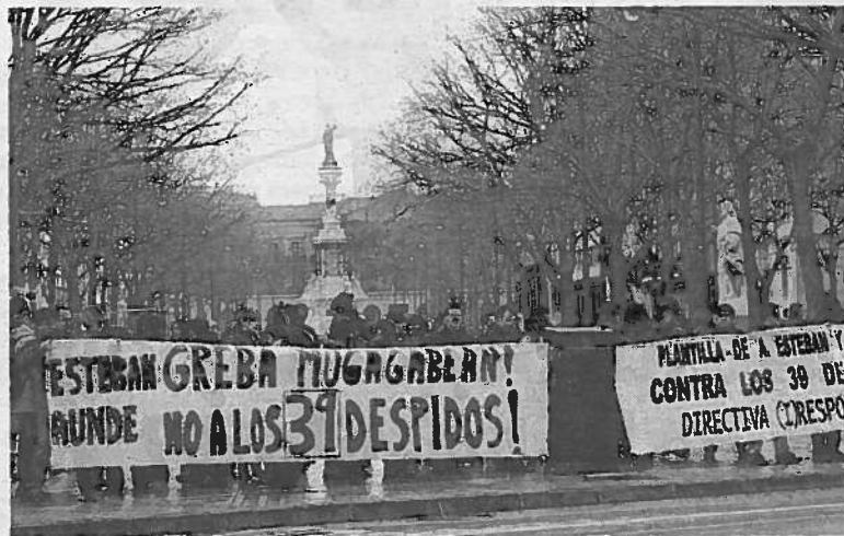
Empleados de Asientos Esteban en una protesta en 2011.

En diciembre del año pasado la dirección de Asientos Esteban adelantó a la parte social otro recorte de plantilla en Landaben, después de que hubiera despedido a 23 personas por motivos organizativos, productivos (caída de pedidos) y económicos (en 2007 cerraron con un millón de beneficios; en 2008, con 146.000 euros de pérdidas; en 2009, con 1,1 millones de euros en rojo y en 2010, con -1,5 millones), como ahora. Ante ese anuncio, el comité exigió a la empresa y al Gobierno de Navarra—que en febrero de 2011 se comprometió pedir a la multinacional un plan de futu-