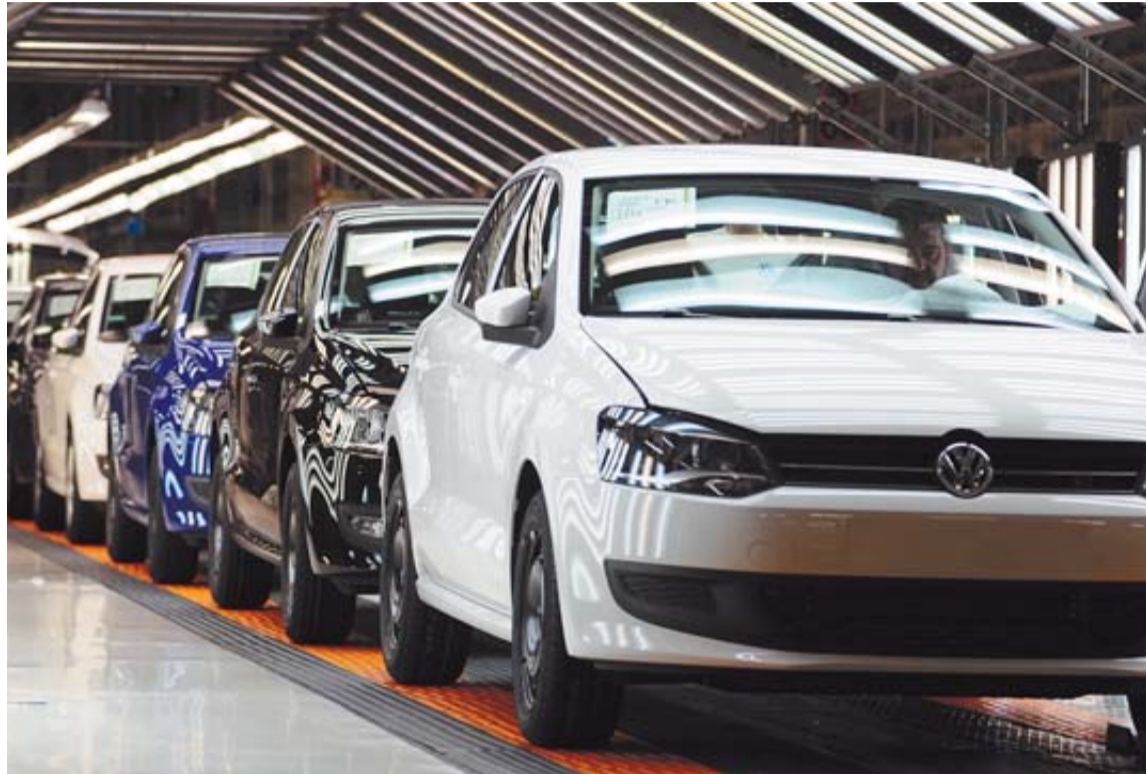
Una imagen de coches en la fábrica de Volkswagen Navarra en Landaben.

Volkswagen Navarra finalizará contrato a otros 52 trabajadores eventuales en mayo, según informó ayer el comité de empresa. En una reunión celebrada ayer mismo, la dirección indicó a los sindicatos que, según sus cálculos de cargas de trabajo y absentismo previsto, en este momento tienen un excedente de plantilla de mano de obra directa cifrado en 104 personas. De ellas, 47 de exceso sobre la plantilla necesaria para las cargas de trabajo actuales (3.272 personas) y 57 más por la reducción del absentismo, tanto el de enfermedad como el pactado, para lo que la fábrica cuenta habitualmente con un colchón de 244 trabajadores por encima de la plantilla de producción estrictamente necesaria.