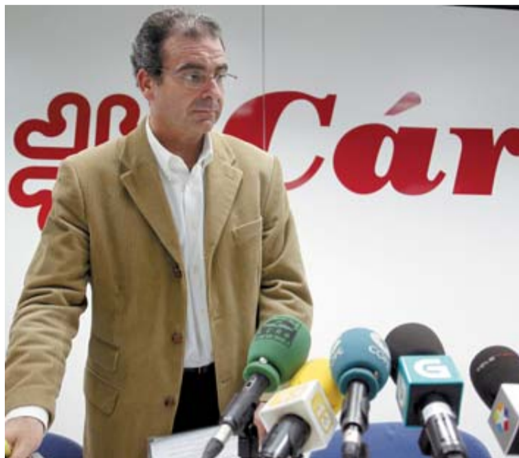
El presidente de Cáritas Española, Sebastián Mora.

Dichos programas atendieron el año pasado a 80.417 personas, de las cuales el 60,8% son inmigrantes. La mayoría de las personas atendidas -un 70%- tanto españoles como extranjeros son mujeres comprendidas entre los