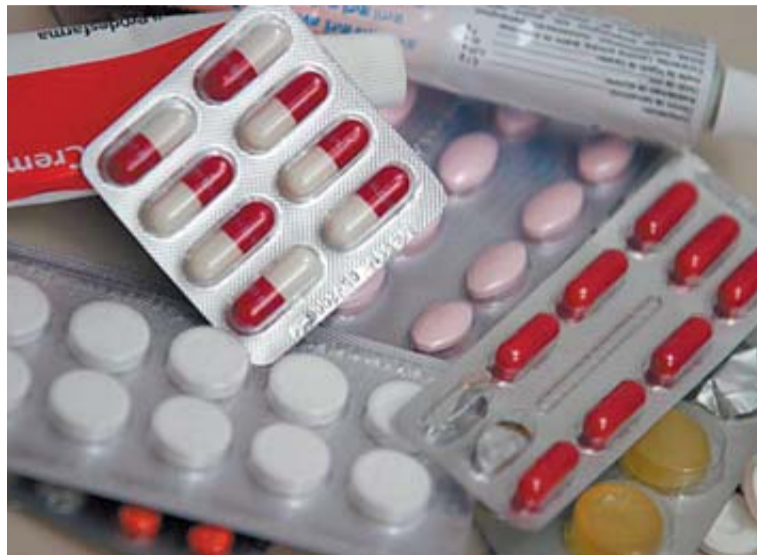
Imagen de varios fármacos.

La cifra correspondería al ahorro anual con la medida de el pago de fármacos en función de la renta: 10% en el caso de pensio-