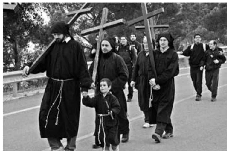
Romería principal celebrada el año pasado.