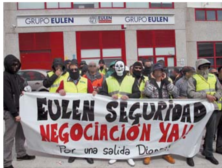
Imagen de archivo de una concentración reciente de protesta. J.SESMA

Eulen despide a 49 escoltas en Navarra. El periodo de negociaciones terminó ayer sin acuerdo con la parte sindical. La empresa ofrece el mínimo establecido, 20 días por año trabajado, cuando los trabajadores han intentado, sin éxito, poder aumentar la indemnización. A cambio, la empresa sí ha ofrecido recolocaciones tanto para la plantilla de Navarra como la del País Vasco, ya que el Expediente de Regulación de Empleo (ERE) de extinción se ha tramitado conjuntamente, en Madrid. Las 12 recolocaciones se ofrecen en vigilancia, la otra división de Eulen seguridad. Son