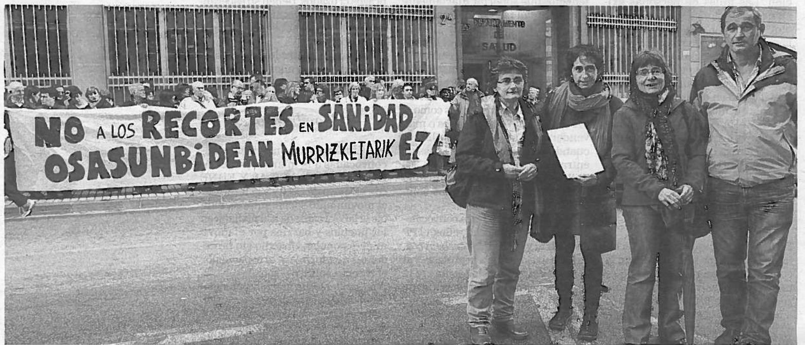
Trabajadores sanitarios se concentraron a las puertas del departamento de Salud, donde entregaron las firmas.

Los profesionales sanitarios llevan ya meses advirtiendo de que la sobrecarga de trabajo que tienen, derivada de la decisión de Salud de no realizar sustituciones para cubrir las bajas de menos de tres días de personal sanitario y administrativo, repercute de modo directo en la atención que a los pacientes. En este sentido, los trabajadores explicaron que