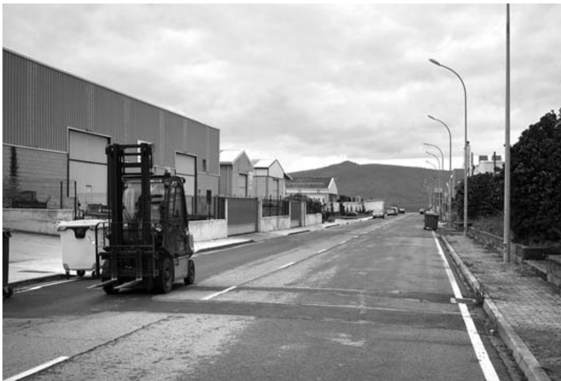
Una carretilla elevadora circula ayer por un polígono de Aoiz casi sin actividad.

En 2009 cerró el taller de maquinaria Pedroarena, con unos 5 empleados. Y en febrero de 2012 lo hizo Cotalsa. Se dedicaba a la transformación y comercialización de aluminio, bolsas de basura y film estirable, y llevaba 5 años con problemas económicos y de gestión. En agosto de 2011 se despidió a 29 empleados para inten-