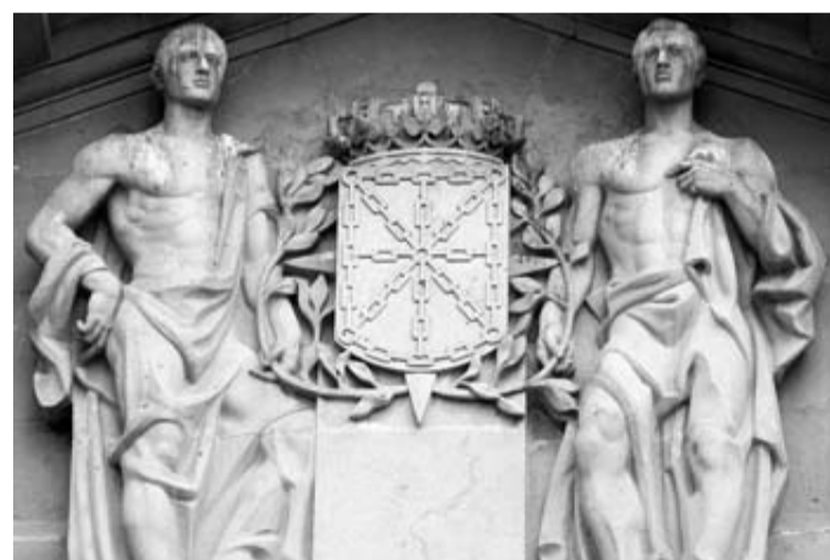
Imagen del escudo de Navarra con la laureada.