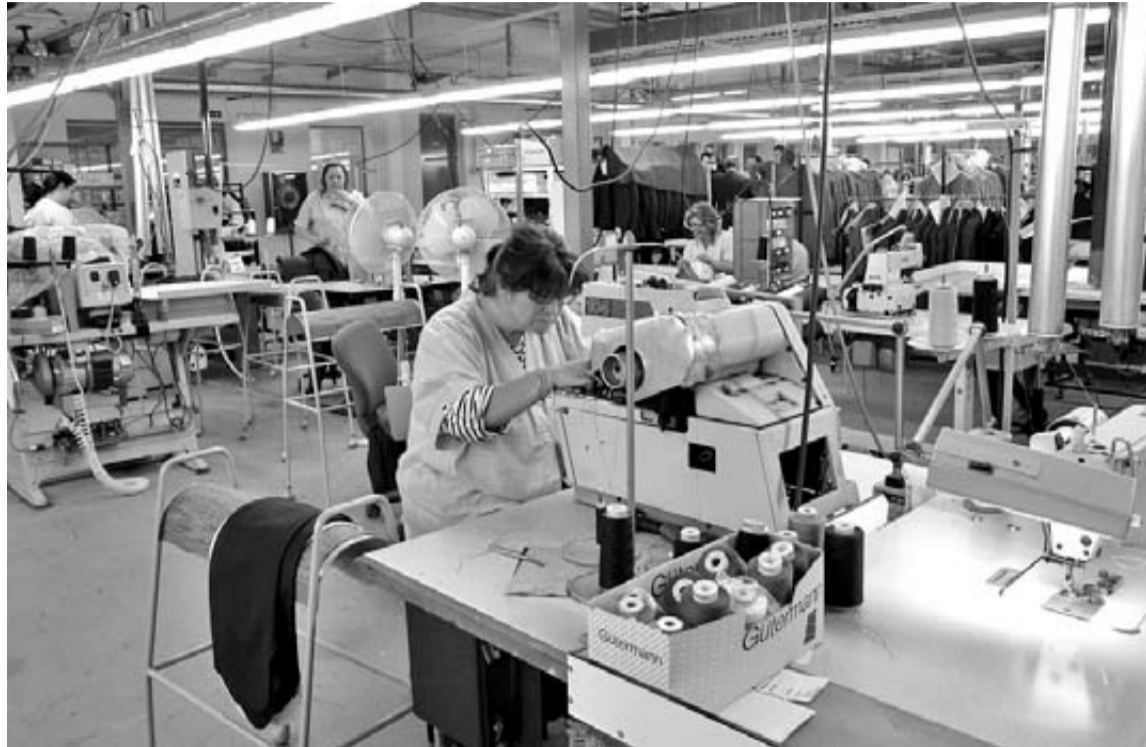
Mujeres trabajando ayer en el taller de Segura Taylor en Caparroso.