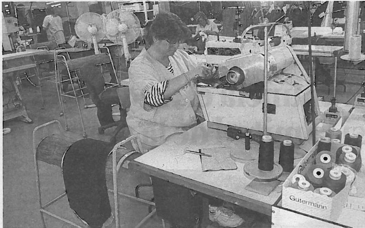
Una empleada de la fábrica textil Segura Tylor de Caparroso.