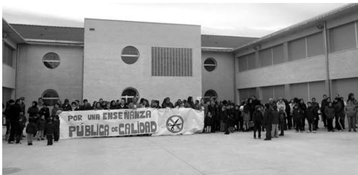
Profesores, padres y alumnos, en una de las concentraciones contra los recortes en educación.

Este periódico intentó recabar la postura de la empresa, sin éxito.