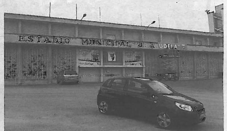
Los operarios colocan parte del cartel del Ciudad de Tudela.

Ocho años después de que se promulgara la Ley de Símbolos, el Ayuntamiento ha cumplido con la normativa y ha cambiado de forma definitiva este nombre colocado en agosto del año 1969, cuando se inau-