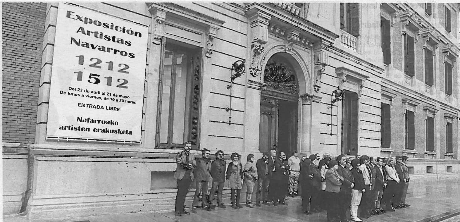
Los parlamentarios, durante la concentración mensual contra la violencia de género, ayer frente al Legislativo.

aunque son temporales algunas de las medidas requieren esfuerzo, son difíciles, complejas pero vamos a salir adelante con responsabilidad, que nadie lo dude", defendió Iribas, que evitó descartar ninguna posibilidad, y que reprochó a De Simón que dijera que los recortes "no se tienen por qué aplicar" cuando ni siquiera los servicios jurídicos lo tienen claro. "Con estas medidas se limita la calidad de la educación y se cercena el acceso a muchas personas a los estudios universitarios", advirtió la parlamentaria de I-E.