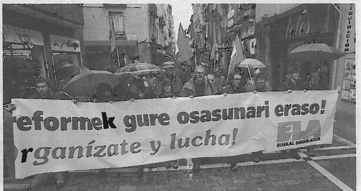
Cientos de delegados de ELA denunciaron el "gran teatro que es el diálogo social".

Durante su intervención, Muñoz se preguntó "qué le importa la salud laboral a un Gobierno que plantea que los jóvenes que no hayan tenido un empleo antes de cumplir 26 años se queden sin asistencia sanitaria". A su juicio, esta medida se planteó para que "la juventud, con una tasa de paro en el Estado de más del 50%, se vea obligada a aceptar contratos miserables. La reforma laboral es la más brutal y más despiadada conocida", dijo. Muñoz criticó que "la salud laboral es una consecuencia estructural de un sistema laboral montado para que la patronal gane dinero y aumenten su poder las