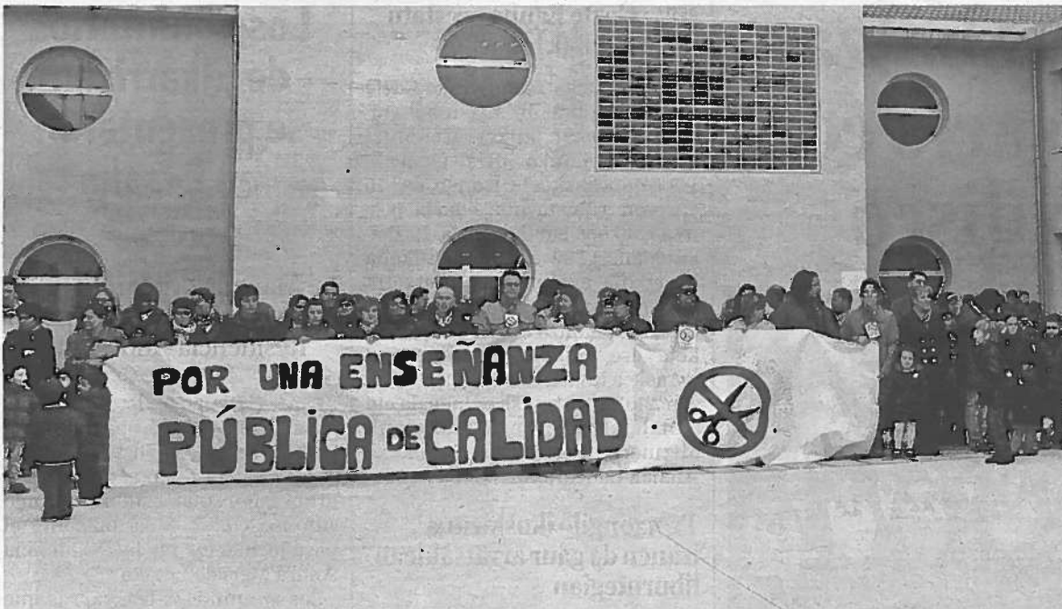
Profesores, padres y alumnos de Milagro se concentraron ayer contra los recortes en Educación.