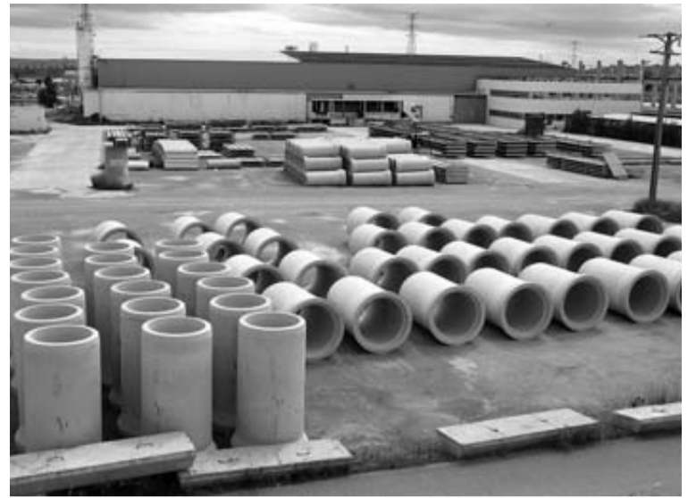
Una imagen de la empresa Precon SA de Castejón.

En este sentido, indicó que la última pretensión de la empresa de implantar una bolsa de 200 horas sin negociarla con el comité "provocó que los trabajadores le dieran su apoyo "para plantarse ante la empresa y decir ¡basta ya!". "La respuesta de la empresa a esta reacción de los trabajadores ha sido el despido de 12 compañeros de forma indiscriminada y con la intención de hacer el mayor daño posible a los mismos", afirmó.