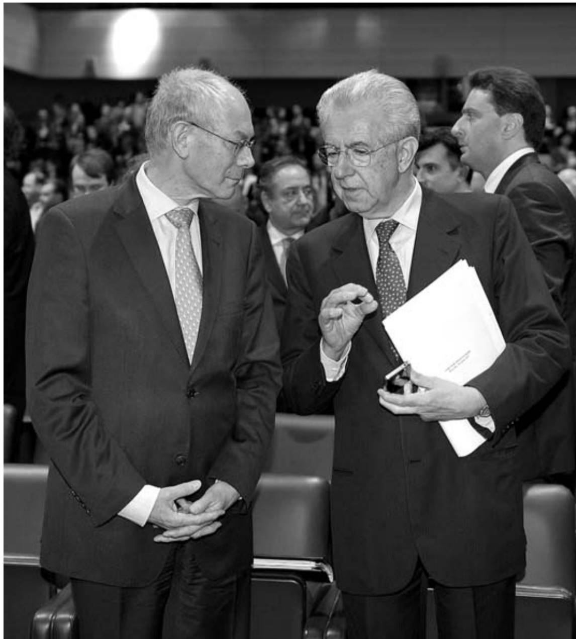
El presidente del Consejo Europeo, Herman van Rompuy, escucha al primer ministro italiano, Mario Monti.

Desde que estalló la crisis griega en la primavera de 2010, los socios han apostado por una reducción del déficit a marchas forzadas como palanca para regresar a la prosperidad. A diferencia de Estados Unidos, que empieza a