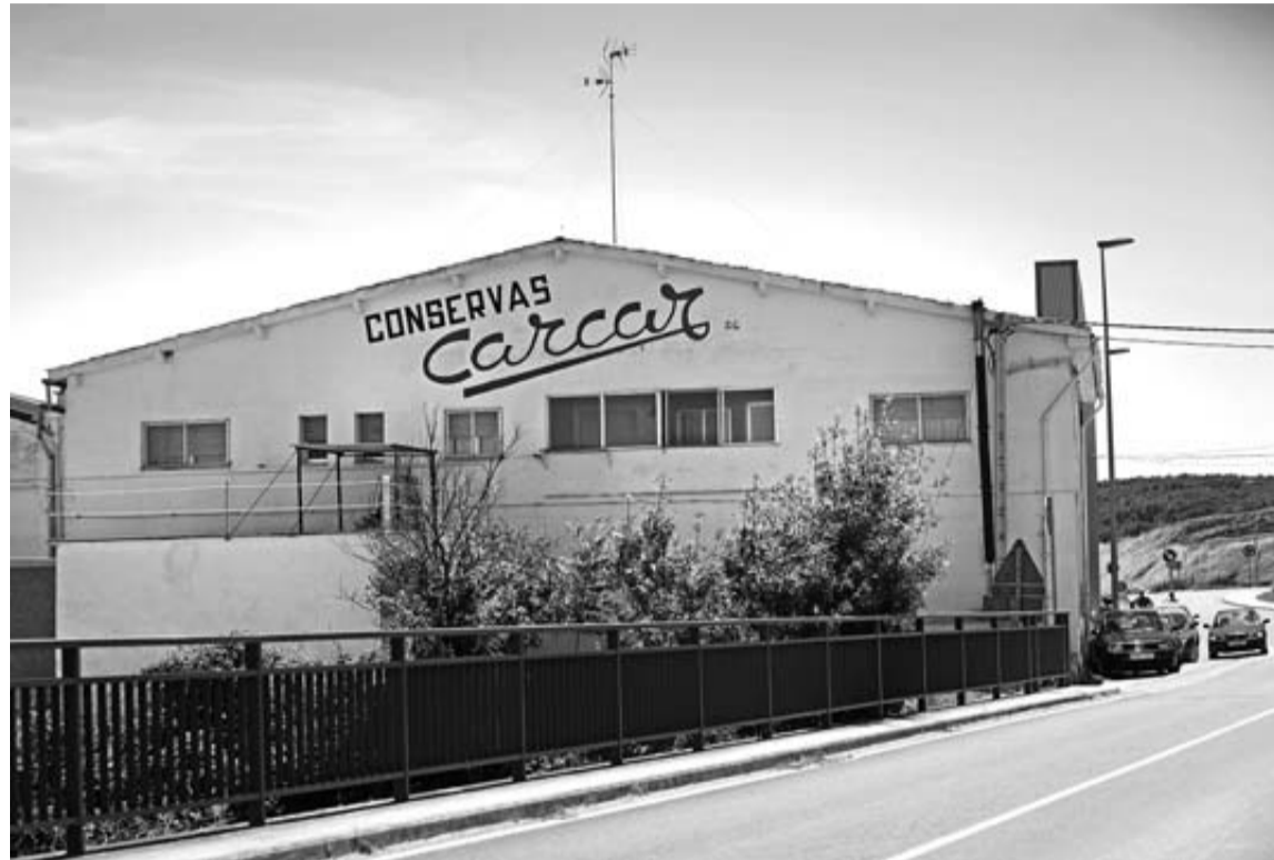
Una imagen de Conservas Cárcar, una de las conserveras históricas de la Ribera Alta.

El empresario atribuye los problemas que atraviesa su empresa al fracaso del proyecto de integración con MCA Spain, una colaboración que echó a andar el pasado mes de junio y que la empresa mendavieses describe simplemente como un acuerdo de comercialización preferente.