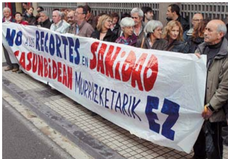
Trabajadores de Primaria ayer, ante la sede de Salud.

86 trabajadores en la división de los escoltas y casi 100 en vigilancia. La disminución de trabajo que ha provocado el ERE es consecuencia de la decisión del Ministerio del Interior de reducir los servicios de protección.