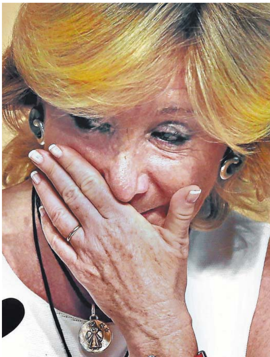
Esperanza Aguirre, presidenta de Madrid, intenta contener la emoción al dar la noticia .