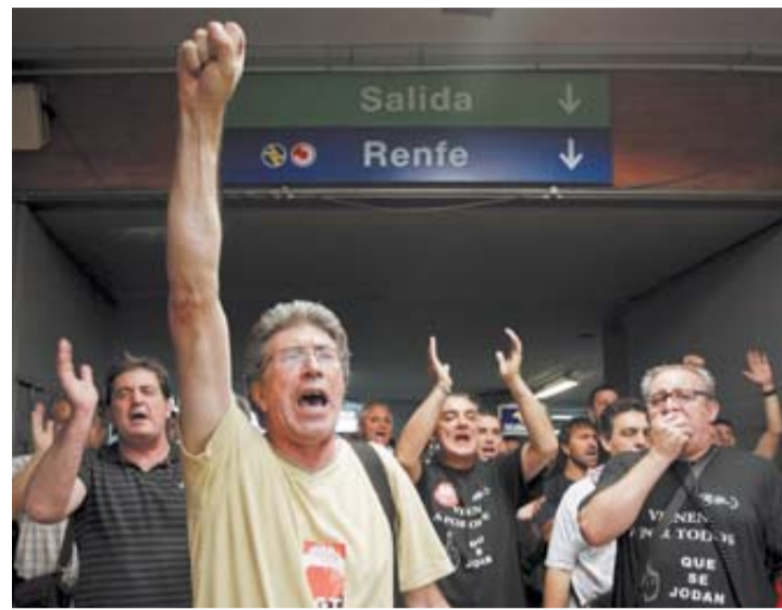
Manifestantes, en la madrileña estación de Atocha.

■ Examen al Tesoro Pese a la resistencia a bajar que presenta la prima de riesgo, el Tesoro español mantiene sus citas con el mercado. Hoy colocará letras a 12 y 18 meses, y el jueves se atreverá con obligaciones con vencimiento en 2022. En total, se propone captar hasta 9.000 millones de euros.