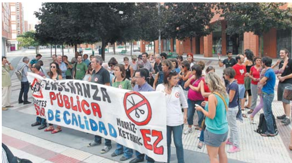
Unas cincuenta personas exigieron una enseñanza pública "de calidad", ante las puertas del Consejo. J.C. CORDOVILLA