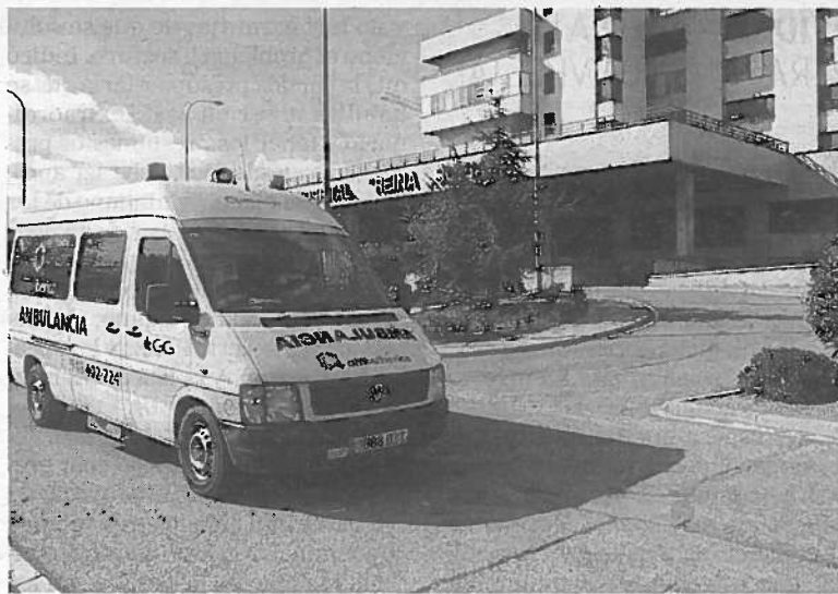
Una ambulancia pasa por delante del Reina Sofía.

En concreto, el hospital disponía de una ambulancia nocturna desde