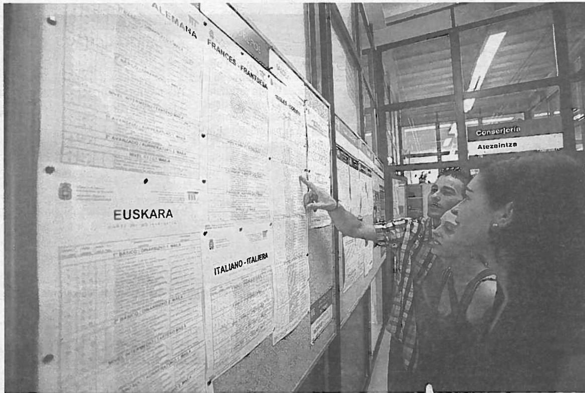
Tres personas comprueban en un tablón de la EOIP, el pasado curso, si tienen plaza.

La escuela sorteó ayer las cerca de 2.300 plazas ofertadas en los niveles básico e intermedio. Y a partir de las cuatro de la tarde, el alumnado preinscrito pudo comprobar en la página web y en los tablones del centro si había sido admitido en alguno de los horarios solicitados. De ser así, las personas interesadas deberán formalizar la matrícula entre mañana