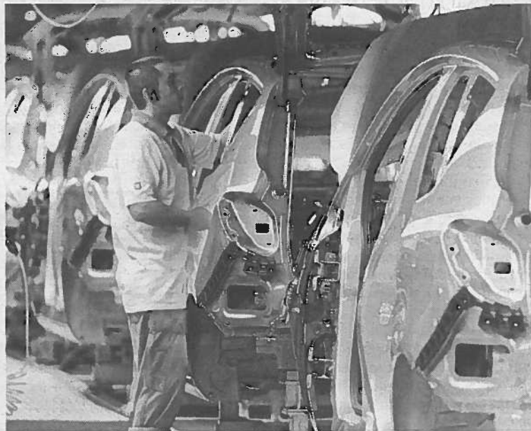
Los salarios en la industria han crecido levemente en 2011.

“No se está negociando nada y lo que se negocia en algunos casos es a la baja”, reconocían desde UGT, que junto a CCOO firmó un acuerdo marco con la patronal para reactivar la negociación colectiva que de momento no se está plasmando en resultado concretos, como recordaba hace unos días el propio secre-