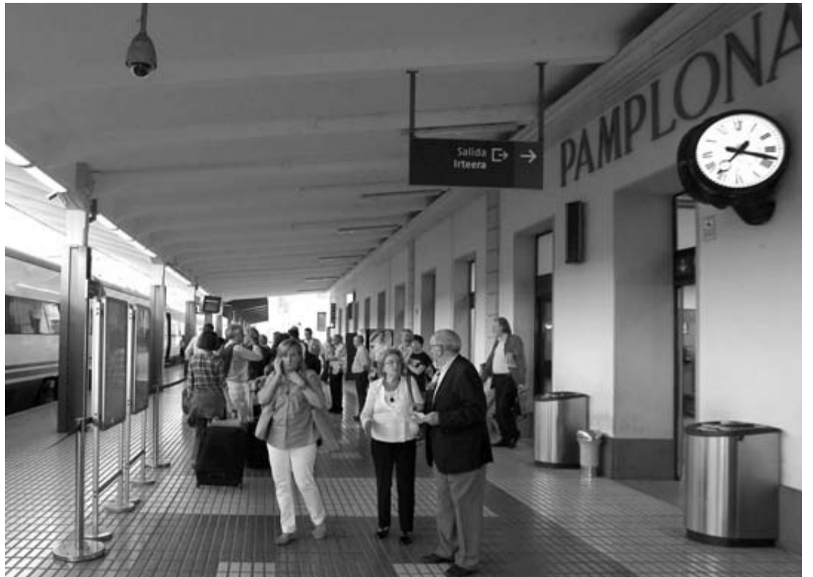
Pasajeros, minutos antes de que partiera hacia Madrid el Alvia de las 19.35 horas.

EMPLEADOS entre las plantillas de Renfe y de Adif estaban ayer llamados a la huelga en la Comunidad foral