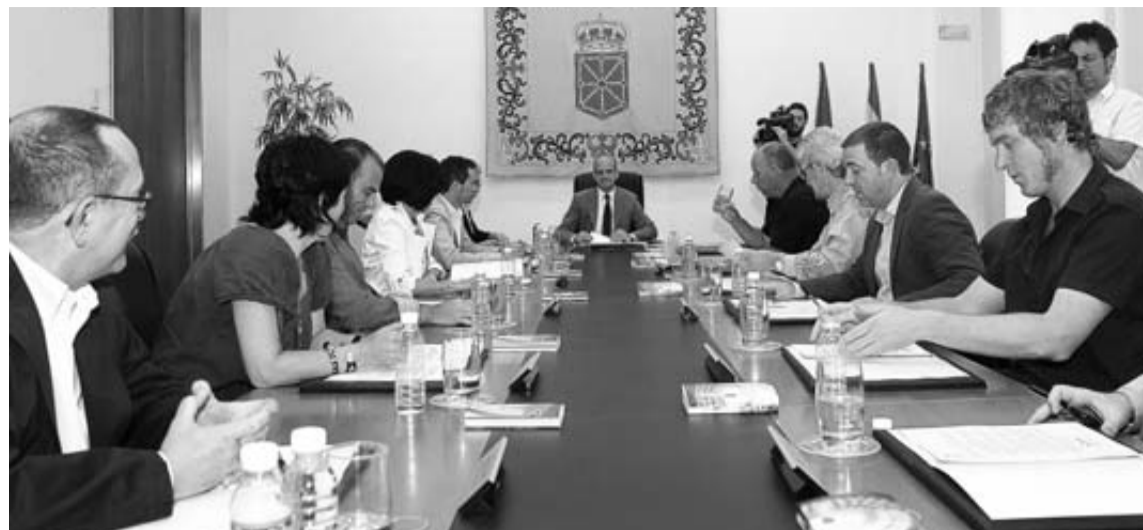
La Mesa y Junta de Portavoces, en una de sus reuniones.

El Ejecutivo había pedido que su norma se tramitara por el pro-