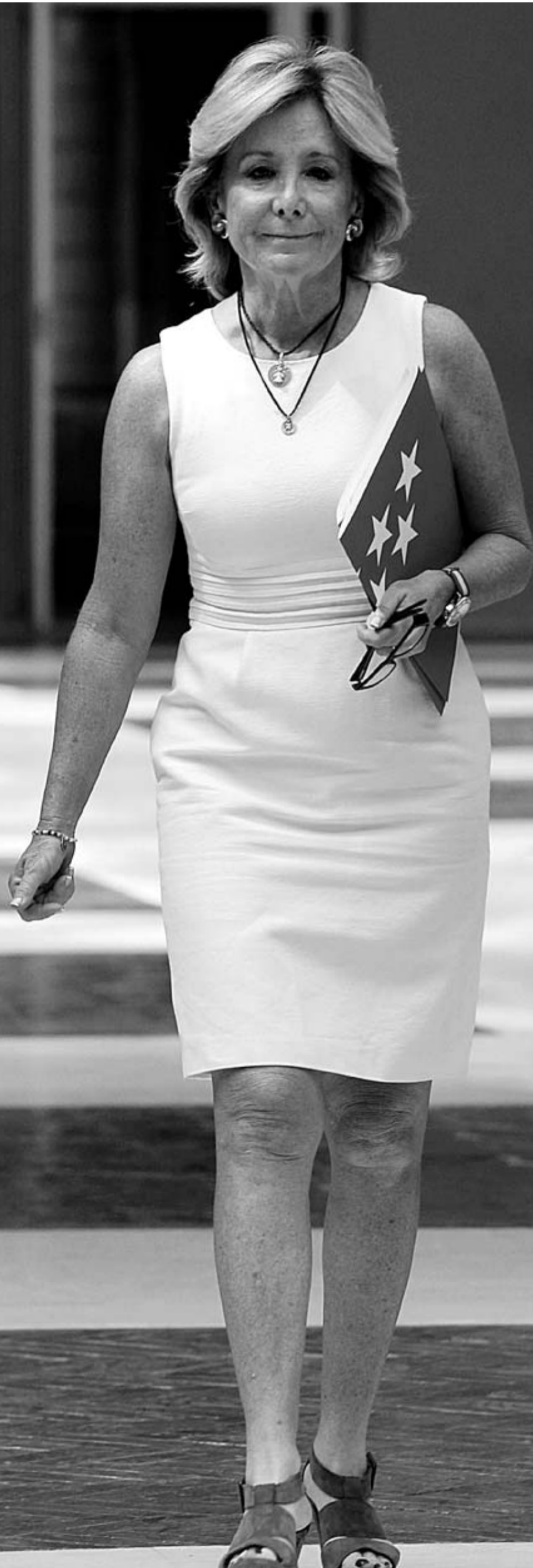
Esperanza Aguirre llegando ayer a la sede de la Comunidad de Madrid.