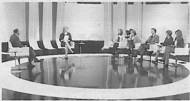
Rubalcaba, en un momento de la entrevista de ayer.

Rubalcaba advirtió que una victoria del PPDG liderado por Alberto Núñez Feijóo en las próximas elecciones gallegas del día 21 de octubre supondría dar "barra libre" a las políticas del presidente del Gobierno, Mariano Rajoy, y restó importancia a lo que él se juega en estos comicios como líder del PSOE. "Yo no me presento", sentenció. Para el líder del PSOE lo que se "dilucida" en estos comicios es el respaldo que los ciudadanos darán a las políticas del Ejecutivo central y recordó que antes de convocar elecciones anticipadas el presidente de la Xunta "vino a pedir permiso" a Rajoy. "Los ciudadanos van a votar si siguen o si cambian. Los gallegos tienen la oportunidad democrática por excelencia de votar y cambiar la política del PP si no les gusta. Respecto a los comicios en el País Vasco, el líder nacional de los socialistas elogió el trabajo desarrollado por el lehendakari al frente del Gobierno vasco al que llegó con "tres retos como eran la situación económica de crisis, la falta de libertad y los problemas de convivencia que él ha sabido superar. Si no llega a ser Patxi López, las cosas hubieran sido más difíciles", ha recalcado. Por tanto nsentenció: "Patxi, misión cumplida". >EFE