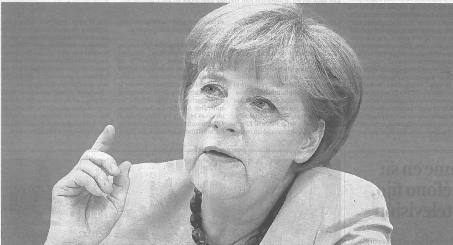
La canciller alemana, Angela Merkel, durante el encuentro con los medios de comunicación alemanes que celebró ayer en Berlín.

"Todo el mundo está de acuerdo en que tenemos una normativa demasiado frondosa, compleja y que, a veces, desconcierta totalmente a los ciudadanos, y por ahí vamos a avanzar", señaló Arias Cañete, quien afirmó que incluso se está analizando la puesta en marcha de leyes básicas. >E.P.