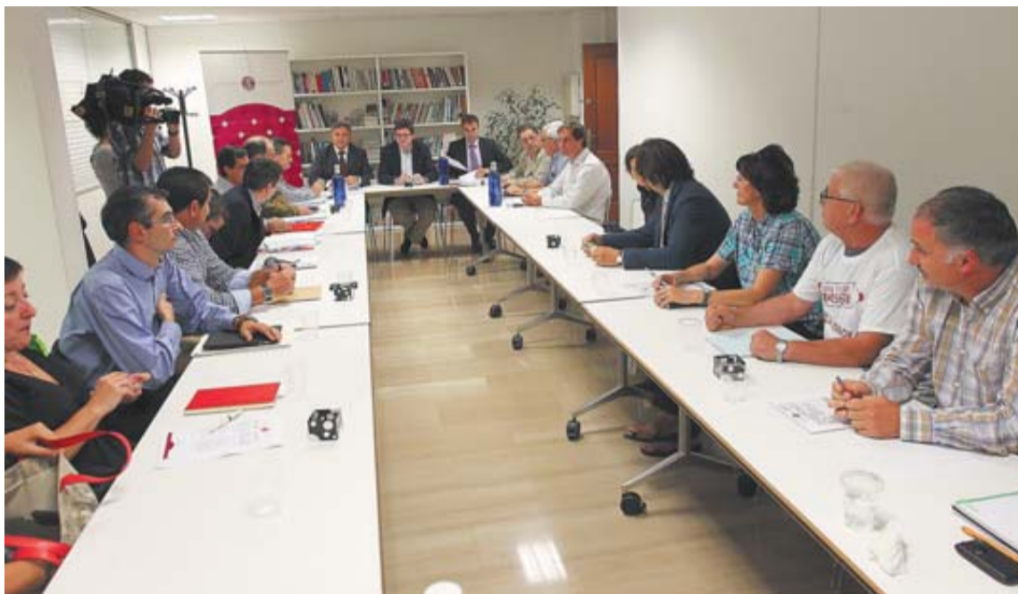
Los miembros del Consejo Escolar, ayer, en su primera reunión plenaria este curso.