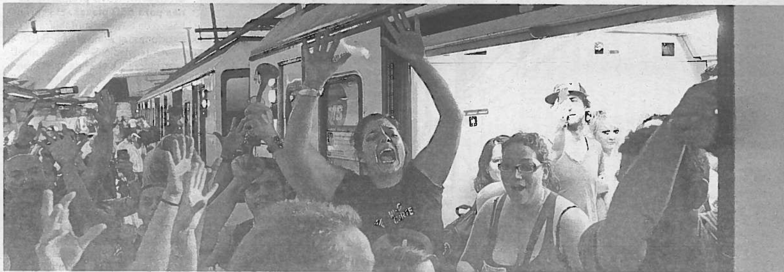
Una multitud de personas, trabajadores del sector de los transportes públicos, interrumpió ayer el servicio de la línea 1 del Metro de Barcelona.