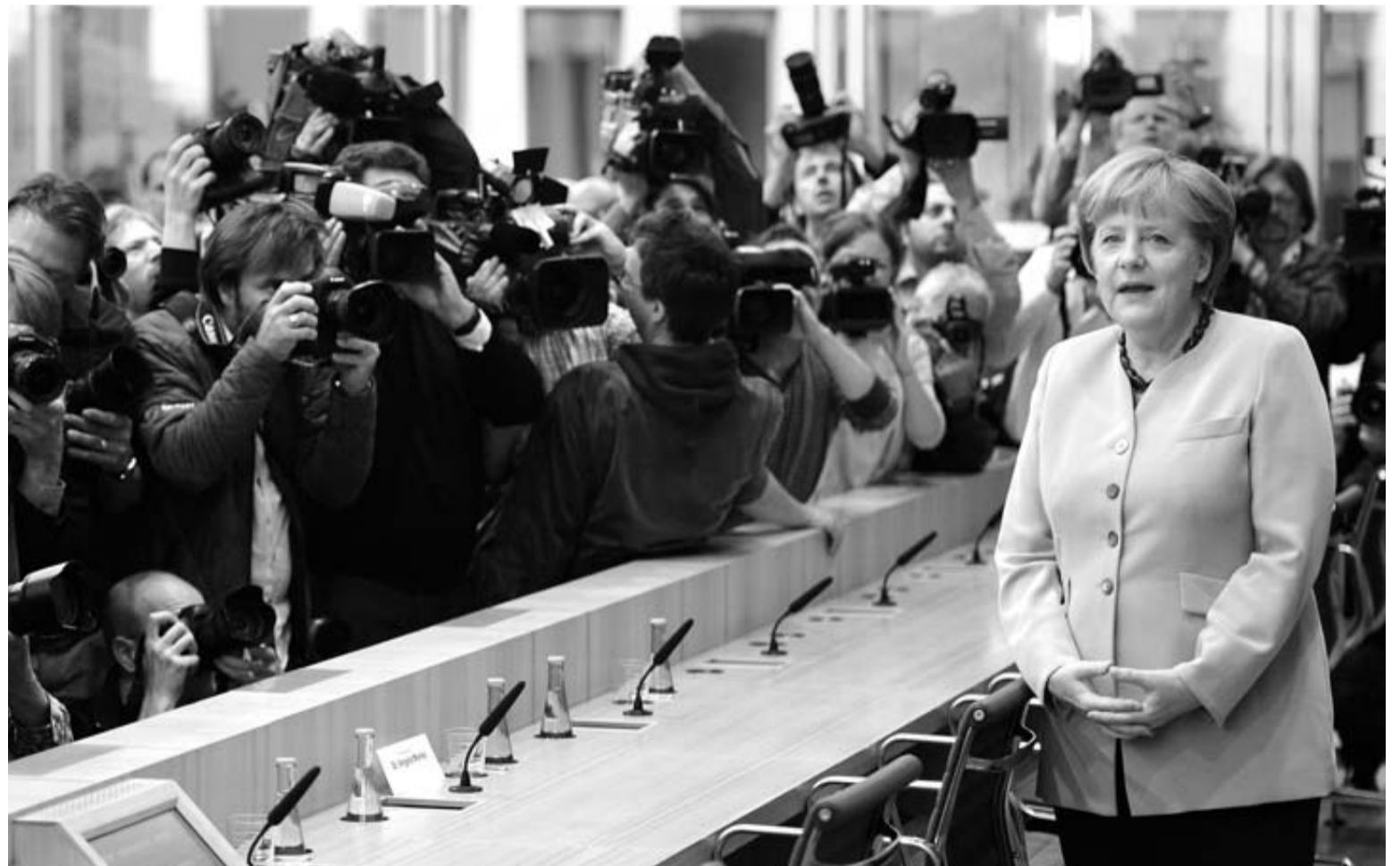
La canciller alemana, Angela Merkel, es fotografiada antes de comenzar la rueda de prensa que ayer ofreció en Berlín.

La ralentización, a la que se opone Francia, supone un importante peligro para España, que no podrá aprovechar la recapitalización directa de las entidades hasta que el nuevo organismo empiece a funcionar. Alemania paró la unión bancaria porque no comparte la propuesta de Bruselas, que pretende que el supervisor vigile todas las entidades, mientras que Berlín reclama que se cione a las de carácter sistémico.