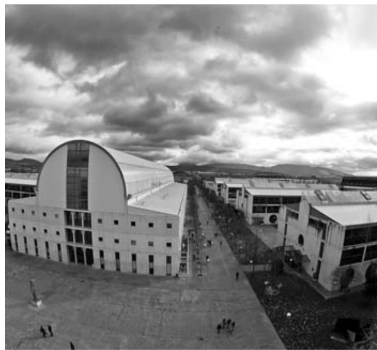
Vista de archivo del campus de la UPNA.

La UPNA ha puesto en marcha desde el 18 de enero un programa de reuniones informativas con estudiantes interesados en participar en estos programas de movilidad internacional. En estos