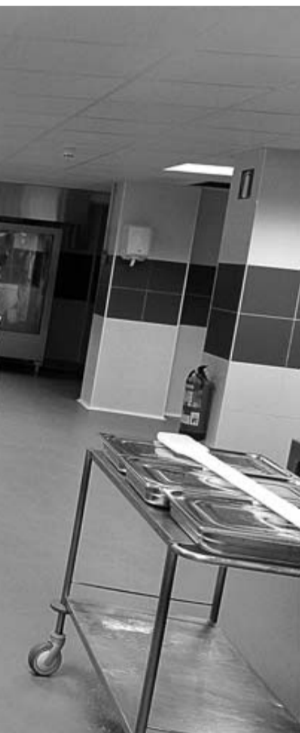
Imagen del interior de las nuevas cocinas del Complejo Hospitalario de Navarra, ubicadas junto al edificio de las urgencias infantiles.

Además, la regionalista añadió que "ha habido otros problemas adicionales de otros trabajadores que no han colaborado en que funcione bien".