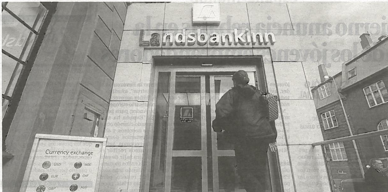
Sede del segundo mayor banco islandés, el Landsbankinn, que se vio afectado por la crisis financiera de 2008 en Europa.