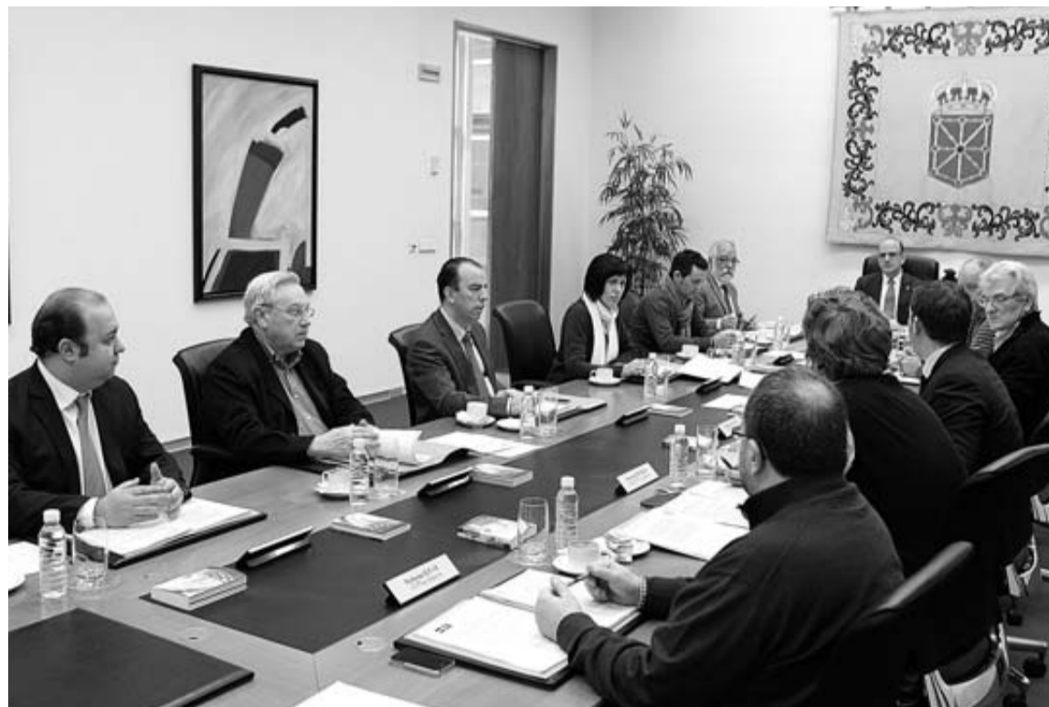
Los miembros de la Mesa y Junta de Portavoces, en una reunión reciente.

Salud ha puesto en marcha un programa de cata aleatoria de los menús que sirve Mediterránea de Catering para comprobar su calidad y cantidad. Varios técnicos del Servicio Navarro de Salud y del Complejo Hospitalario analizaron ayer, por ejemplo, un menú astringente, una dieta hiperproteica y una tercera hipoproteica y pesaron las raciones. El resultado de la prueba, que se seguirá repitiendo, fue 'satisfactorio', según Salud. Además se ha activado un sistema para que la supervisora de cada planta informe sobre incidencias.