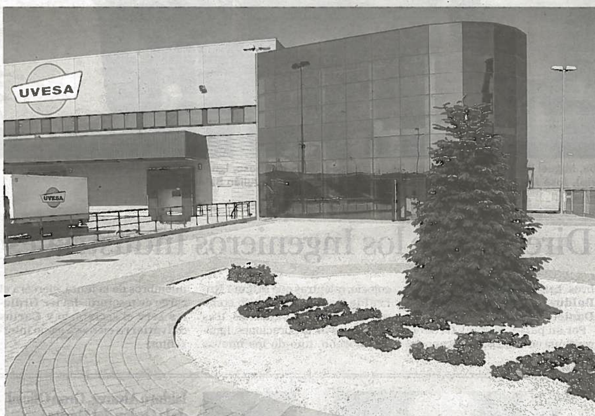
Sede central de Uvesa en Tudela.

CRECIMIENTO La incubadora permitirá abastecer a las plantas de producción que tiene el grupo en diferentes emplazamientos. Entre ellos -y el más cercano- la planta del polígono de Montes del Cierzo de Tudela, con capacidad para procesar 400.000 aves a la semana. Esta planta es una de las grandes apuestas del