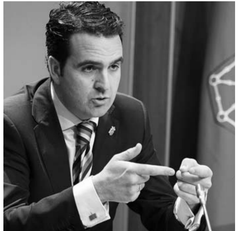
El consejero Iñigo Alli, ayer en la rueda de prensa.

El consejero resaltó, asimismo, que a través del empleo social protegido se contrató a 272 personas y otros 484 perceptores de renta de inclusión tuvieron un puesto de trabajo mediante subvenciones a entidades locales y ONG. Este año, dijo, se pretende aumentar a 800 estos empleos.