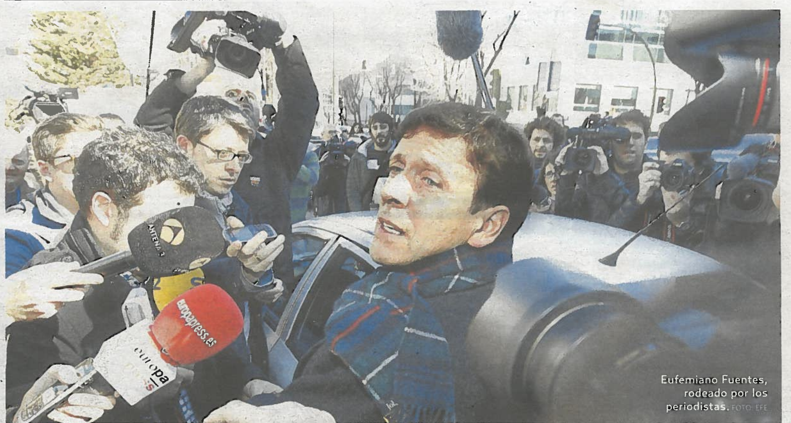
Eufemiano Fuentes, rodeado por los periodistas.