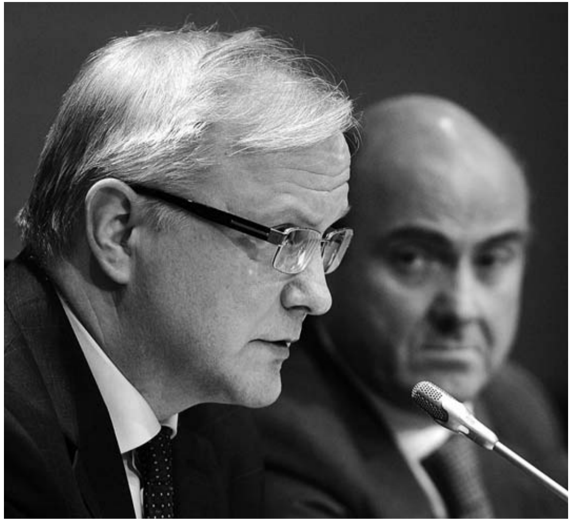
Olli Rehn y Luis de Guindos, en su comparecencia de ayer ante los medios, después de una reunión.

De Guindos se mostró confiado en que, si no se mide a todos los países con el mismo rasero, la presentación de los datos de las administraciones públicas españolas en los próximos días pondrá de manifiesto "el intenso esfuerzo de todas ellas para reducir el déficit". Y añadió que si Bruselas reduce la intensidad de los sacrificios, habrá una "distribución equitativa" de las posibles ventajas. Varias autonomías han reprochado al Gobierno el desigual reparto que se produjo cuando la Comisión flexibilizó el