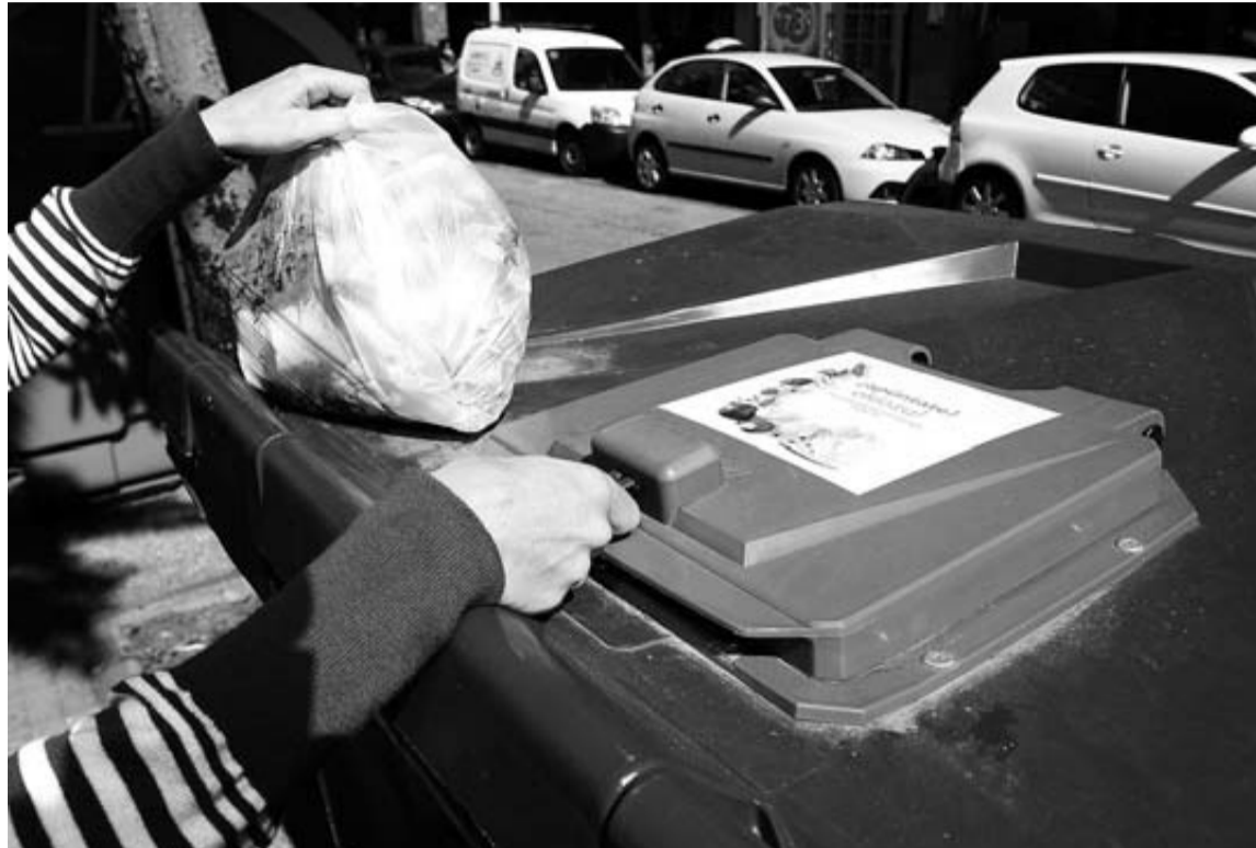
Imagen del quinto contenedor en el barrio de Amara, en San Sebastián.