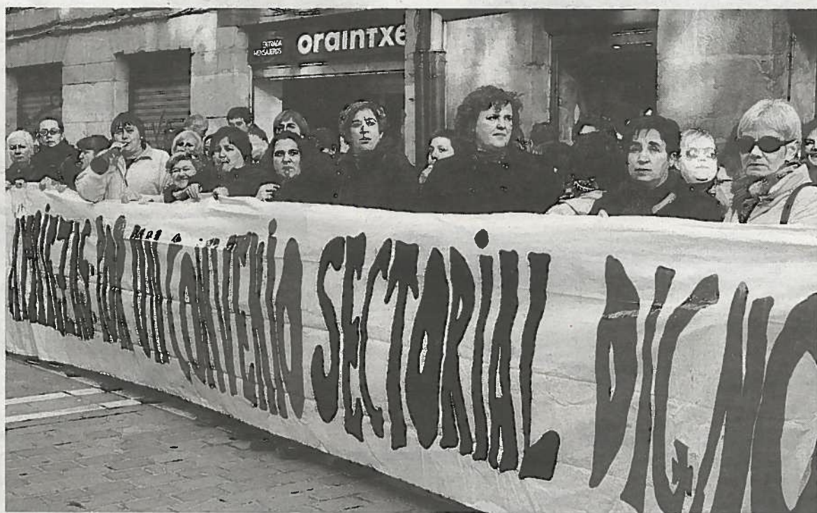
Concentración del sector de las limpiezas, que se celebró en el Tribunal Laboral.

UPTA-UGT criticó que las administraciones, "en lugar de adoptar soluciones dirigidas a la reforma y mejora del transporte por carretera, han agravado la situación con una continuada subida de impuestos que cargan el precio de los combustibles y el resto de los costes del sector". En este sentido, remarcó que en los próximos días se comienza la tramitación de la nueva Ley del Transporte Terrestre que "intenta avanzar en una total desregulación del transporte ligero". "Esto solo puede crear más competencia desleal y producir más cierres", advirtió. >E.P.