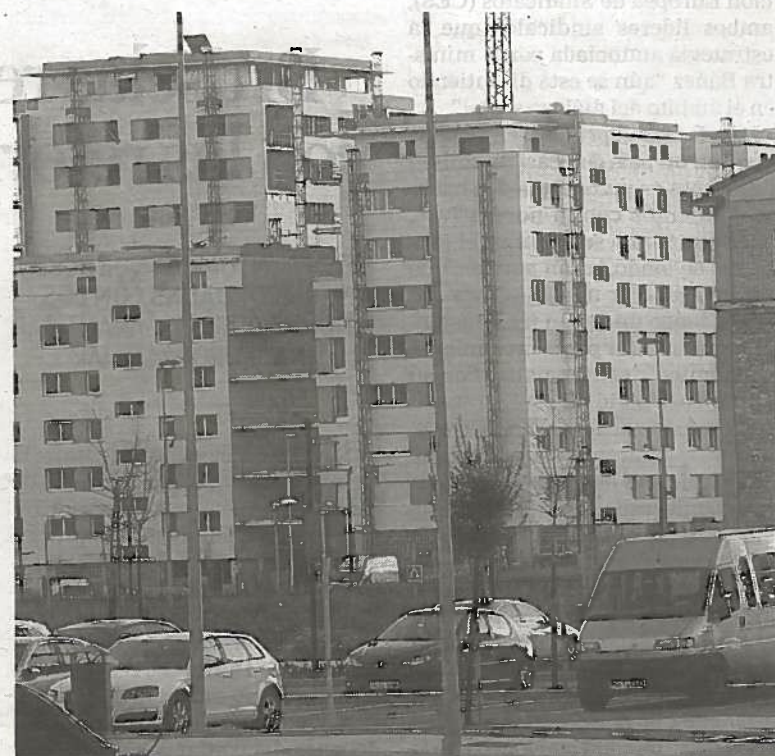
Viviendas en construcción en el barrio pamplonés de Lezkairu.

Las comunidades de Andalucía y Madrid fueron las que registraron un mayor número de hipotecas constituidas sobre viviendas durante el pasado mes de noviembre, con 3.522 y 3.050, respectivamente. >E.P.