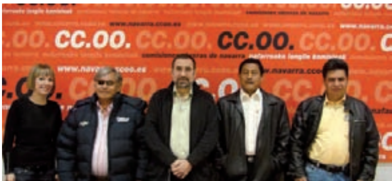
Sindicalistas de la CGT de Perú visitaron CCOO de Navarra

CCOO ejerció de “cicerone” de los representantes peruanos y en la agenda se marcaron reuniones con las federaciones, la Asesoría jurídica del sindicato, una visita al Tribunal Laboral, encuentros con secciones sindicales; así como distintos empresarios para conocer sobre el terreno el marco de relaciones entre los distintos agentes sociales de Navarra.