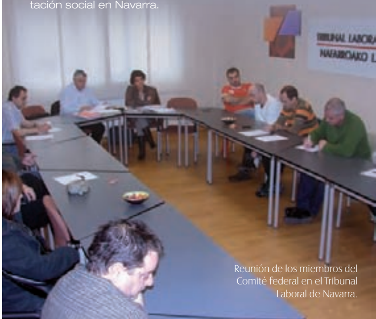
Reunión de los miembros del Comité federal en el Tribunal Laboral de Navarra.

En este contexto, la Federación de Industria se ha reafirmado en la validez de la campaña de información y movilización que se acordó en la Ejecutiva de CCOO de Navarra por la defensa del puesto de trabajo, donde se persiguen tres objetivos: Informar sobre la coyuntura de crisis actual; poner en valor la movilización por la defensa del empleo y la protección social y reclamar la activación de las mesas de concertación social en Navarra.