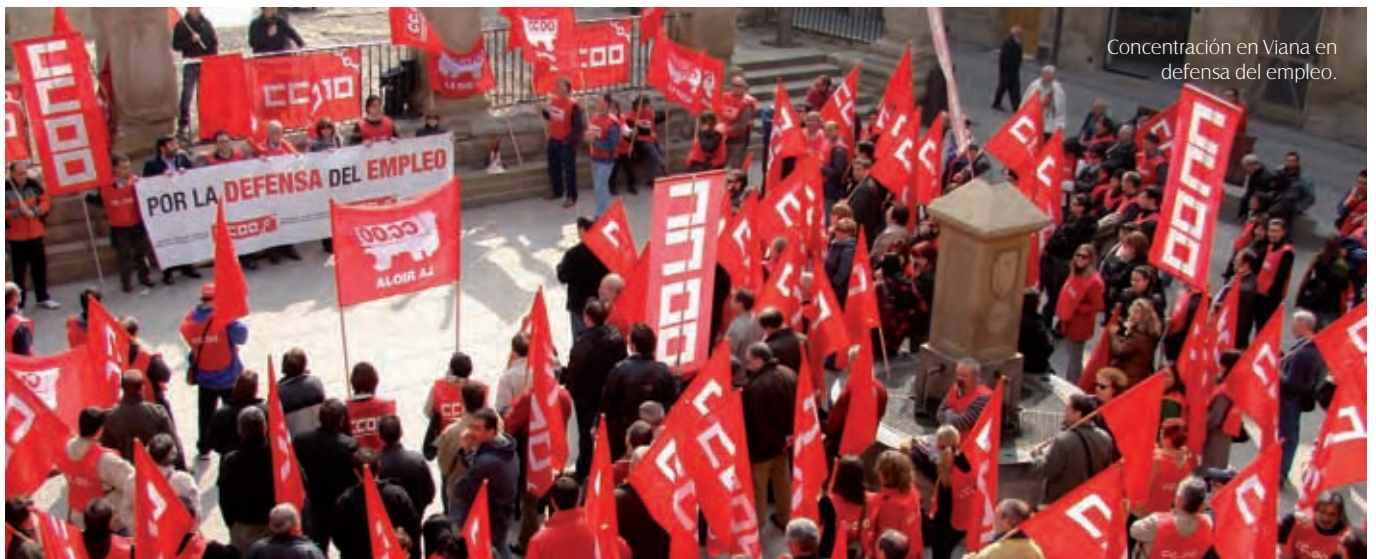
Concentración en Viana en defensa del empleo.

Sin embargo, y pese a que la Fiscalía había solicitado su estimación, el Juzgado de lo Social ha desestimado la demanda interpuesta contra LAB; ante lo que CCOO ha mostrado su discrepancia legítima, manifestando su intención de recurrir la sentencia.