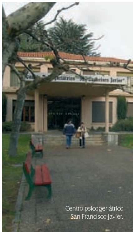
Centro psicogeriátrico San Francisco Javier.

A través de su Federación de Sanidad, CCOO ha mostrado su satisfacción por el anuncio de la dirección del Centro Psicogeriátrico San Francisco Javier, de la puesta en marcha del anteproyecto de Plan Director para el citado centro; un plan cuyo presupuesto ya aprobó el Parlamento foral en 2008 (en concreto, 500.000 euros para el estudio y