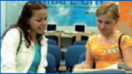
El crecimiento en el número usuarios de Anafe se ha acelerado en la última parte del año.