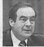
JOSÉ BONO OFRECIÓ UNA CHARLA EN PAMPLONA P. 19