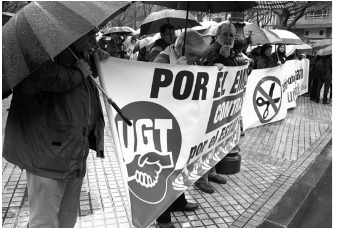
Los empleados públicos secundaron ayer la convocatoria de Pamplona frente al Parlamento foral.