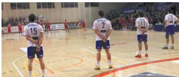
Los jugadores de los dos equipos en el minuto de parón.