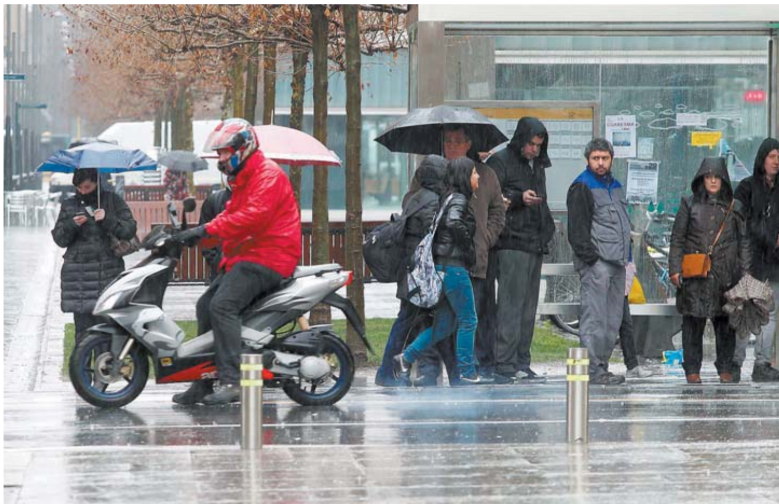
La lluvia cayó con intensidad al mediodía en Pamplona. En la fotografía se recoge un aspecto de la avenida de Carlos III.