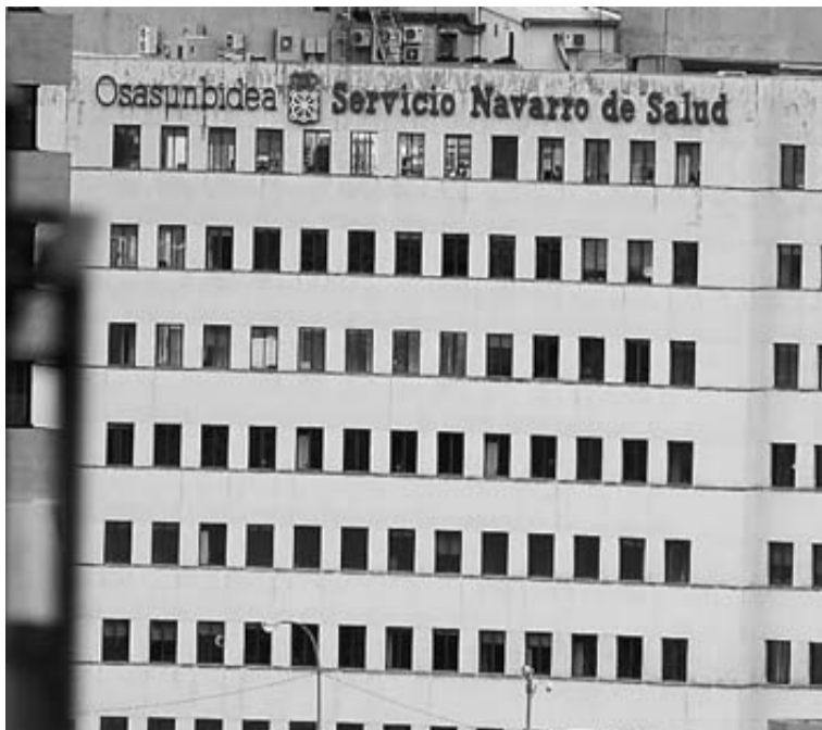
Edificio del Servicio Navarro de Salud, en la plaza Conde Olivetto.

Salud estudia medidas para avanzar en un nuevo modelo de asistencia que pasan por reorganizar el SUR o abrir más horas los centros de salud.