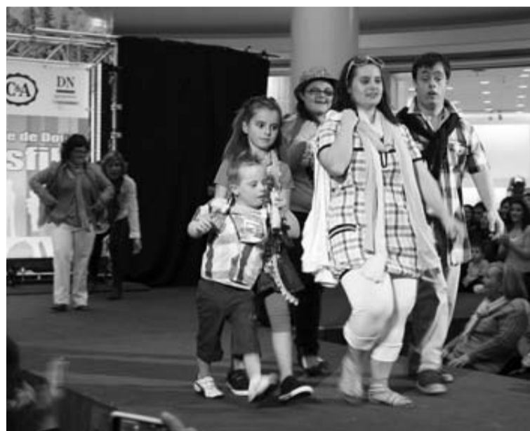
Algunos de los jóvenes que desfilan ayer en La Morea.