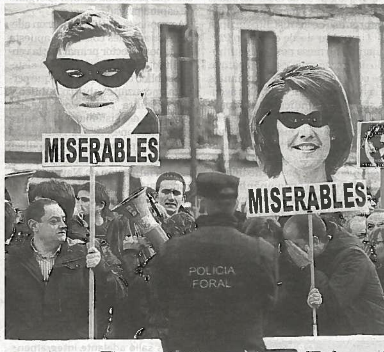
Durante la protesta se lucieron diferentes pancartas.