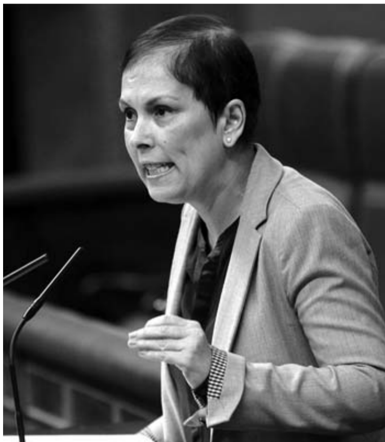
Barkos (Geroa Bai) interviene en la tribuna de oradores.