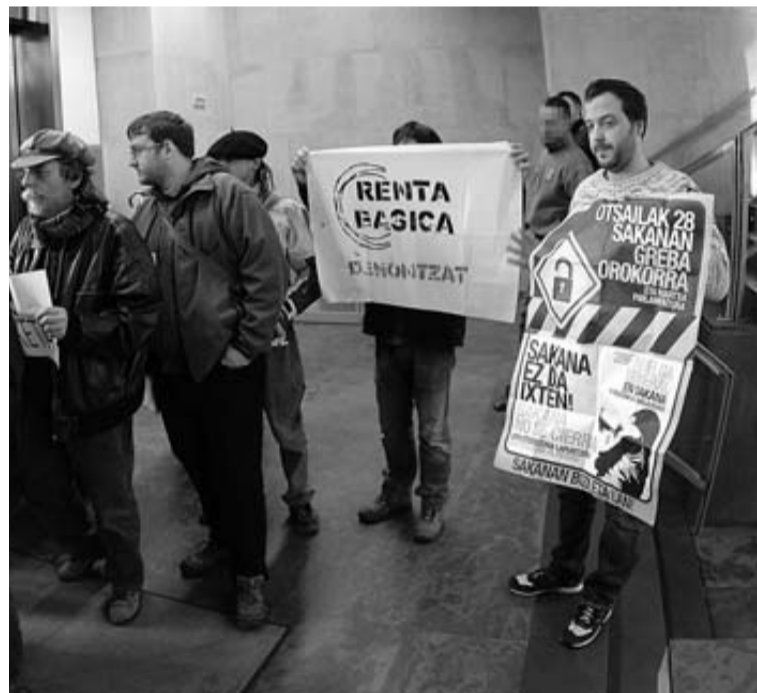
Nueve personas interrumpieron el pleno y fueron desalojadas. CORDOVILLA

Unas 300 personas, convocadas por los sindicatos ELA, LAB, ESK, STEE-EILAS, CGT y CNT, así como por otras organizaciones como Kontuz! y colectivos de parados, se manifestaron ayer junto al Parlamento mientras en su interior se estaba desarrollando el ple-