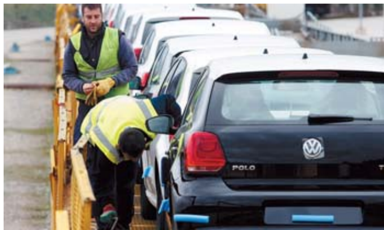
Dos operarios fijan los Polo para ser transportados por tren.

El comité volvió a reclamar un segundo modelo para la planta "que garantice y diversifique la carga de trabajo, dé nuevas oportunidades al centro y permita la renovación de la plantilla".