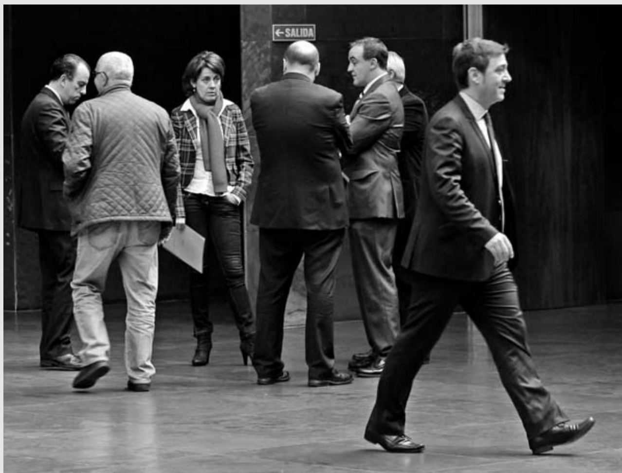
proseguir su camino, como se observa en esta secuencia de imágenes.