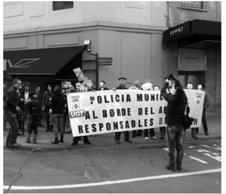
Un momento de la protesta de policías municipales, ayer.

Aseguraron que hay policías que trabajan "con miedo a represalias por hacer bien su trabajo, o a que una actuación en la calle con algún allegado de ciertos políticos o del jefe, derive en expedientes disciplinarios o incluso en imputaciones en fiscalía". González reconoció ser una de los agentes en esta situación. Dijo que "seis policías han sido expe-