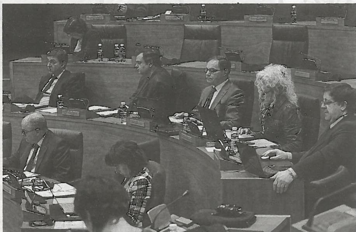
La bancada socialista, en el pleno monográfico celebrado ayer.

A propuesta de Bildu salieron adelante cuestiones como una apuesta firme por el sector primario y la venta directa o la creación de un sistema público de financiación que permita encauzar el ahorro público y que permita poder corregir las carencias del sistema actual, entre otras cuestiones. Aralar NaBai sacó adelante la propuesta para impulsar la construcción de cuatro zonas de industrialización en Navarra para fomentar el desarrollo. El Partido Popular solo concitó el apoyo en dos iniciativas, la referida al blindaje de los puestos de trabajo de los discapacitados y la implantación de dos nuevas asignaturas en las escuelas