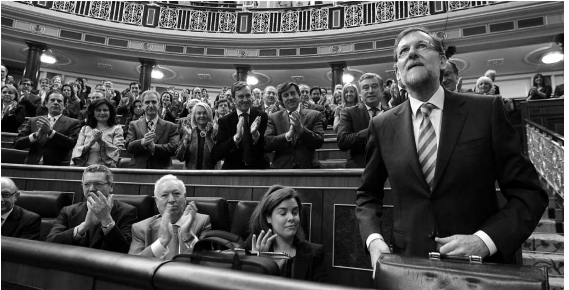
Rajoy recibe al aplauso de los diputados del PP tras finalizar su intervención ante los ministros Montoro, Ruiz Gallardón, García Margallo y la vicepresidenta Sáenz de Santamaría.