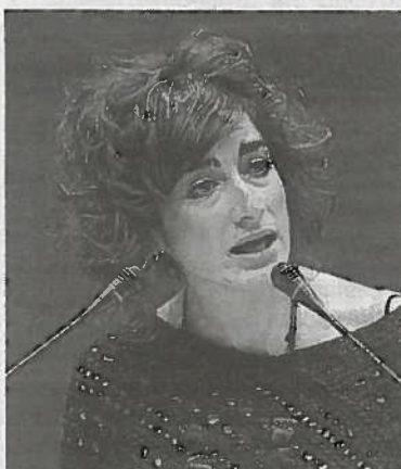
Bakartxo Ruiz.

LA PORTAVOZ DE BILDU CRITICA LA REFORMA LABORAL Y LOS RECORTES PORQUE MANDAN AL PARO A MILES DE PERSONAS