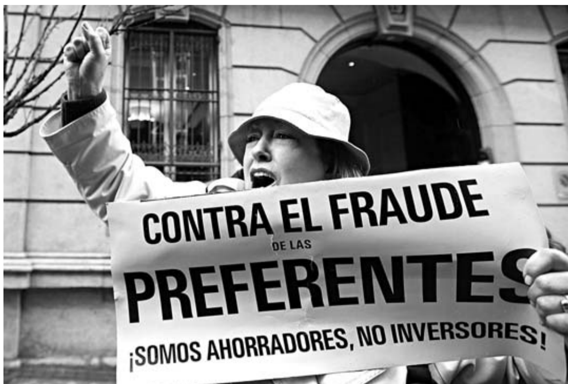
Una mujer afectada por la compra de preferentes protesta frente a la Audiencia Nacional.