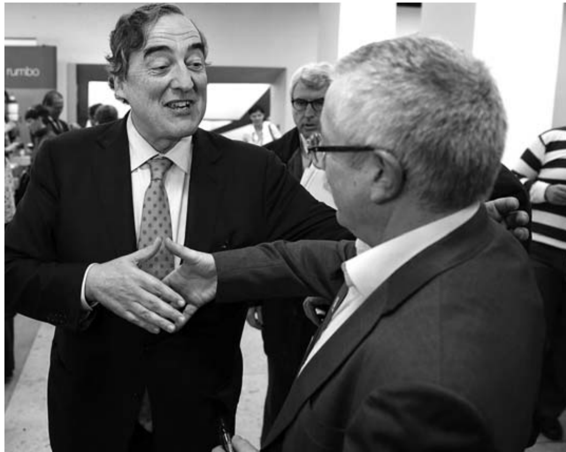
El presidente de la CEOE, Juan Rosell (izq.) saluda a Ignacio Fernández Toxo.

También han disminuido los ingresos por cuota de afiliación un 3,3% respecto a 2010; han subido un 3% sobre 2008 pero no es a precios constantes por lo que recoge el efecto de la inflación. En 2011, últimas cuentas auditadas del sindicato, ingresó 156,8 millones de euros por cuotas.