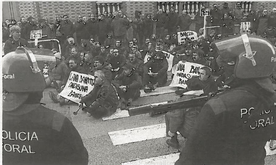
La Policía Foral vigila la protesta antes de que dieran comienzo los altercados.

La consejera dijo que el Gobierno está trabajando también, en colaboración con los agentes económicos y sociales, en la adopción de medidas directas para contratación de personas y en medidas de mejora de empleabilidad para "que las personas en paro tengan más posibilidades". Tras precisar que la plantilla de las oficinas de empleo se incrementará en veinte personas en Navarra, Goicoechea señaló que "en estos momentos debemos analizar fórmulas laborales que incidan en el reparto del empleo y solidaridad", algo que debe hacerse "a través del acuerdo". >E. PRESS