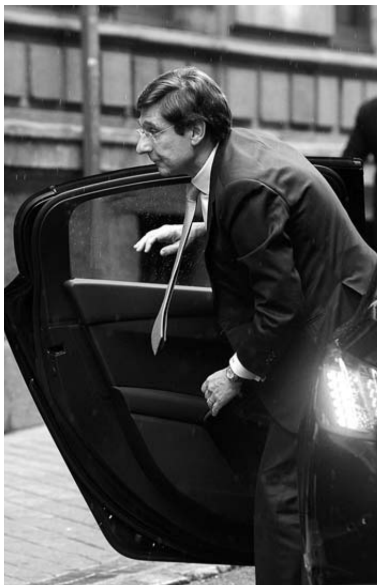
El presidente de Bankia, Ignacio Goirigolzarri, a su llegada.

Y en cuanto a las irregularidades percibidas por el Banco de España en la división inmobiliaria del banco, Bankia Habitat, el presidente de Bankia reconoció