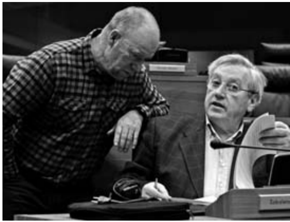
Jiménez y Zabaleta, de NaBai, dialogan.

DE TASA DE PARO JUVENIL Navarra es la novena comunidad autónoma de España con el mayor porcentaje de desempleo entre su población joven. En total son 27.900 jóvenes, de los 52.600 parados de la Comunidad foral.