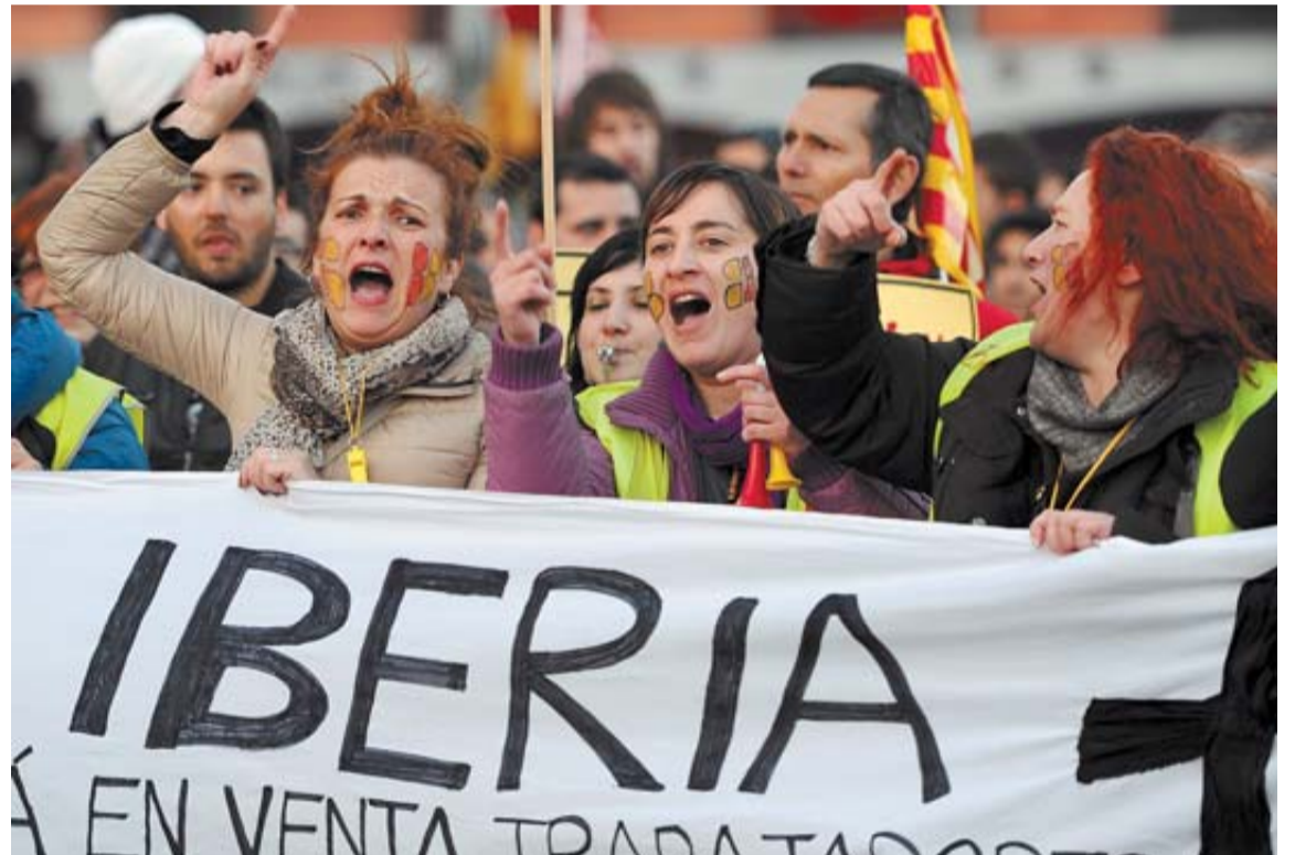
Manifestación de trabajadores de Iberia delante de la sede de la compañía en Madrid.

El mediador, cuya designación ha de ser formalizada ahora ante el Servicio Interconfederal de Mediación y Arbitraje (SIMA), es crítico con la actual reforma laboral, contra la que firmó un manifiesto en abril de 2012 —junto a otro medio centenar de catedráticos— donde estima que tal modificación legal es "contraria al Estado social y democrático de Derecho, potenciadora del poder normativo unilateral del empleador y hostil a la acción colectiva de los sindicatos". Una de las peticiones sindicales es que no se les apliquen los términos severos de