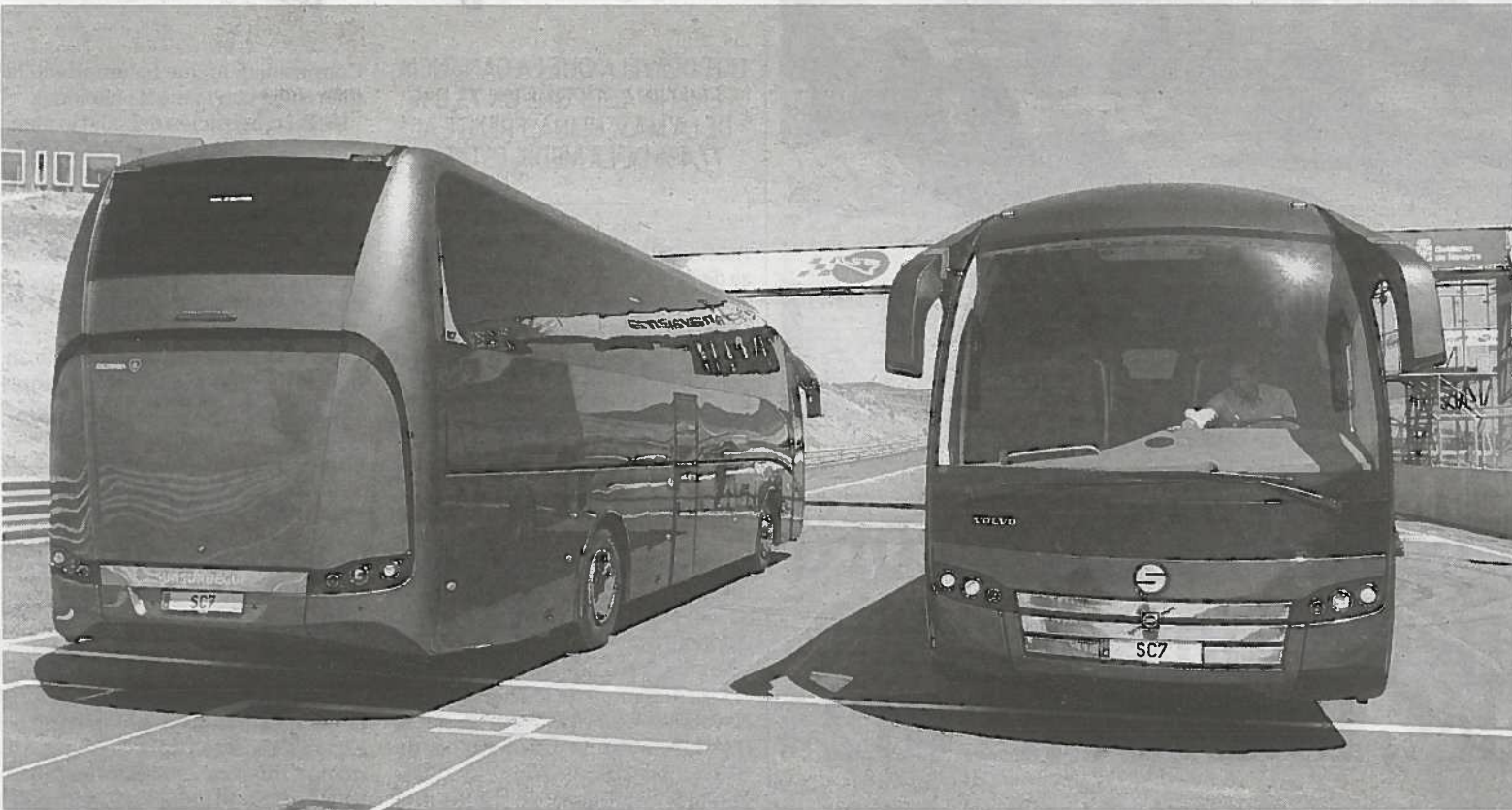
Los últimos autobuses de Sunsundegui, presentados el pasado verano en el Circuito de Los Arcos.

INCREMENTOS LOS CARBURANTES SE SITUAN EN MÁXIMOS HISTÓRICOS P. 39