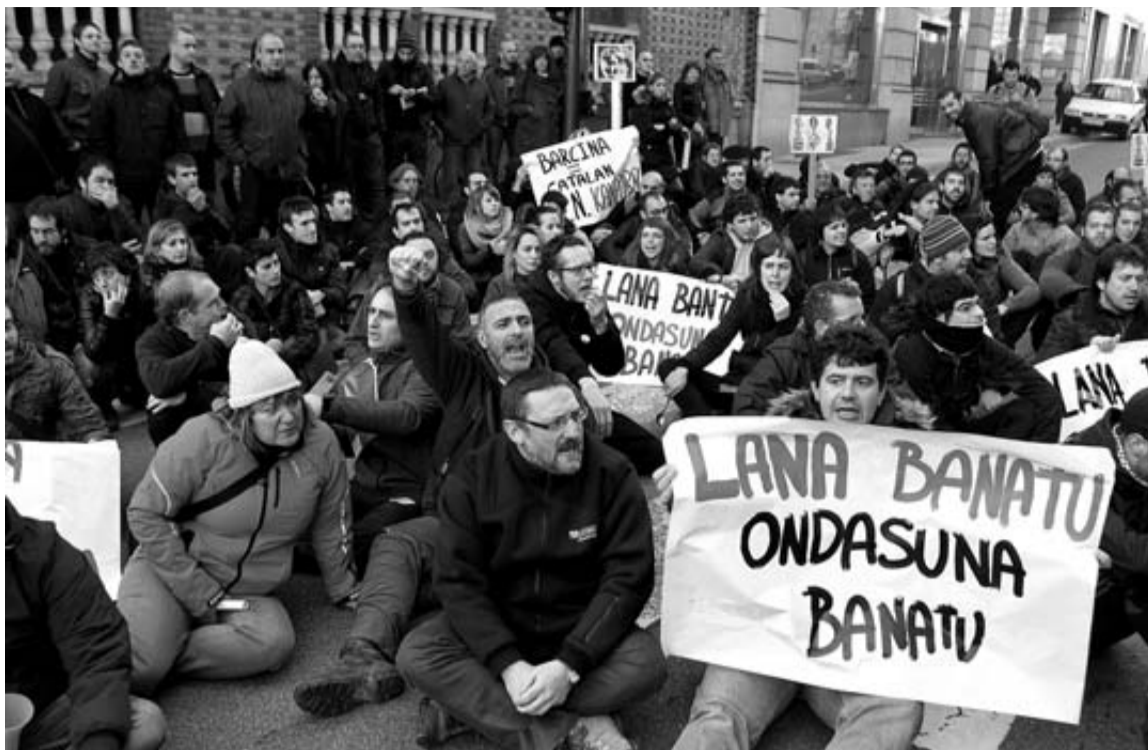
Los manifestantes hicieron una sentada que obligó a cortar el tráfico en las calles anexas al Parlamento. BUXENS