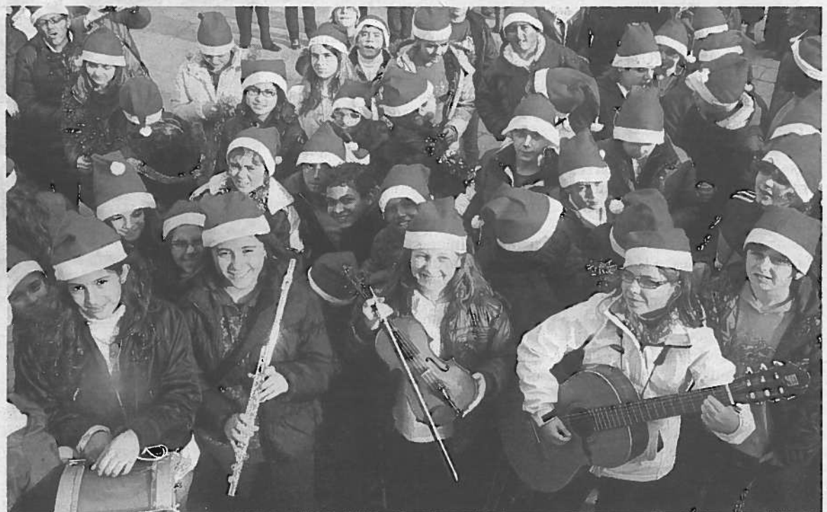
Niños del colegio San Julián, con gorros de Papá Noel, cantan villancicos en la plaza de los Fueros. FOTO: C.J.

Tras el acto, los niños continuaron recorriendo las calles de la localidad. La actividad, que se celebra cada año, forma parte del programa Villancicos en la calle y fue promovida por la concejalía de Educación. >CRISTINA JIMÉNEZ