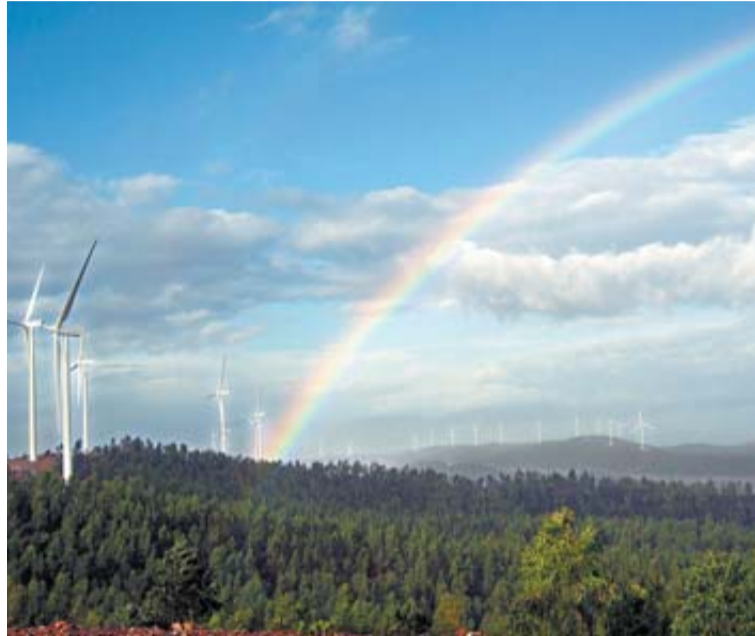
Parque eólico de Iberdrola de El Andévalo (Huelva).

Además, Gamesa se hará cargo del mantenimiento de aerogeneradores que suman unos