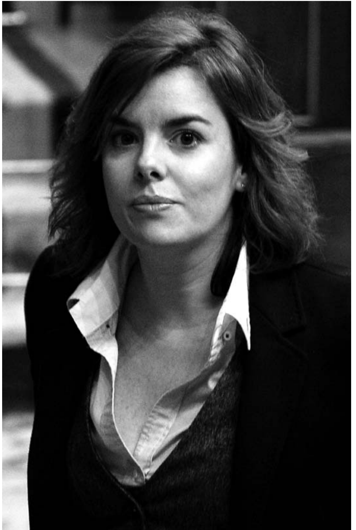
Soraya Sáenz de Santamaría es la elegida para ser vicepresidenta primera, ministra de la Presidencia y ministra Portavoz en el Gobierno de Mariano Rajoy.

Otro de sus frentes será el adelgazamiento del Estado de las Autonomías para evitar duplicidades y solapamientos de instituciones y entidades