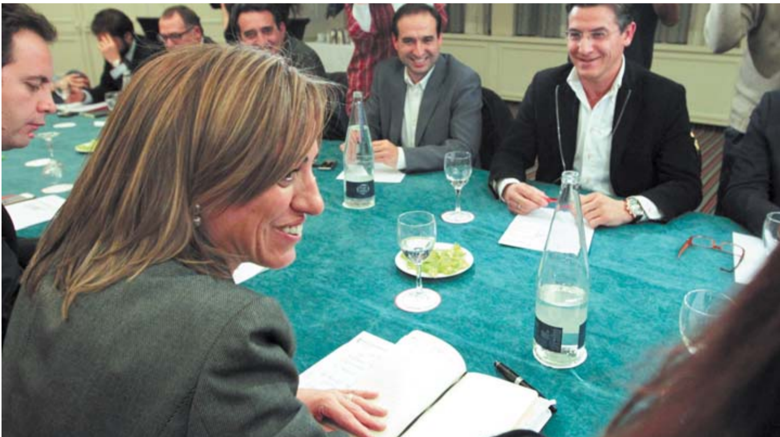
Carme Chacón, ayer en la reunión de los firmantes del manifiesto. Se perfila como aspirante a la sucesión de Zapatero al frente del partido.

Martínez definió el documento como un diagnóstico realista y de "cierta crudeza" de la situación del partido y recaló que su objetivo no es recabar "adhesiones" ni firmas a una "plataforma que no lo es", sino invitar a la reflexión y al análisis".