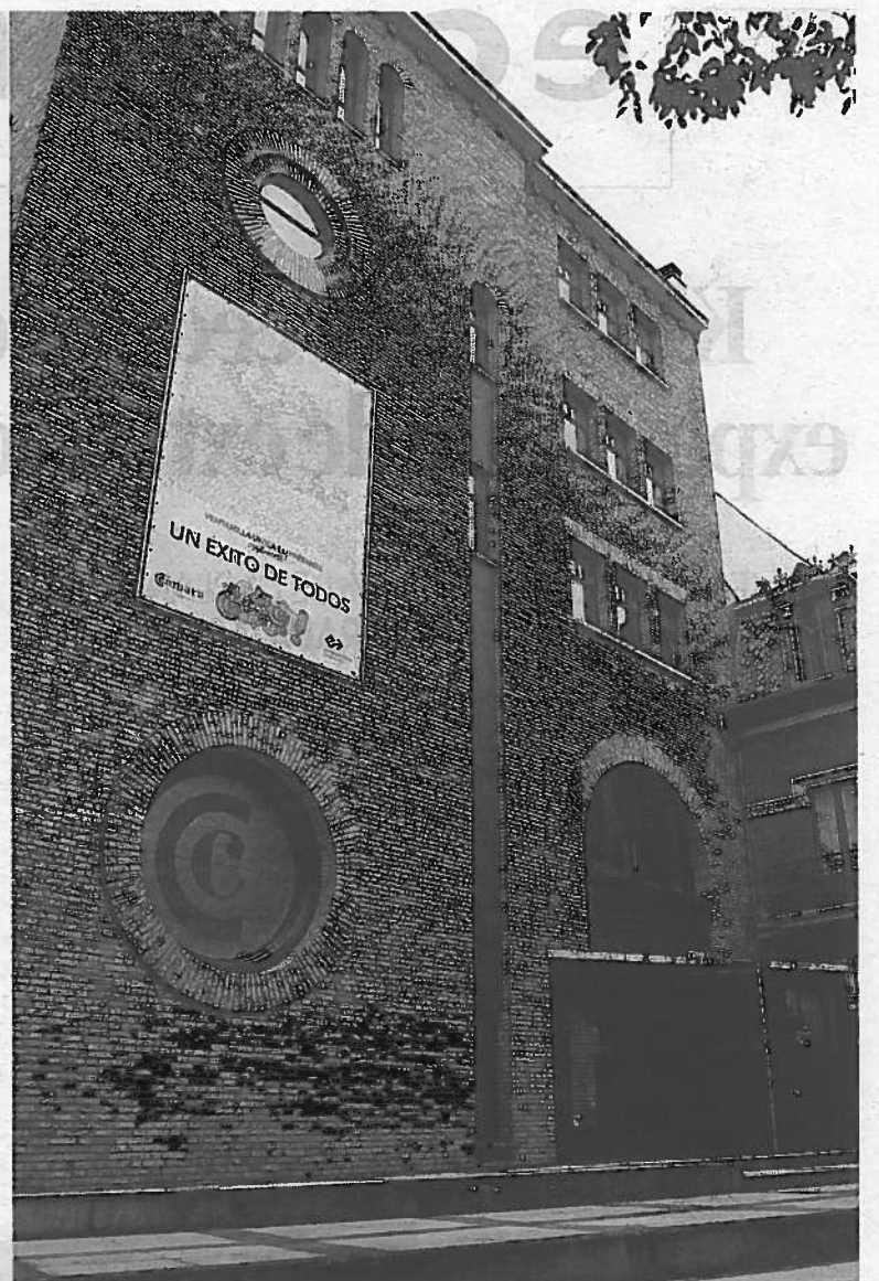
Sede de la Cámara Navarra de Comercio en Pamplona.

Cámara Navarra, tal y como se aprobó en el Consejo Superior de Cámaras, las cuotas voluntarias en 2012 tendrán una cuantía de cero euros, con carácter excepcional, derivado de la crisis económica actual. De esta forma, las empresas adheridas podrán beneficiarse de las ventajas de pertenecer a la Cámara sin coste alguno".