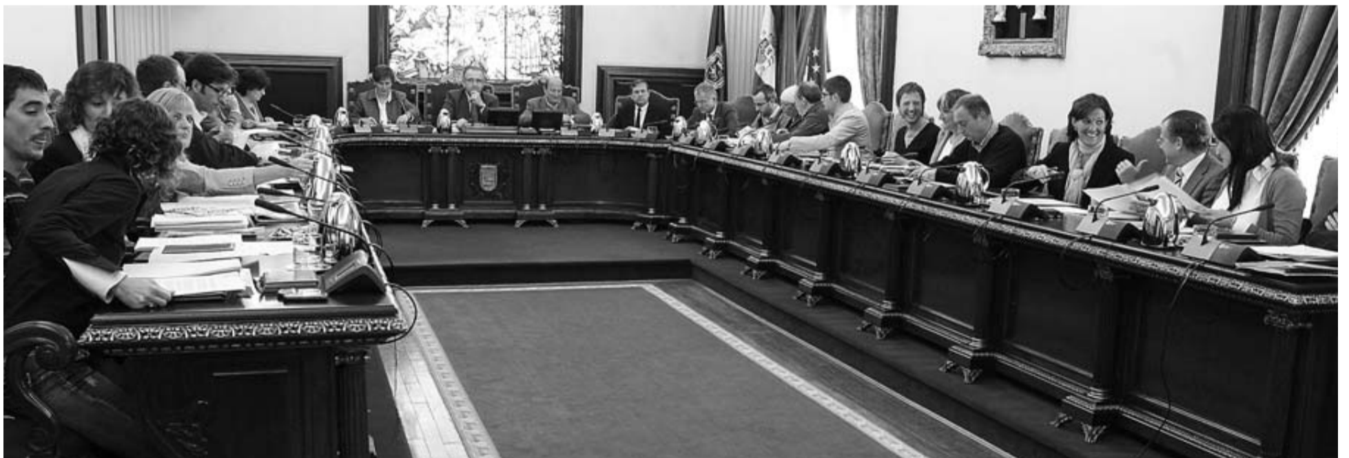
Vista general del salón de plenos del Ayuntamiento de Pamplona, en una sesión celebrada el pasado mes de octubre.

Según Administraciones Públicas, la tabla se ha calculado según una media de lo que ya cobraban los alcaldes de municipios con los habitantes de cada tramo.