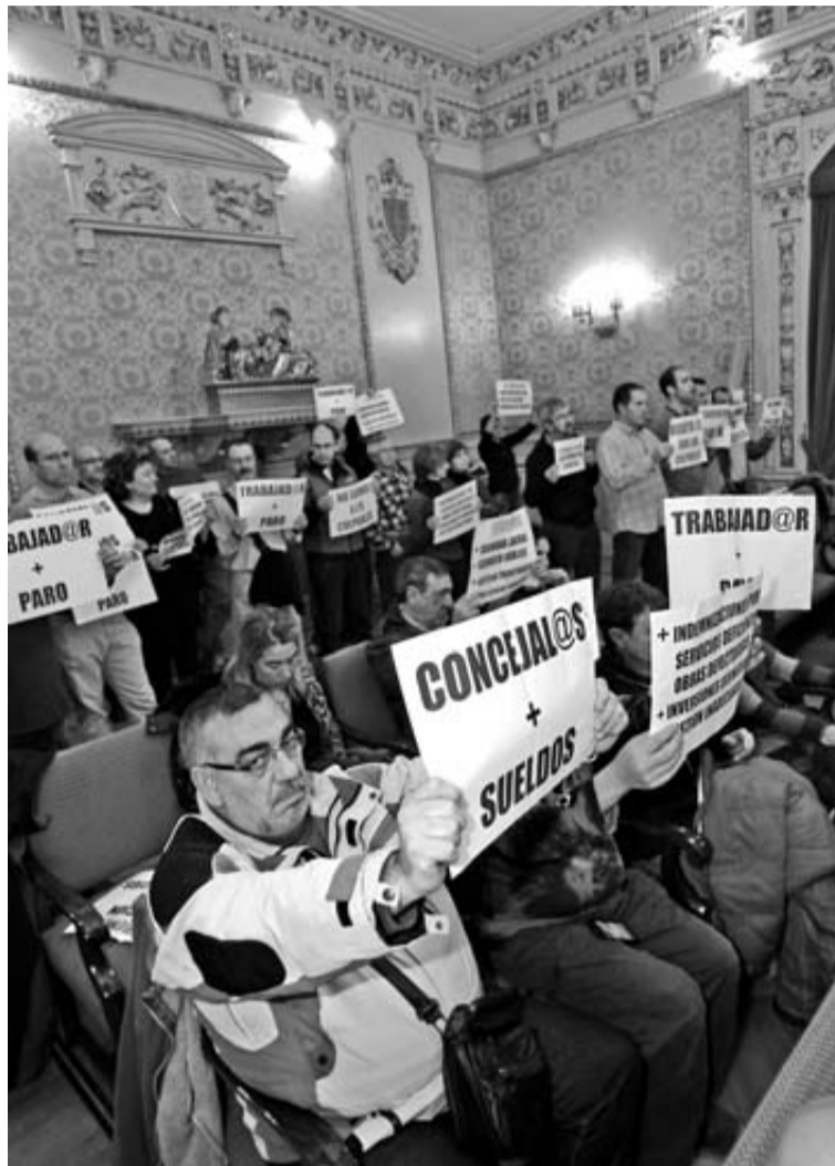
Trabajadores del ayuntamiento protestaron por los despidos previstos. BLANCA ALDANONDO

También se refirió al recorte de personal, que implica 9 empleos menos y la reducción de jornadas. "Es la medida más dura, pero necesaria y hemos trabajado para que el recorte sea el menor posible", señaló. Además,