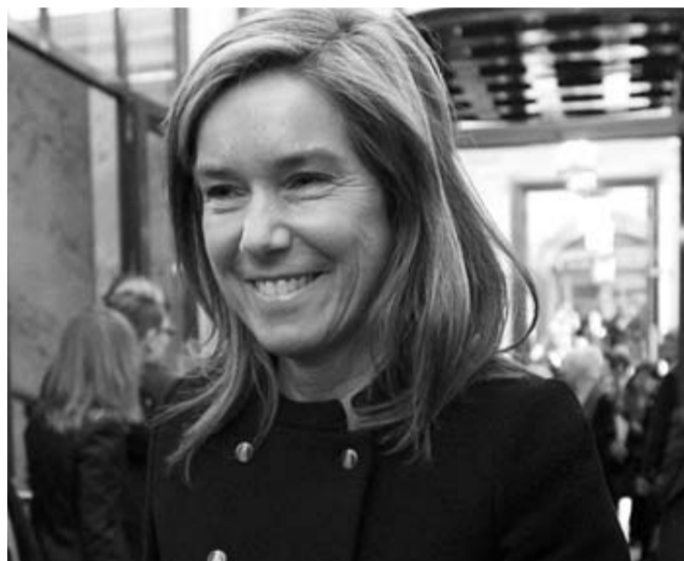
Ana Mato, al frente de Sanidad

Atrás también quedan polémicas como cuando afirmó que los niños andaluces eran prácticamente analfabetos o que estudiaban en el suelo por la falta de pupitres deri-