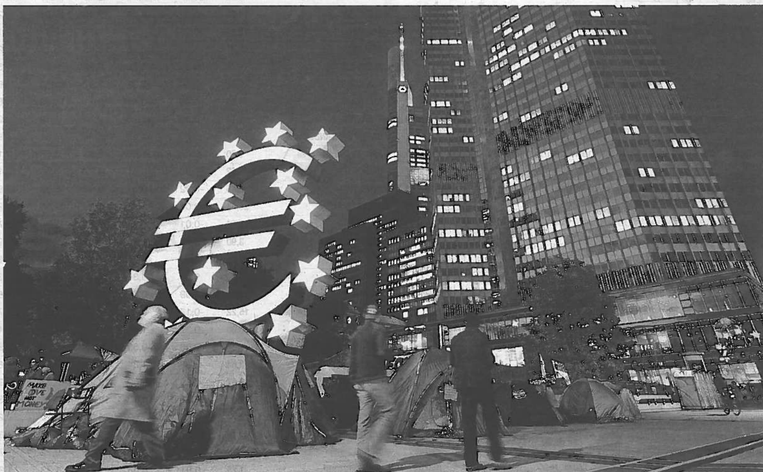
Imagen del pasado 20 de octubre que muestra un campamento de 'indignados' frente la sede del Banco Central Europeo en Fráncfort.