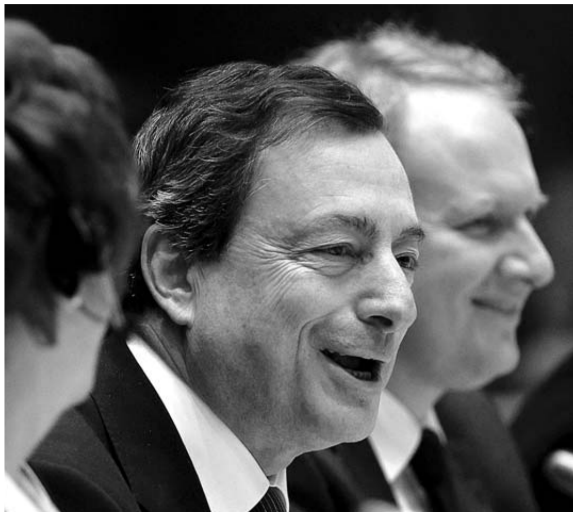
El presidente del BCE, Mario Draghi, el pasado miércoles en el Parlamento europeo.

Pero nunca llueve a gusto de todos y los inversores se replegaron tras conocer los resultados de esta iniciativa. La prima de riesgo de España, o diferencia entre la rentabilidad de las obligaciones a diez años con el bono alemán del mismo plazo, se disparó desde los 304 puntos básicos de primera hora hasta las 334 unidades que mostraba al cierre de las bolsas. También cayeron los mercados de valores. El Ibx 35