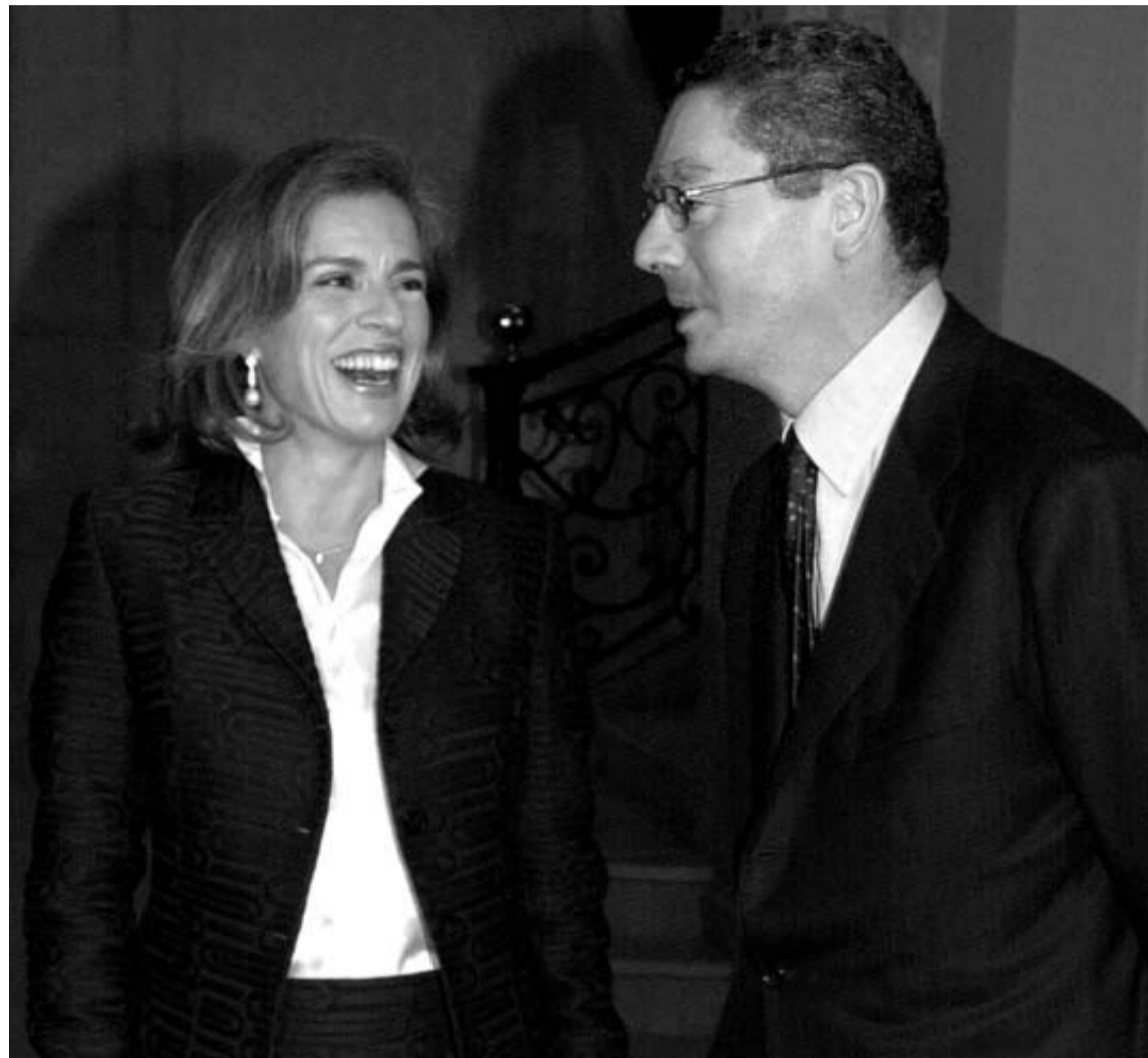
Alberto Ruiz-Gallardón dejará el sillón de la alcaldía de Madrid después de casi nueve años y trashaber sido presidente de la Comunidad entre 1995 y 2003; le sustituirá Ana Botella, esposa de Aznar y concejala desde 2003.

En aquella época tuvo que hacer frente al llamado caso Naseiro .