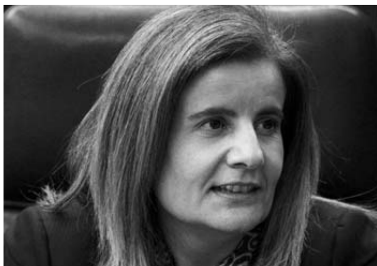
Fátima Báñez, en su escaño la pasada legislatura.

Su nombramiento es el premio a una mujer eficiente y discreta, muy trabajadora -ha echado muchas noches en su despacho del Congreso- y, sobre todo, nada dada a los enredos políticos.