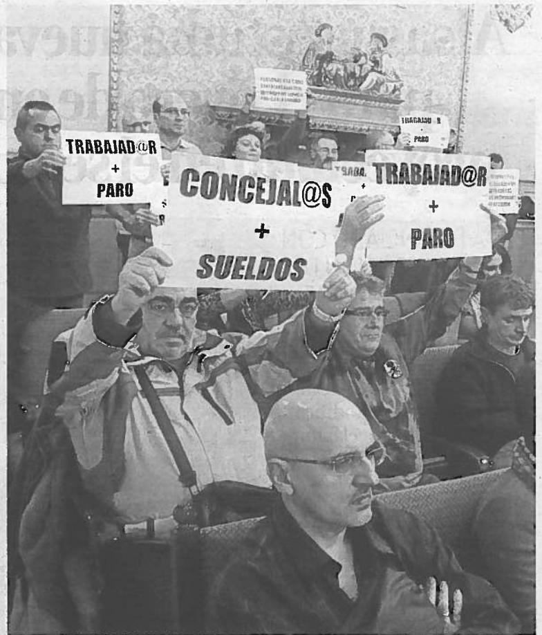
Algunos de los trabajadores presentes ayer en el pleno.

● Millones de euros. Es el presupuesto consolidado que se reparte en: 33,352 millones para el Ayuntamiento, 4,089 millones para la Junta de Aguas y 1,298 millones para Castel Ruiz. En el año 2011 el presupuesto consolidado era de 50,9 millones de euros, lo que supone una reducción del 26,2%.