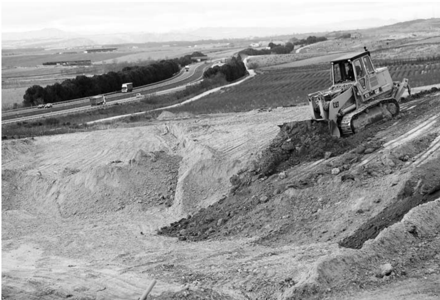
Una retroexcavadora, trabajando ayer en las obras del primer subtramo del TAV, entre Cadreita y Villafranca.

Su esencia es el desarrollo global de la personalidad mediante la participación y el aprendizaje activo de los propios pacientes. Su finalidad primordial es posibilitar que las personas desarrollen al máximo sus capacidades motoras, cognitivas y afectivas.