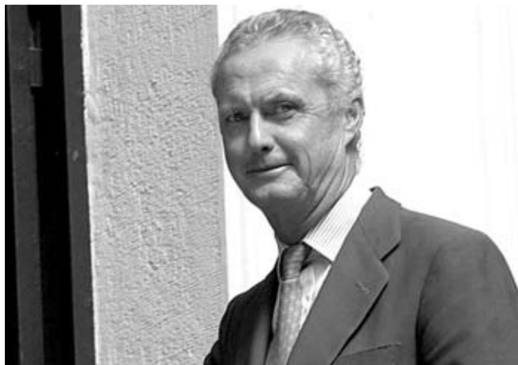
Pedro Morenés Eulate, nuevo titular de Defensa.

Durante esta etapa protagonizó dos hitos: la costosa profesionalización de las Fuerzas Armadas y la supresión del servicio militar obligatorio, la popular 'mili'. Con-