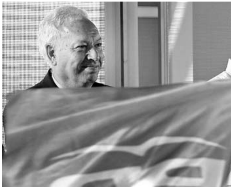
José Manuel García-Margallo, ahora en Exteriores.

El nuevo ministro de Asuntos Exteriores, José Manuel García-Margallo, es el abuelo del Gobierno Rajoy, pero en los felices hábitos presentes, un sexagenario —él tiene 67— en buena forma es una bendición. Y más si dispone, como el interesado, de otra condición también respetable, pero más arriesgada: la de un junior caído en paracaídas en el torbellino político, lo que él, con una pro-