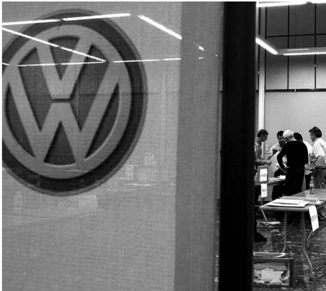
Imagen de la fábrica de Volkswagen en Landaben.

Afirmó que "en 2011 hemos tenido una eventualidad exagerada porque era un año excepcional de producción" pero "estamos comprometidos con un equilibrio y en trabajar por una plantilla estable para una producción estable". En este senti-