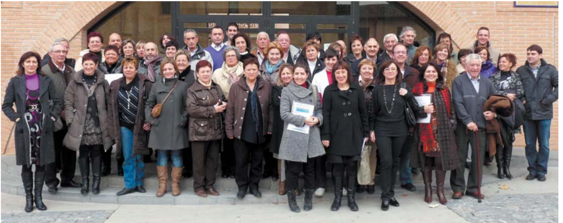
Los firmantes del pacto de conciliación en Mendavia, Lazagurría, Lodosa, Sartaguda y Sesma posan a las puertas del consistorio mendaviés tras la rúbrica del documento.