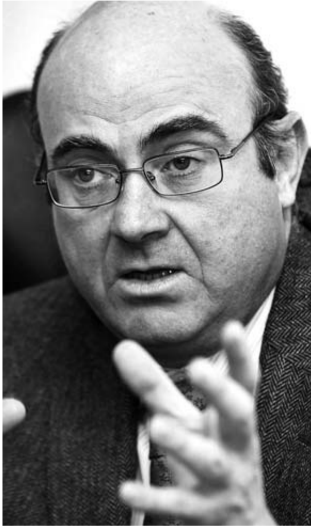
Luis de Guindos.

Entre sus primeros cometidos figurarán, junto a la recuperación de la confianza en la capacidad de España para cumplir sus compromisos fiscales, la culminación de una rees-