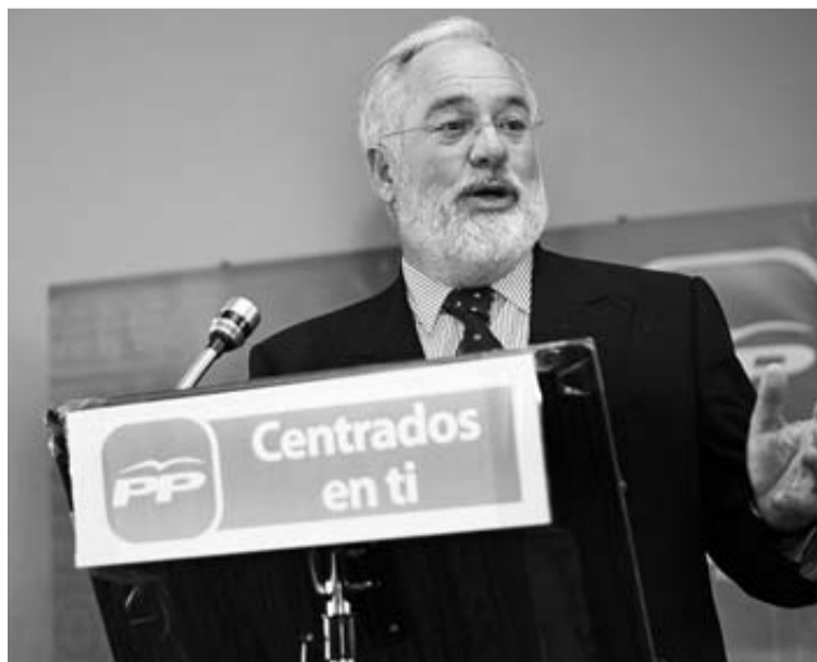
Arias Cañete, en campaña en Estella.

Madrileño, de 61 años de edad, casado y con tres hijos, con fuertes lazos con Andalucía, licenciado en Derecho por la Universidad Complutense de Madrid, abogado del estado y profesor de Derecho, Miguel Arias Cañete ya fue ministro de Agricultura, Pesca y Alimentación en el segundo gabinete de Jo-