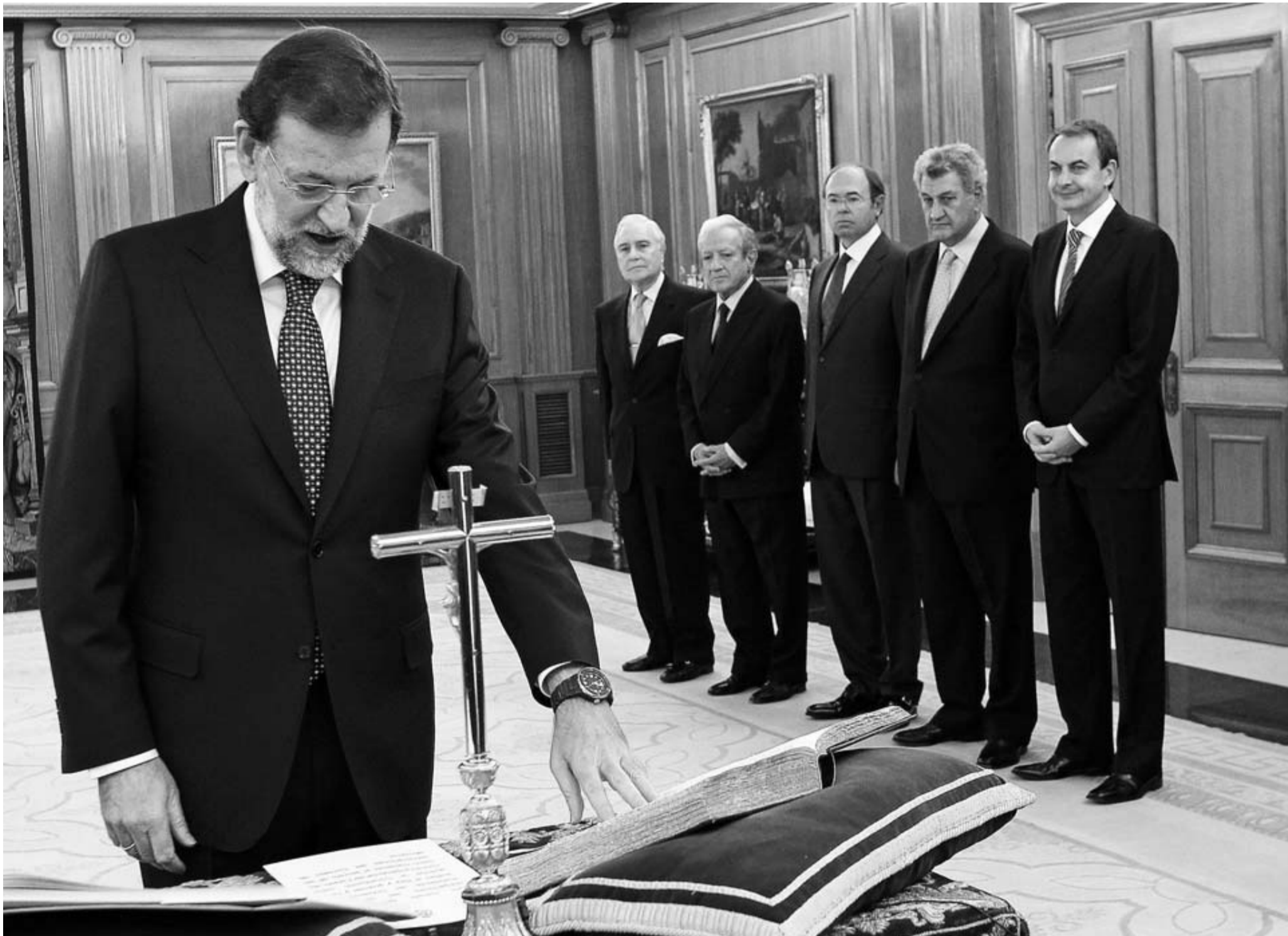
Mariano Rajoy juró ante los Reyes, en presencia, de izquierda a derecha, de Carlos Dívar, presidente del Tribunal Supremo; Pascual Sala, presidente del Tribunal Constitucional; García Escudero, presidente del Senado; Jesús Posada, presidente del Congreso, y Rodríguez Zapatero.