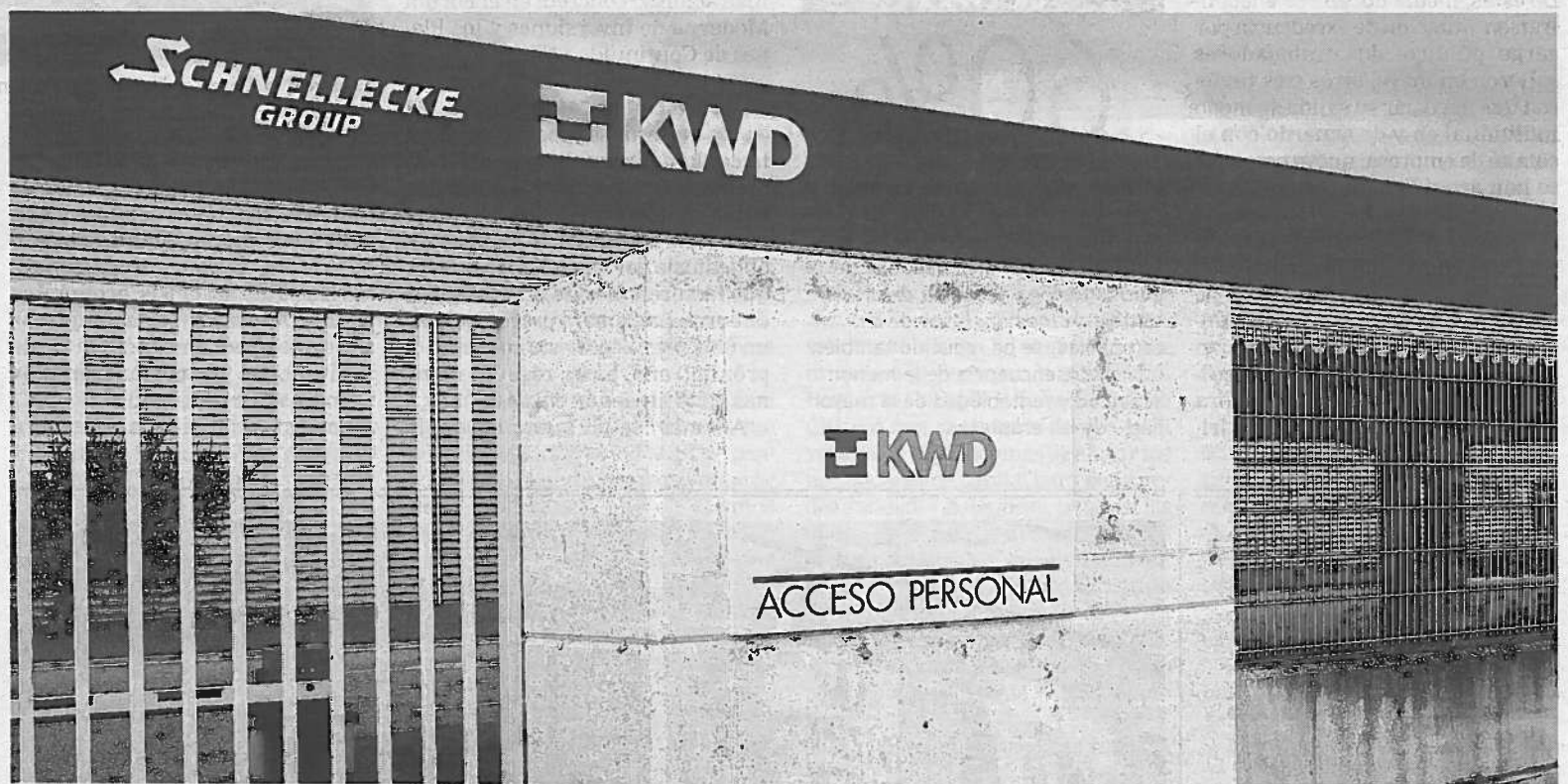
Instalaciones de KWD en el polígono Arazuri-Orkoien.

La próxima reunión entre el comité y la dirección se celebrará el martes 27 de diciembre