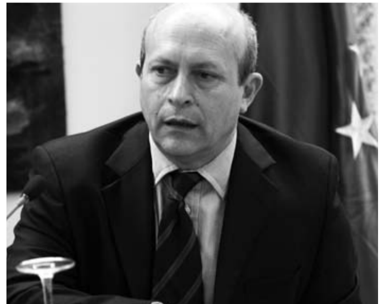
José Ignacio Wert, nuevo ministro de Educación y Cultura.

los primeros años de su actividad política, hoy ha configurado una imagen simpática, sonriente e irónica.