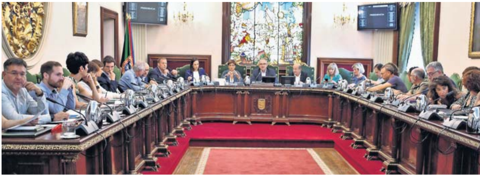
Imagen del pleno del Ayuntamiento de Pamplona en una de las primeras sesiones del mandato.

Uno de los cambios es la reconversión del puesto del técnico de Cultura, "con exigencias de idiomas inglés y francés", para reforzar la promoción y gestión de eventos culturales.