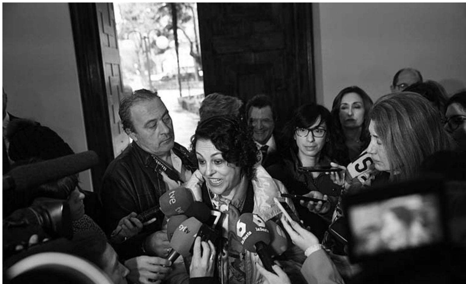
La ministra de Trabajo en funciones, Magdalena Valerio.

Si finalmente el Ejecutivo suspende ese artículo antes de fin de año, como ya ha hecho este Gobierno y el anterior en los dos últimos ejercicios, 2020 comenzaría con la subida del 0,9% anunciada, el nivel en el que previsiblemente cerrará la inflación, según las previsiones de Economía. "En el hipotético caso de que el IPC subiera más", dijo la titular de Trabajo, "se pagará una paga compensatoria a