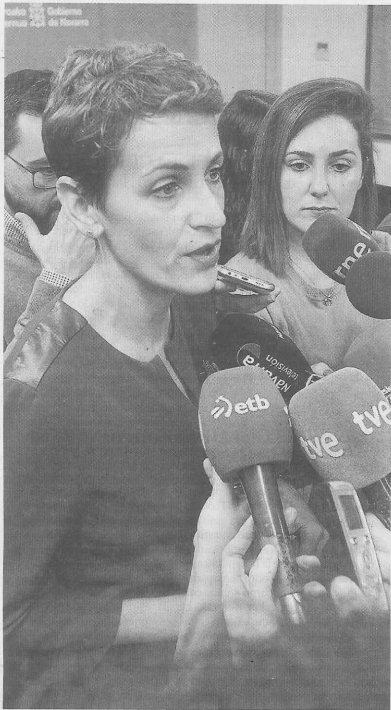
María Chivite, ayer, rodeada de micrófonos.