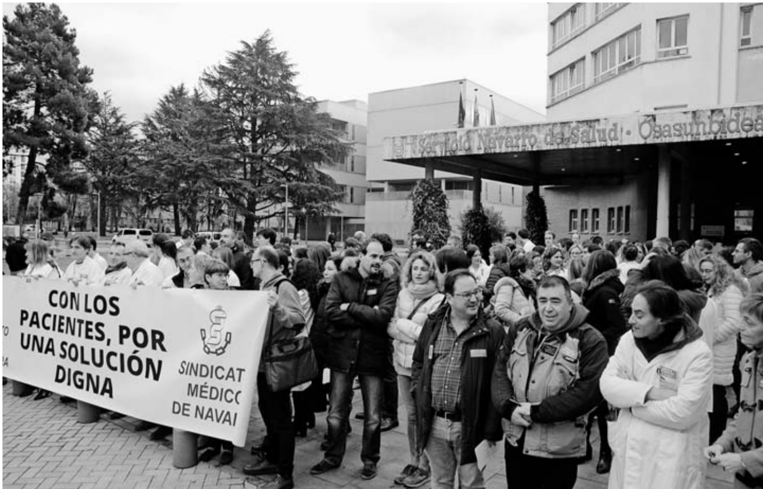
Concentración de médicos durante la huelga que mantuvieron la última semana de noviembre.