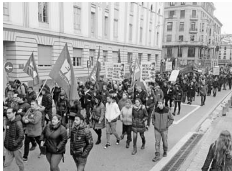
Marcha posterior al acto celebrado en el frontón Labrit.