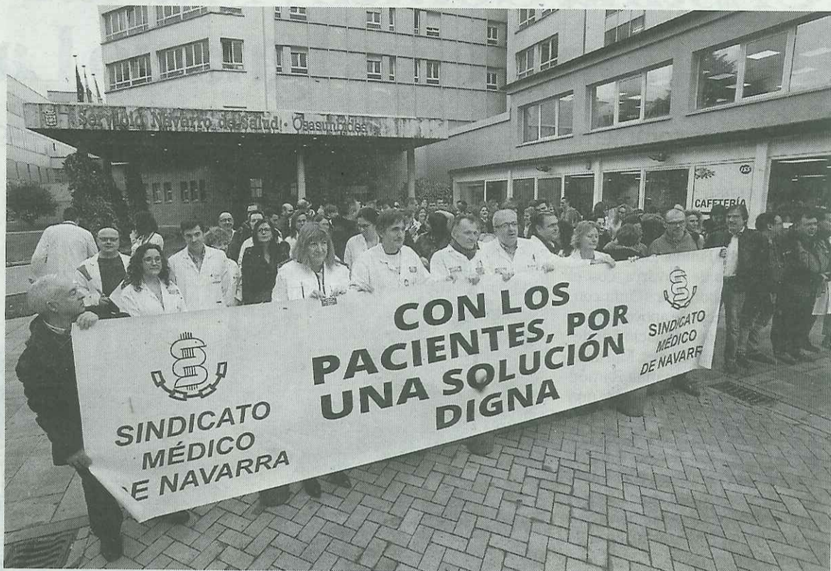
Concentración de médicos en el CHN durante la 4ª jornada de huelga el pasado 28 de noviembre.

● Grupos de trabajo mixtos. Finalmente, entre otras medidas, se pondrán en marcha sendos grupos de trabajo para buscar una "optimización del trabajo médico en Primaria y Atención Hospitalaria", señala el preacuerdo.