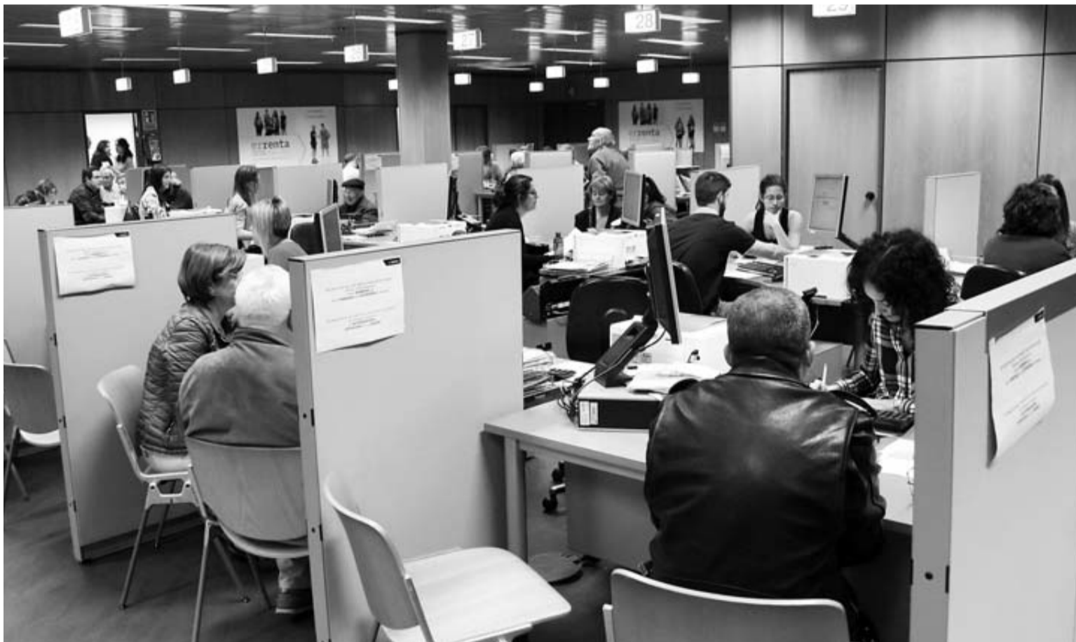
Una oficina de la Agencia Tributaria Estatal.

De los 2.500 millones de euros pagados a Hacienda en 2018, casi el 40% fueron contribuciones a la Seguridad Social. El impuesto sobre beneficios que soporta el sector se ha multiplicado por cinco en un año, hasta los 492 millones de euros, mientras que la tributación autonómica ha supuesto un 21% menos, 263 millones en total. Con todo, el tipo impositivo total fue del 38% de lo ganado.