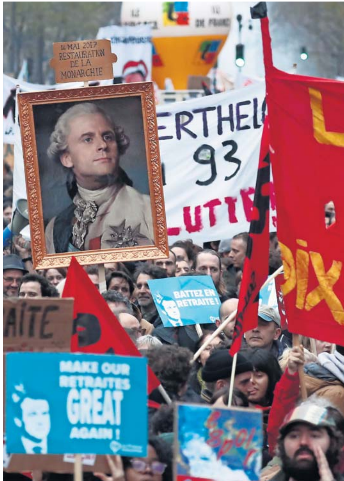
Manifestantes cerca de la plaza de la Bastilla con un retrato de Macron como sucesor de Luis XVI.

Mientras, la batalla por la opinión pública está ya en pleno apogeo y desde hace varios días, el Gobierno y las centrales se acusan mutuamente de poner en riesgo la movilidad durante tan populares fiestas, pero ninguno parece dispuesto a dar marcha atrás. Ayer, el secretario de Estado de Transportes