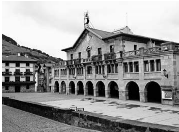
El Ayuntamiento de Leiza es uno de los beneficiados.

En ese plan, según señala el Gobierno de Navarra, "se establece la necesidad de ampliar la oferta en los medios para facilitar y aumentar el acceso a la información en esta lengua por parte de la sociedad, elemento necesario para que las personas vascoblantes puedan utilizar la lengua en todos los ámbitos sociales".