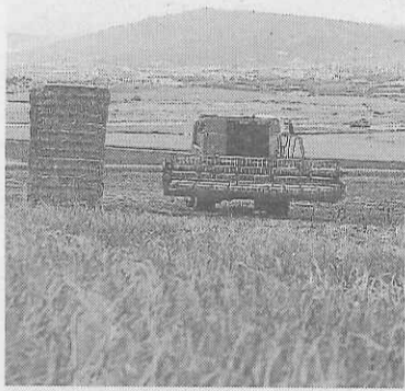
Una cosechadora.

Asimismo, estas partidas se orientan a la consecución de objetivos medioambientales específicos, en concreto la optimización en la ges-