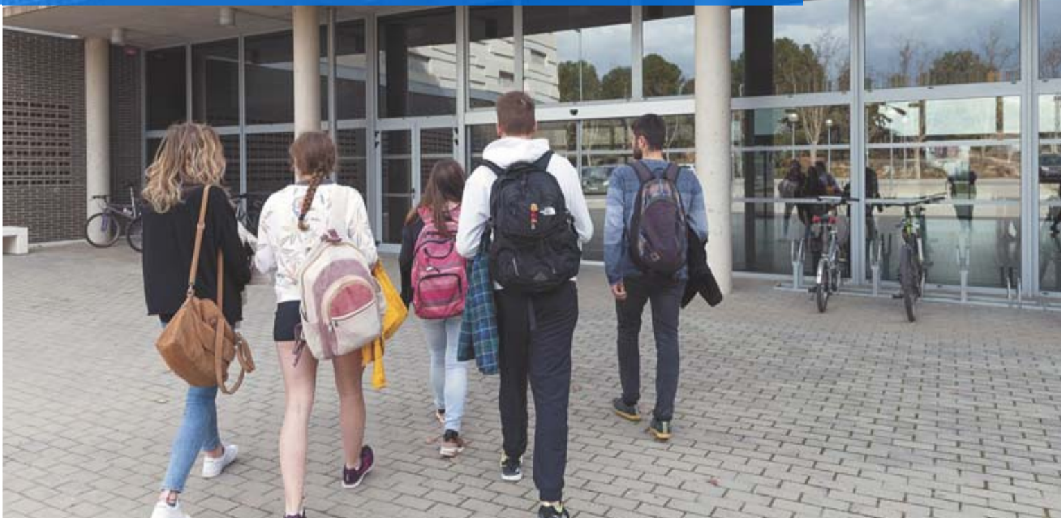
Estudiantes entrando a una facultad universitaria.

Ocho de cada diez jóvenes no pueden emanciparse