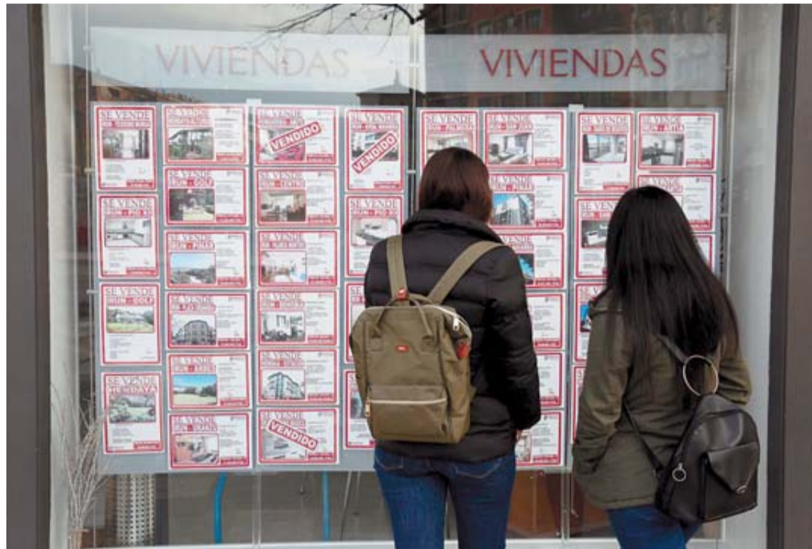
Dos jóvenes miran los precios de venta de viviendas en el escaparate de una inmobiliaria.

Las tasas de empleo, paro y temporalidad juvenil han mejorado algo desde 2016, con la salida de