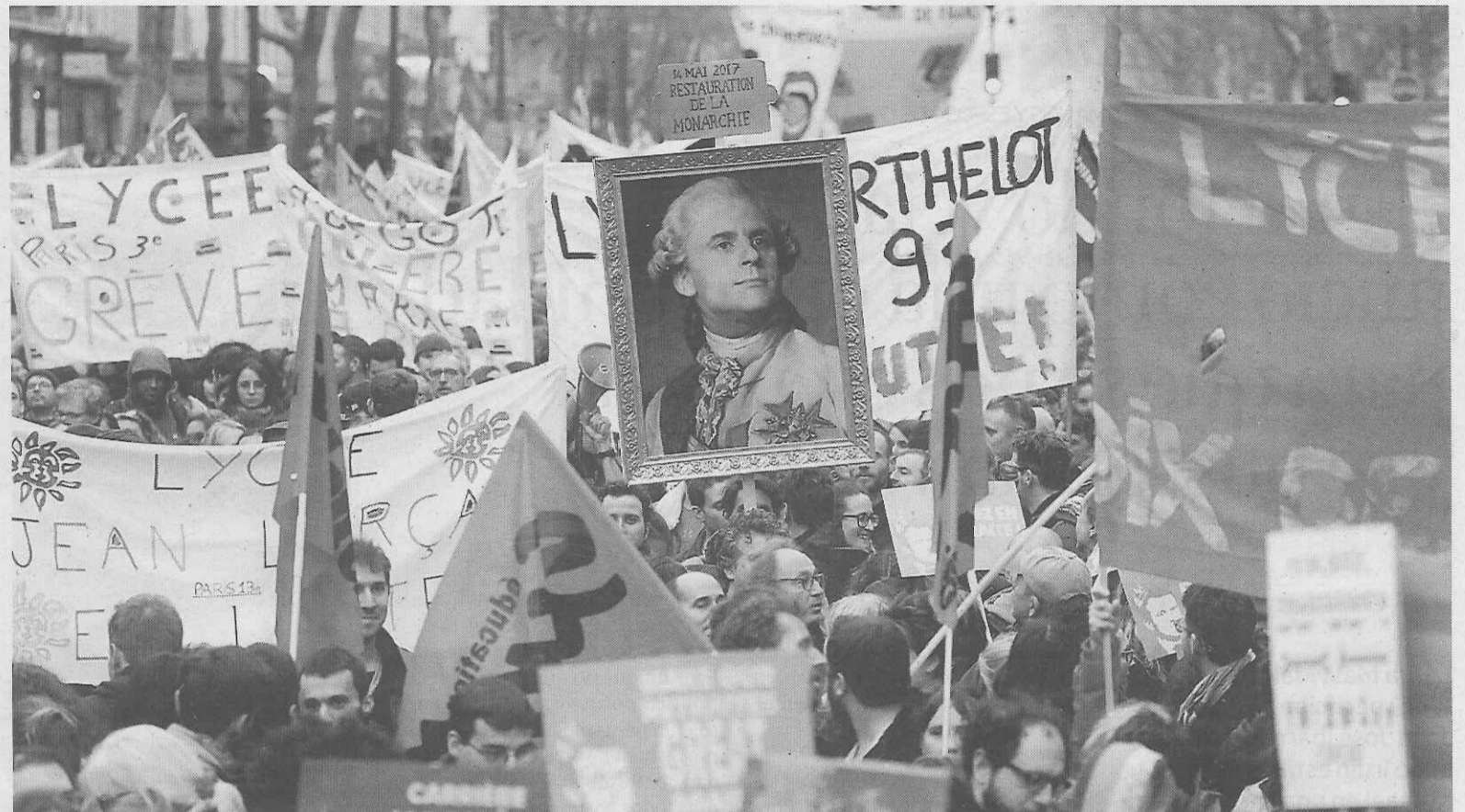
Los manifestantes sostienen un retrato del presidente francés, Emmanuel Macron, retratado como el rey Luis XVI de Francia.