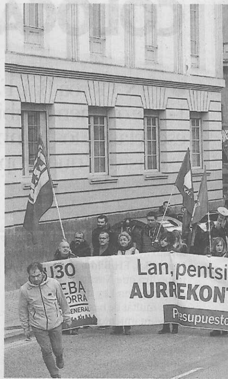
La manifestación, a su paso por la calle.

mas de tutela para los menores no acompañados, la defensa de los derechos de las familias transnacionales y el fin de la segregación en centros