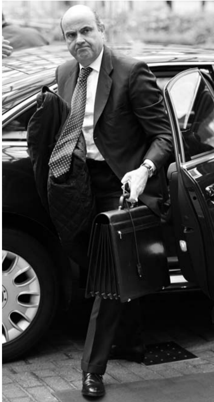
El ministro de Economía, Luis de Guindos, a su llegada a Bruselas.

La consultora Oliver Wyman cifró los requerimientos de capital de la banca española en 53.745