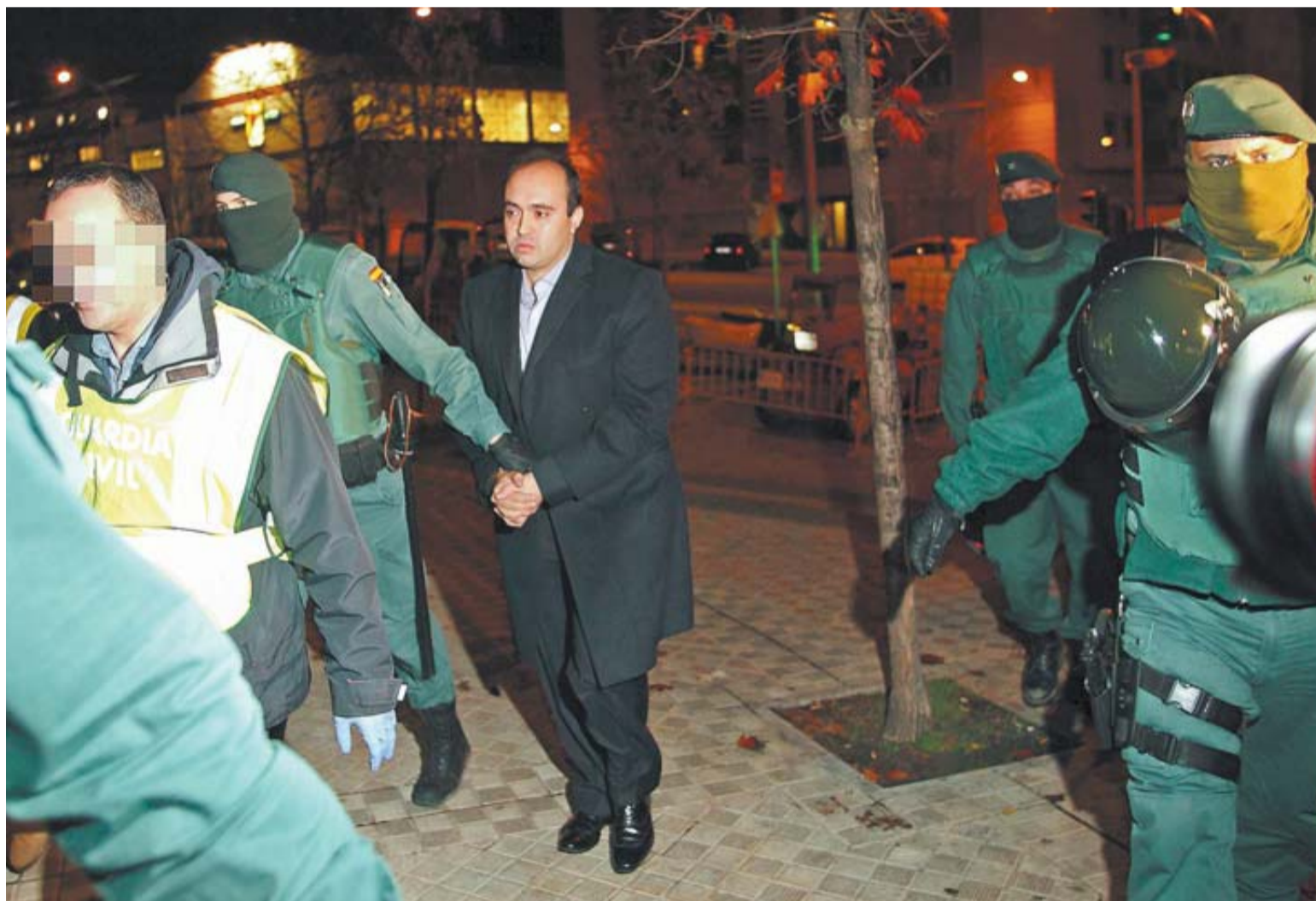
Agentes de la Guardia Civil trasladan al propietario de Asfi, a las 21.40 horas, a las oficinas del grupo en la calle Monjardín para su registro.