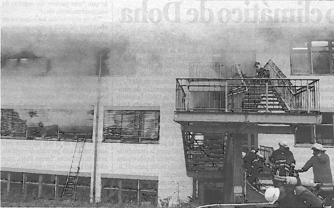
Un grupo de bomberos trata de apagar un incendio en un taller de discapacitados en Alemania.

La Audiencia Nacional rechazó ayer el incidente de nulidad presentado por la fiscalía contra el auto en el que esta sala declaró ilegal la prórroga de la detención aplicada a uno de los arrestados en la operación Emperador contra la mafia china, por el que podría ser excarcelado su líder, Gao Ping. Inadmite este incidente presentado el viernes ya que cree que detrás de él se esconde un "encubierto recurso de súplica". >EFE