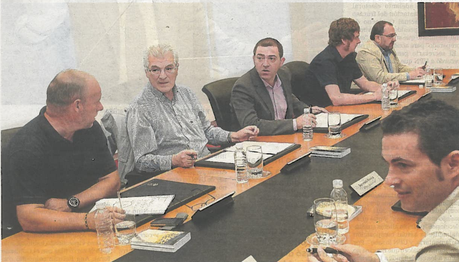
Imagen de una reunión anterior de la Mesa y Junta de Portavoces del Parlamento de Navarra.