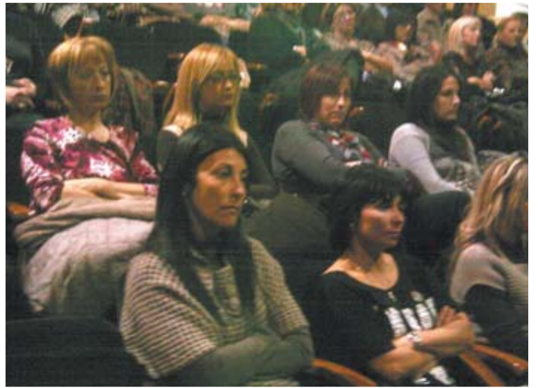
MURCHANTE Asistentes a la proyección del documental 'Nagore'. E.A.