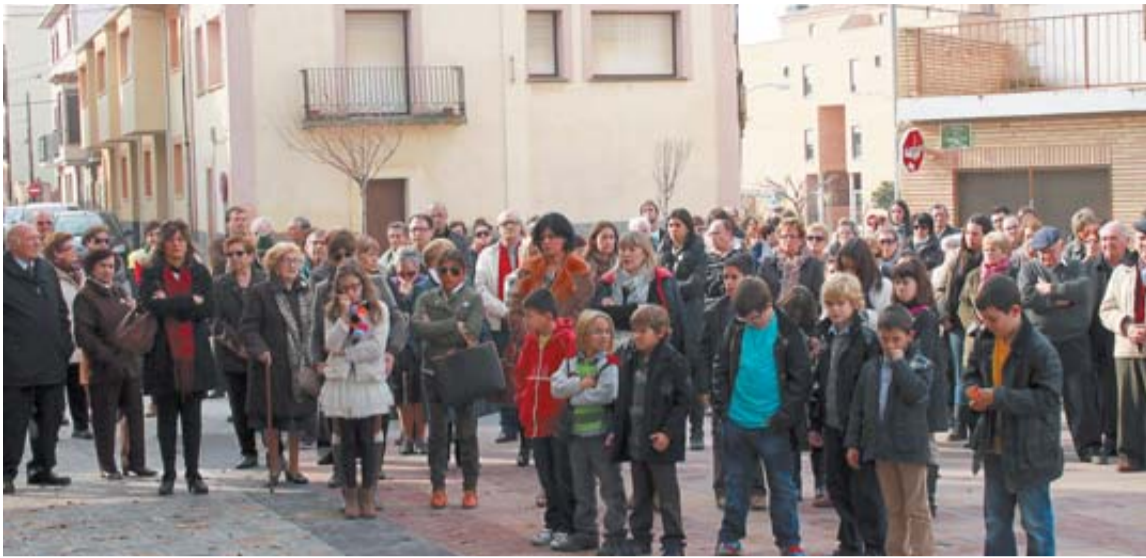
RIBAFORADA Asistentes a la concentración que tuvo lugar en la plaza San Francisco Javier.