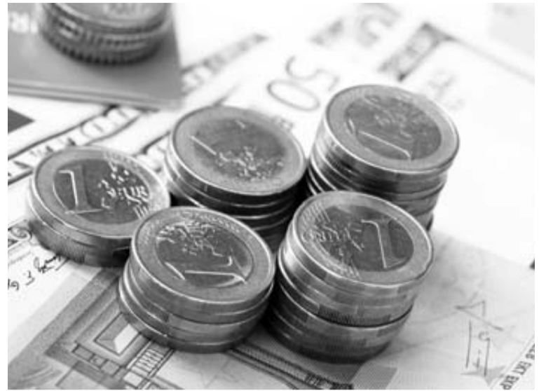
Las pensiones preocupan estos días a los mayores.

Igualmente, desde ayer los pensionistas están cobrando la paga de noviembre. En total son 122.787 las personas que cobrarán la pensión de noviembre, una retribución que supone en Navarra un abono de 109.498.333 euros (891 euros de media).