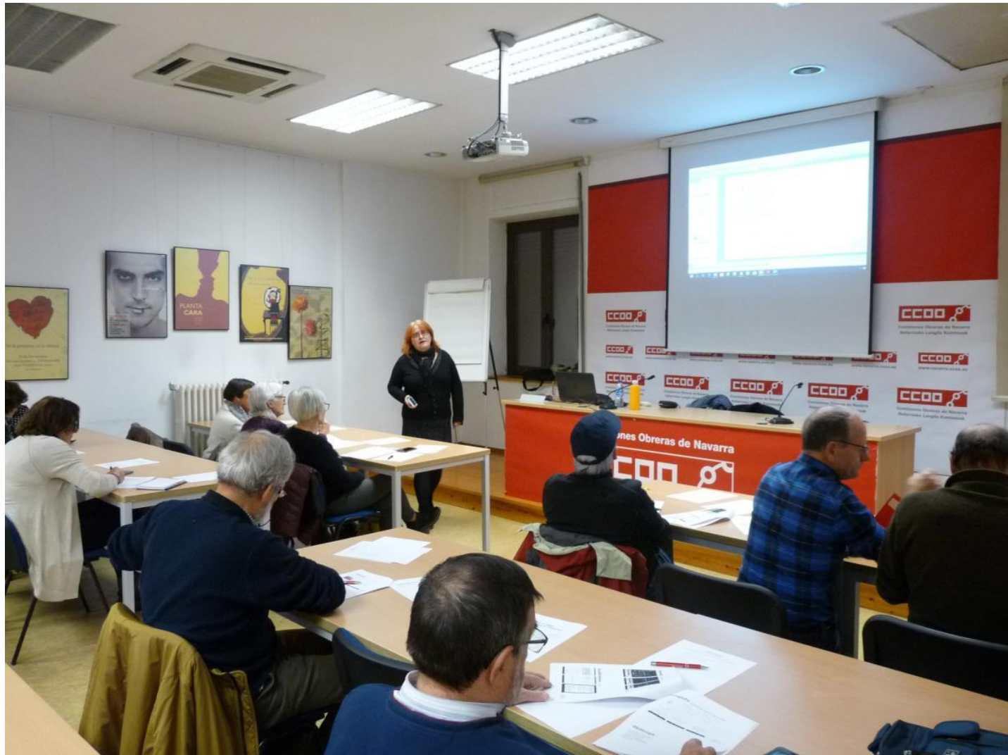
Imagen de la jornada

Hoy ha tenido lugar una jornada sobre aplicaciones útiles para mayores, dirigida al colectivo de personas jubiladas, prejubiladas, pensionistas y/o mayores de 65 años. En la misma se han dado a conocer diferentes aplicaciones útiles que sirven para mejorar la calidad de vida de las personas, como por ejemplo: My 112, Carpeta Personal de Salud, Medisafe, MyHeart, Google Fit, VolumeBooster, Juegos de Memoria, etc.