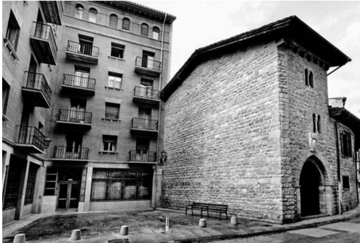
A la derecha, sede de la Cámara de Comptos en la calle Ansoleaga de Pamplona.

El 69% de los municipios navarros tiene menos de 1.000 habitantes. Consecuencia de este pequeño tamaño de la mayoría de los ayuntamientos es una estructura administrativa limitada, con escasos recursos humanos y financie-