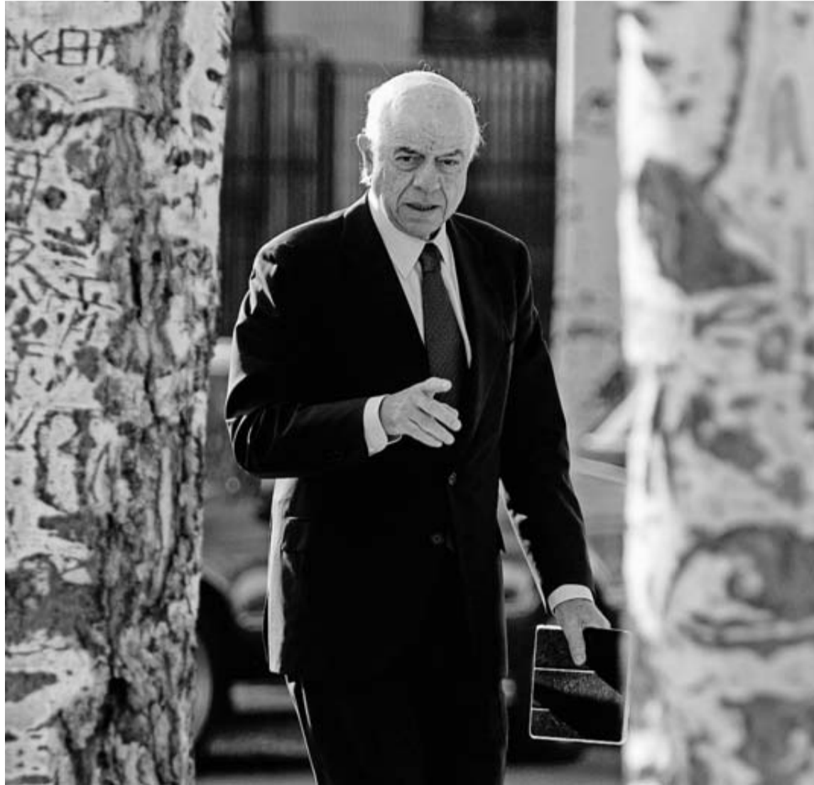
El expresidente de BBVA Francisco González en una foto de archivo.

En el caso de González, el Ministerio Público ha pedido al juez que le cite a declarar por los presuntos delitos de cohecho y revelación de secretos. Desde que abandonó el cargo de presidente de ho-