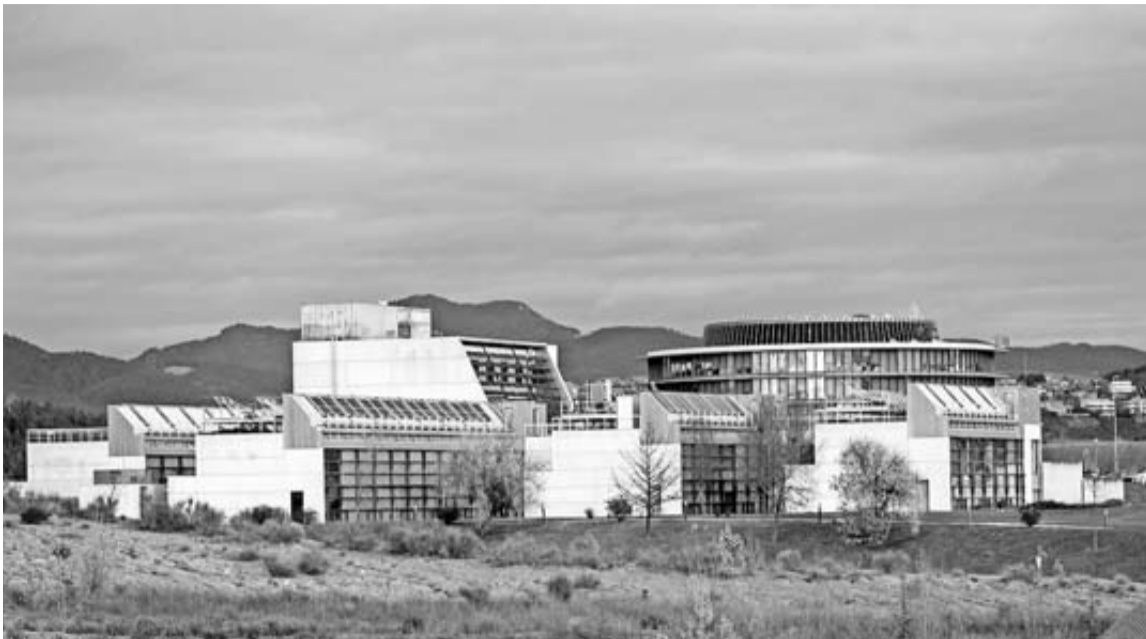
La sede de Cener en Sarriguren será una de las paradas de la delegación de China EV100. CASO (ARCHIVO)