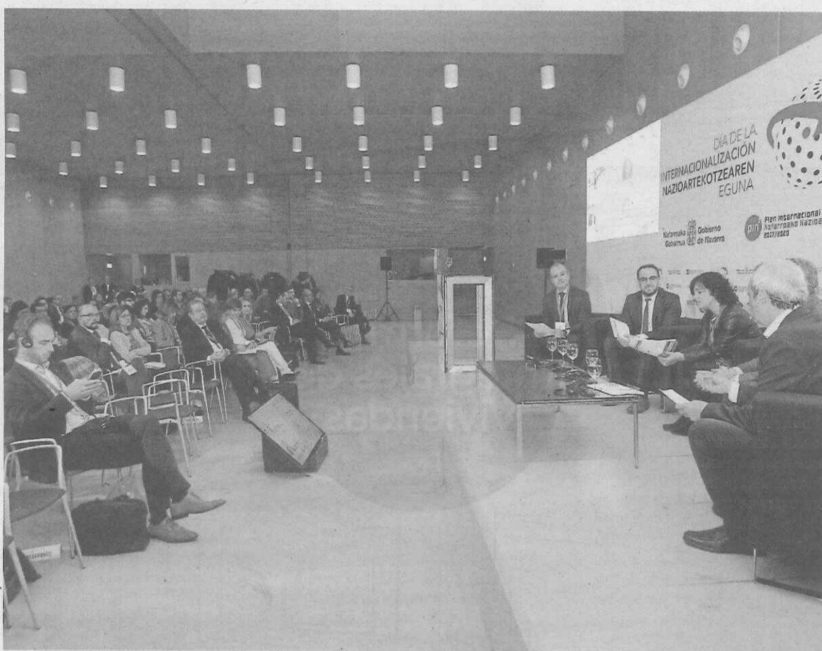
Decenas de personas acudieron ayer a la mesa redonda sobre internacionalización.