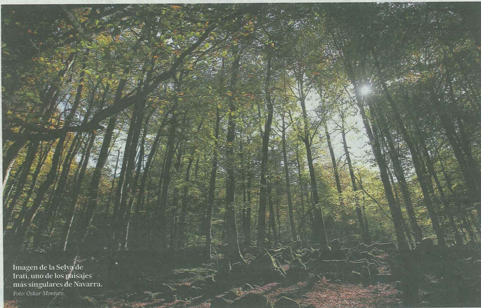
Imagen de la Selva de Irati, uno de los paisajes más singulares de Navarra.