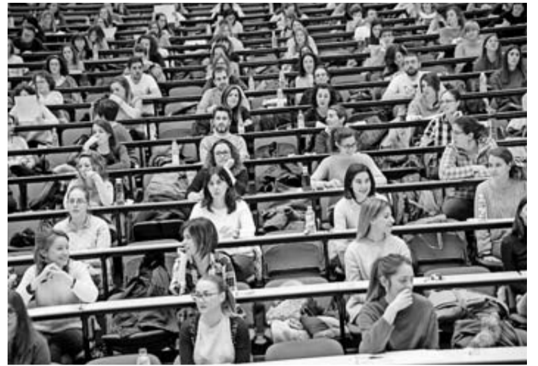
Imagen del examen de la OPE en marzo de 2018.

Una vez realizada la prueba se inició un largo camino de recursos y demoras para su resolución y la de las baremaciones. De hecho, el Sindicato de Enfermería de Navarra, SATSE, alertó de manera recurrente del "despropósito" que supone que una OPE se demore más de un año y medio en resolverse. "Es habitual que en los procesos de OPE existan