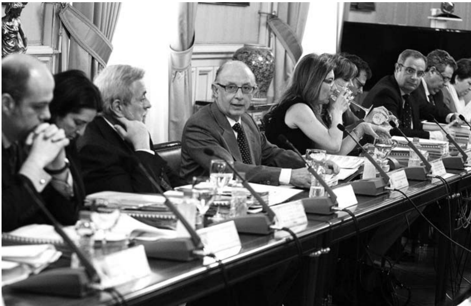
Montoro durante la reunión del martes con representantes de los entes locales para analizar las cuentas de los ayuntamientos.