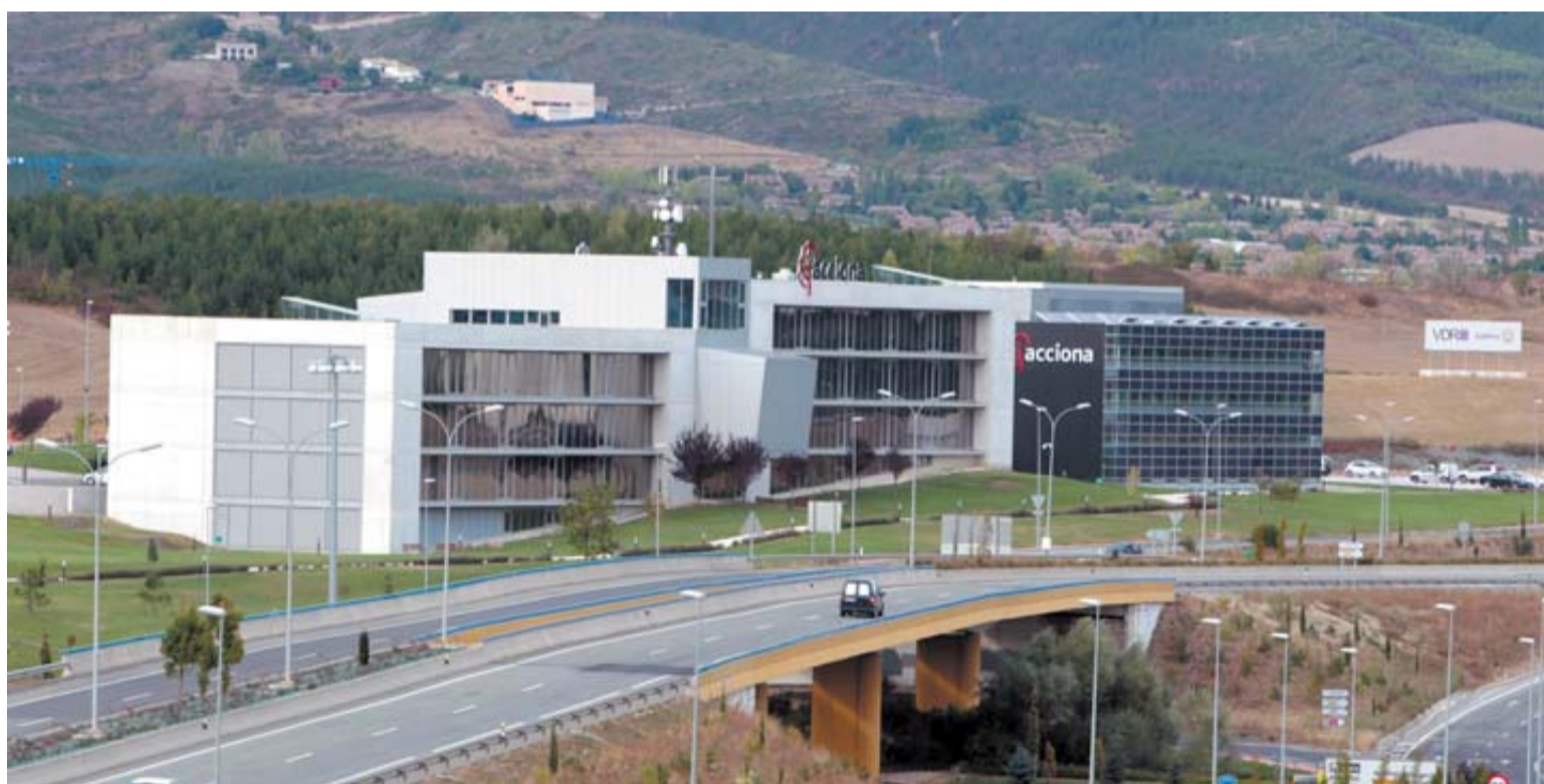
Imagen de archivo de Acciona, en Sarriguren.

Con la reunión de ayer en Madrid entre dirección y representación sindical se abre un periodo de negociación de 30 días, que finaliza el 16 de mayo. El objetivo de la cita de ayer era entregar a la parte laboral la memoria explicativa del expediente y el informe técnico, además de constituir la mesa de negociación. Después de acreditarse 80 representantes de los trabajadores de los diferentes centros de