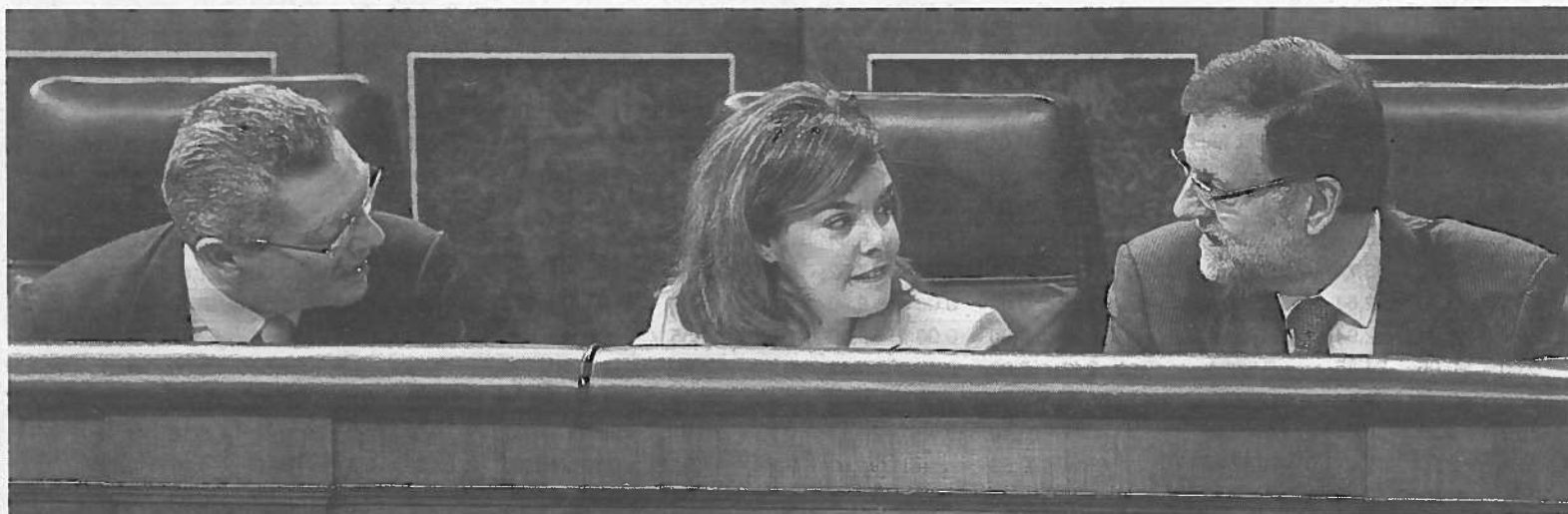
El ministro de Justicia, Alberto Ruiz-Gallardón, junto a la vicepresidenta, Soraya Saenz de Santamaría, y al presidente, Mariano Rajoy.