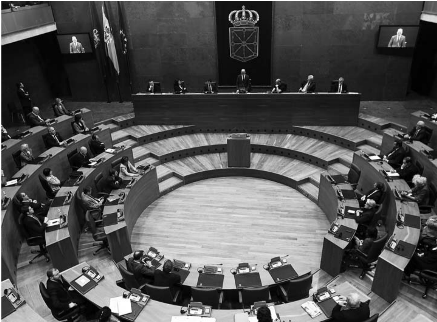
Salón de plenos de la Cámara foral, donde hoy se debatirá y votará la moción de censura de Bildu y NaBai.