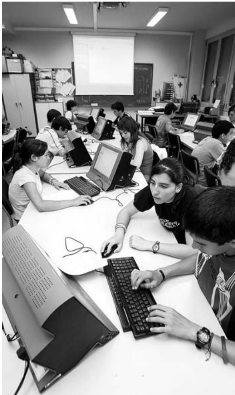
Jóvenes trabajan con ordenadores, en una imagen de archivo.

niveles no obligatorios son consideradas "buenas". El abandono escolar es de un 13,3%, por debajo de la tasa española (28,4%) y de la Unión Europea (14,1%) pero lejos aún del objetivo de 'Europa 2020', que establece la tasa en un 10%.