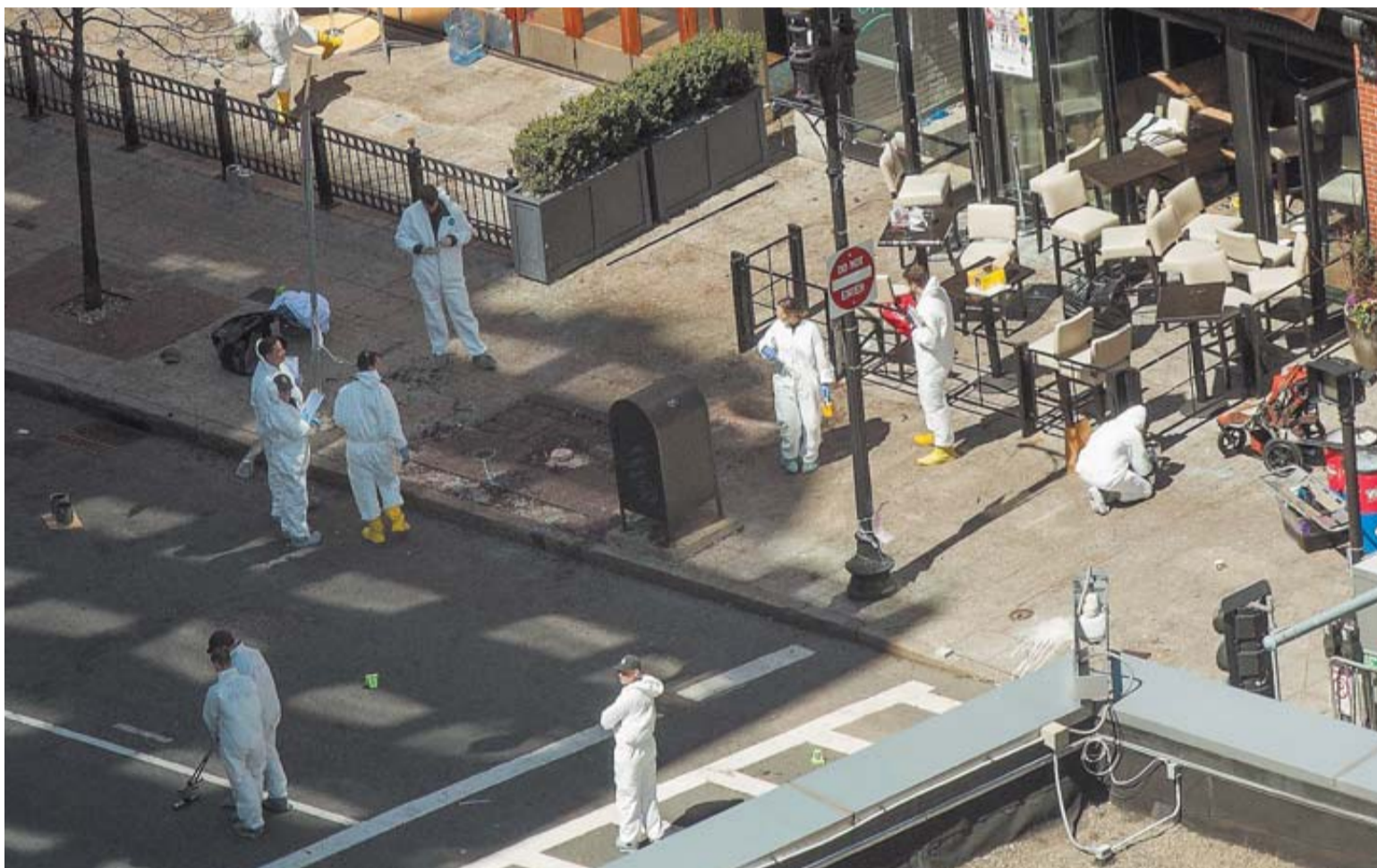
Investigadores de distintos cuerpos policiales buscan pistas en el lugar de la explosión de una de las bombas.