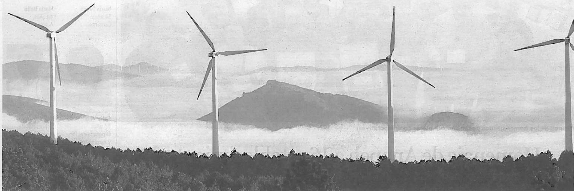
Parque eólico de Acciona ubicado en El Perdón y que fue puesto en marcha en tiempos de EHN.

PREVISIONES EL FMI ALERTA DE UNA CRISIS FINANCIERA CRÓNICA SI NO SE TOMAN MEDIDAS P. 47