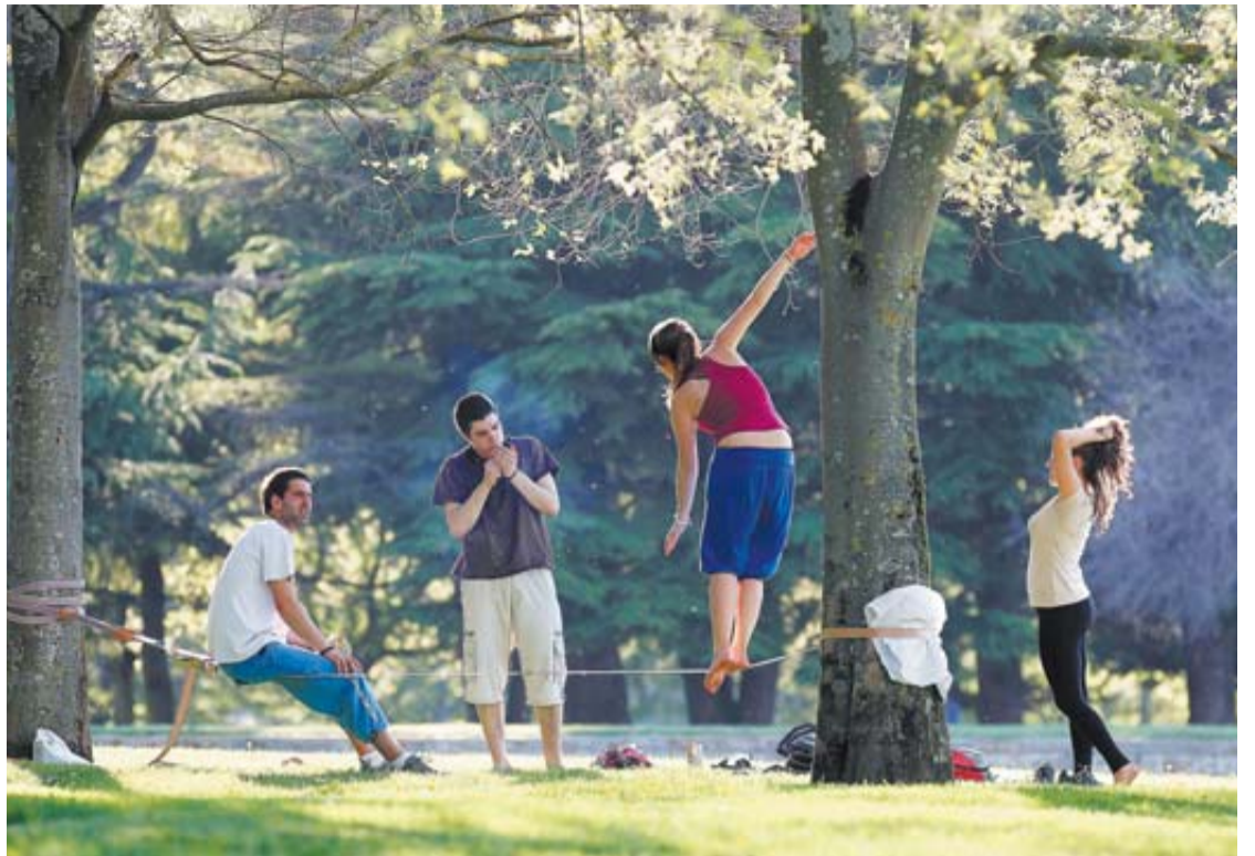
Los parques de Pamplona, como la Vuelta del Castillo se llenaron ayer de ciudadanos ávidos de sol. BUXENS

Acciona abandona el negocio del biodiésel. El ERE comunicado ayer a trabajadores prevé el despido de 17 de los 18 trabajadores que cuenta la planta de biodiésel en Caparroso. Esta fábrica fue inaugurada por la entonces EHN en enero de 2005, con una capacidad para producir 35.000 toneladas anuales de biodiésel, unos 40 millones de litros. Prácticamente, esta planta ya llevaba tiempo sin producir biodiésel y lo que fabricaba era glicerina. La compañía cuenta con otra planta de biodiésel en Bilbao, que abrió en 2009 y para la que prevé el despido de 16 de sus 17 trabajadores.