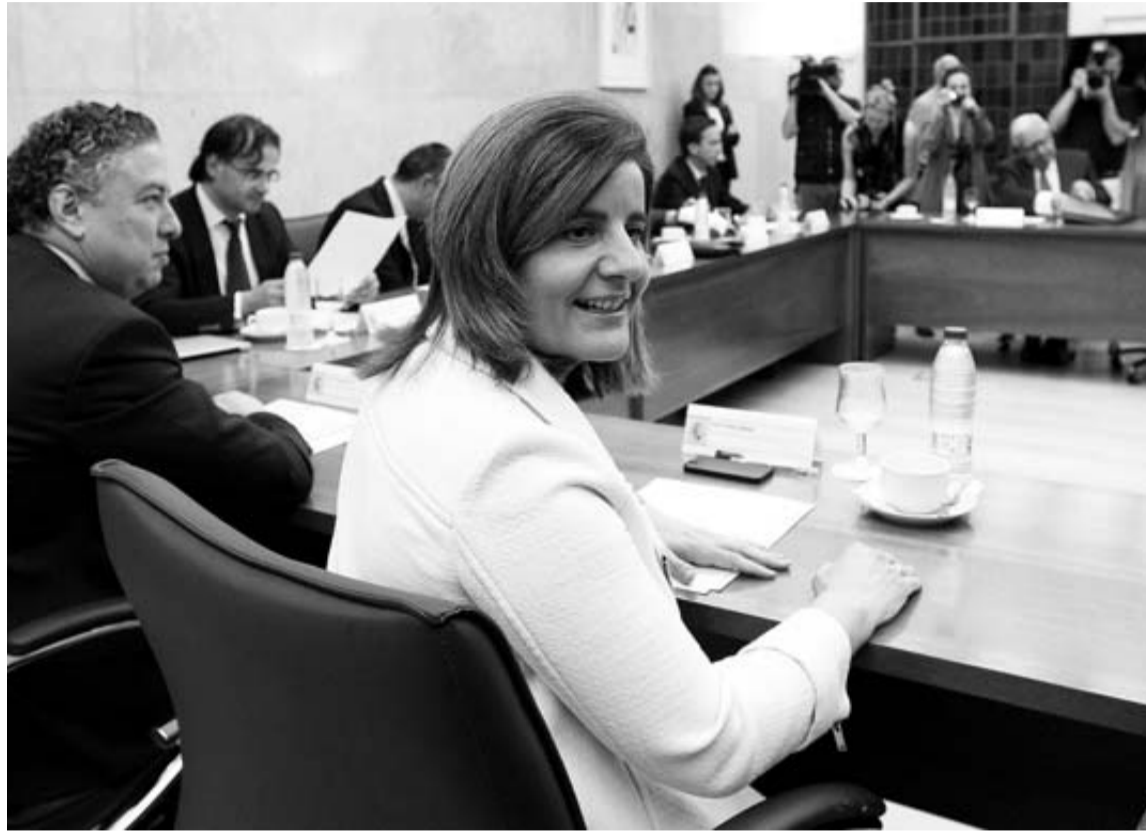
Fátima Báñez, durante la reunión con el comité de expertos que analizará la sostenibilidad de las pensiones.

El planteamiento de movilidad, respondió Báñez, "lleva a