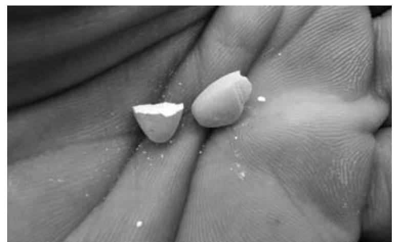
Una persona a punto de consumir un medicamento. DN

Los encuestados reconocen también el papel de estos fárma-