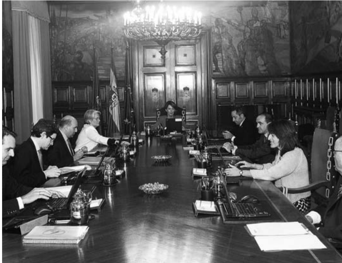
El Gobierno, en uno de sus consejos semanales.

El Ejecutivo quiere extender la medida a 200 cargos locales: los 22 alcaldes de las localidades de más de 5.000 habitantes y 178 concejales de las que superan los 10.000 vecinos.