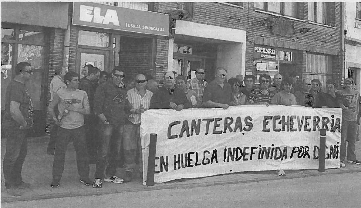
Los empleados se concentraron ayer en el mercadillo, acompañados de ediles de Bildu.