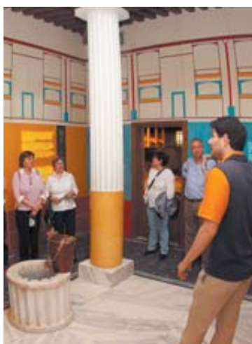
Acceso a la casa romana. BUXENS

Las cámaras captaron una imagen de la persona que colocó los explosivos en Boston INTERNACIONAL 6-7