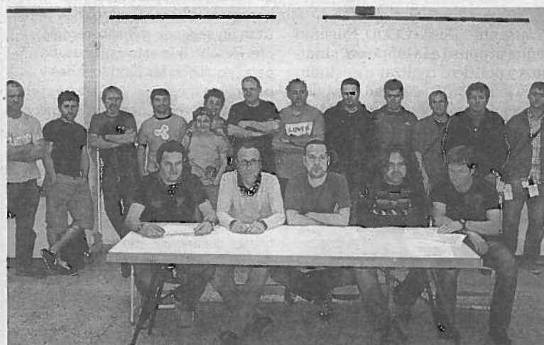
Momento de la comparecencia, ayer en el local Gure Etxea.

Por otro lado, adelantaron que están organizando una movilización para el próximo 3 de mayo en Alsasua para exigir la readmisión de los trabajadores despedidos, además de denunciar "el fraude que se