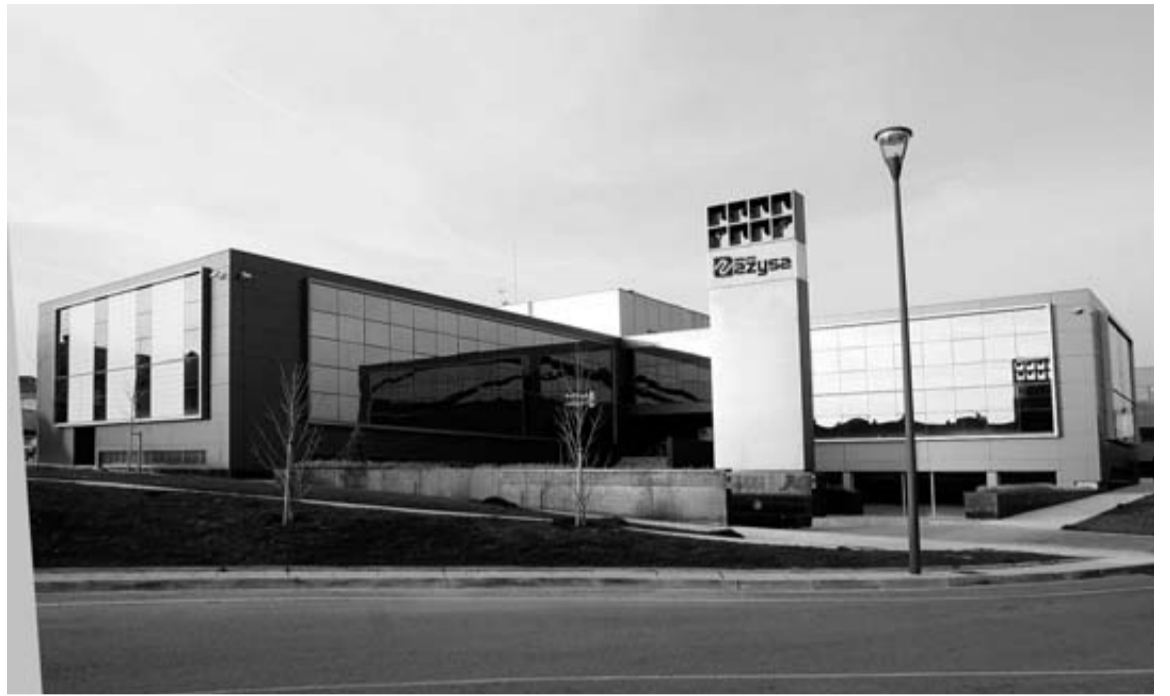
La sede de la constructora Azysa, en Zizur Mayor.

Es lo único que está claro en este convenio. Por primera vez, y así lo han reconocido los sindicatos, la empresa no ha utilizado la inversión necesaria para fabricar el sustituto del Polo (A07) como moneda de cambio. El futuro de la fábrica está asegurado con los 785 millones que se van a invertir en 5 años en las instalaciones para hacer el siguiente Polo, incluida la introducción de la plataforma MQB, una estructura modular (base para varios modelos) que requiere el futuro Polo. Lo que no está asegurado es si, entretanto, va a venir o no un segundo modelo (el SUV, un todo camino basado en el Polo) que reclama insistentemente UGT para saturar la ocupación. Tampoco hay fecha para la renovación del taller de montaje, el más antiguo de la fábrica. Por lo menos, la empresa ya ha planificado inversiones para cambiar los ‘pulpos’ (anclajes que transportan el coche en construcción por la nave) por otros más ergonómicos. 50 millones de esos 785 se inyectarán directamente a mejorar las condiciones de trabajo.