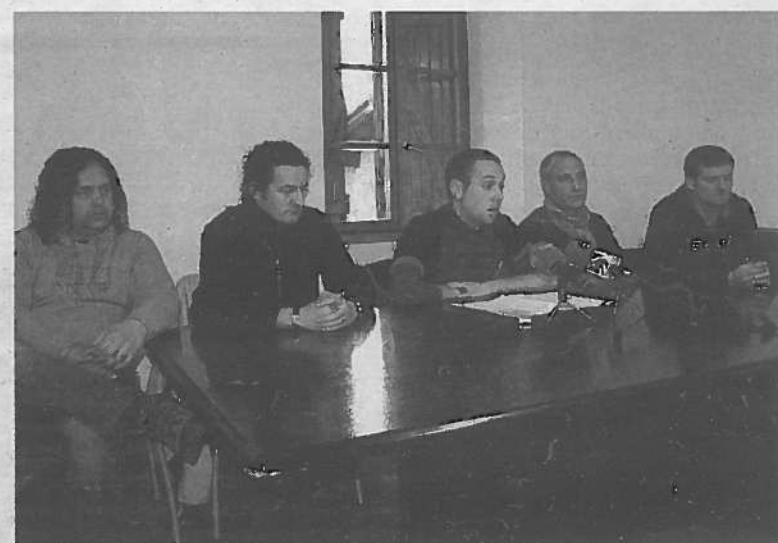
Momento de la rueda de prensa, ayer en Alsasua.

Para LAB, estas bases eran la búsqueda de un inversor y el aval de Sodena en la transición, durante