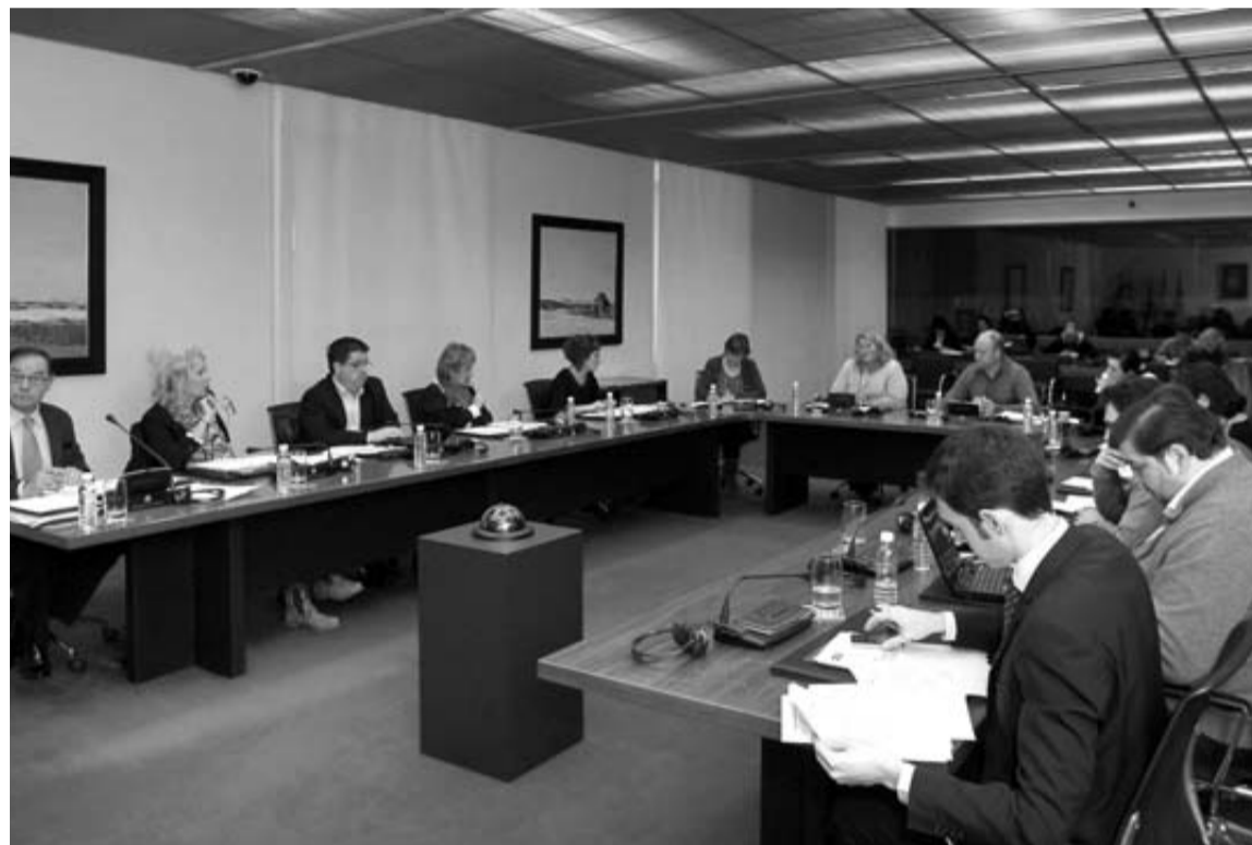
Momento de la reunión de ayer de la Comisión de Cultura, Turismo y Relaciones Institucionales.

En el turno de los grupos, UPN defendió el acuerdo porque "minimiza los efectos de la ley nacional". El PSN justificó su cambio de actitud al apoyar los diez festivos en que ahora "se ha tenido en cuenta la demanda de los sindicatos" y no sólo de los comerciantes. Desde el PP se lamentó el "caos" y la "preocupación" creada en el comercio desde enero y se culpó de ello a "grupos" que, según dijo, no quisieron negociar en su día. NaBai no votó las enmiendas propuestas porque su apuesta es la "apertura cero", mientras que Bildu e I-E coincidieron en señalar que la normativa estatal únicamente beneficia a las grandes superficies.