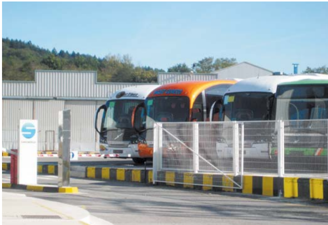
Modelos de autobús carrozados en Sunsundegui, junto al acceso a las instalaciones.

Disconforme con "cualquier despido que no sea voluntario", ELA justificó su postura con el argumento de "dar cauce legal a la voluntad" expresada por la asamblea en la víspera con la elección arbitraria de uno de sus cuatro delegados para estampar su rúbrica. Su decisión, no obstante, se demoró en una jornada de tensión e incertidumbre, iniciada con el mal presagio de su propia incomparecencia y la de