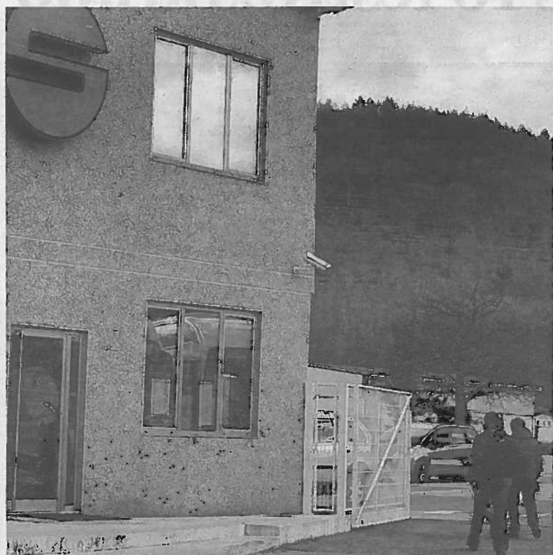
Instalaciones de la firma alsasuarra de autobuses.

● Compraventa. Sodena vende y transmite el 100% de las acciones a la parte compradora: un 51% a los actuales ejecutivos y un 49% al personal que se adhiera al acuerdo. El precio inicial asciende a un euro. Adicionalmente a este valor, Sodena estipulará las cláusulas de disparo correspondientes que protejan la inversión previa de Sodena en caso de venta total o parcial de la compañía o entrada en beneficios.