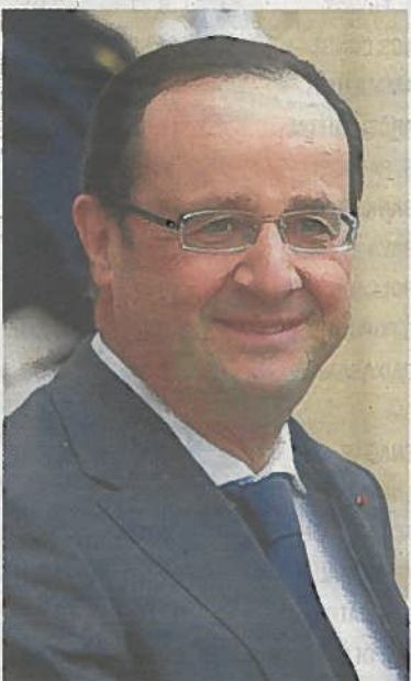
François Hollande.

"En dos años habremos logrado una recuperación estructural iné-