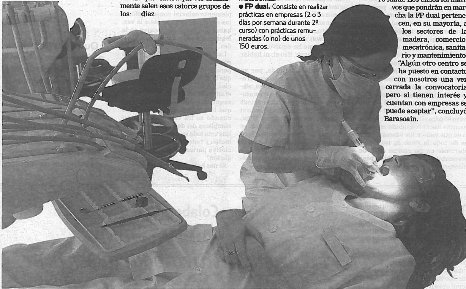
La Escuela Sanitaria será uno de los centros que pondrá en marcha el próximo curso el sistema dual.

"Algún otro centro se ha puesto en contacto con nosotros una vez cerrada la convocatoria pero si tienen interés y cuentan con empresas se puede aceptar", concluyó Barasoain.