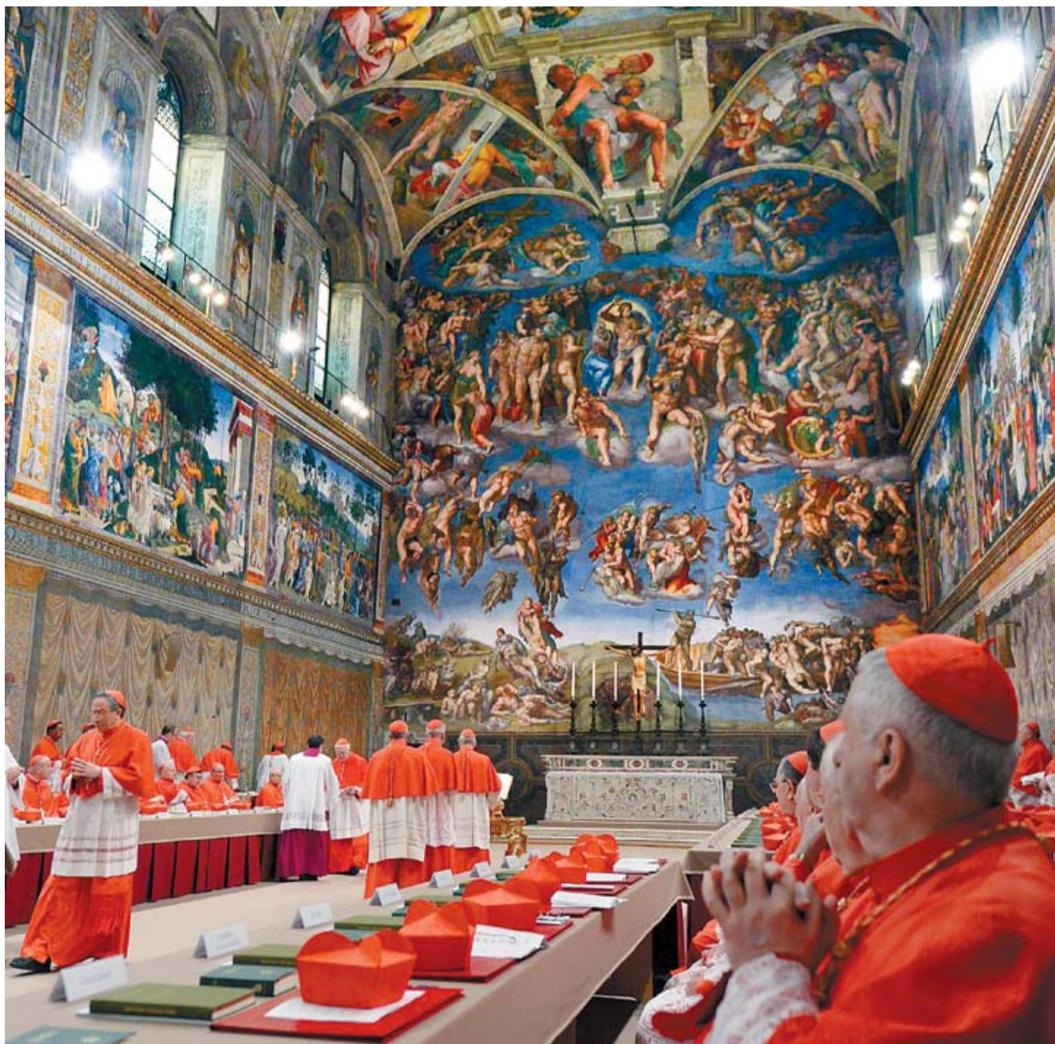
Los cardenales van ocupando sus asientos en la Capilla Sixtina momentos antes del comienzo del cónclave.