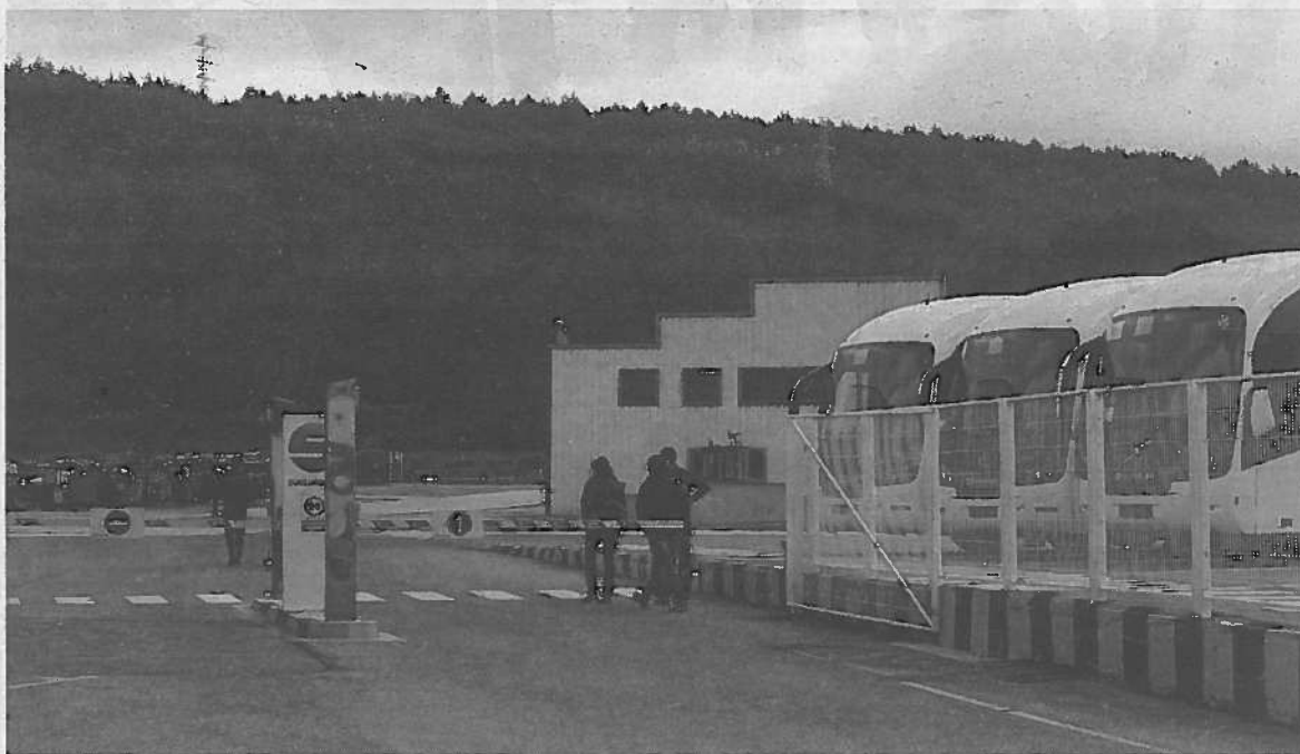
Varios trabajadores, en la entrada de la empresa.

La mañana de ayer en Alsasua fue candente ante la incertidumbre de si el acuerdo obtendría el apoyo o no de la mayoría de la parte social. La asamblea de las 13.00 horas se presentó complicada, ya que los trabajadores con nervios a flor de piel esperaban conocer cuál iba a ser el desenlace del plan. En el último momento, el sindicato ELA, con cuatro delegados en la factoría de autobuses, dio un giro a su posicionamiento y decidió que uno de sus representantes firmara el acuerdo para alcanzar la mayoría necesaria,