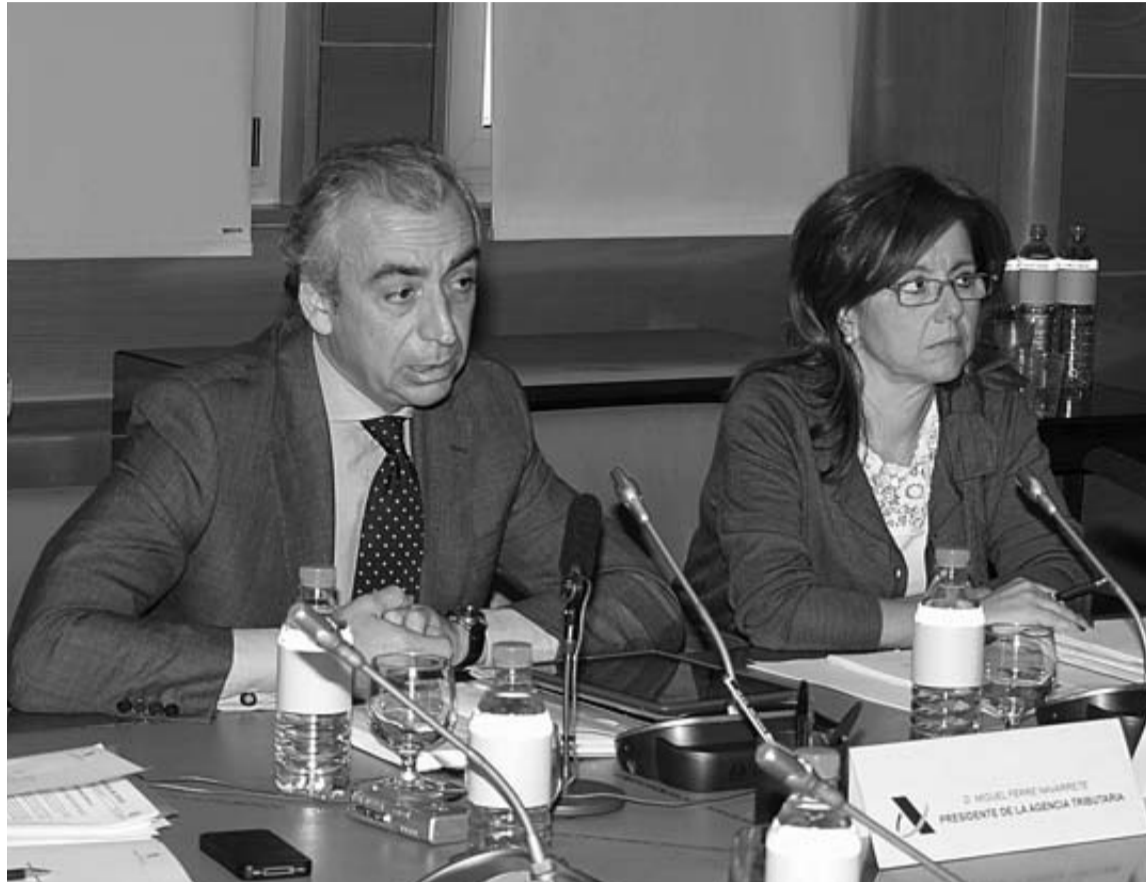
El secretario de Estado de Hacienda, Miguel Ferre, y la directora general, Beatriz Viana.

Otra novedad es la próxima creación de la Oficina Nacional de Fiscalidad Internacional (ONFI), con especial atención a la tributación de los grupos empresariales multinacionales, a la com-