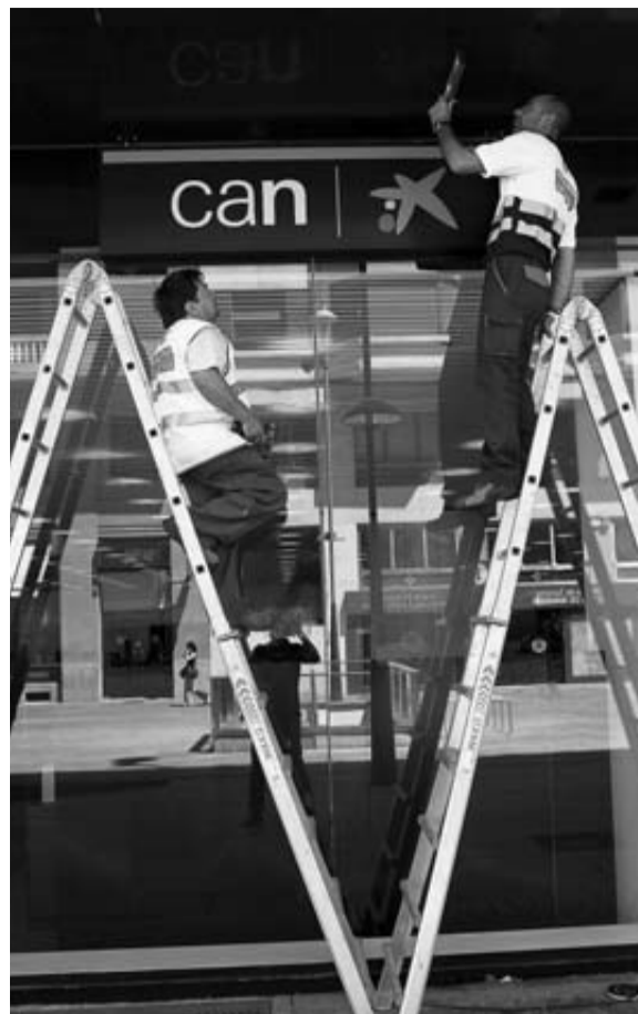
Cambio de rótulos en la sede de Caja Navarra.CORDOVILLA

DIETAS : Por una sesión el pte. cobró 8.040 euros y los vocales, 5.141. No constan las razones