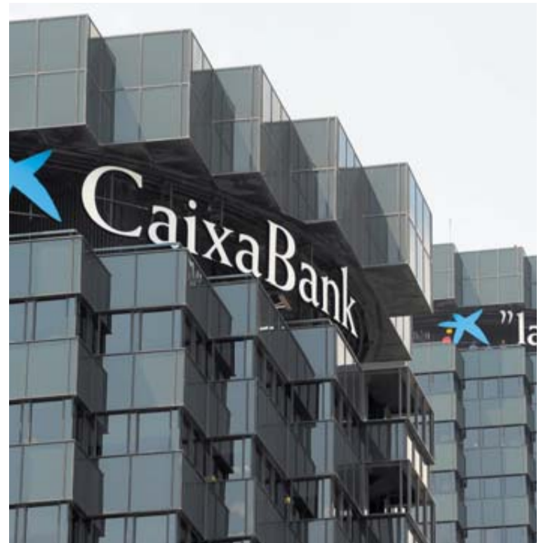
La sede Caixabank en la Avenida Diagonal de Barcelona.

Así, destaca que esta integración tiene como objetivo "generar las sinergias y economías de escala apropiadas para lograr