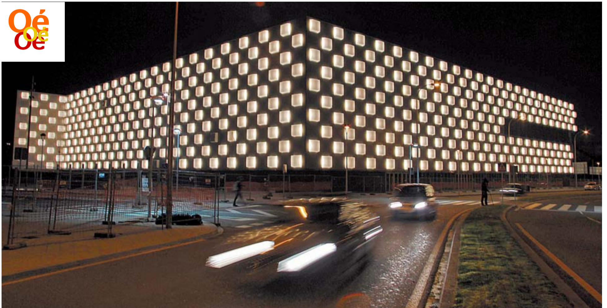
Los 933 cubos de la fachada permanecerán iluminados hasta el lunes para detectar posibles fallos y estabilizar el flujo de las lámparas.