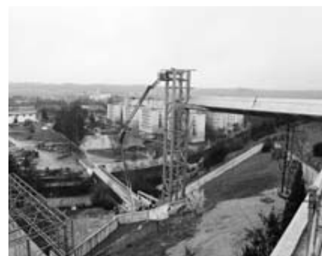
Al fondo, las casas de Urdánoz.