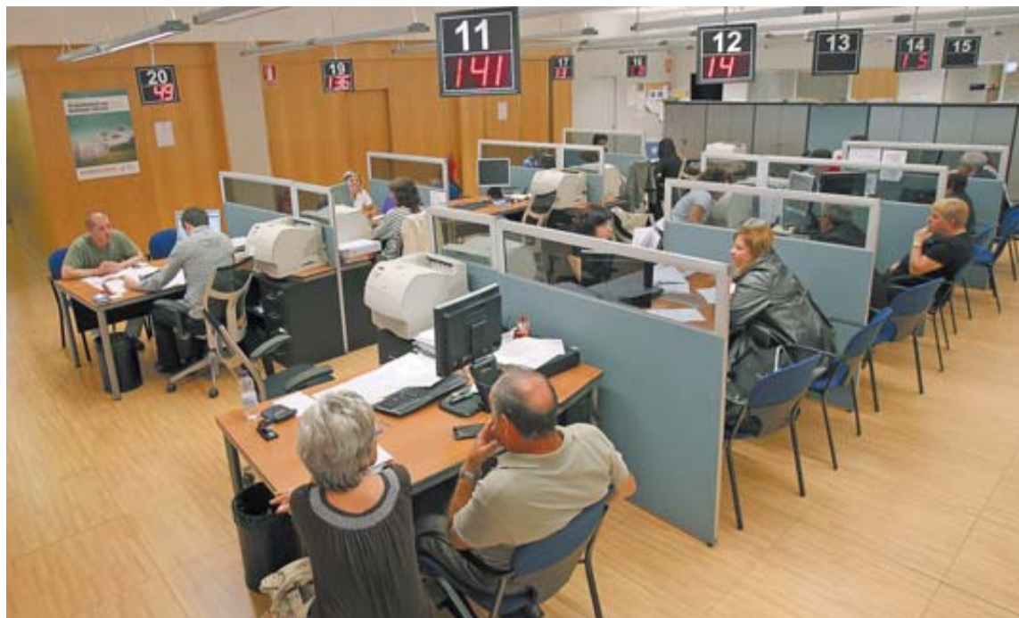
Las oficinas de Hacienda, un día de la campaña de la renta del años anteriores.

En la declaración de 2012 no entran en vigor aún los límites a la deducción por deducción por vivienda aprobados en diciembre pasado en Navarra. Será así el último año en que las 130.000 familias con inversión en vivienda podrán deducirse hasta 9.000€ (declaración individual) o 21.000€ (conjunta). A partir de 2013, los topes bajas a 7.000 y 15.000 euros respectivamente. Y los nuevos compradores de vivienda solo podrán deducirse si su base liquidable (ingresos a efectos fiscales) no supera los 20.000 euros (40.000 en conjuntas y 44.000 en familias numerosas).