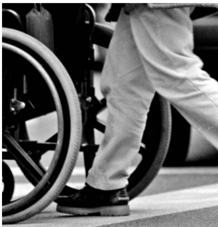
Una persona ayuda a otra en silla de ruedas.

Añadió que se va a crear una Oficina de Vida Independiente, que estará ubicada en la sede de la Agencia Navarra para la Autonomía de las Personas, en la calle González Tablas de Pamplona. En este lugar se atenderá a las personas con discapacidad o dependencia y se analizará con ellas sus "proyectos vitales" y la