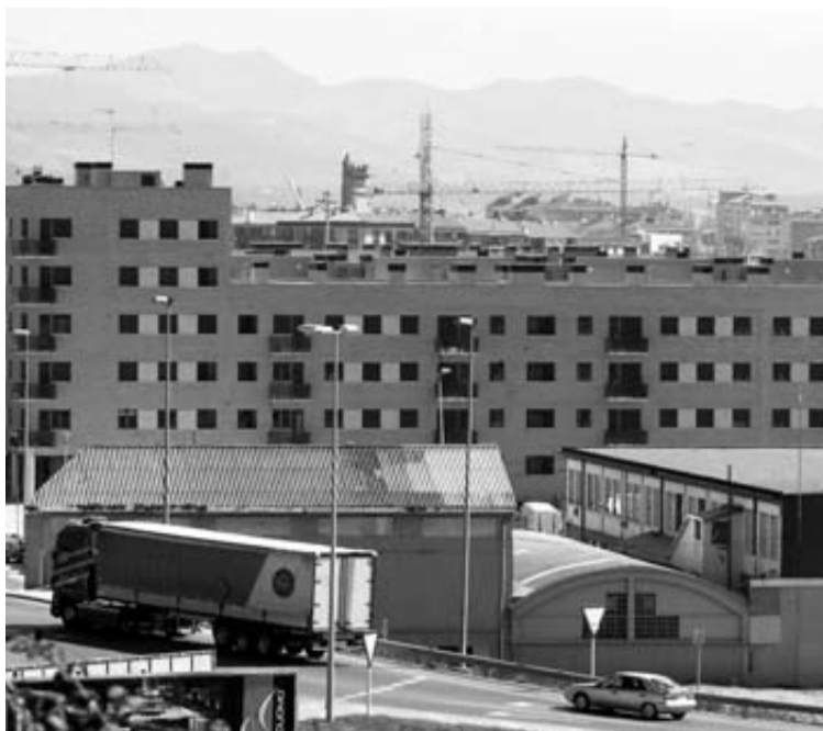
Instalaciones de Inepsa en el barrio de Buztintxuri.

Además, estas mismas fuentes informaron que la dirección había comunicado que en breve la planta de Buztintxuri se va a hacer cargo de la fabricación que hasta ahora venía realizando una empresa china, por lo que no comprenden que un plazo de "un mes o mes y medio" tengan que plantearse nuevas contratacio-