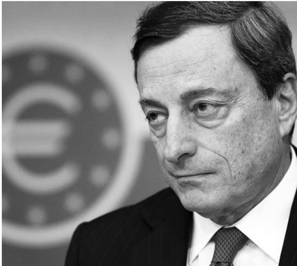
El presidente del BCE, Mario Draghi, en su comparecencia de ayer en Fráncfort.

El presidente del BCE negó, como muchos expertos apuntan, a que el organismo europeo se esté quedando sin herramientas en su caja y aseguró que están analizando tanto medidas convencionales como no convencionales. "Desde el punto de vista convencional nuestra política monetaria va a seguir siendo acomodati-