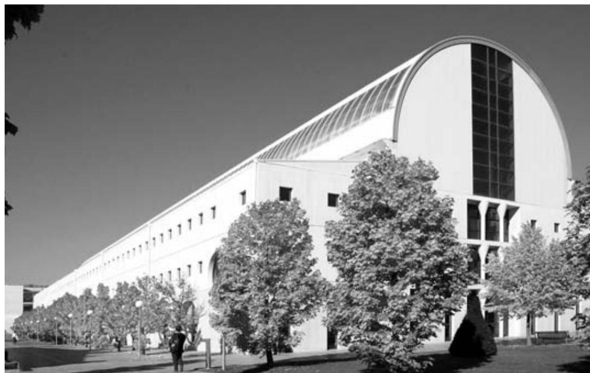
Fachada de la Universidad Pública de Navarra.

Pese al recorte, el centro mantiene el periodo de preinscripción ordinaria de junio y reserva para julio el extraordinario. Cabe recordar que estas pruebas pre-