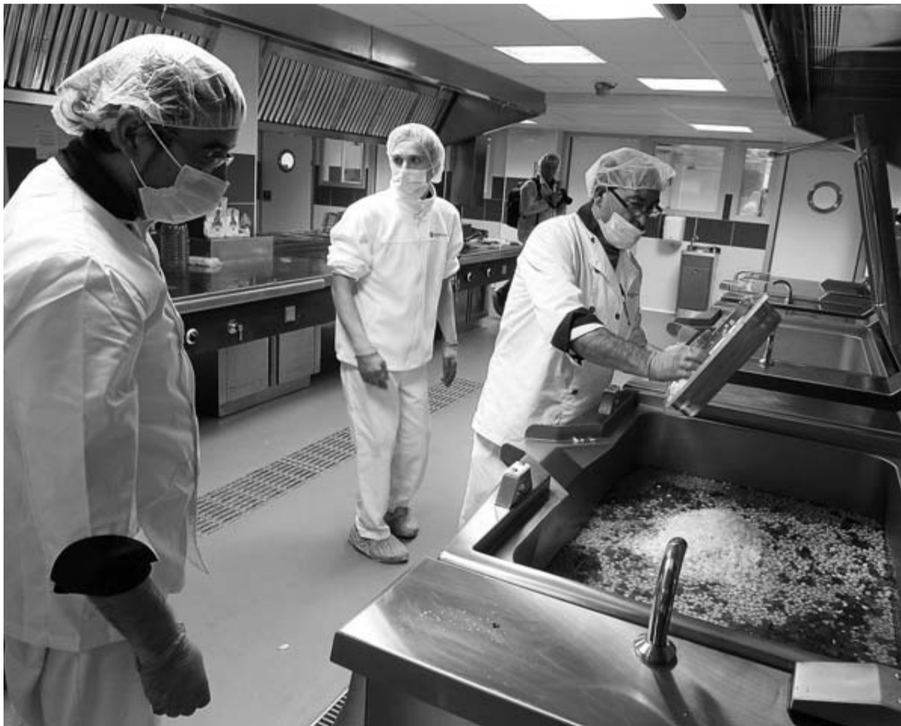
Imagen de las nuevas cocinas del Complejo Hospitalario de Navarra.