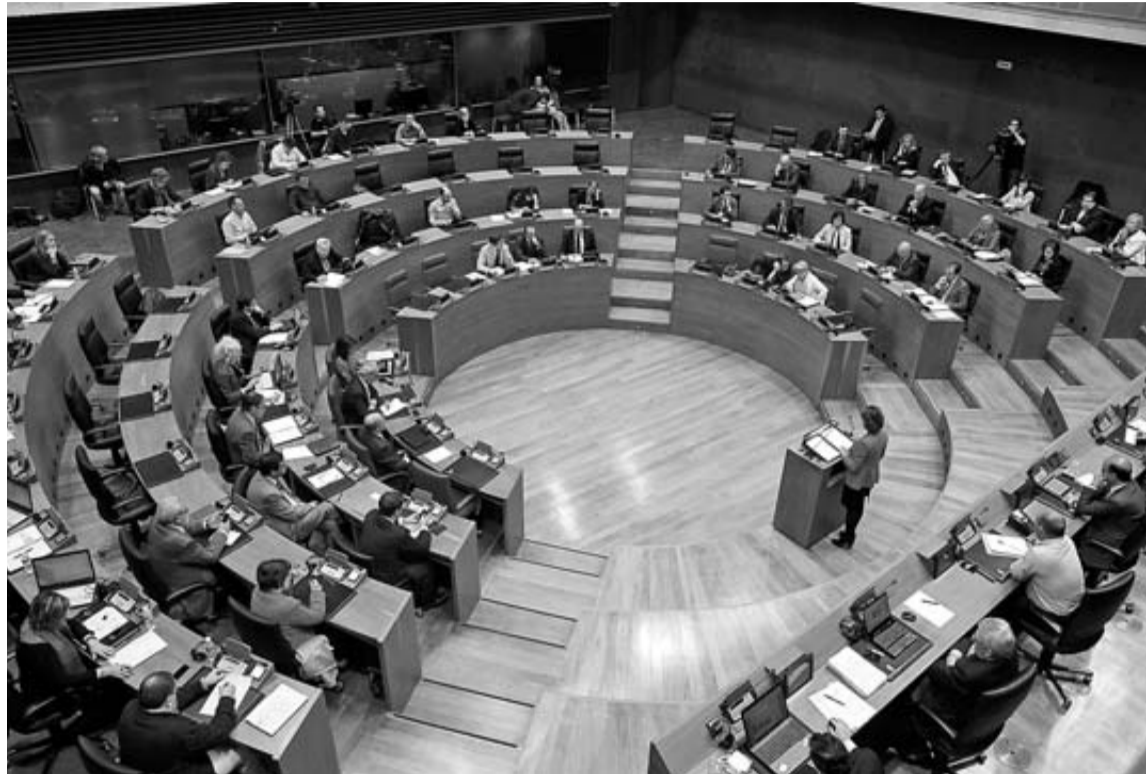
Barcina, interviniendo en el debate parlamentario sobre el estado de Navarra, el pasado octubre.

El debate de la iniciativa mostrará una curiosa fotografía política del Parlamento navarro, en el que la oposición se une para pedir la dimisión de la presidenta (así lo han hecho PSN, Bildu, NaBai, I-E y Geroa Bai), pero en la que esos mismos grupos se dividen cuando se trata de obligar a Yolanda Barcina a dejar el cargo. Los socialistas no quieren recorrer ese camino con Bildu, como han reiterado estos días.