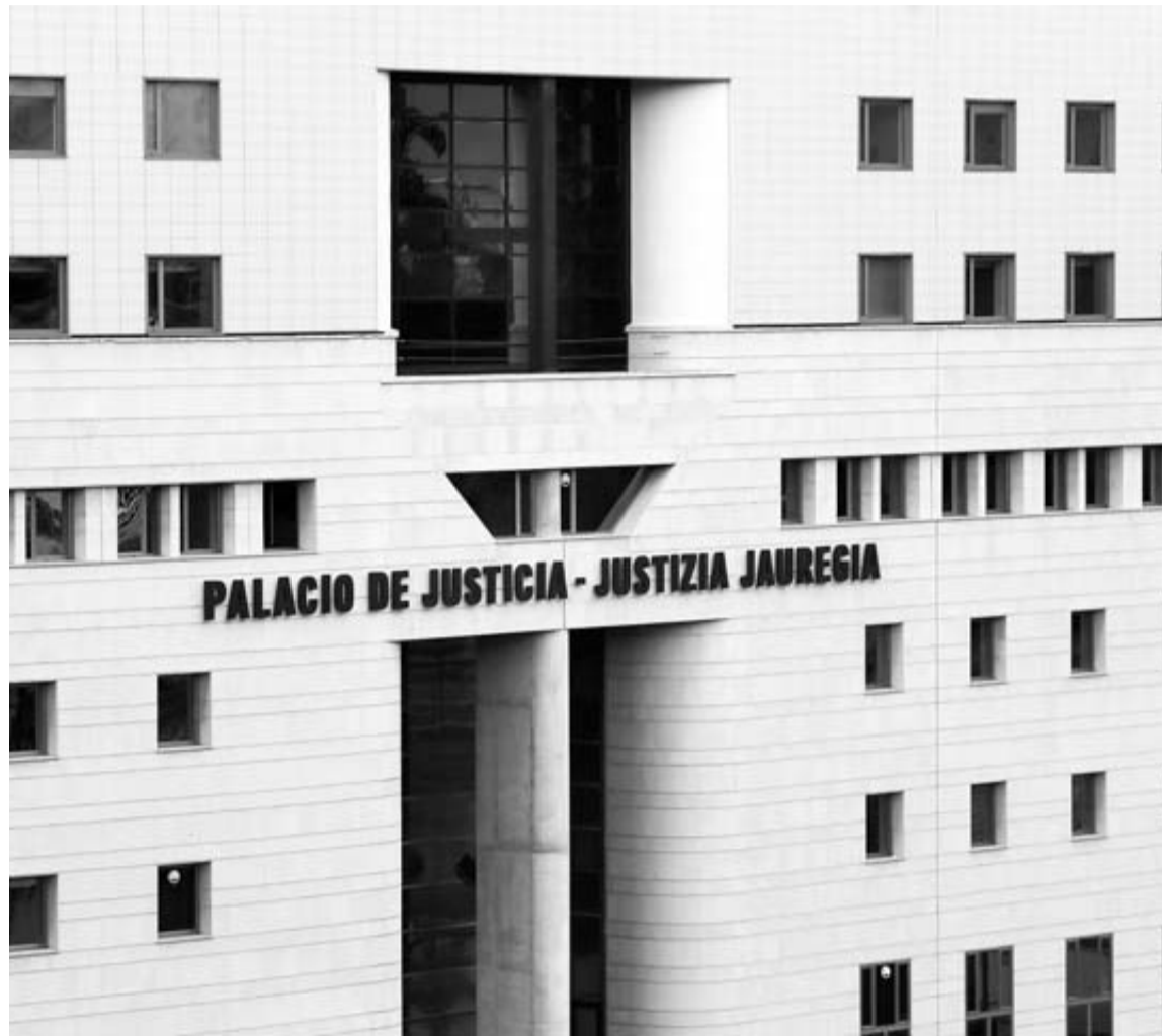
Fachada del Palacio de Justicia de Pamplona.

Recuerda que la juez cuando admitió la denuncia entendió que la posible existencia de delitos so-