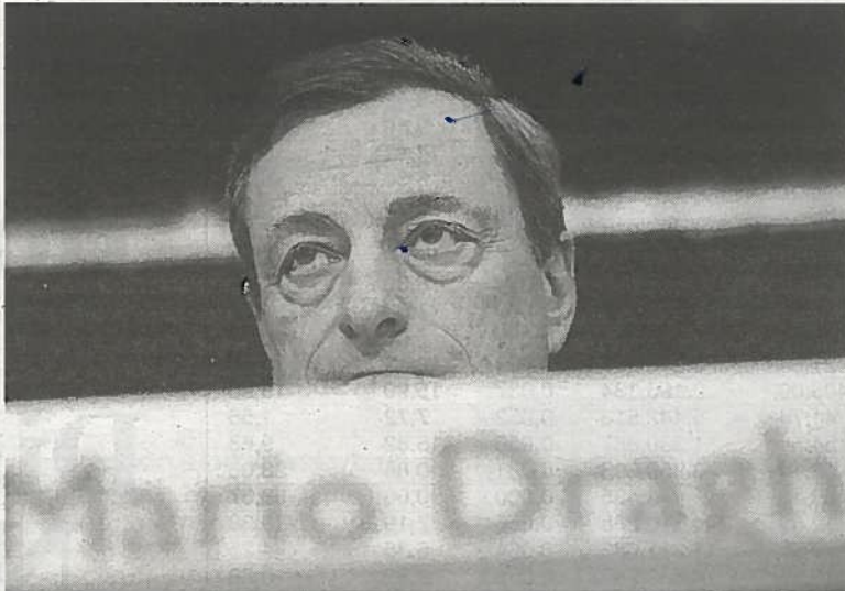
El presidente del Banco Central Europeo, Mario Draghi.

"Las próximas semanas, observaremos muy de cerca la información sobre los cambios económicos y monetarios" y "estamos preparados para actuar", lo que deja entrever que podría bajar los tipos de interés en caso de que las próximas cifras económicas señalen un debilitamiento de la economía.