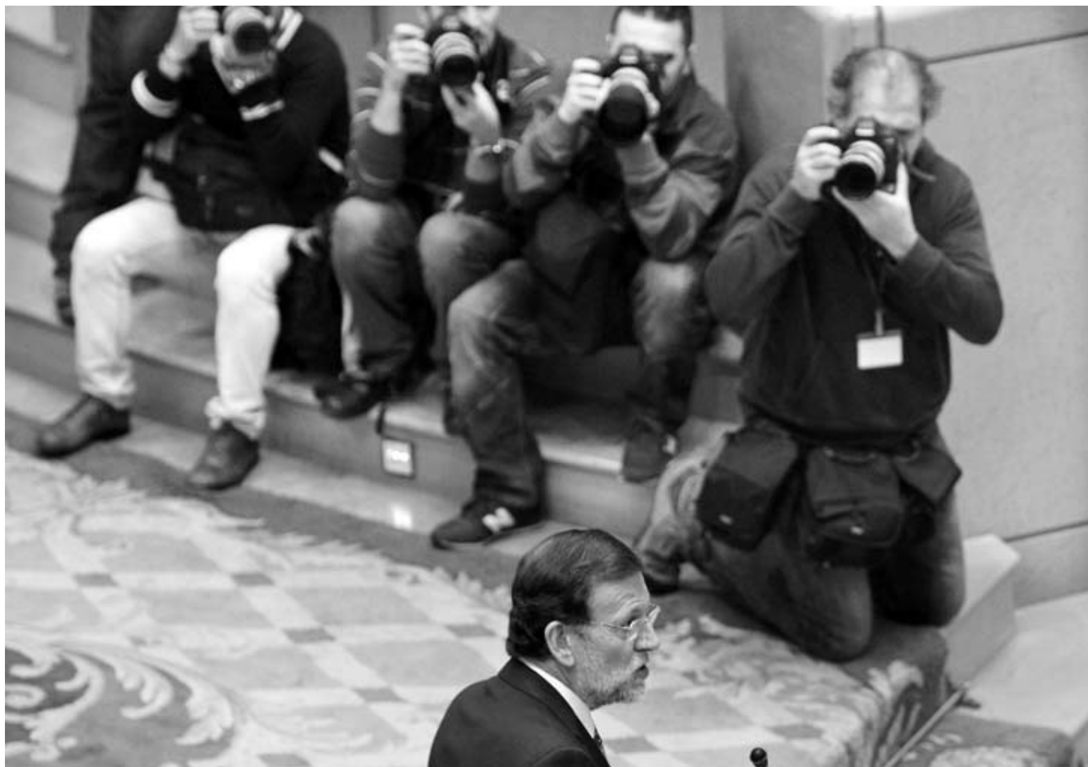
Rajoy, ante los fotógrafos de los medios de comunicación, durante su intervención ayer en la sesión de control al Gobierno del pleno del Senado.