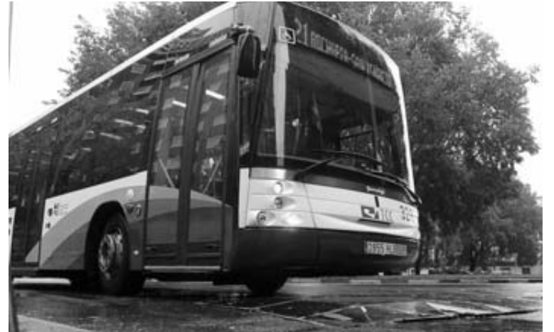
Villavesa en servicio por Pamplona.

Todos los partidos expresaron su apoyo al Transporte Urbano Comarcal y la necesidad de dotarlo de "garantías y sostenibilidad económica", detalló Mariví Castillo (UPN). Desde el PSN desligaron la bajada de usuarios de la subida de precios: "Ha caído en todas las ciudades", apuntó Maite Esporrín. El resto de grupos pidió apoyo a las demandas que planteen los sindicatos.