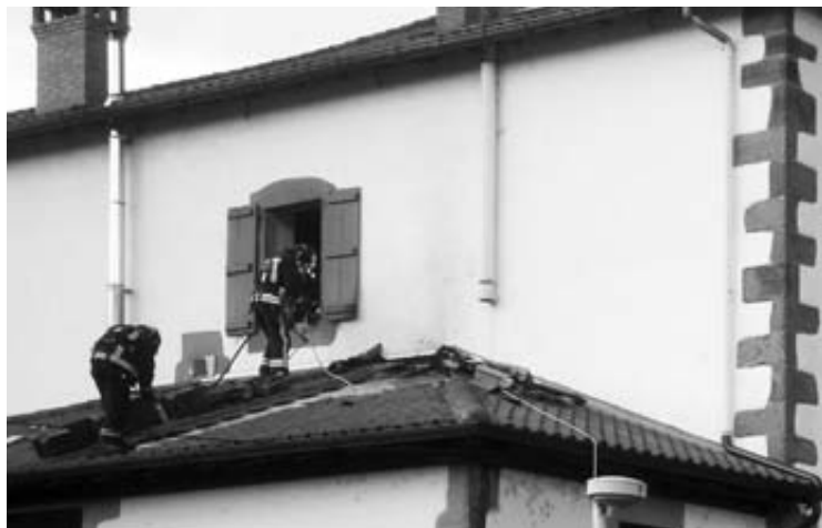
Los bomberos trabajan en la vivienda afectada.

La segunda detención se produjo este lunes, 5 de noviembre. La mujer está acusada de apropiarse de 1.300 euros que nunca llegaron a Ecuador. Los investigadores localizaron a una tercera víctima que había realizado un envío de 300 dólares desde el locutorio de la detenida y que nunca llegaron a su destinatario. Por este motivo, el ciudadano afectado presentó la denuncia.