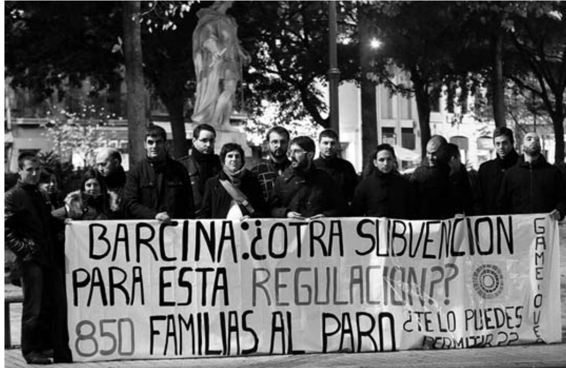
Concentración de protesta de trabajadores de Gamesa, ayer, frente al Parlamento.

El comité de empresa en Navarra pidió a Barcina que se implique para que la negociación se lleve a cabo en la Comunidad foral.