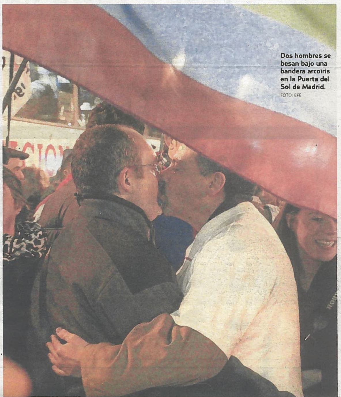
Dos hombres se besan bajo una bandera arcoiris en la Puerta del Sol de Madrid.