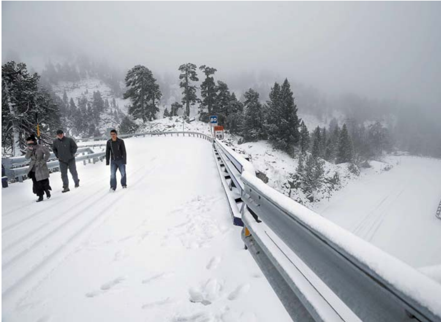
La carretera de Isaba a Francia se cubrió de nieve a su paso por Larra.

Tras una madrugada en la que se prevén heladas, las lluvias podrían reaparecer esta tarde por el sur de Navarra