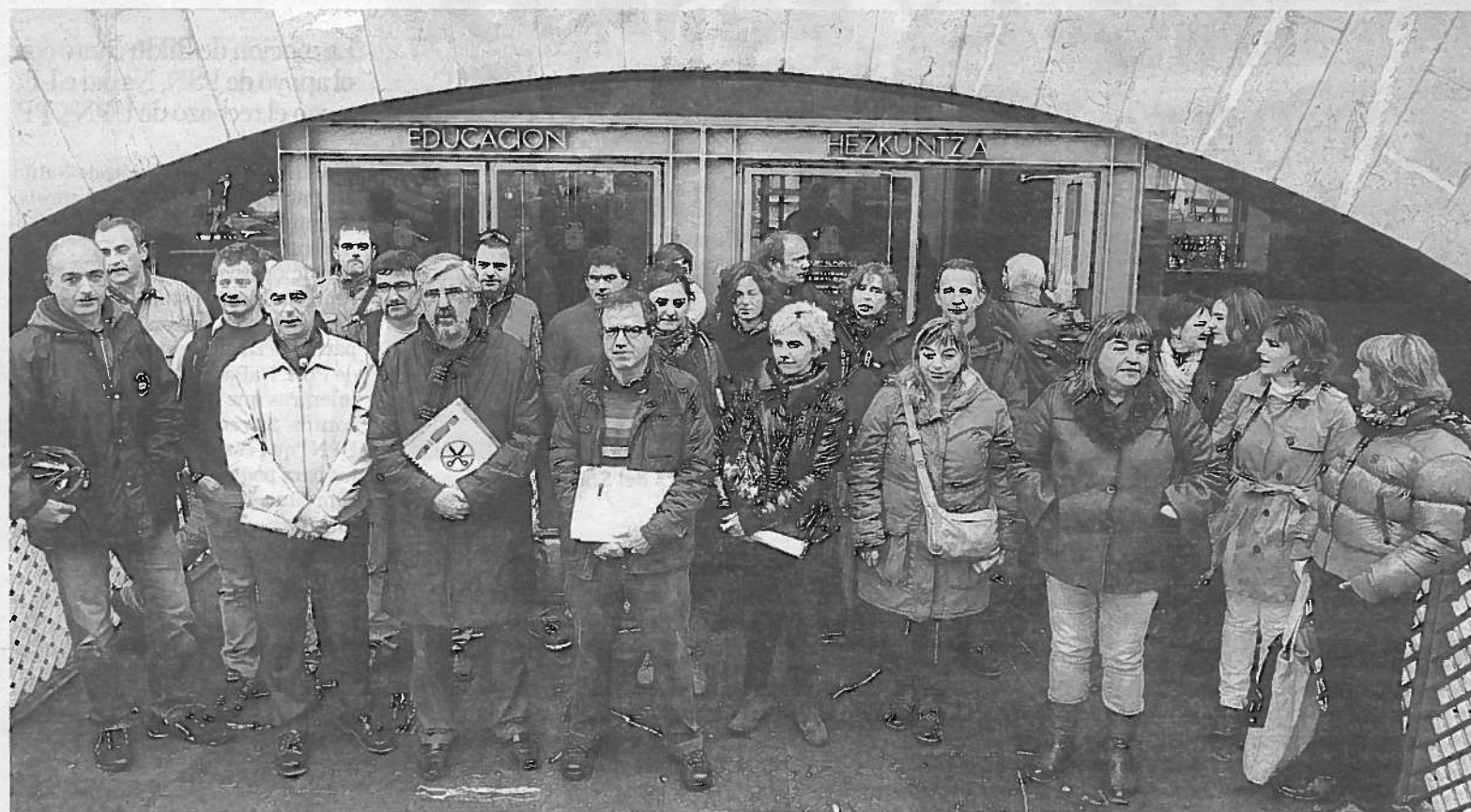
Una treintena de directores y directoras de los 57 que integran Nize, ayer tras entregar las programaciones con los efectos de los recortes.

Jornadas sobre el Ganado de Lidia. Este encuentro, que tendrá lugar en la Universidad Pública de Navarra los días 23 y 24 de noviembre, tiene como objetivo dar a conocer a estudiantes, ganaderos, profesionales, aficionados y a todas las personas interesadas en el mundo del toro los aspectos más relevantes de la cría y explotación de este tipo de ganado. Las jornadas son organizadas por la Escuela Técnica Superior de Ingenieros Agrónomos de la UPNA en colaboración con su escuela homónima de la Universidad Politécnica de Madrid (UPM). >D.N.