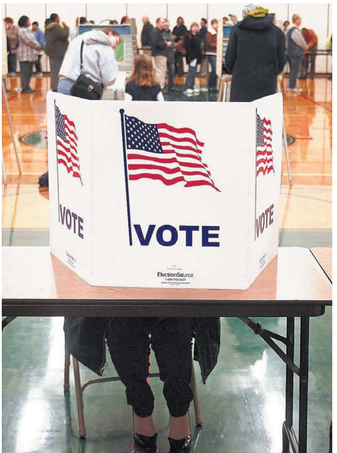
Una mujer prepara su papeleta oculta por una pantalla de cartón en un centro de votación de Michigan.