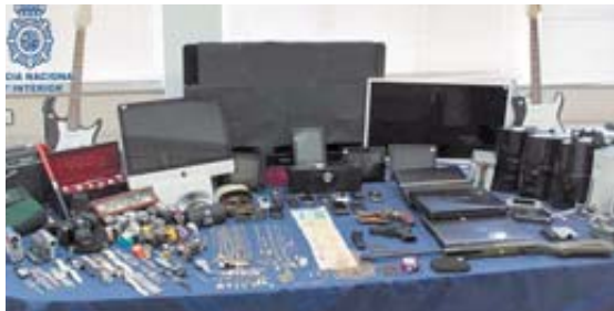
Material incautado por la Policía Nacional.