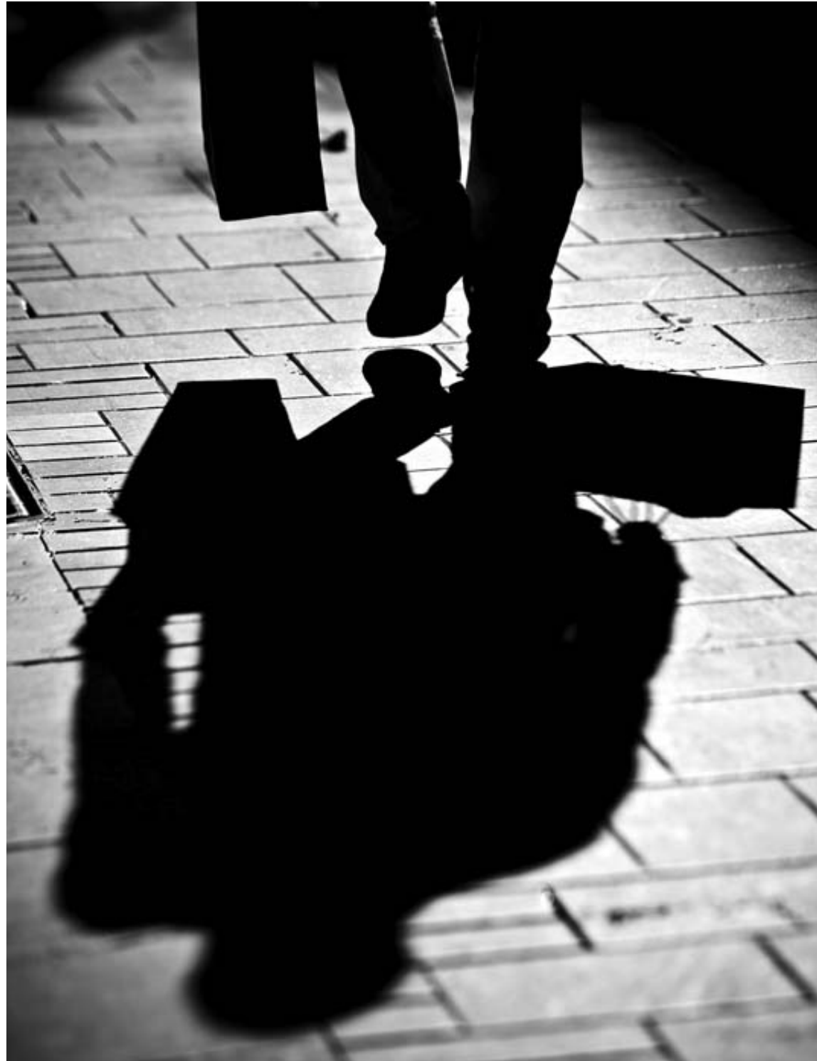
Un hombre proyecta su sombra sobre los adoquines.

En cuanto a los trabajadores con incapacidad permanente para la profesión habitual, el recorte significará que en vez de 27.770 euros percibirán ahora unos