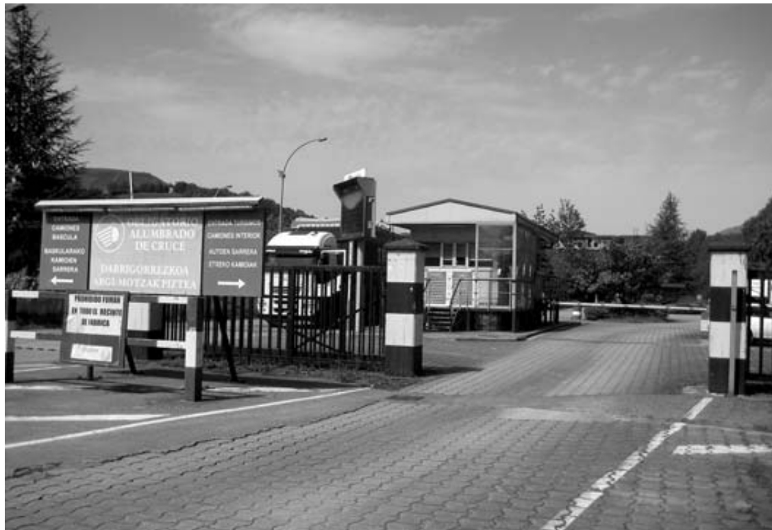
Acceso a las instalaciones de la factoría de Arcelor Mittal en Legasa.

La actual circunstancia es consecuencia del revés que sufrie-