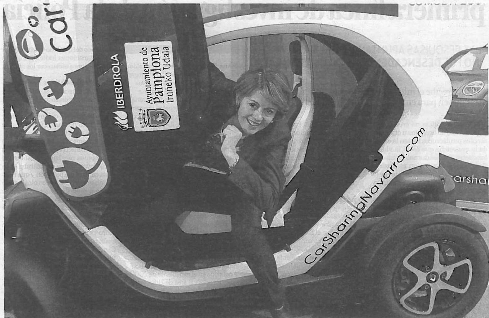
La presidenta Yolanda Barcina, ayer, durante la inauguración de la 12ª Semana de la Ciencia en Pamplona.

tes", lo que deja a UPN sin su principal aliado histórico, y al Gobierno foral en una situación de extrema debilidad. Una desconfianza que los regionalistas quieren limar con un encuentro directo en el Parlamento, previsiblemente este viernes, pero al que el PSN irá sin perspectivas de acuerdo. La disputa entra así en el terreno de las culpas y los reproches por el fracaso de la ley más importante del año. Una derrota que Barcina intenta endosar ahora a su antiguo aliado, ahora escarmentado de una experiencia que la presidenta aceptó a regañadientes y que acabó rompiendo antes de tiempo.