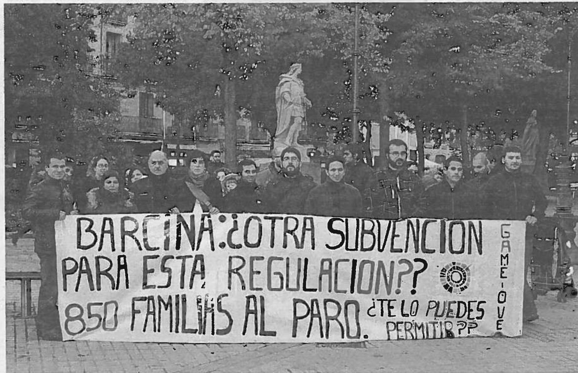
Trabajadores de Gamesa, concentrados ayer ante el Parlamento de Navarra.

Nuin (I-E) pide a la presidenta que haga valer las cuantiosas subvenciones concedidas a la empresa