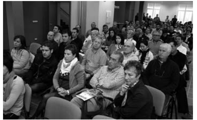
Asistentes a la asamblea de delegados de CC OO de la Ribera.