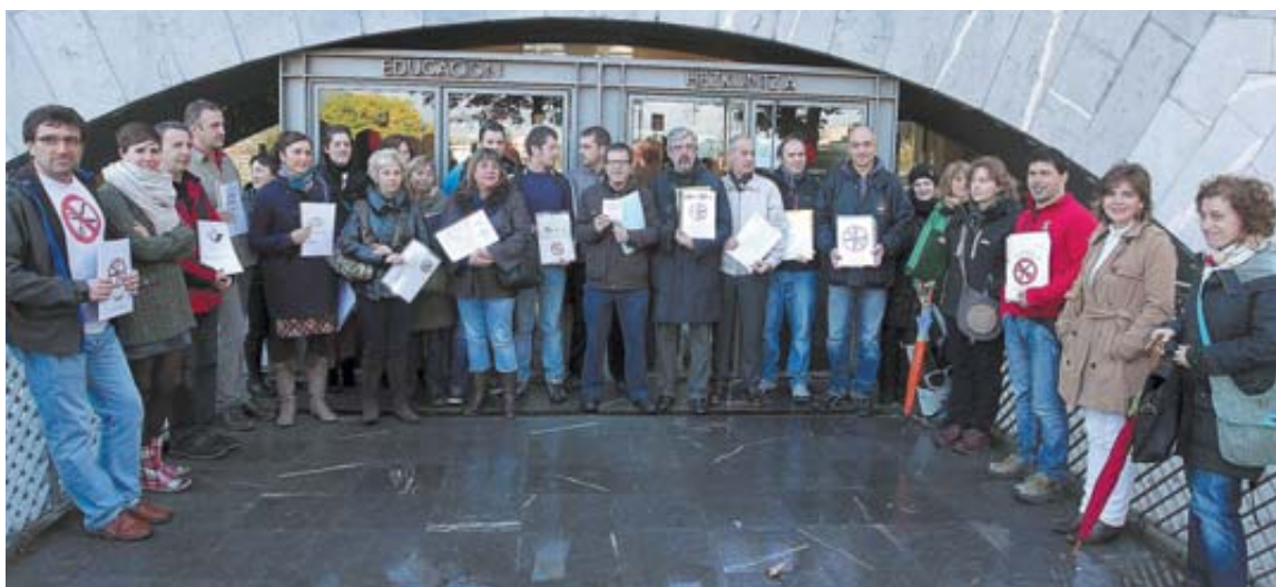
Directores de 25 de los 57 colegios públicos del modelo D (euskera), ayer por la mañana frente al Departamento de Educación, donde entregaron las programaciones de este año, como protesta por los recortes.