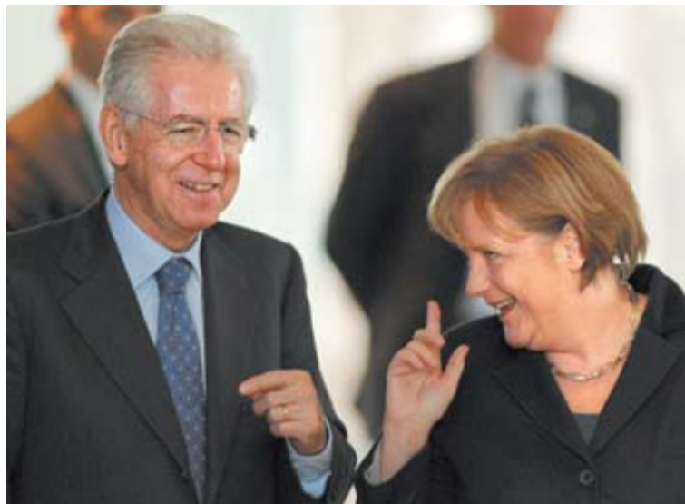
El primer ministro italiano, Mario Monti, y la canciller Angela Merkel.

La canciller alemana, Angela Merkel, prosiguió ayer su ronda de contactos de cara a la cumbre