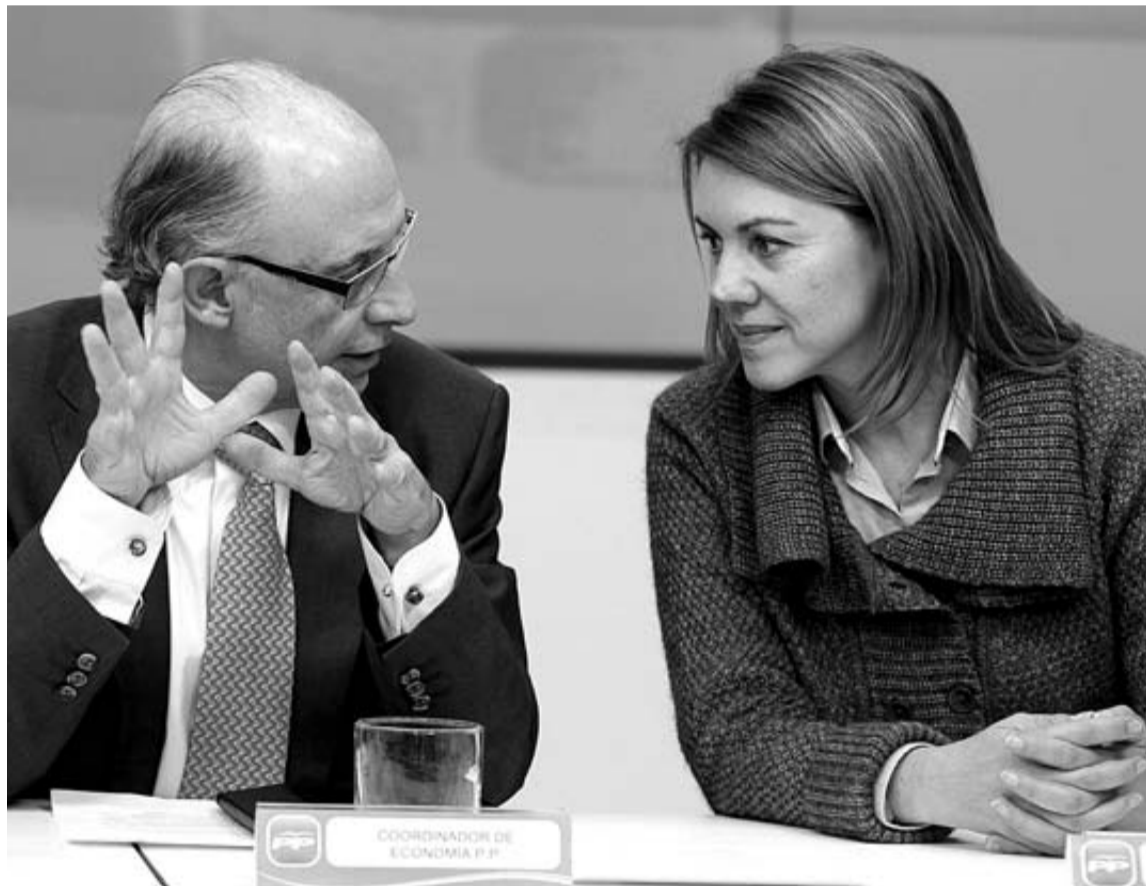
El ministro Montoro, junto a Dolores de Cospedal, encabezó la reunión con los consejeros del PP.

Preparó, además, una "respuesta común" al déficit que estas autonomías defenderán de manera conjunta próxima semana del