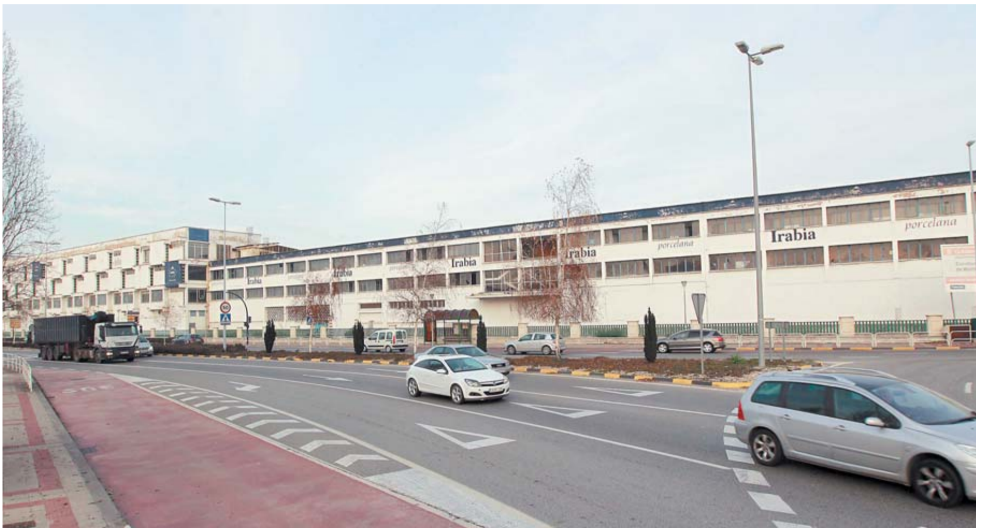
Vista de la nave de la antigua f brica de electrodom sticos Super Ser en Cordovilla, que termin  albergando a la empresa de porcelanas Nacetec antes de su abandono.

Habr  una subasta, en la que la nave de la Super Ser saldr  por 8 millones