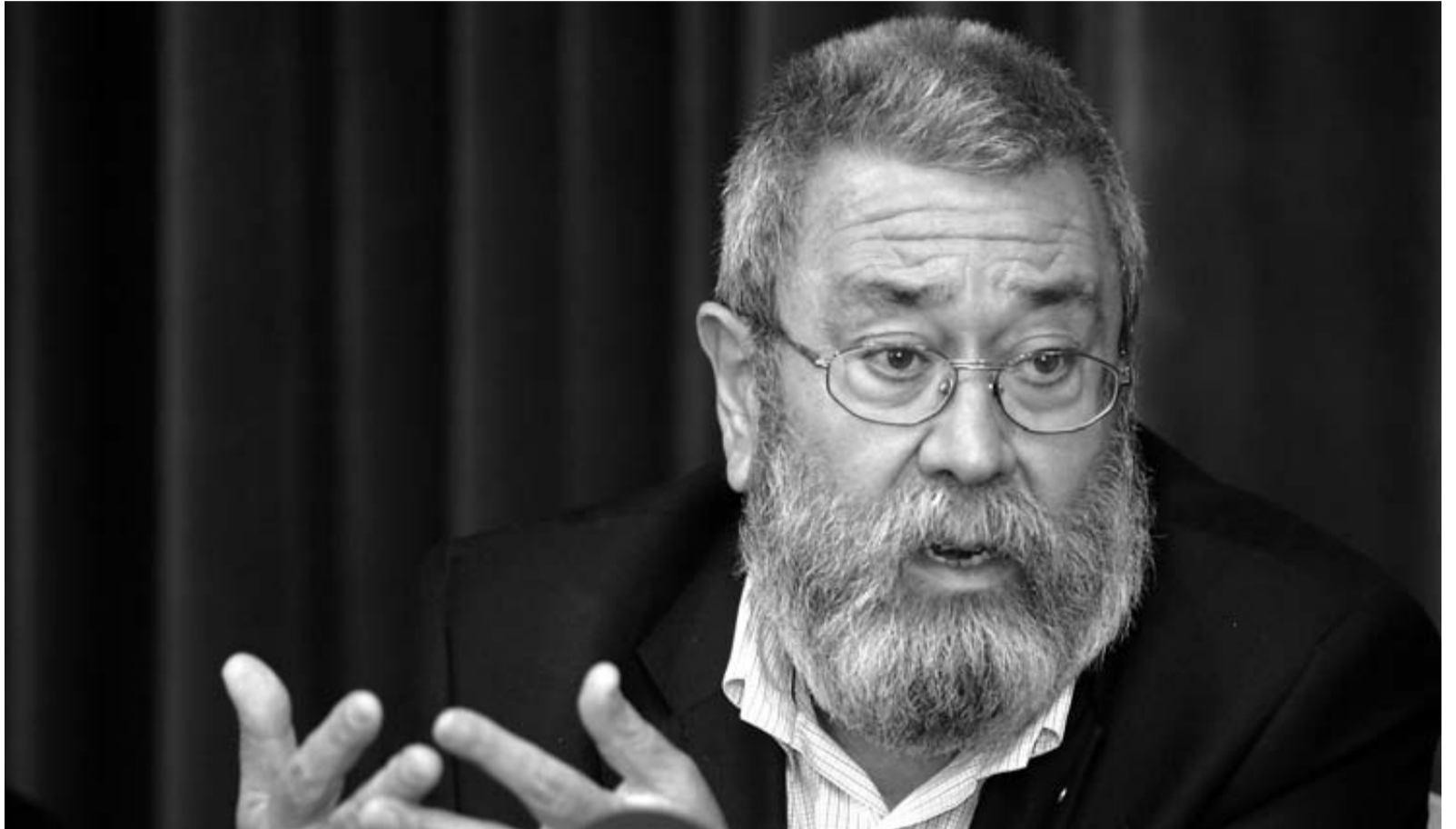
El secretario general de UGT, Cándido Méndez.

El empresario animó a CCOO y UGT a "entrar en la modernidad y el cambio" que les ofrece CEOE. Fernández recordó que la patronal demanda giros notables tanto en contratación como en despidos. Y reiteró las reclamaciones patronales de un contrato único con una indemnización por despido improcedente de 20 días y una anualidad como máximo, y de la congelación salarial durante 2012 y 2013 como paliativo a la crisis. Esto no será el bálsamo de Fierabrás, reconoció, pero "es sentar las bases de un futuro en el que poder pensar en contratar".