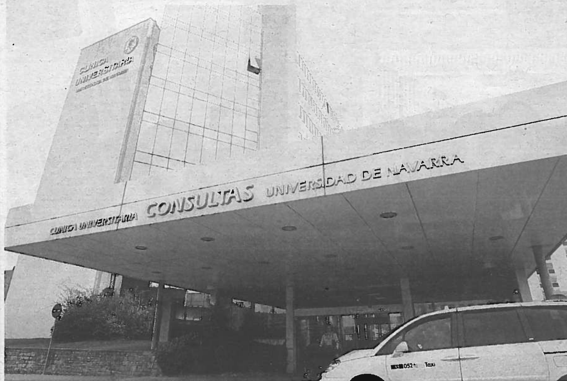
Entrada al edificio de Consultas de la Clínica Universidad de Navarra (CUN).