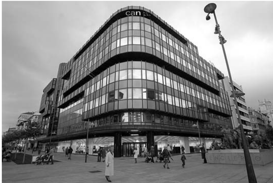
Edificio central de Caja Navarra, en imagen de archivo.

Banca Cívica está preparando un nuevo plan de ajuste de costes que incluye la posibilidad del cierre entre 2012 y 2014 de 180 oficinas de las 1.415 con las que cuenta. Además, se baraja la posibilidad de prescindir, en caso extremo, de 1.400 personas de una plantilla total de 7.800 trabajadores, según informaba ayer el periódico económico Cinco Días. El plan que baraja la dirección, contempla la posibilidad de que de las 180 oficinas que pueden cerrarse, 60 estén localizadas en la zona natural de las cuatro cajas que integran Banca Cívica y el resto correspondería a la zona de expansión. El pasado año ya se redujo la plantilla en 1.000 personas.