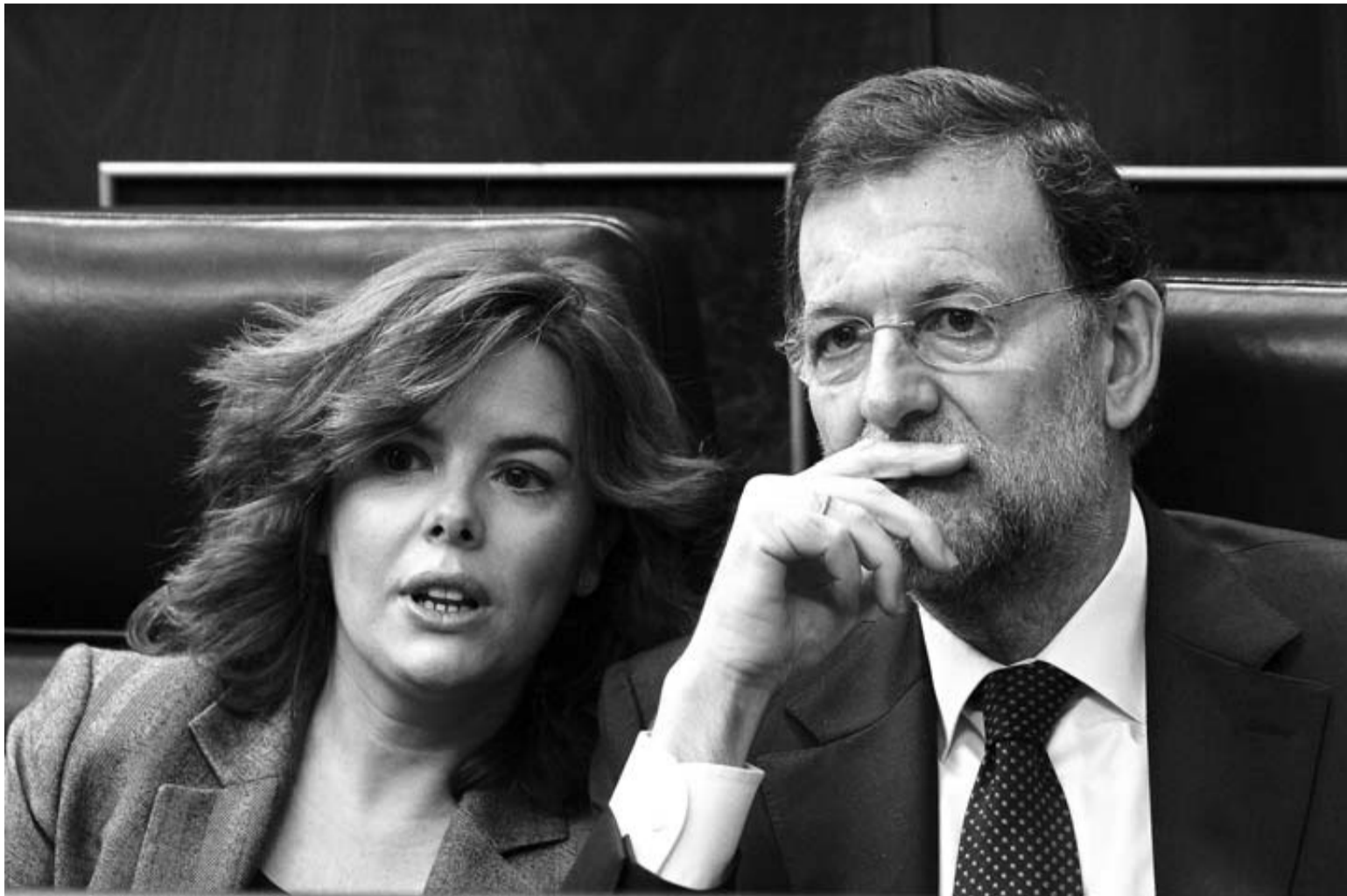
La vicepresidenta Soraya Sáenz de Santamaría y el presidente del Gobierno, Mariano Rajoy, siguen la sesión extraordinaria del Congreso.