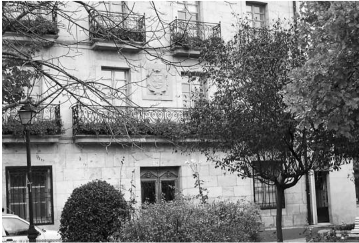
Fachada de la Casa Consistorial de Alsasua.

Junto con las visitas a las obras, los inspectores centrarán sus esfuerzos en constatar si las declaraciones de los promotores se ajustan a la realidad con el cotejo de las "cuotas fijas y variables" que componen el Impuesto de Actividades Económicas (IAE). "Es en la parte variable donde se dan las mayores