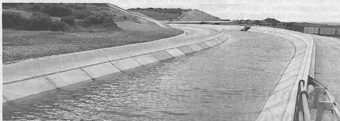
Vista del sector IX, a la altura de Pitillas, de la zona regable del Canal.

EL PORTAVOZ DEL GOBIERNO, JUAN LUIS SÁNCHEZ DE MUNIÁIN, INSISTE EN QUE "HAY FINANCIACIÓN PARA LAS OBRAS"