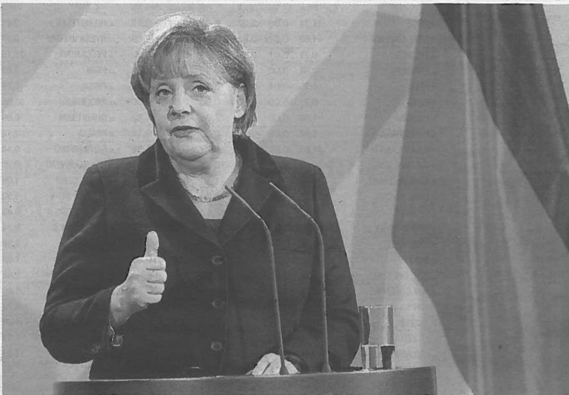
La canciller alemana, Angel Merkel.

EL DÉFICIT BAJA AL 1% Y CUMPLE POR PRIMERA VEZ EN TRES AÑOS CON LO EXIGIDO POR EL PACTO DE ESTABILIDAD