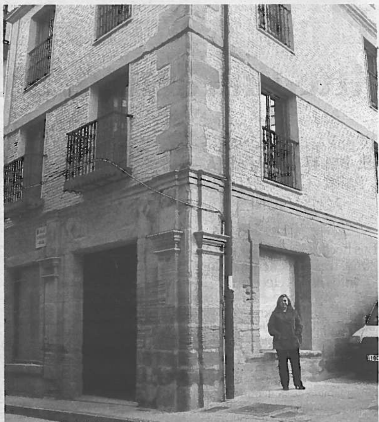
La Hospedería Chapitel es una de las empresas asesoradas.

● En 2010. Los últimos datos que tienen recopilados son los de 2010, con 32 nuevas empresas y 44 empleos, cifra superior a años anteriores. Hubo 156 consultas, y la inversión total fue de 847.000 euros, con subvenciones de 128.800.