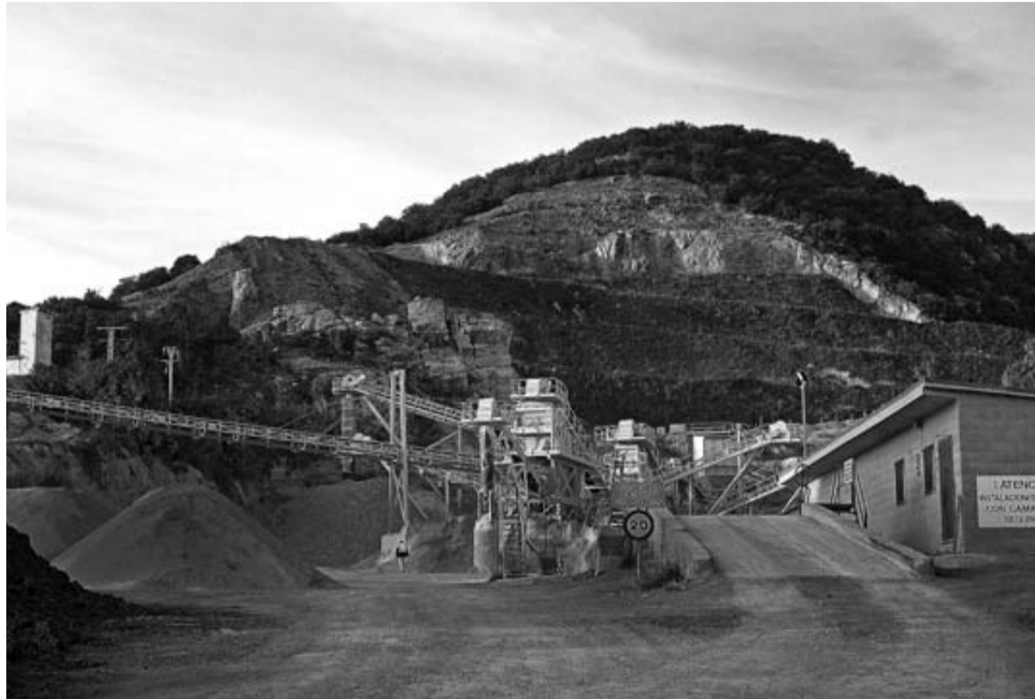
Una imagen de la cantera de Vresa en Murieta, uno de los seis centros de producción.

Además, en el compromiso sellado se incluye una mejora económica para las indemnizaciones, que además del mínimo de 20 días por año con un máximo de 360 días se incrementará con 5.000 euros lineales para los tres trabajadores despedidos.