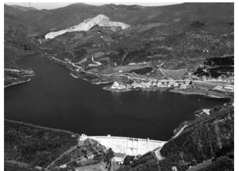
Vista del pantano de Eugi, rodeado de montes.