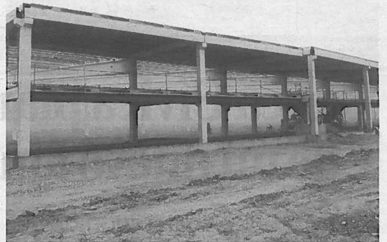
Las instalaciones están en construcción en Mendavia.

Sobre la posible creación de puestos de trabajo por la entrada en funcionamiento del nuevo complejo, desde la empresa prefirieron ser cautos "para no generar falsas expectativas", aunque sí confirmaron que se generarán empleos "aunque el número va a depender de muchas cosas", advirtió Pedro Ochoa. En la actualidad, la firma da empleo en sus instalaciones navarras a alrededor de medio centenar de personas.