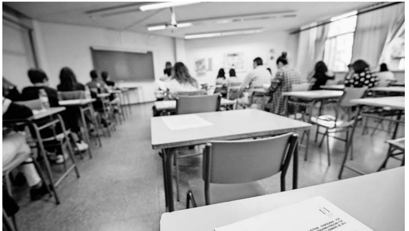
Aspirantes a una oposición celebrada en una comunidad autónoma española.

La sentencia, que aún puede ser recurrida, se sitúa en la línea de las conclusiones que presentaron hace un par de semanas los abogados generales del Tribunal de Justicia de la Unión Europea (TJUE), que estimaron que los interinos españoles ni tienen derecho a convertirse automáticamente en fijos tras encadenar sucesivos contratos temporales, aunque piden una sanción disuasoria a la Administración; ni tienen derecho a una indemnización cuando sean despedidos. Pero aún falta la sentencia definitiva.