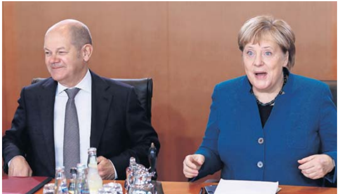
El ministro de Finanzas alemán, Olaf Scholz, junto a la canciller Angela Merkel.