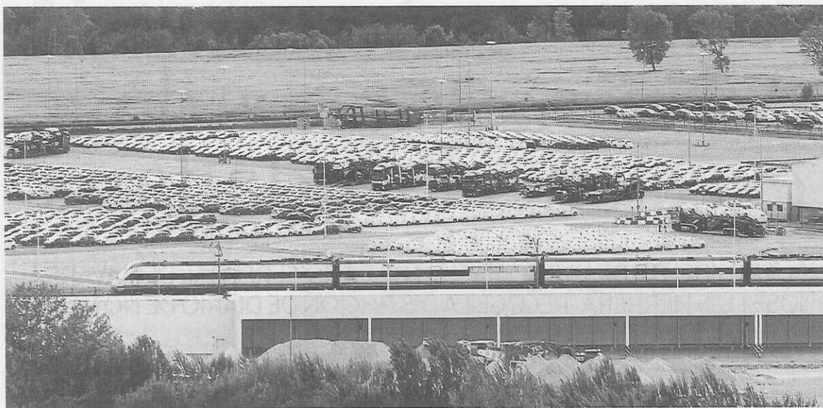
Coches aparcados junto a la planta de Volkswagen Navarra.