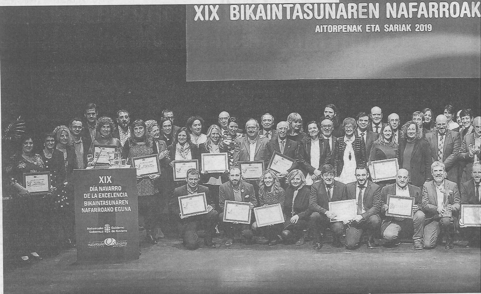
Representantes de las entidades y empresas distinguidas en el 19º Día Navarro de la Excelencia, celebrado ayer en Baluarte.

–En 1994 la residencia ofertaba 34 plazas y empleaba a nueve personas, semejante a un pequeño hotel, pero con barreras arquitectónicas. Trabajé por una residencia mayor, moderna y sostenible. Desde diciembre de 2008, contamos con un edificio más amplio y equipado. Decidimos derribar la antigua residencia y construir otra. Fueron años de proyectos y de reuniones con el Gobierno de Navarra para conseguir financiación, fue una etapa muy dura y complicada, pero aquí estamos 75 residentes, con 25 plazas de día y 34 trabajadores muy contentos y felices. –S.Z.E.