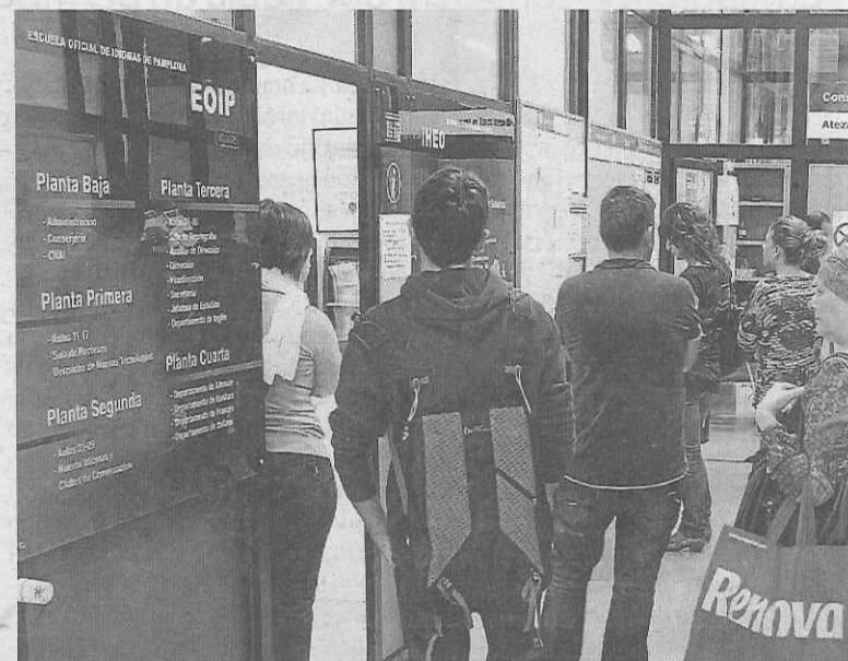
Un grupo de personas, esperan a acceder a Secretaría.

Esta profesora recuerda que en la EOIP "no somos muchos docentes en comparación con Secundaria pero estamos formando a muchos profesores y profesoras que necesitan certificar su nivel CI para impartir el PAI". En Navarra, prosiguió, "se ha apostado por este programa de aprendizaje en inglés y creemos que hay que apos-