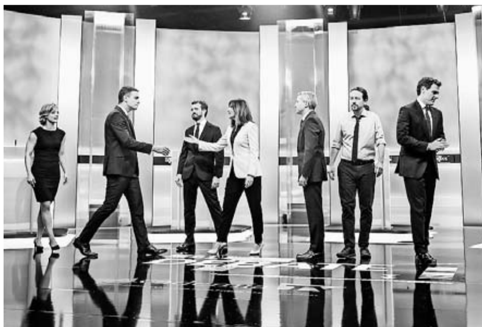
Candidatos intercambian saludos antes del debate.

La pregunta tras un debate entre líderes políticos que se juegan las elecciones es tratar de determinar quién ha ganado. Por una especie de pacto no escrito a esa manera de interpretar se prestan siempre periodistas y analistas de los medios de comunicación. En el soporífero encuentro de candidatos del lunes que se extendió hasta la madrugada si alguien ganó fue el aburrimiento. Aquello se convirtió en un circo en el que los acróbatas realizaban en noviembre los mismos números que les vimos en abril. Ni los intentos de animar con fuegos