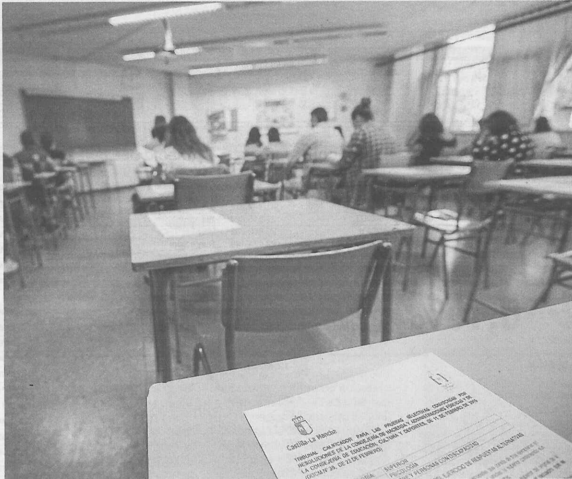
Una de las pruebas de las oposiciones convocadas en Castilla-La Mancha.

La Audiencia Nacional entiende que el acuerdo de mejora del empleo público que se firmó en 2017 no requería publicación ni informe de la Intervención porque no tiene