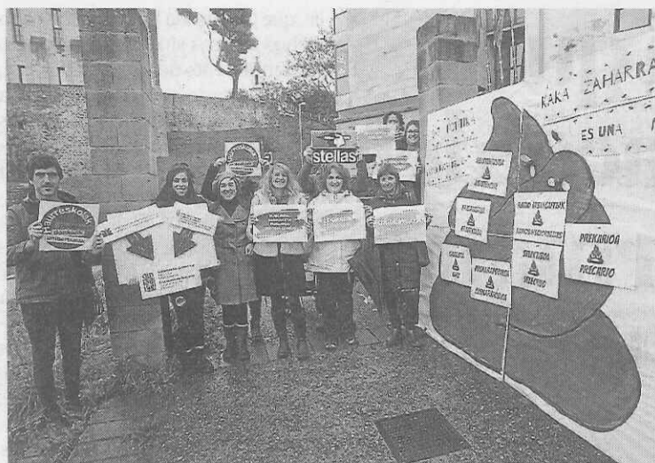
Representantes de Steilas, frente al departamento.