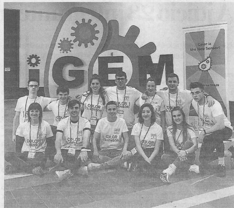
Los estudiantes que acudieron a Boston posan en el concurso.

El concurso iGEM ofrece a estudiantes la oportunidad de superar los límites de la biología sintética, un área emergente de investigación en la que el trabajo genético se aborda desde la perspectiva de la ingeniería. En otras palabras: se manipula la genética de los seres vivos para que cumplan tareas para las que no están preparados. Cada año, 6.000 personas dedican el verano a este certamen y después se reúnen para la final. -D.N.