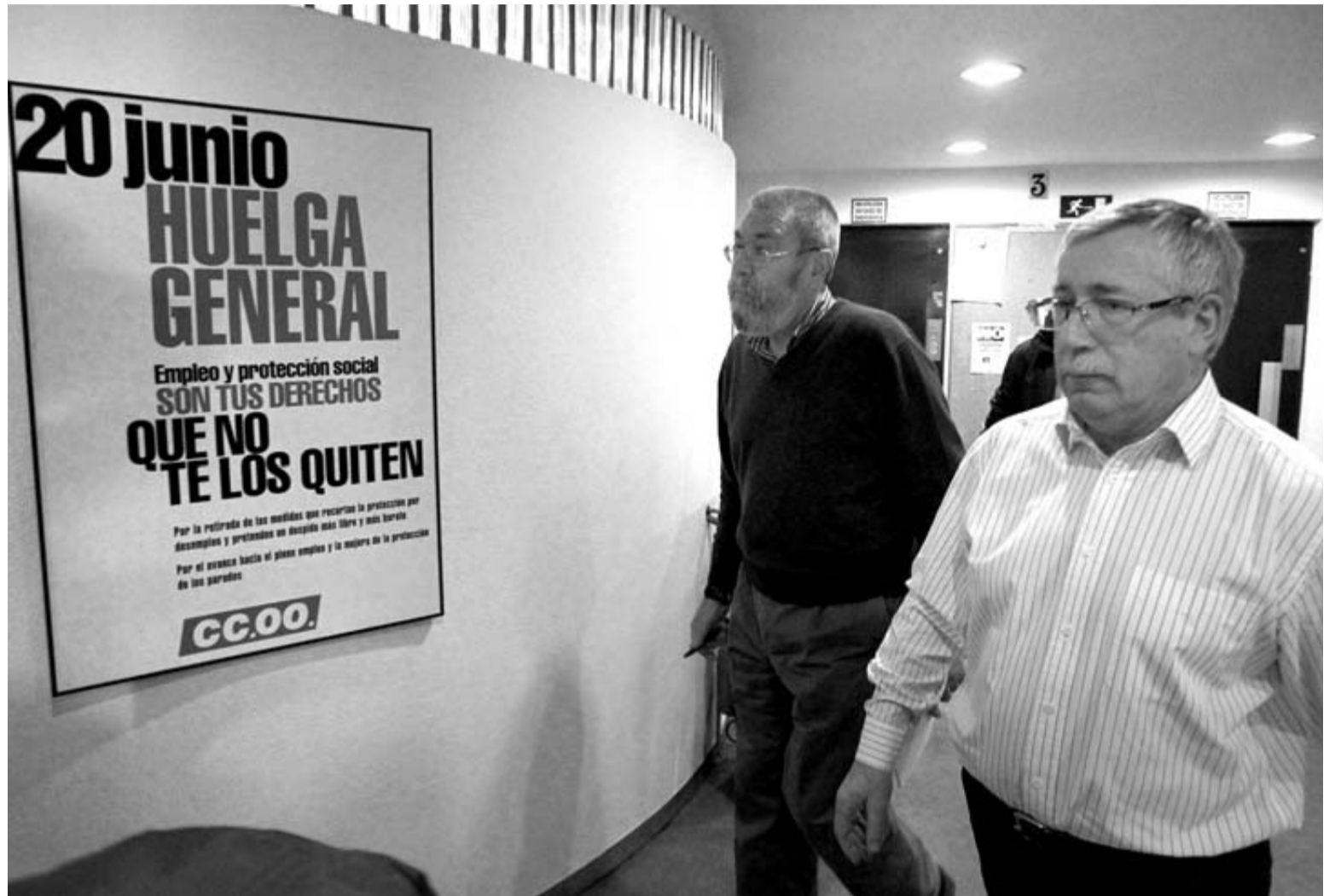
Cándido Méndez e Ignacio Fernández Toxo pasan junto a un cartel de la huelga general del 20 de junio de 2002, contra la reforma laboral de Aznar.

Los líderes de CC OO, Ignacio Fernández Toxo, y de UGT, Cándido Méndez, que ayer presentaron una plataforma social para la defensa del Estado de bienestar, instaron al Gobierno a "leer bien" el mensaje lanzado por la ciudadanía en unas manifestaciones a las que consideraron "las más