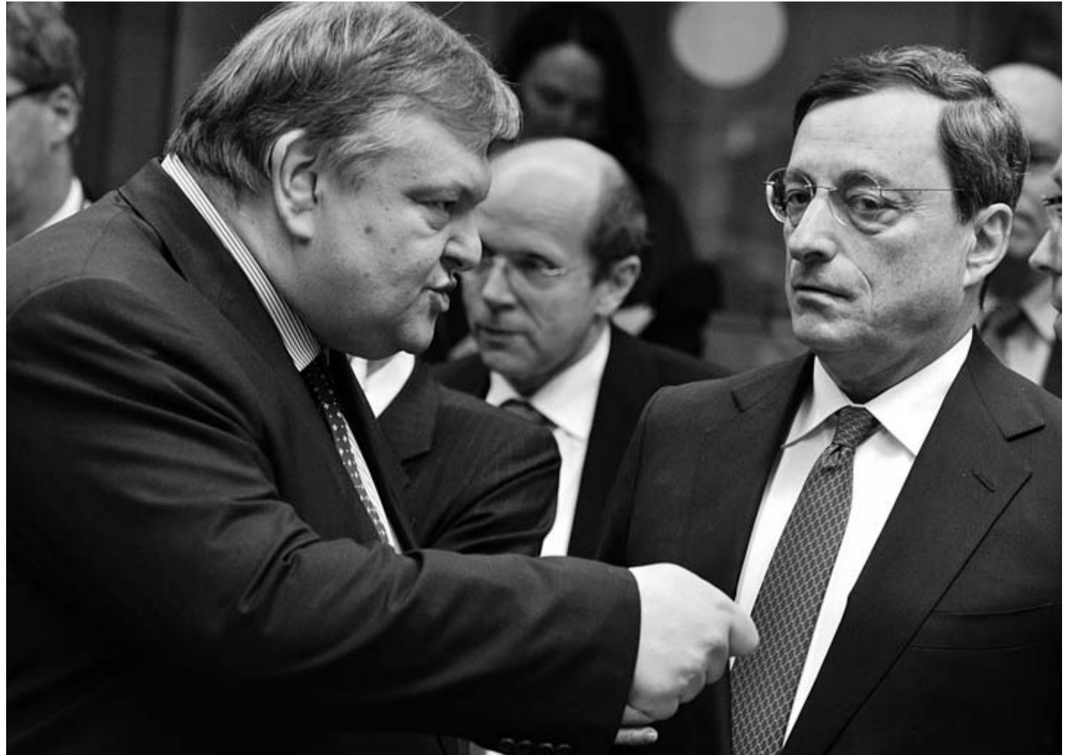
El ministro griego de Finanzas, Evangelos Venizelos (izquierda), se dirige al presidente del BCE, Mario Monti, ayer en Bruselas

Con la reducción de la deuda nacional convertida en reto prio-