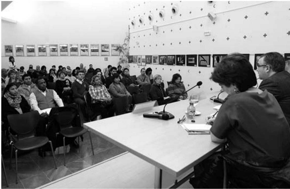
Distintos colectivos de inmigrantes, durante la reunión de ayer en la sede de la Cruz Roja.