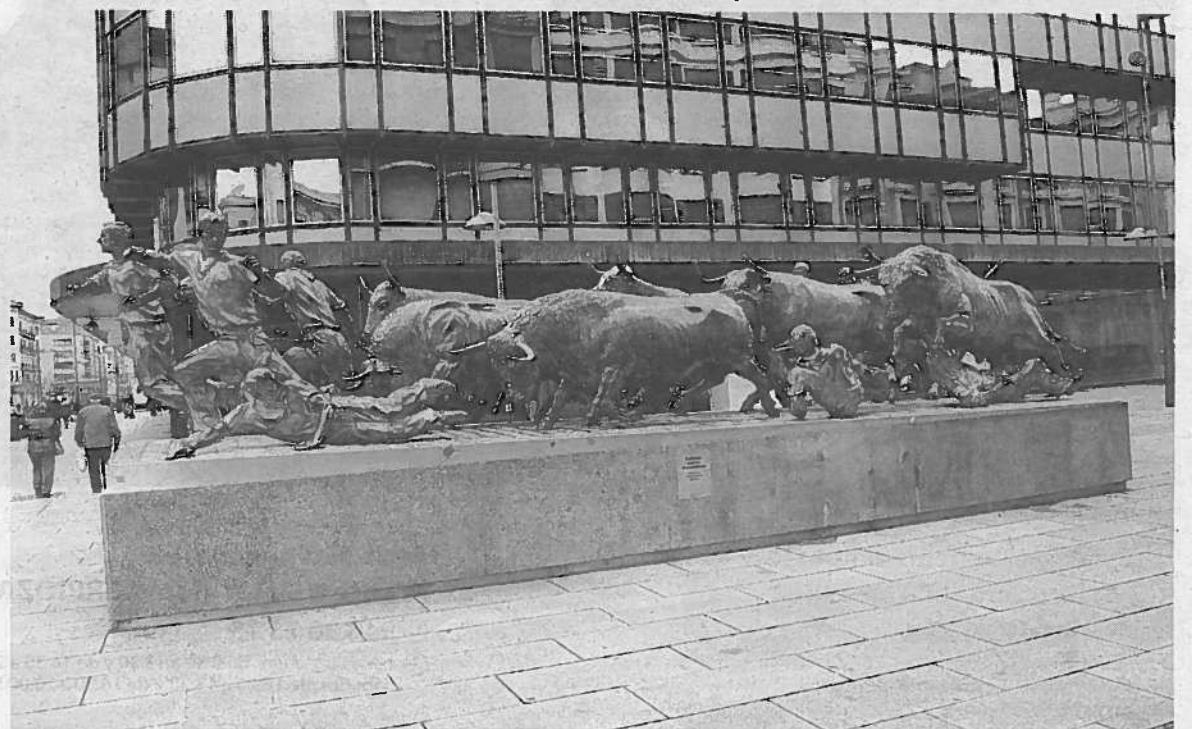
Una imagen del Monumento al Encierro de la avenida Roncesvalles.

Conviene recordar que además la estatua está vigilada permanentemente por una cámara de videovigilancia y que la semana pasada se instalaron tres pequeñas placas de 40x30 centímetros que anuncian la prohibición de subirse al monumento. Las placas están colocadas en los laterales y la parte trasera de la escultura y resultan de un tamaño bastante reducido, lo que dificulta que llamen la atención a turistas que desconocen la ciudad. >D.N.