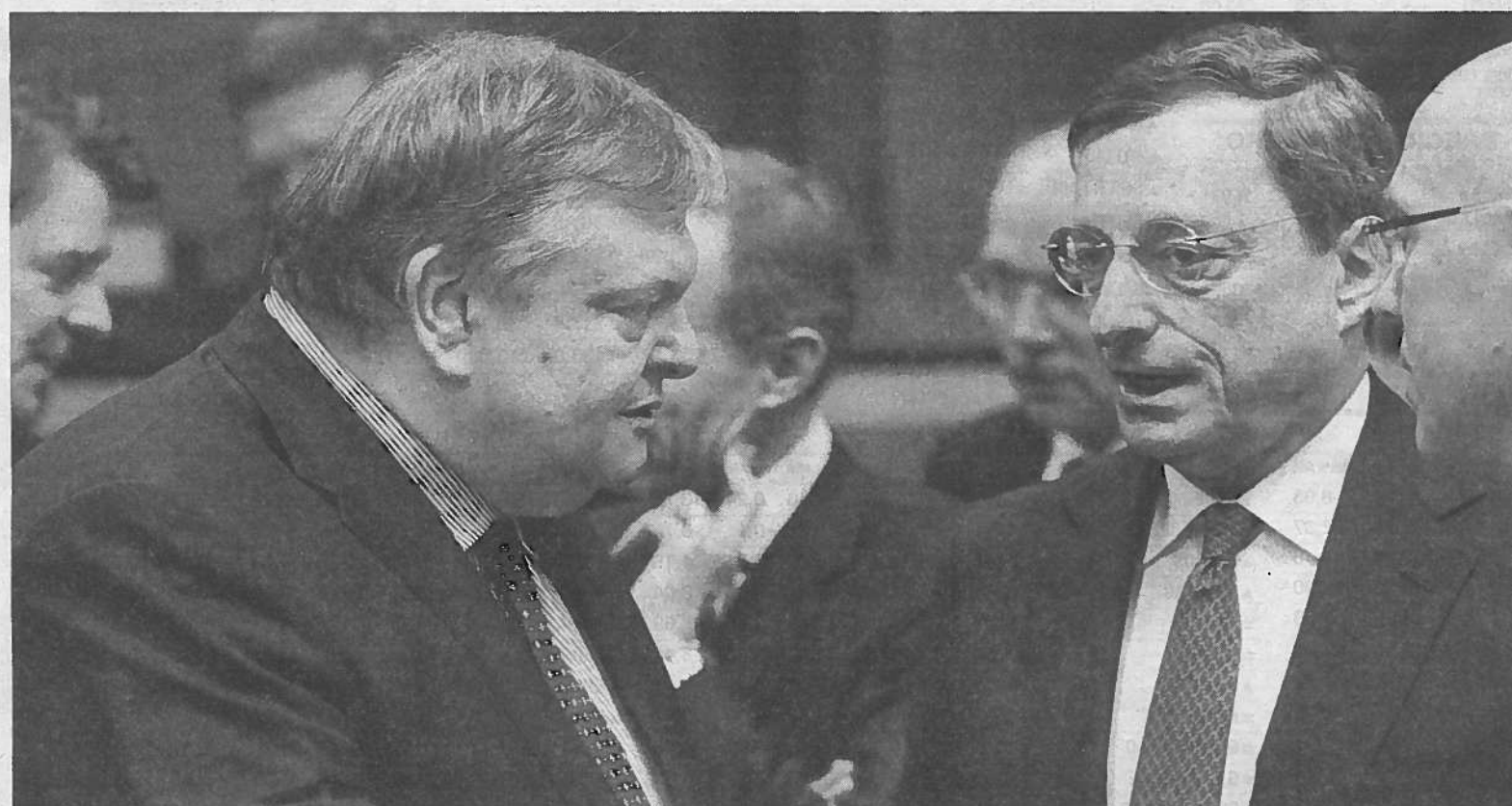
El ministro de Finanzas griego, Evangelos Venizelos (i), charla con el presidente del Banco Central Europeo (BCE), Mario Draghi.

Iberia anuló ayer 153 vuelos, 21 de ellos entre Madrid y Barcelona, con motivo de la décima jornada de huelga convocada por la sección sindical de Sepla en la aerolínea en protesta por la creación de Express. La compañía informó además de que se vieron afectados también dos vuelos del sábado 18 de febrero. La mayoría eran vuelos nacionales y otros con destino a Bruselas, Amsterdam, París, Munich, Zúrich, Ginebra, Frankfurt, Berlín, Estambul, Roma, Lisboa, Milán y Venecia, así como a Nueva York, México, Tel Aviv, Buenos Aires y Sao Paulo. Fomento había establecido como servicios mínimos todos los vuelos a Canarias y Baleares; el 50% de los vuelos nacionales cuyo tiempo de viaje fuera superior a cinco horas y el 25% de los vuelos peninsulares inferiores a cinco horas, así como y el 50% de los vuelos internacionales. >E.P.