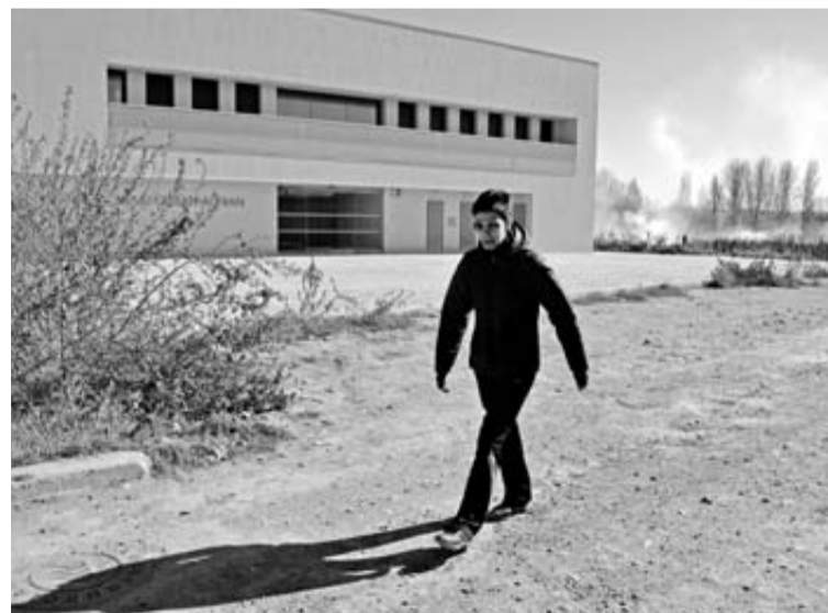
Entrada por la calle El Plantío al centro de salud.

Según explicó el alcalde de San Adrián, Emilio Cigudosa, cuando se acordó construir el nuevo cen-