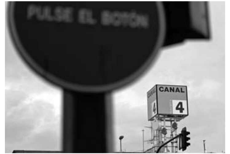
Antenas y rótulo de Canal 4, en el polígono de Cordovilla. GARZARON

Para el magistrado, los tres actuaron "de común acuerdo" para "agradecer los improbables esfuerzos que como máxima responsable política de Navarra estaba realizando por la imposición de esa infraestructura", además de ser "una elegante manera de darle la bienvenida a su nuevo cargo". Esas expresiones, recogidas por el juez en su auto, figuraban en un comunicado hecho público por "Mugitu!" en internet el mismo día de los hechos.