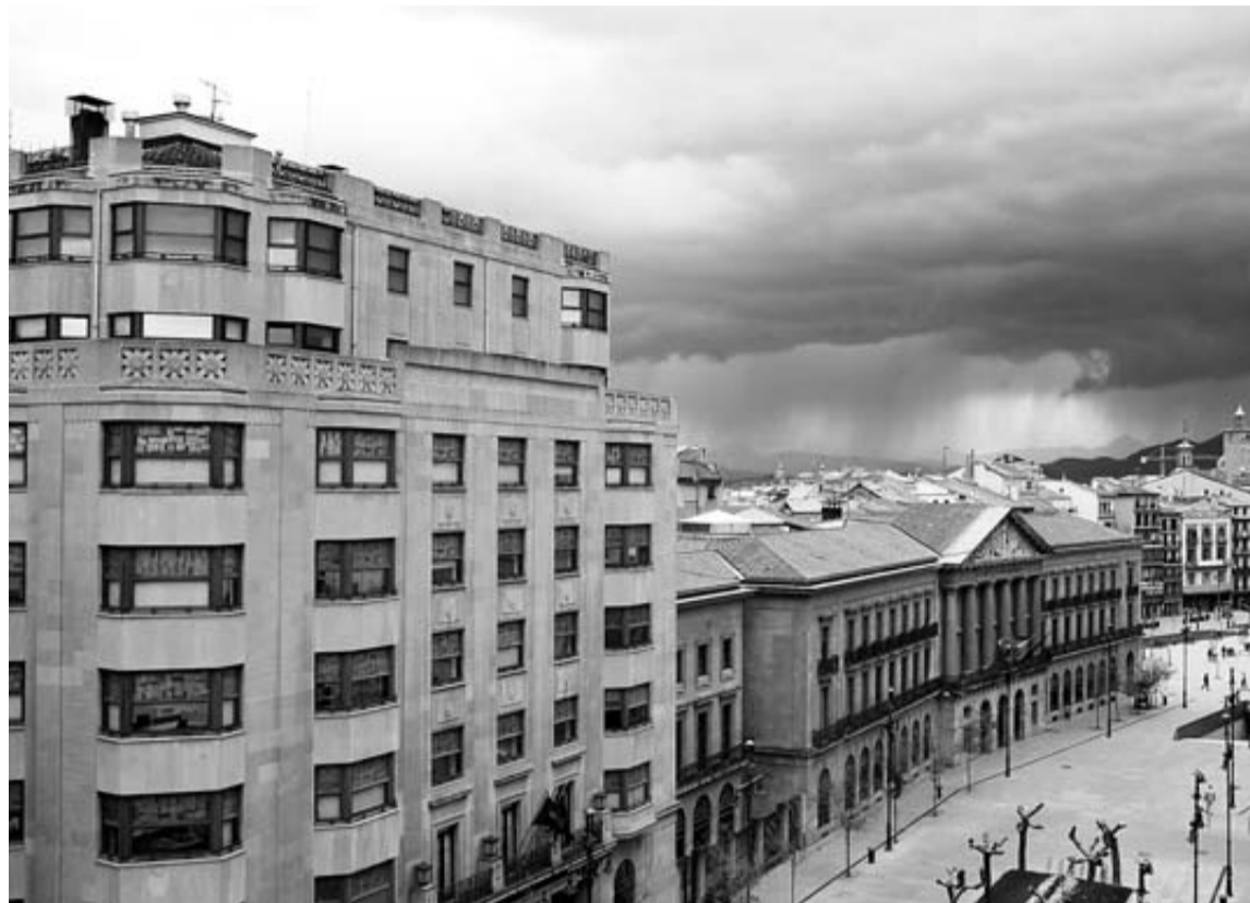
El edificio de la Hacienda Foral y el Palacio de Navarra, en la Avenida Carlos III.

La Mesa y Junta de Portavoces del Parlamento acordó ayer, a petición de Bildu e I-E, que comparezcan en el Parlamento, tanto el consejero Jiménez, como los sindicatos presentes en la Mesa General de la Función Pública para