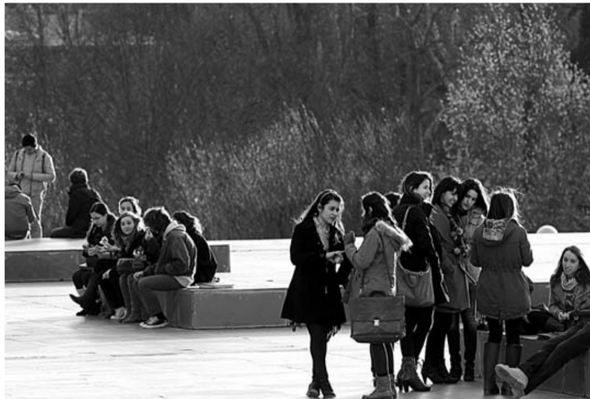
Estudiantes en las inmediaciones del edificio de Comunicación de la Universidad de Navarra.

Tal y como explicaron ayer desde el centro académico, la medida afectará "fundamentalmente" a la velocidad de la puesta en