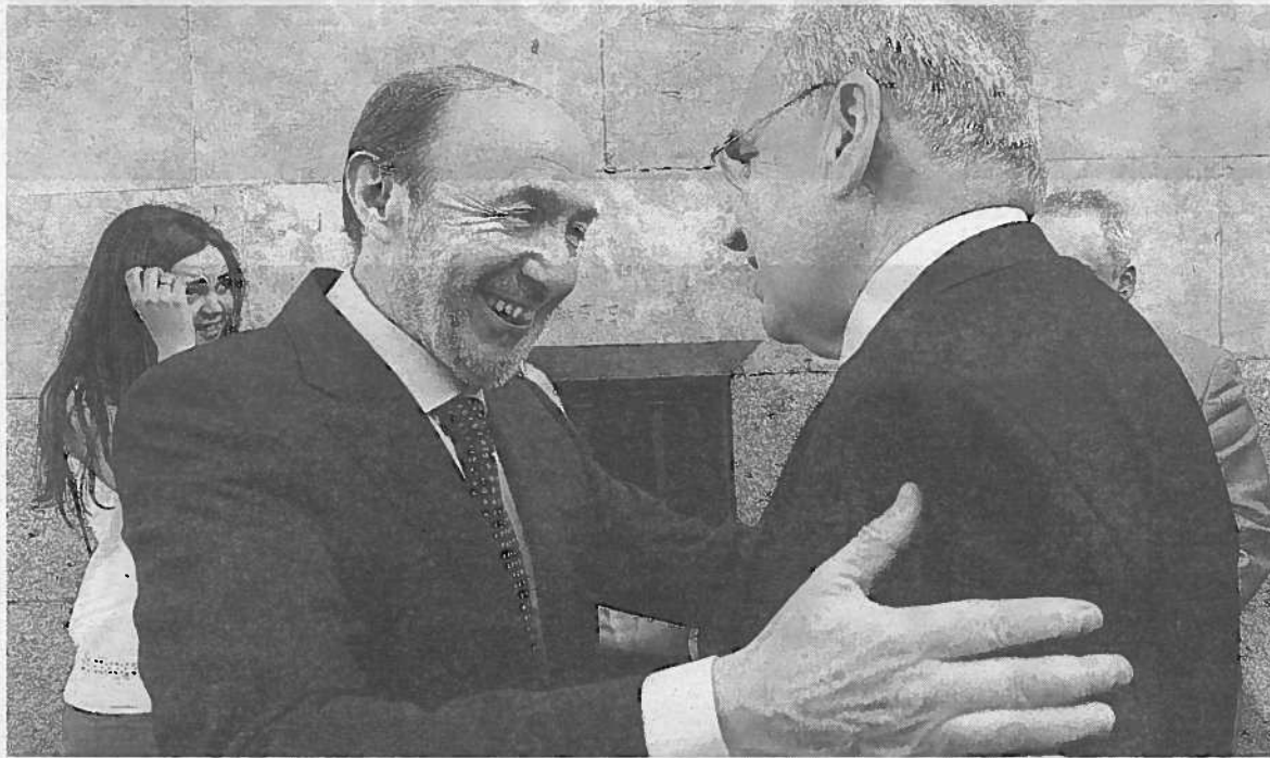
Alfredo Pérez Rubalcaba saluda a Alfonso Guerra en la clausura del X Encuentro Salamanca.