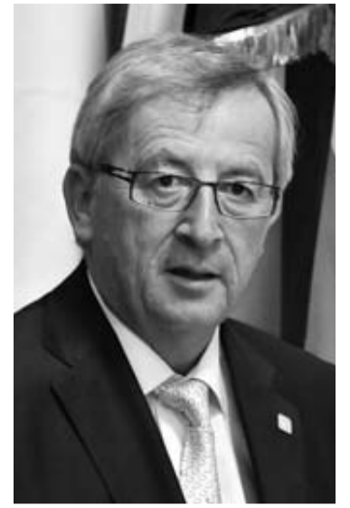
Jean-Claude Juncker.

A su juicio, la situación de España e Italia difiere de la de Grecia porque los dos primeros países "ya cumplen las condiciones