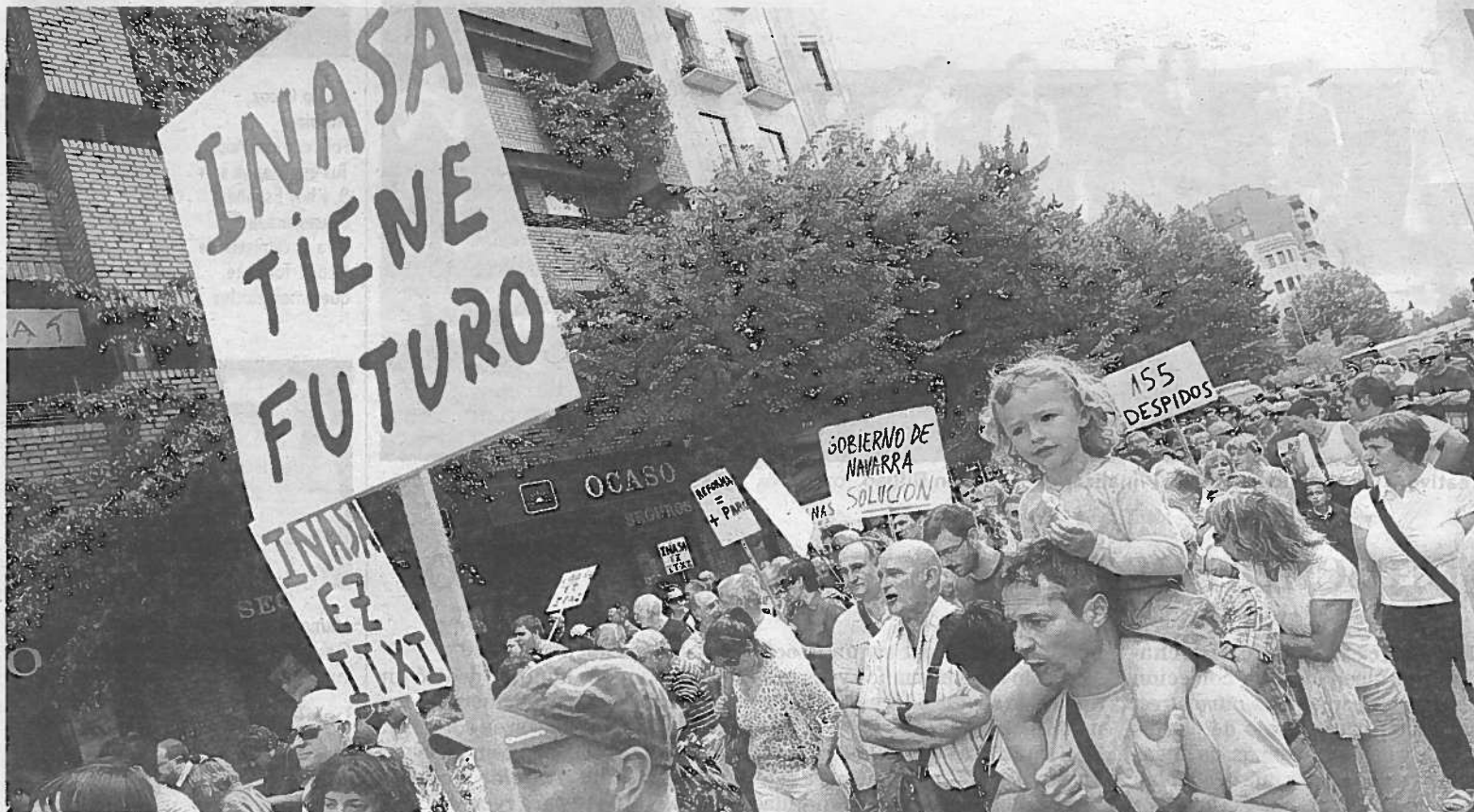
Los trabajadores de Inasa, durante la protesta a su paso por la avenida Baja Navarra.

RUBALCABA PIDE "RAPIDEZ" EN LAS MEDIDAS DE LA UE P. 43