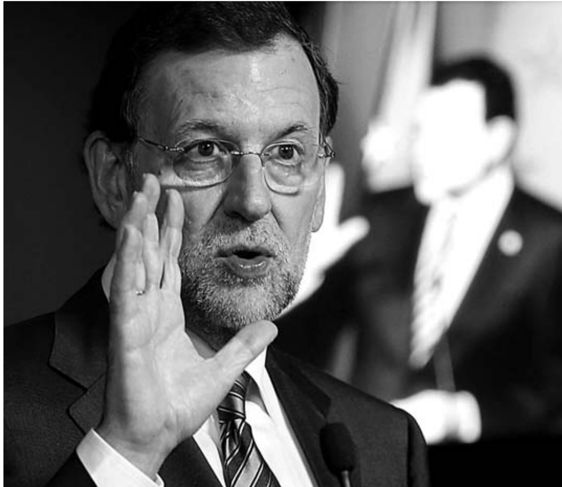
El presidente del Gobierno, Mariano Rajoy, durante la rueda de prensa que ofreció tras la cumbre.

La más inmediata pasa por rematar el rescate bancario. Los expertos comunitarios analizan actualmente el estado del sector financiero para fijar las condiciones del salvavidas. Todavía falta por saber cuánto dinero pedirá finalmente el Ejecutivo, así como los plazos y los intereses que se aplicarán a los préstamos.