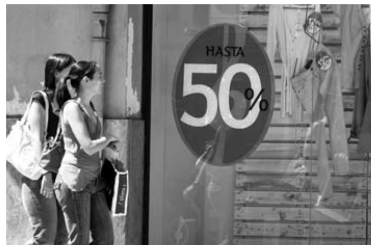
Un establecimiento comercial con el anuncio de hasta el 50% de rebajas.

No obstante, el lado positivo es que gastará más que en ediciones anteriores. "Aumentará el gasto previsto por primera vez en seis años, ya que cada español gastará una media de 60 euros, un 16,6% más que en 2011", apuntan desde la Federación de Usuarios y Consumidores Independientes. Igualmente, la Confederación Española de Comercio