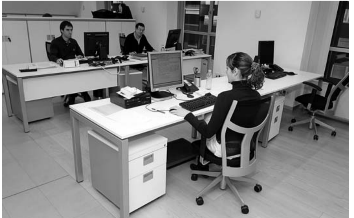
Trabajadores del departamento de Hacienda, en una visita al edificio el pasado año.

La jornada diaria de trabajo de lunes a viernes tendrá, con carácter general, una duración de 7 horas y 30 minutos. Se trabajará de forma obligatoria de 8:00 a 15:00