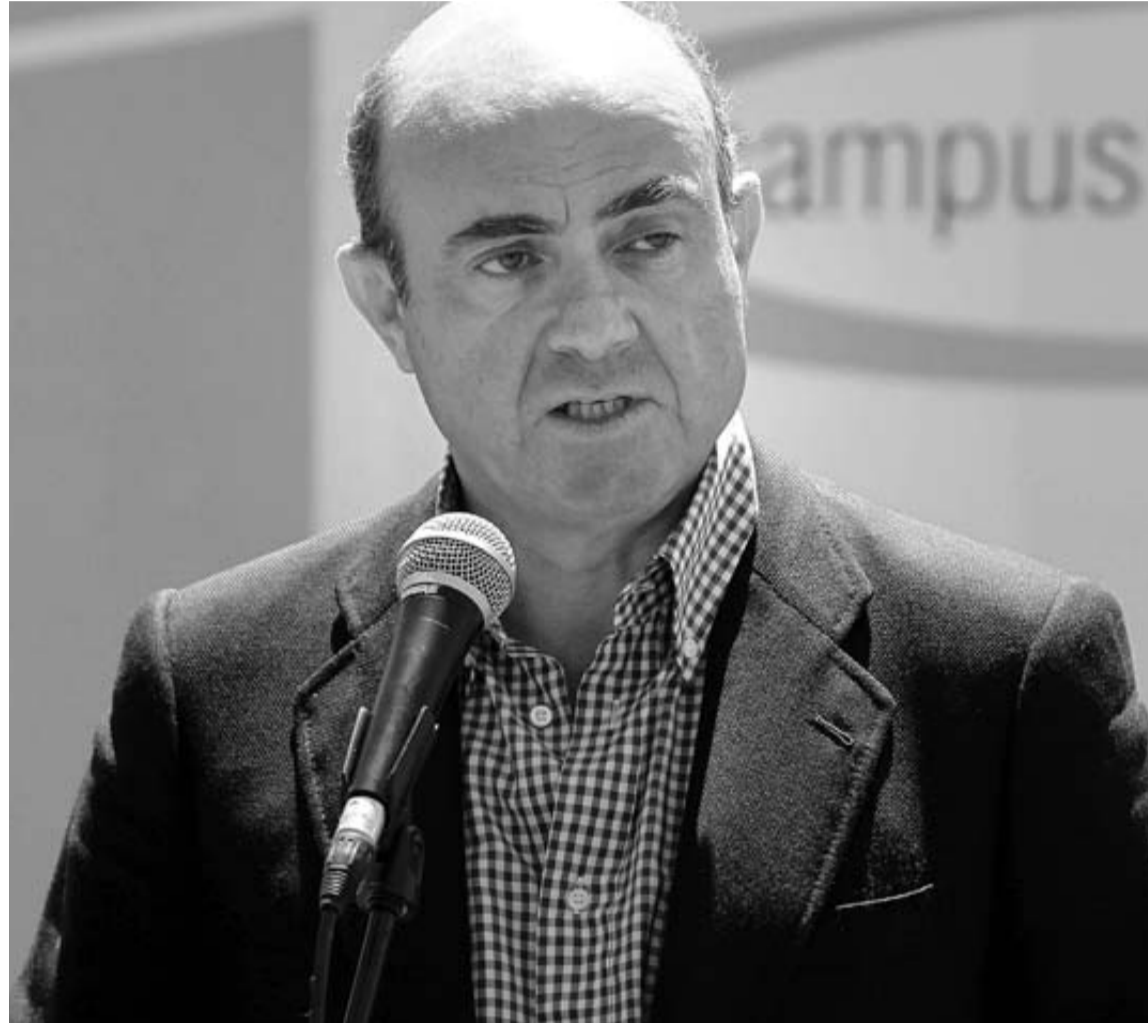
El ministro de Economía, Luis de Guindos, durante su intervención en el campus de la FAES.

Otra máxima de La Moncloa que cumplió el titular de Economía y Competitividad fue la de eludir hablar de vencedores y vencidos tras la cumbre de los países de la zona euro. De Guindos elogió el resultado de este cónclave,