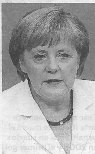
Angela Merkel.

Si el Gobierno quiere imponer ambos mecanismos, tendrá que