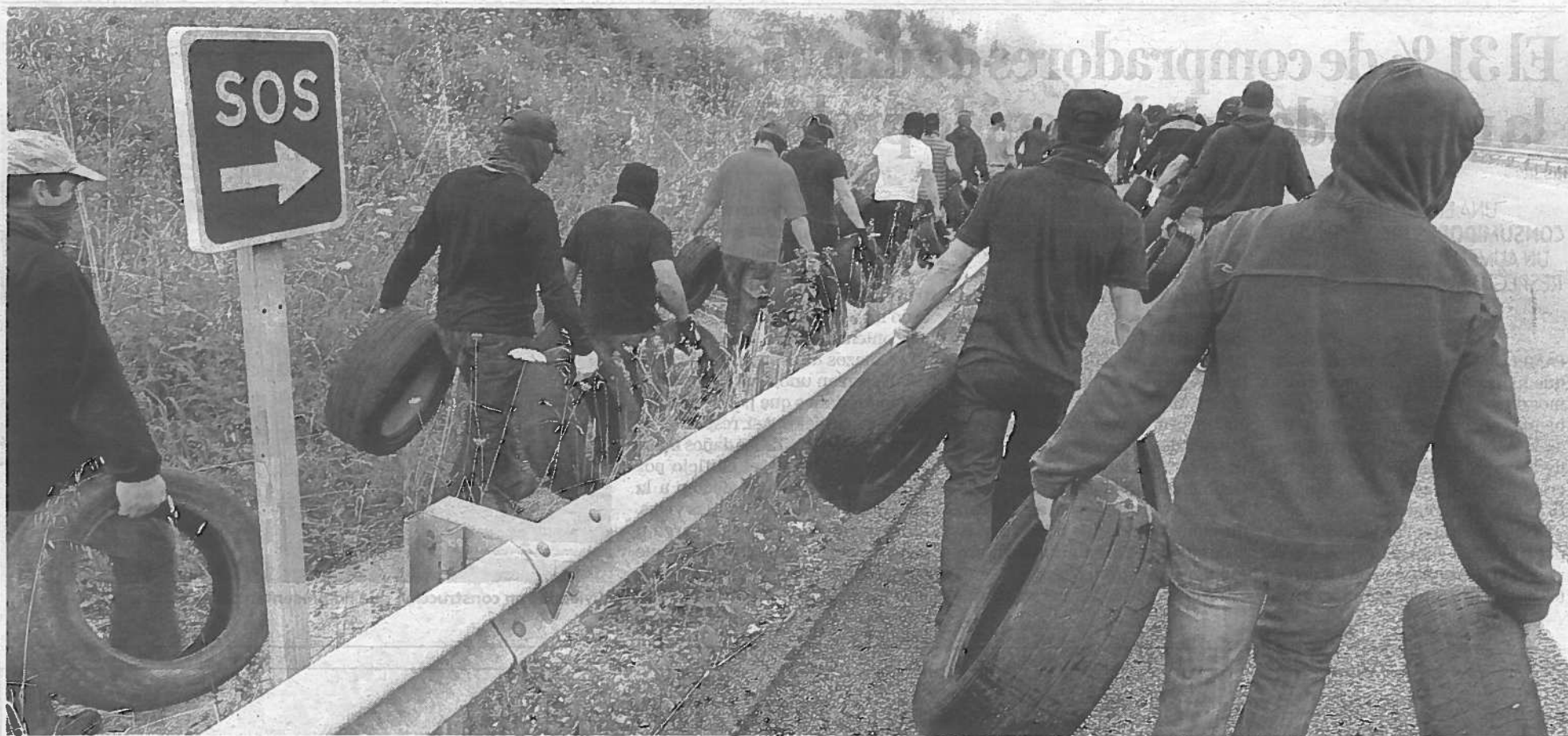
Varios mineros transportan neumáticos usados a los que luego prenderán fuego para cortar una carretera.

La organización es exquisita y quince minutos después de la hora de quedada, la mitad de ellos procede a tomar los neumáticos que el día anterior habían apilado en la parte trasera del hostel mientras el resto aguarda junto a los coches en el aparcamiento. Las ruedas con las que llevan a cabo los cortes las obtienen de los talleres, que salen también beneficiados al darles el mate-