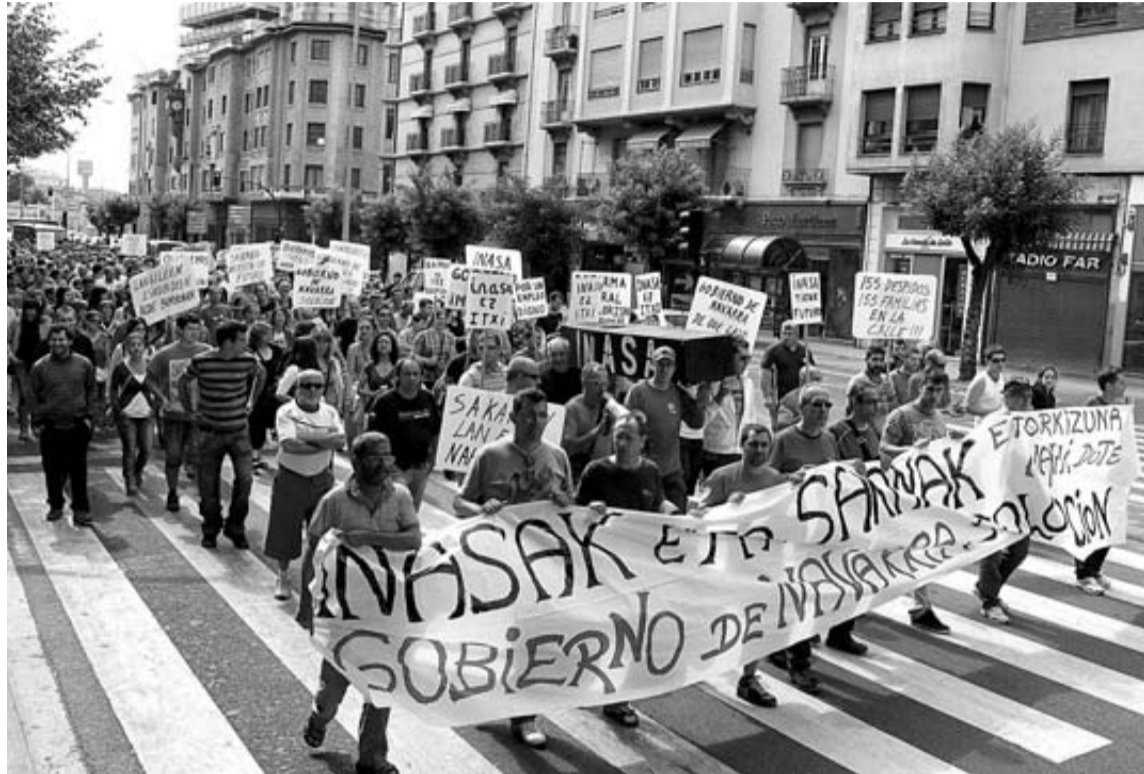
Instante de la manifestación que ayer por la tarde recorrió el centro de Pamplona.

Medio millar de personas clamaron ayer en Pamplona contra el cierre de Inasa Foil en Irurtzun, anunciado el mes pasado por el grupo de capital de riesgo Baikap por "causas económicas". Los manifestantes secundaron al comité de empresa (4 delegados de CCOO, 2 de LAB, 1 de UGT, 1 Solidari y 1 Cuadros) en su petición de implicación dirigida al Gobierno de Navarra para evitar la clausura y conservar los 168 puestos de trabajo. La "búsqueda de alternativas" requerida al Ejecutivo se concreta en la realización de gestiones que conduzcan a la continuidad de la producción con la garantía de un nuevo socio inversor o la constitución de una cooperativa. "Si no sale un inver-