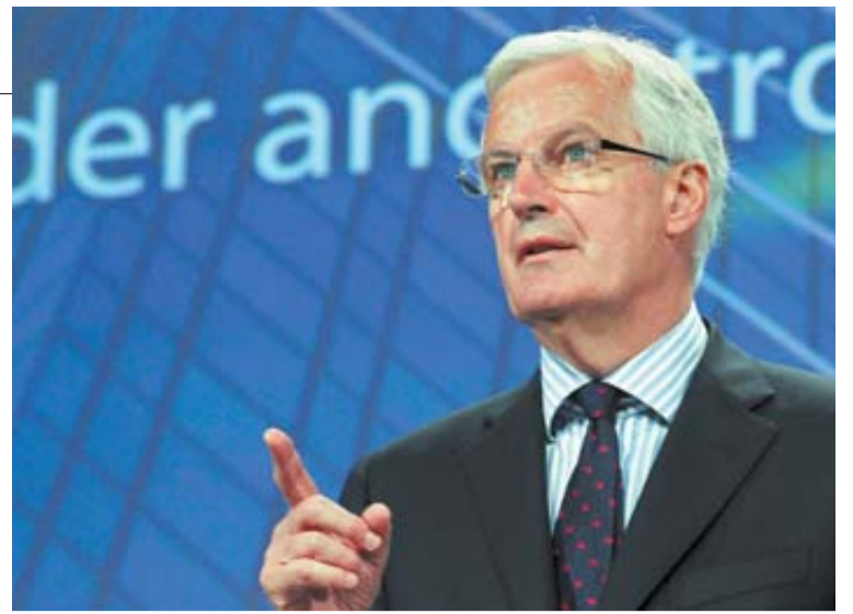
Michel Barnier, comisario del Mercado Interior y Servicios Financieros.

penales el delito sobre la manipulación directa de los índices de referencia, la incitación y la participación en este delito y el intento de amañar esos indicadores, así como establecer sanciones penales efectivas.