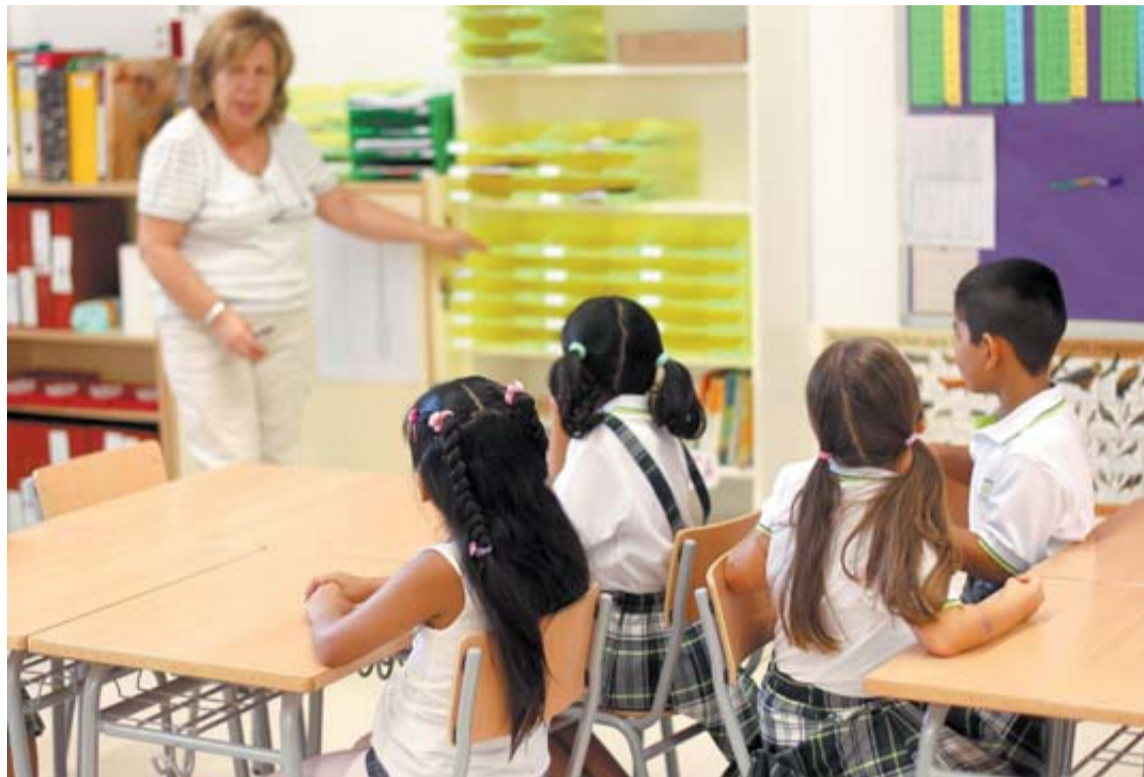
Una profesora se dirige a sus alumnos en una de las clases.