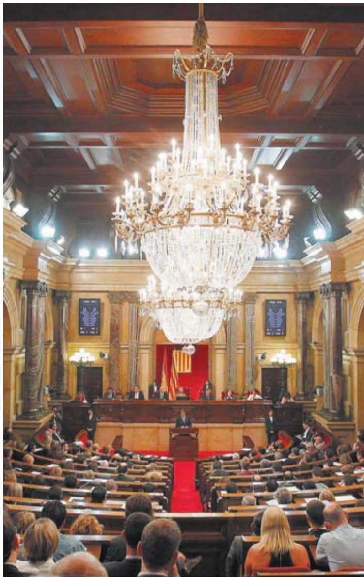
Salón de plenos del Parlamento de Cataluña.

Otra de las grandes novedades del modelo es que la aportación catalana al Estado para pagar los servicios que presta en Cataluña