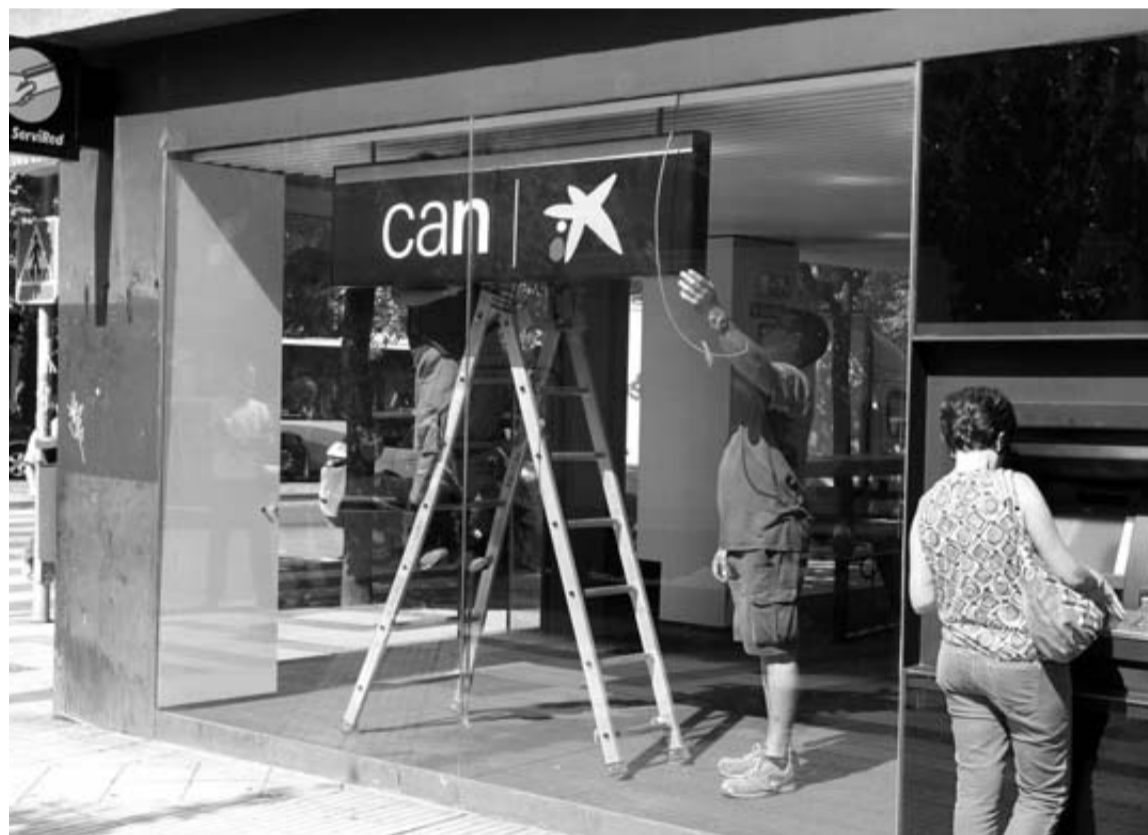
La oficina de CAN de Iturrama transforma su imagen al incluir la estrella de la Caixa.

II Consejo de Administración. Pasa de 16 a 12 miembros, para cuatro años. Tres son designados por el Gobierno de Navarra; uno, por el Parlamento; dos, por las corporaciones municipales (ayuntamientos de Pamplona y Tudela) y seis, entre los representantes de las entidades de relevancia económica, social y cultural (dos de asociaciones empresariales, dos de sindicatos y dos de universidades).