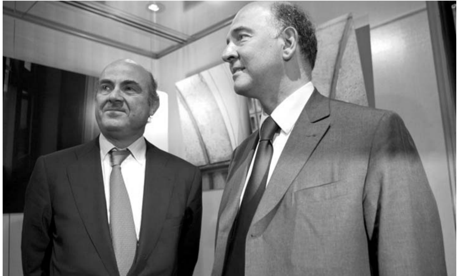
Luis de Guindos y el ministro francés de Finanzas, Pierre Moscovici (derecha), en un encuentro en París el pasado 7 de junio.

La posición oficial del presidente francés fue planteada ante el Consejo de Ministros y revela-