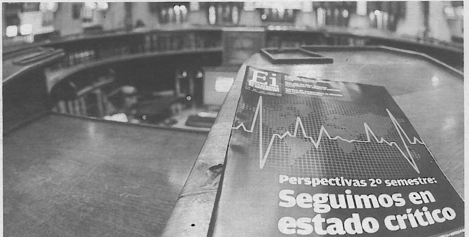
Un libro económico, ubicado en la bolsa española de Madrid, cuyo título hace alusión al momento económico que atraviesa el país.

● Portugal pide una "respuesta europea" para España: El Presidente de Portugal, Aníbal Cavaco Silva, reclamó ayer que se ofrezca una “respuesta europea” a la crisis financiera de la eurozona y de España que complementa las medidas que está adoptando el Gobierno español, dado que “está en juego la estabilidad de la zona euro”.