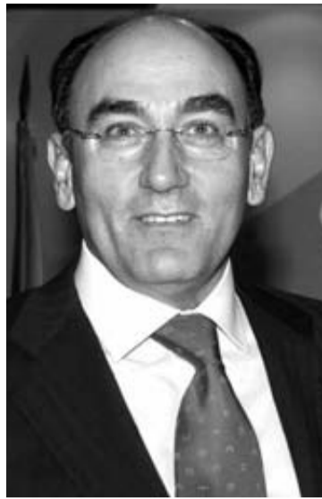
Ignacio Sánchez Galán.

El presidente de la compañía, Ignacio Sánchez Galán, advirtió de que la imposición de medidas "recaudatorias" como parte de la reforma energética puede provocar "el efecto contrario" y dañar la actividad del sector, sus inversiones y los ingresos fiscales.