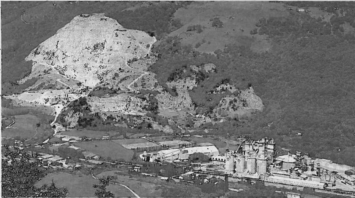
Panorámica de la cementera en Navarra.

El pacto, firmado el martes, contempla parar los centros de Vallcarca y Monjos, ambos en Catalunya, de forma que operarán alternativa-