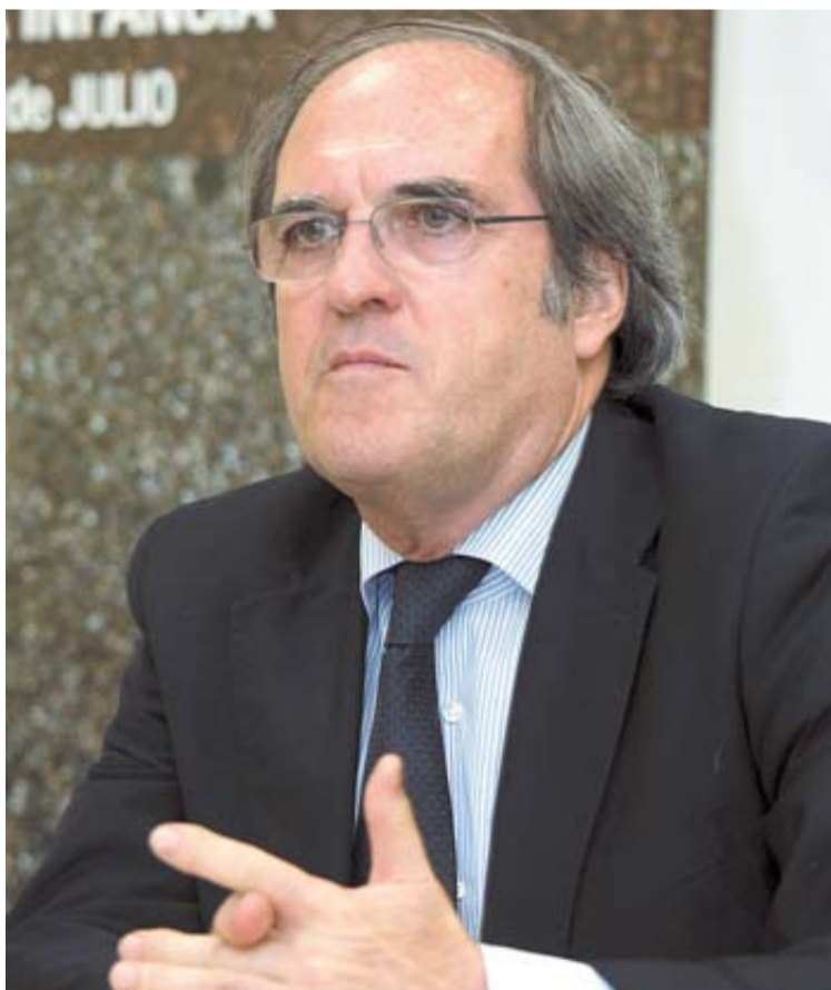
Ángel Gabilondo, en uno de los momentos de la conferencia.

La exclusión del conocimiento es la mayor de las exclusiones. Sé que los ciudadanos entienden que los ajustes son una prioridad. El desafío es ver cómo hacer compatible la calidad con la equidad. Al tener menos recursos, es