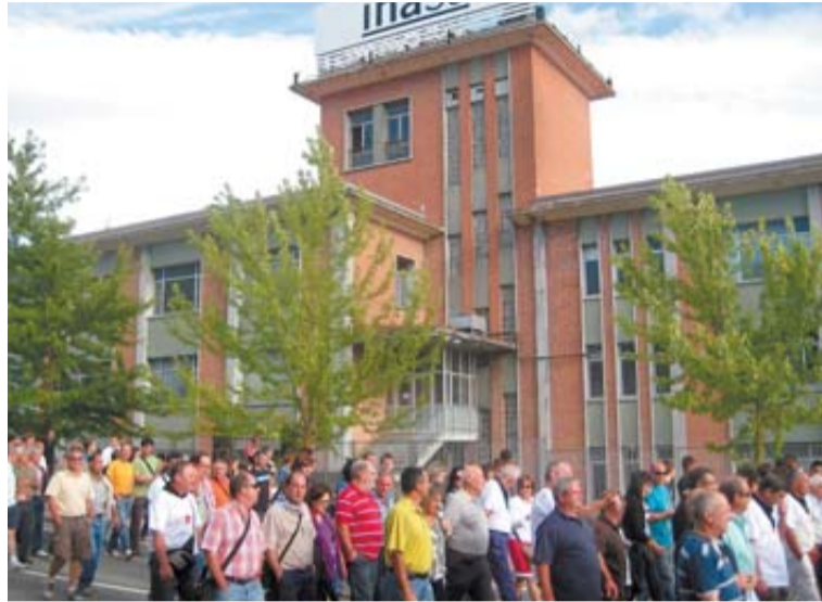
Manifestación del pasado viernes en Irurtzun.

En segundo lugar, ANEL no profundizará en un plan pormenorizado sin antes conocer el número de trabajadores que estarían dispuestos a participar en