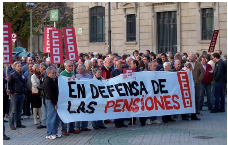
Concentración en defensa de las pensiones en el marco de la primera jornada de la escuela sindical.

"CCOO tiene alternativas a la reforma de las pensiones y ha presentado al Gobierno una batería de propuestas para actuar sobre los ingresos del sistema, reforzándolos con reformas coyunturales por la crisis y estructurales"