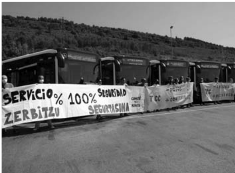
Trabajadores de TCC concentrados frente a los nuevos autobuses.

villavesas, de ellas 56 son híbridas y seis eléctricas, "con lo que el 40% es sostenible", destacó Campión. El 30% de la flota tiene mamparas. Llegaron como elemento de seguridad para los chóferes y ahora son, además, un escudo antiviral.