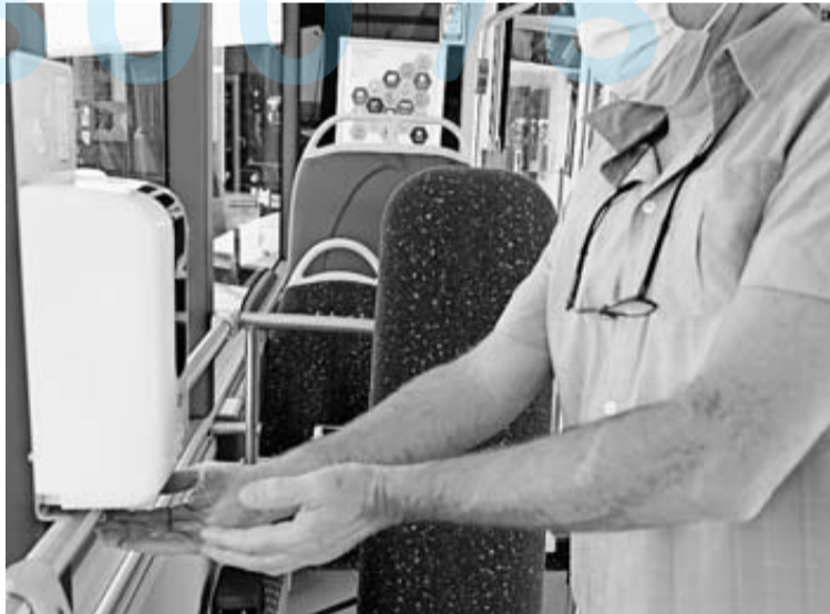
Una persona se lava las manos en el dispensador de hidrogel.

Reparó Campión en que el transporte público ha sido, tras el sanitario, el sector más vapuleado por el covid-19. "Pero a diferencia de la sanidad, aquí cuantos más viajeros haya menos coste tendrá el servicio", indicó y precisó que la crisis ha dejado un sobredéficit de entre 4 y 6 millones. Si el sistema de financiación no cambia lo abo-