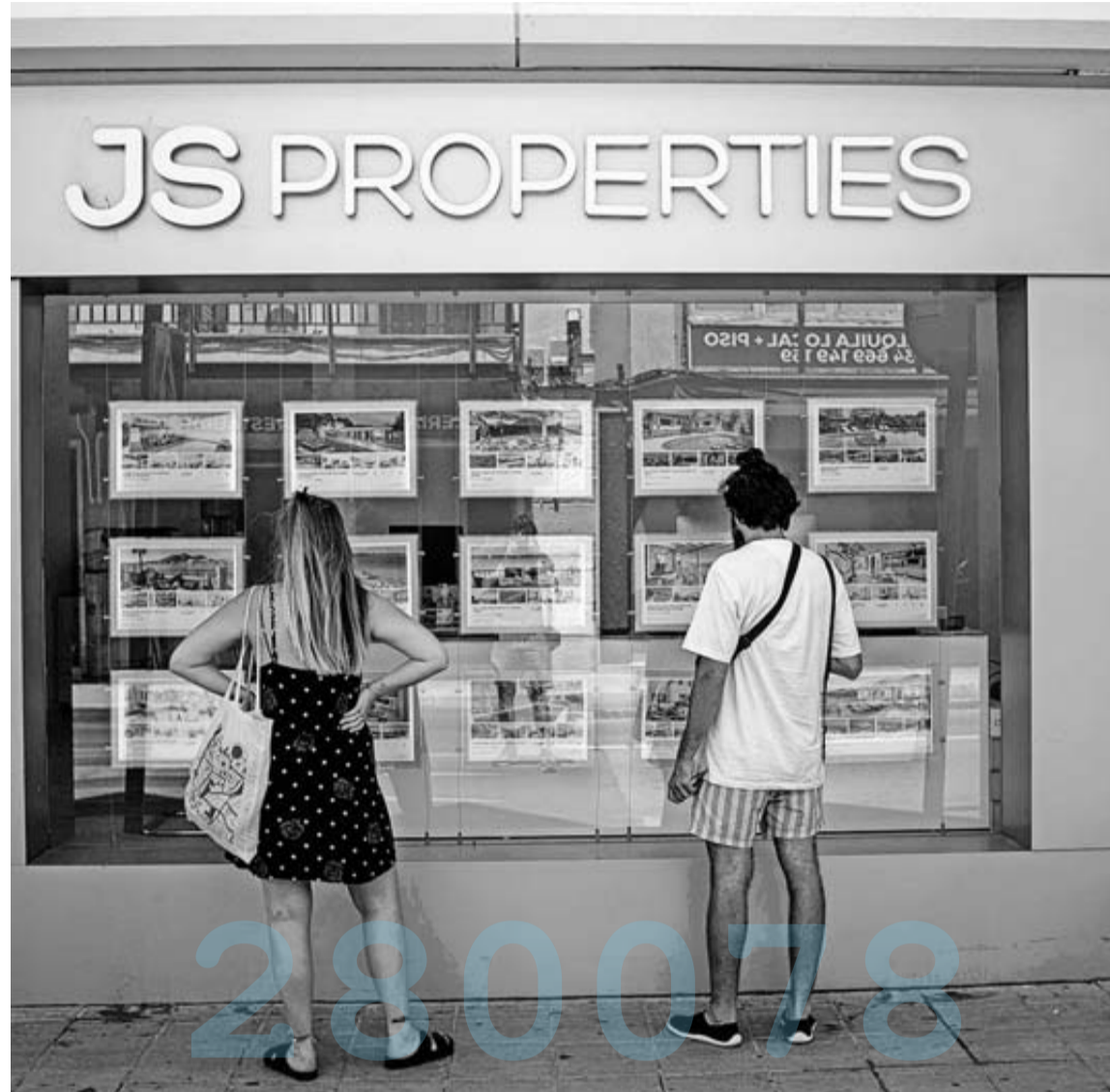
Fachada de una inmobiliaria en Mallorca.

La estadística muestra que el precio medio del alquiler se si-