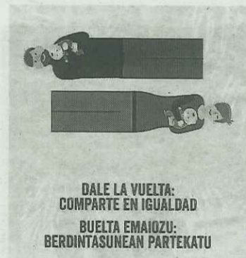
Cartel de la campaña.

Según un estudio que ha puesto en marcha el INAI/NABI sobre el impacto del covid-19 en las mujeres navarras, se ha detectado que las mujeres que están teletrabajando priorizan la atención a las personas que requieren cuidados o al seguimiento de las tareas escolares, relegando su actividad laboral a horarios poco saludables (de madrugada o reduciendo las horas de descanso).