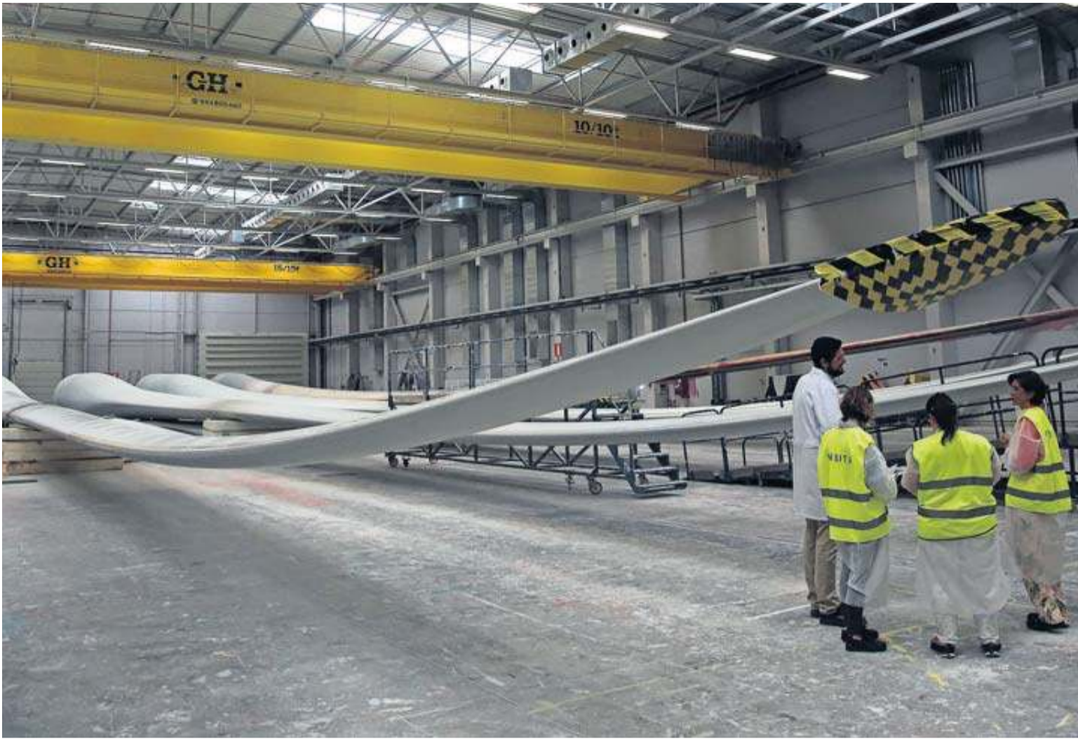
Un grupo de trabajadores en las instalaciones de la fábrica de palas de Gamesa en Aoiz que da empleo a 239 personas.