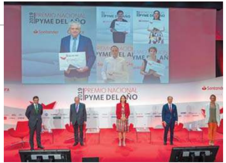
Momento de la entrega de premio y accésit, ayer.

antes esta situación y reducir al máximo el daño al tejido empresarial que es clave para asegurar una recuperación rápida, sostenible e inclusiva".