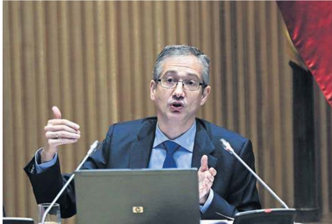
El gobernador del Banco de España, Pablo Hernández de Cos, en una foto de archivo.

En su hoja de medidas para salir de la crisis, el Banco de España aconseja al Gobierno que elabore un plan fiscal a medio plazo con