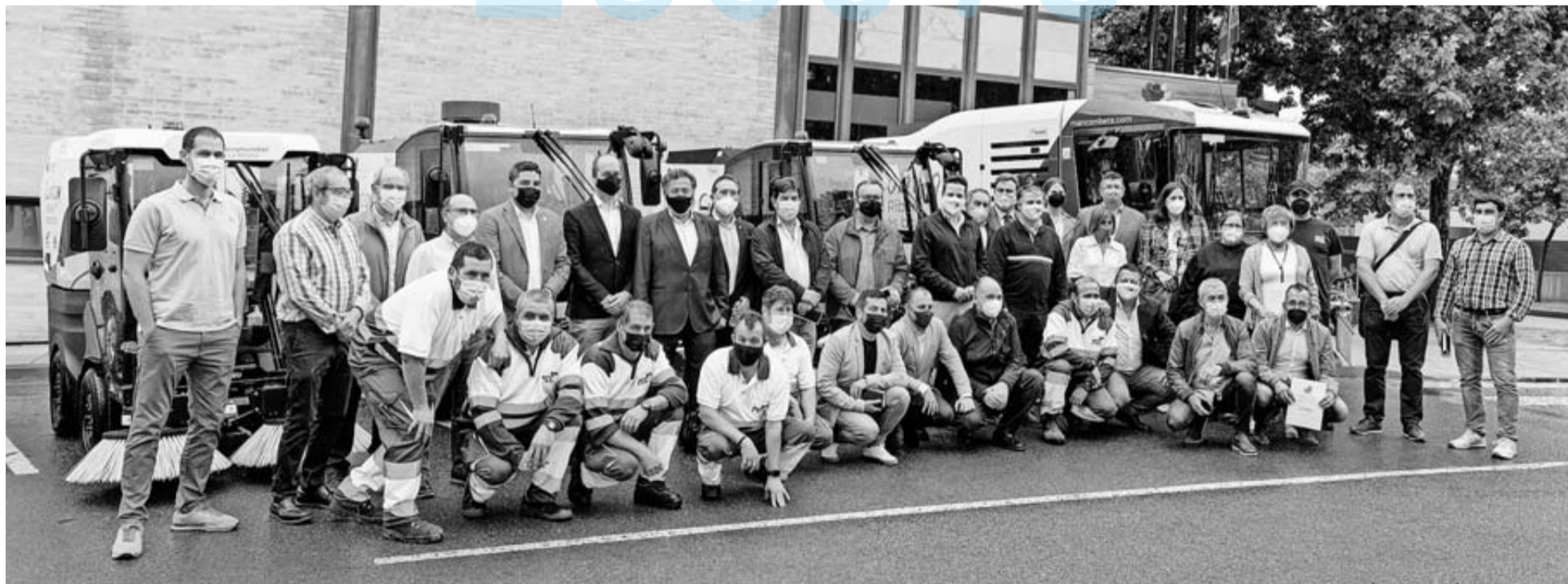
Alcaldes, representantes de la Mancomunidad y de la adjudicataria, y trabajadores del servicio, ante parte de la nueva maquinaria.

Para el nuevo servicio de limpieza la adjudicataria cuenta con 41 empleados, 36 de ellos en la capital ribera "que han sido subrogados", añadió Ferrer.