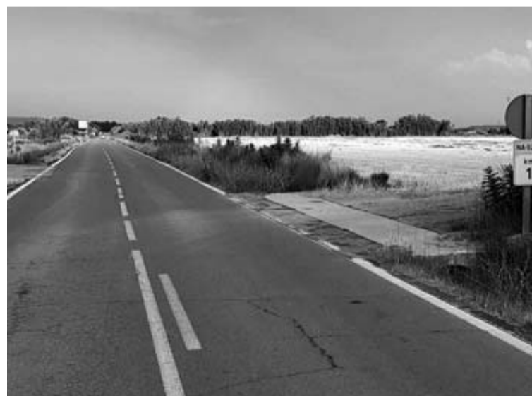
Imagen de la carretera NA-5211 que une Cortes y Aragón.

En los tramos contiguos, tanto en el casco urbano de Cortes como en Aragón, se han realizado actuaciones sobre la calzada para disponer de mayores dimensiones. De hecho, en 2019 se urbanizó el antiguo camino de La Máquina para construir una calle que evita el tráfico, especialmente de vehículos pesados, por el centro Cortes y lo dirige hacia la NA-5221, que ahora completa-