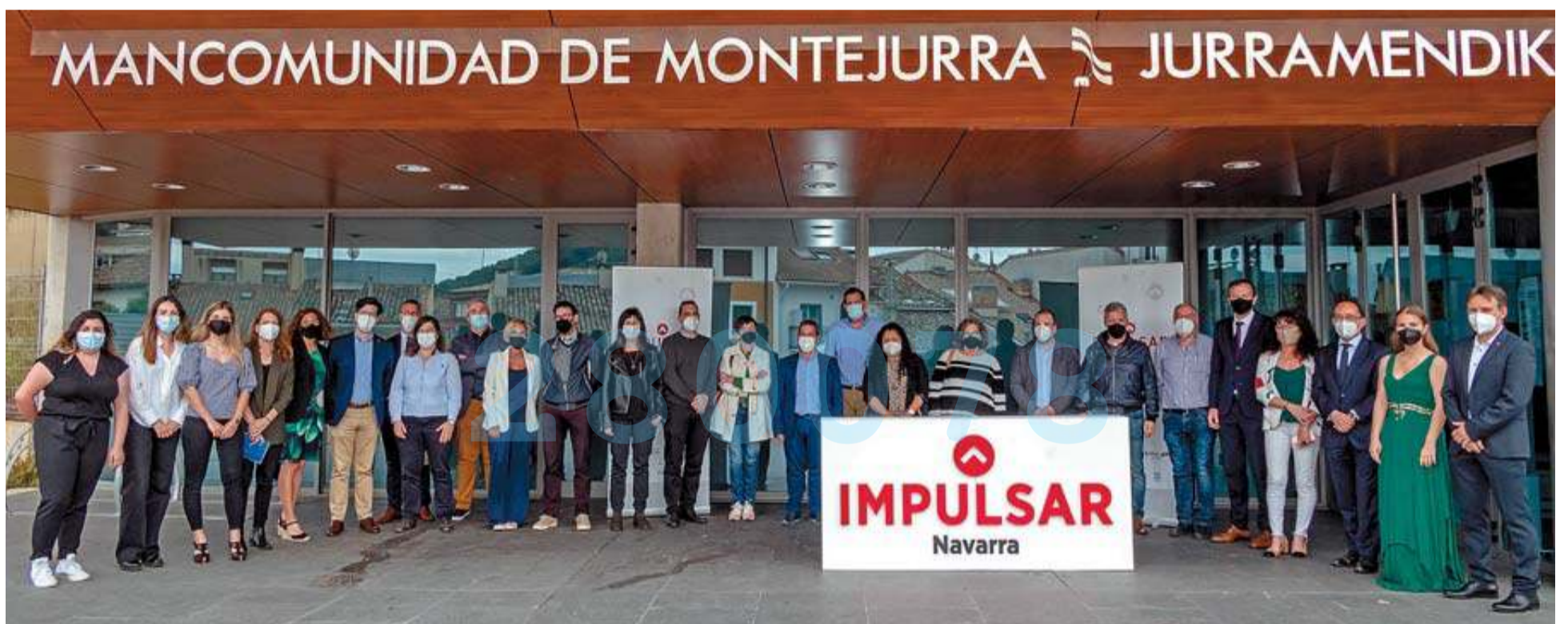
Foto de familia con los participantes y organizadores de Impulsar Navarra en Estella en la entrada de la sede de Mancomunidad de Montejurra.