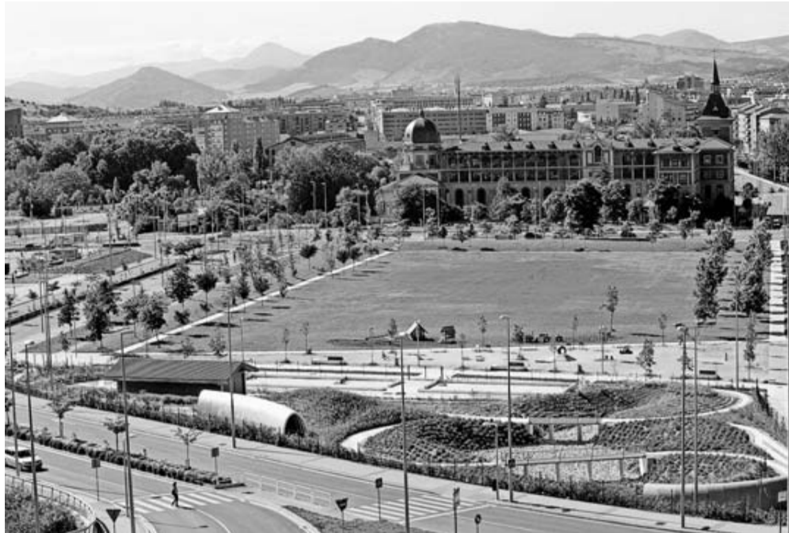
Imagen de 2018 de la explanada donde se levantará el futuro Parque del Tren, en Trinitarios.