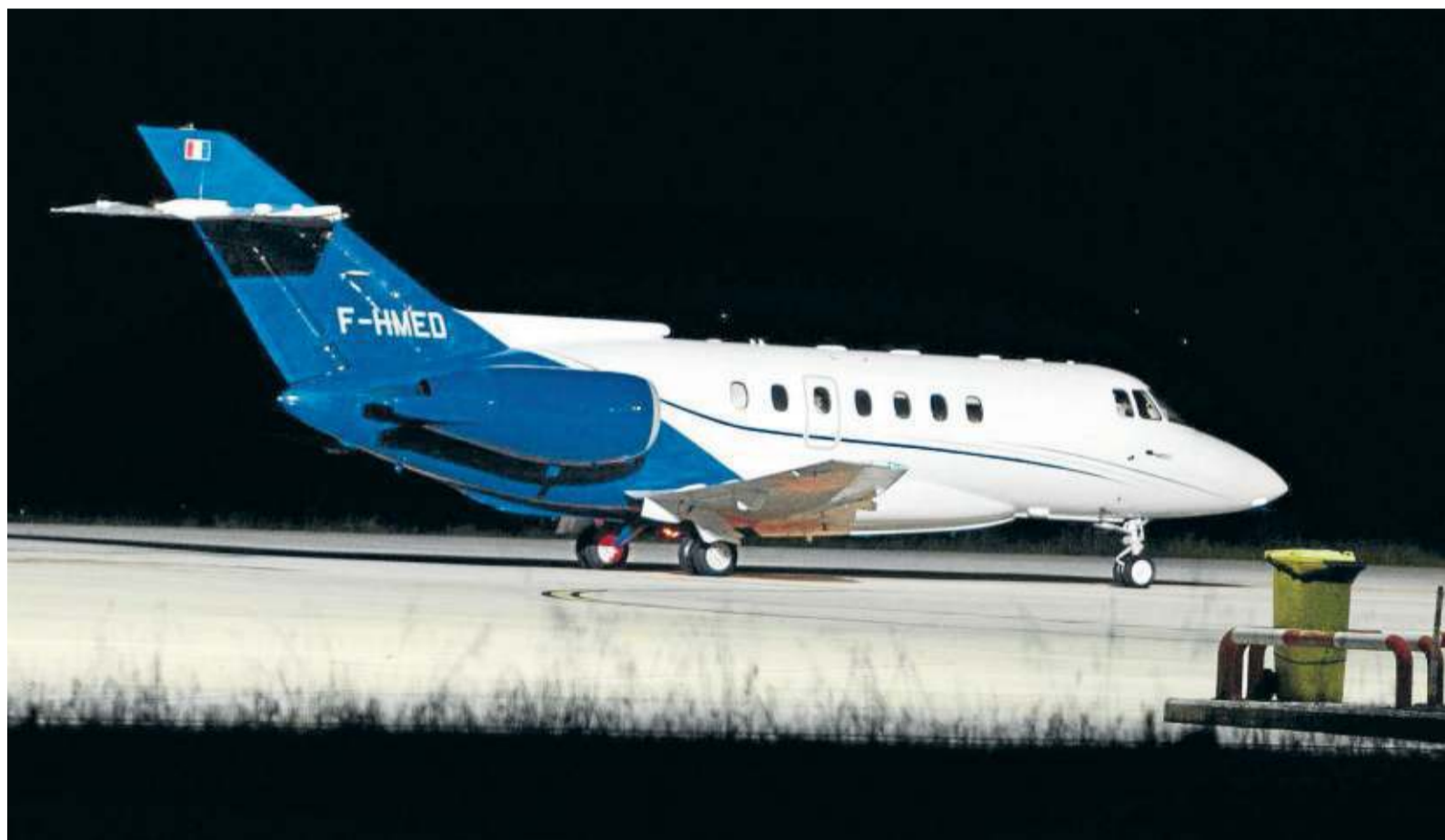
El avión argelino que trasladó a Ghali tomó tierra en Noáin poco antes de las doce y media de la noche.