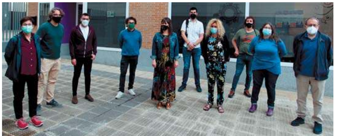
Miembros de IU, Batzarre y Podemos que se reunieron ayer posan en la c/Joaquín Beunza, en Pamplona.