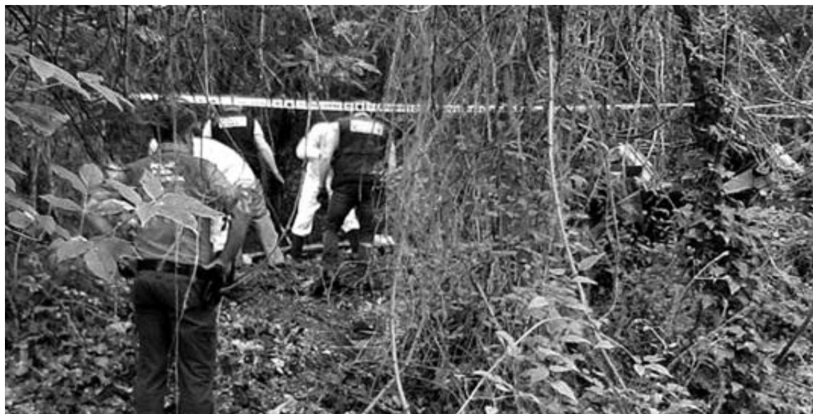
La caseta abandonada se encontraba en una zona de vegetación frondosa, en la zona de Beloso.

La dotación del GRT avistó el vehículo desde el helicóptero junto al repetidor de El Yugo, y posteriormente se comprobó que estaba cerrado. El dispositivo de búsqueda peinó la zona en un radio de más de 1 kilómetro en torno al coche sin hallar objetos o pistas sobre su paradero.