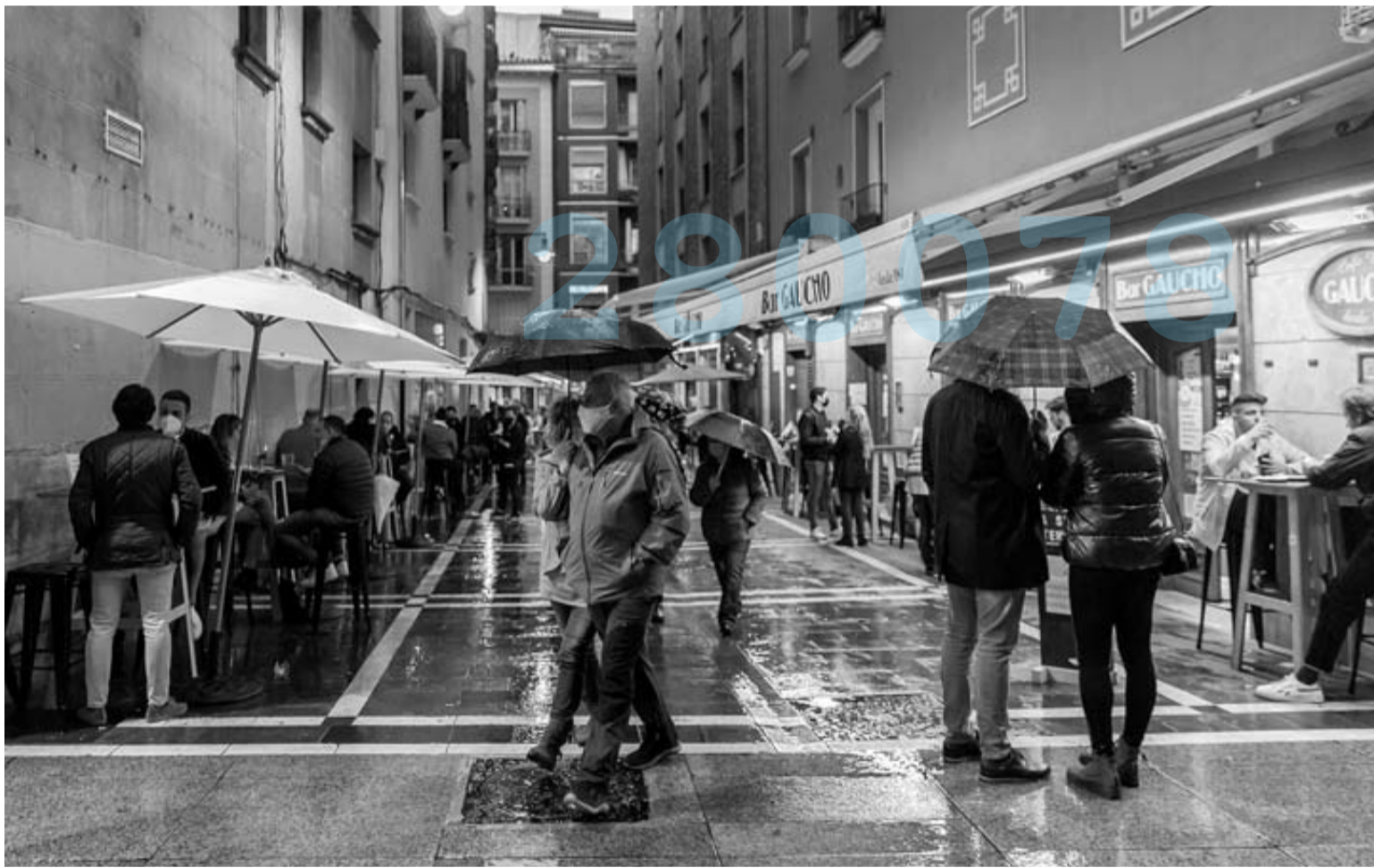
Paseantes y clientes, en el exterior de locales de hostelería de la calle Espoz y Mina de Pamplona en una imagen reciente.

El Consejo Interterritorial se reúne semanalmente para analizar la evolución de la pandemia y de la campaña de vacunación y adoptar las medidas que en ambos casos considere necesarias. Para la cita de hoy, está previsto que las comunidades aborden medidas de seguridad sanitarias que deben mantenerse en eventos y festivales multitudinarios, y de cara al verano. Darias estará en Pamplona presidiendo la reunión junto a Iceta, que por la mañana firmará el traspaso a Navarra de las competencias de sanidad penitenciaria.