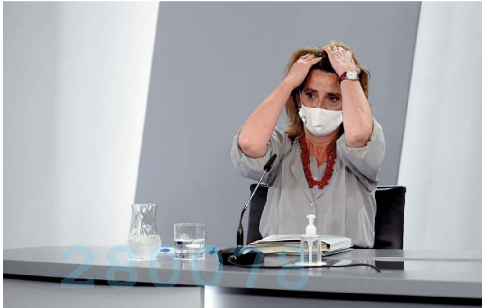
La vicepresidenta y ministra para la Transición Ecológica, Teresa Ribera, ayer en La Moncloa.

El importe restado a estas centrales servirá para reducir los costes regulados que se incluyen en la factura y que financian las primas a las renovables de la burbuja de 2008. Serán unos 900 millones de euros que deberían detraerse del recibo cada año. Representa una reducción del 4% de la factura, unos 2,5 euros al