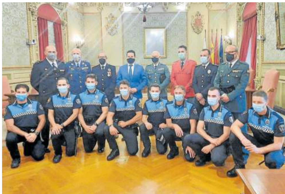
Los agentes posan con los representantes de los cuerpos de seguridad del Estado.