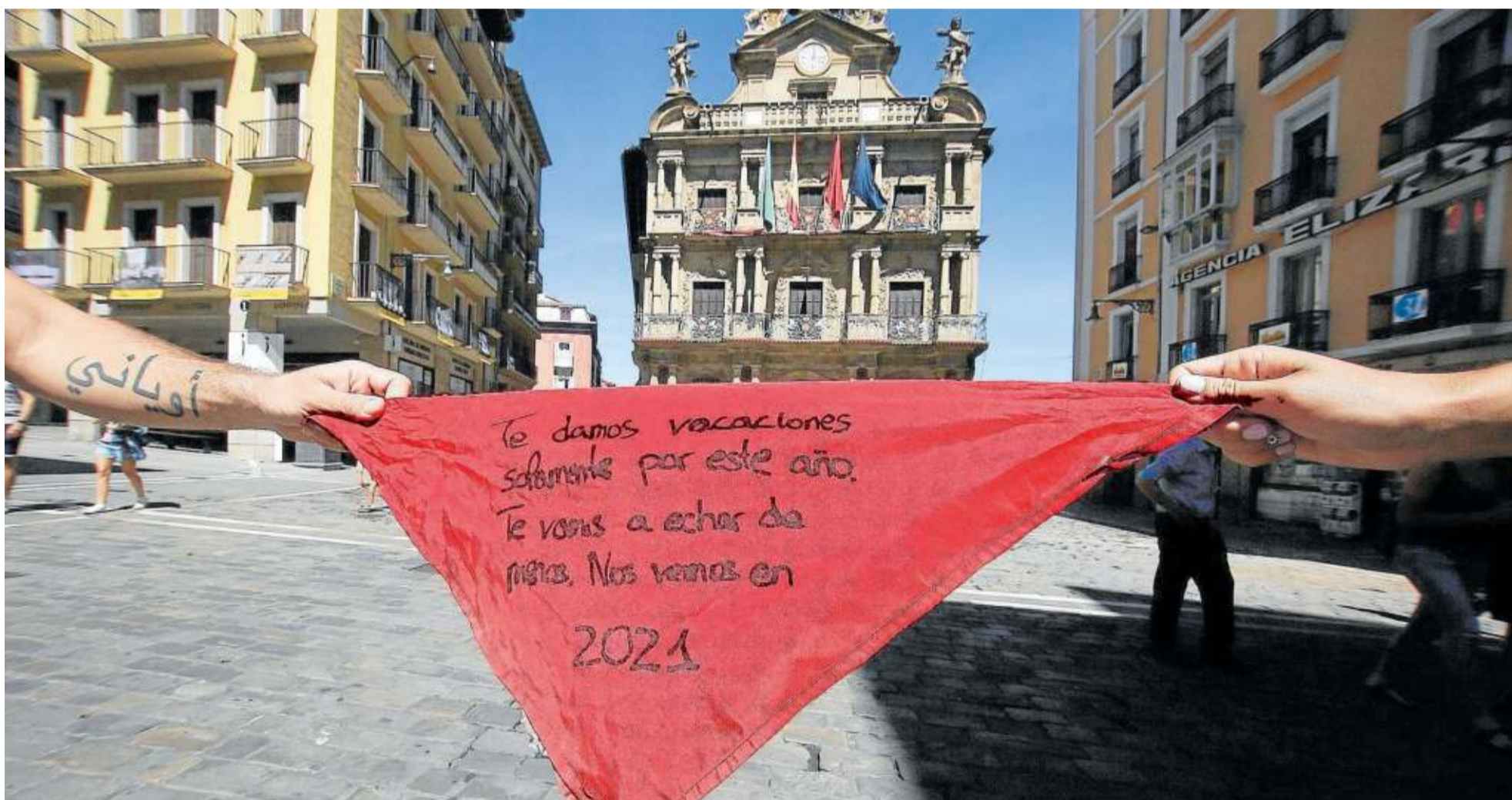
Dos personas sujetan el pañuelo de San Fermín delante del Ayuntamiento de Pamplona con un llamamiento a la no fiesta y a celebrarlos en 2021.

MUERE UN VECINO DE DONEZTEBE ATROPELLADO POR EL COCHE AL QUE FUE A SOCORRER