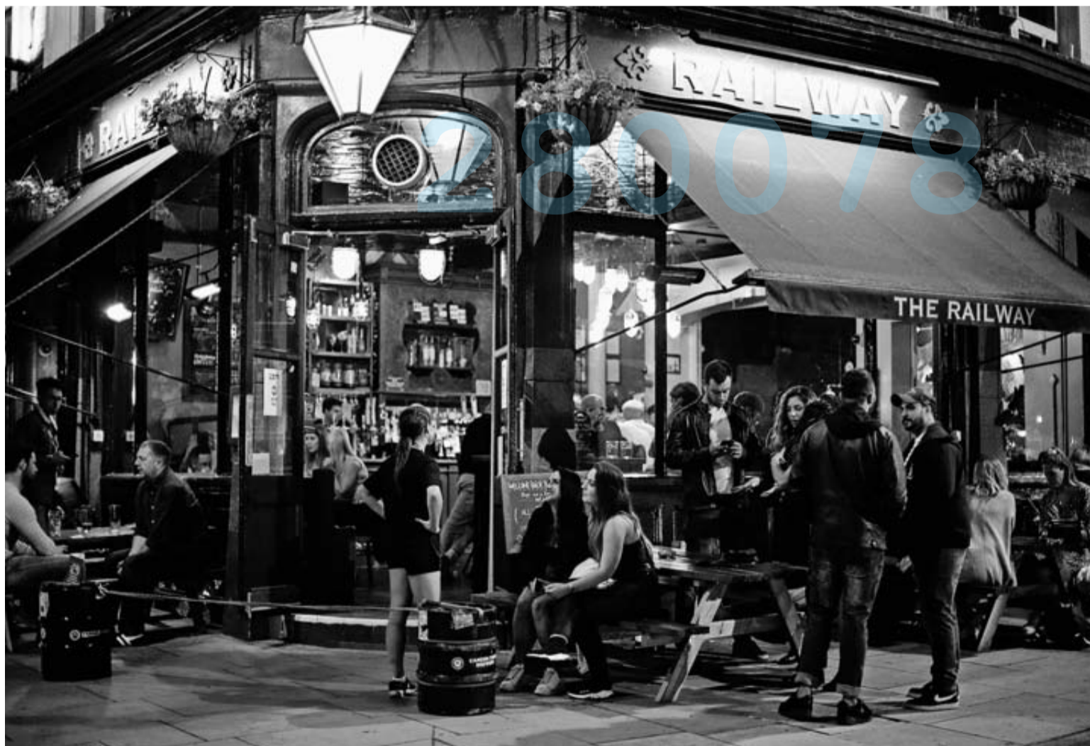
Así estaban los bares en Londres tras su reapertura del confinamiento este fin de semana.

Los empresarios también transmiten sugerencias en materia de política económica. Según el sondeo, el 65% de los empresarios españoles considera que la prioridad que el Gobierno central debería marcarse para estimular la recuperación debería ser disminuir la presión fiscal. Además, un 56% señala como prioridad la mejora del gasto público y un 55%, la garantía de la liquidez a las empresas.