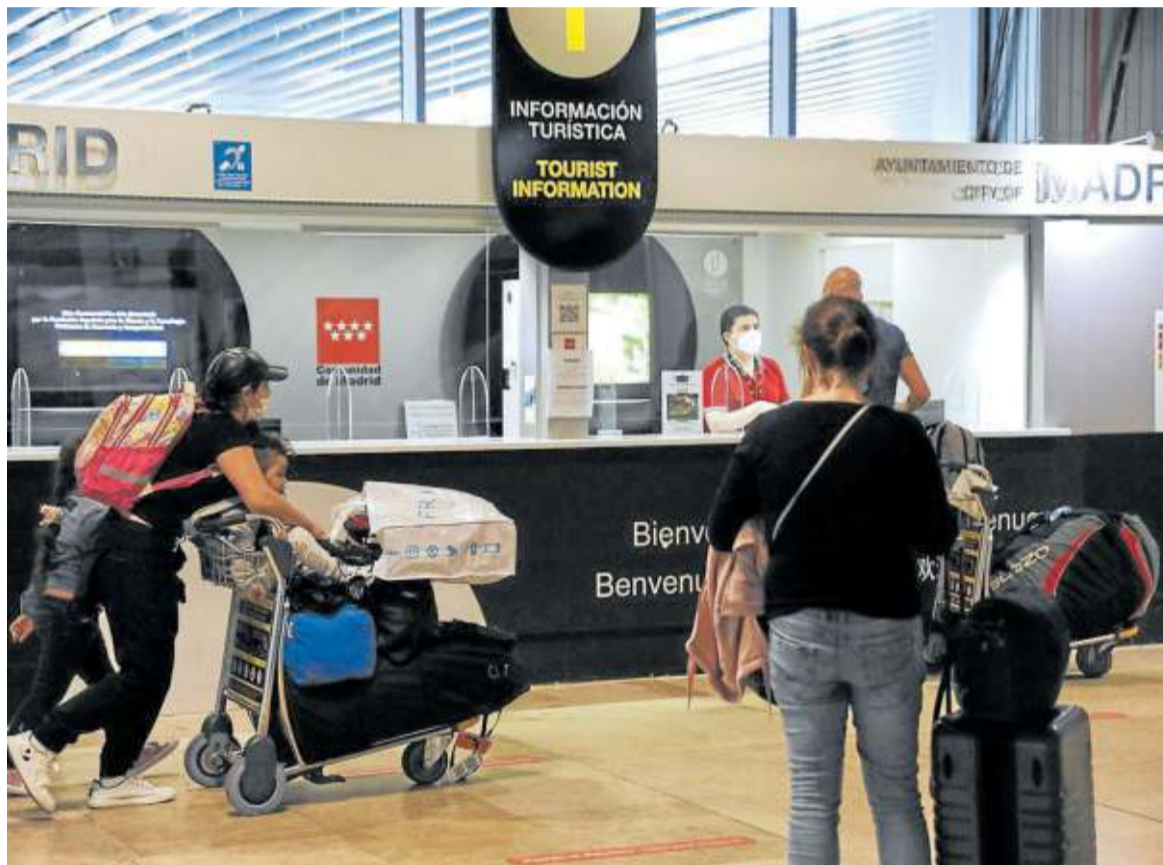
Pasajeros en la sala de llegadas de la Terminal 1 del Aeropuerto de Barajas, en Madrid.

El gasto de los extranjeros en España ha pasado de los 30.884 millones computados entre enero y mayo de 2019 a 11.707 millones al cierre de marzo de este año, cifra que no se ha