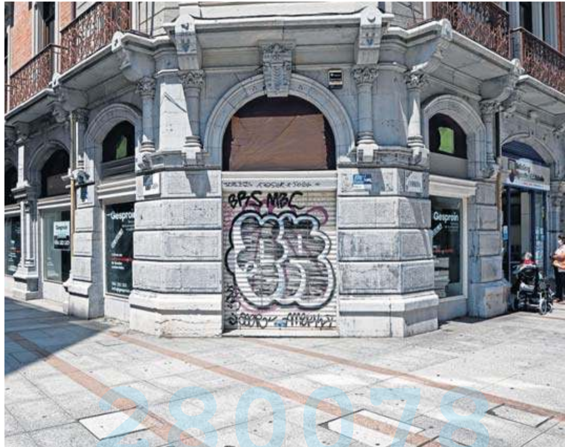
Locales comerciales vacíos en una calle de Gijón.

Y será peor en los centros comerciales: la CEC anticipa el cierre del 50% de los pequeños y medianos comercios de las