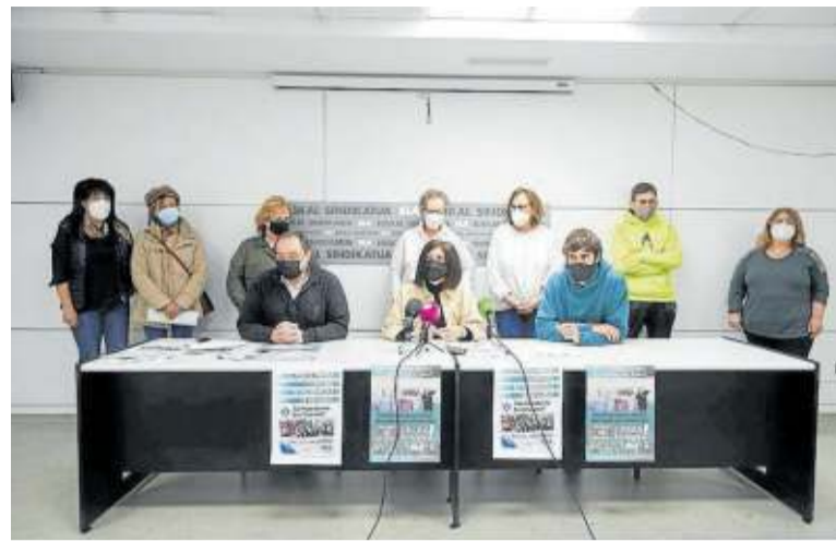
Rueda de prensa de ELA en su sede de Pamplona.

ERE – MTorres presentará, previsiblemente, mañana las medidas no traumáticas para evitar salidas forzadas de la empresa, informaron fuentes sindicales. La dirección explicó ayer a la comisión negociadora las cargas de trabajo previstas en el ejercicio 2021 en la segunda reunión del periodo de consultas del ERE para justificar las 88 extinciones en Torres de Elorz, y 74 en Murcia. La dirección compartió los principales servicios del plan de recolocación. – Diario de Noticias