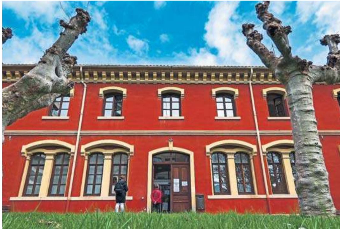
Acceso a dependencias municipales por la fachada trasera del Ayuntamiento de Estella.

En caso de que el recurso no se estime en su totalidad, piden