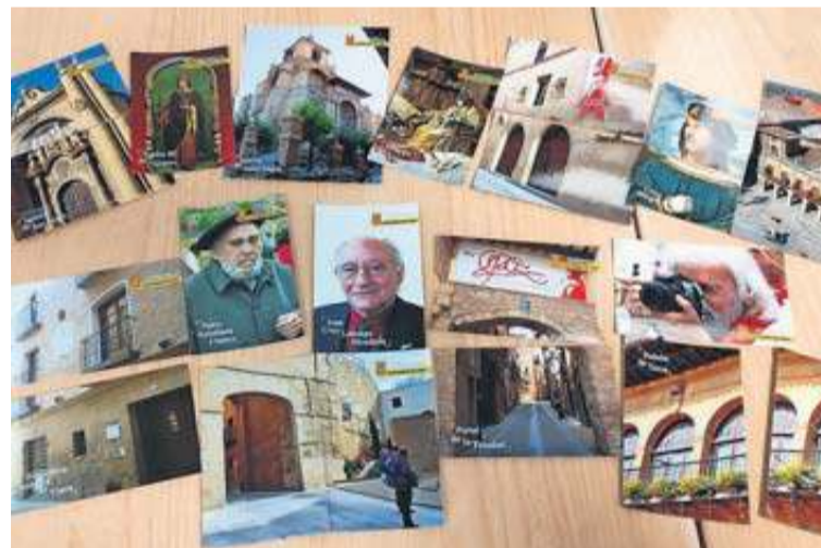
Cromos coleccionables del álbum de la biblioteca vianesa.

La iniciativa es gratuita y está dirigida al público infantil. "Por cada vez que utilicen el servicio de préstamo recibirán un cromo. Cuanto más lo usen, más sobres podrán conseguir. Con la primera entrega se les da el álbum para coleccionar". En total, son 24 cromos y la actividad se desarrollará hasta el 29 de mayo, coincidiendo con el sexto centenario del nacimiento de Carlos de Viana, el primer príncipe que tuvo la ciudad. "Es una pretensión para recordar la historia de Viana desde un punto de vista infantil, más enfocado a los niños y a toda la familia", se-