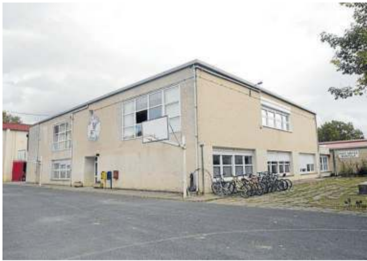
Fachada de la ikastola Iñigo Aritza de Alsasua.