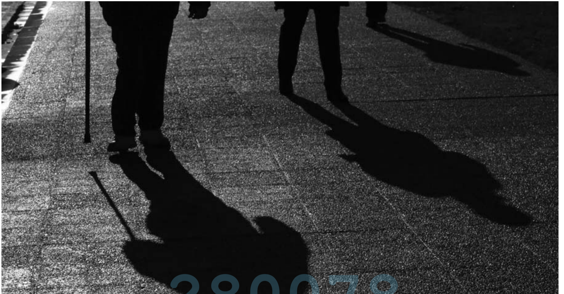
La sombra de dos personas mayores que están paseando por Pamplona se proyecta sobre la acera.