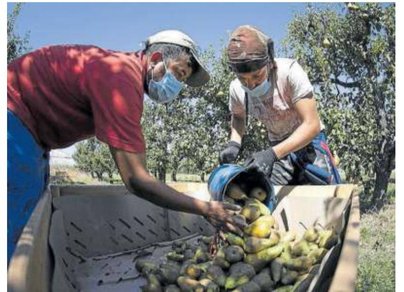
Temporeros recogen peras en la campaña de agosto.

El proceso pivotará sobre tres aspectos. Las personas contratantes deberán firmar una declaración responsable en la que se comprometen a asumir las obligaciones laborales y sanitarias y a tomar las medidas necesarias en seguridad laboral y prevención de riesgos laborales. El documento, previo paso por el Departamento de Desarrollo Rural y Medio Ambiente, será remitido en última instancia al