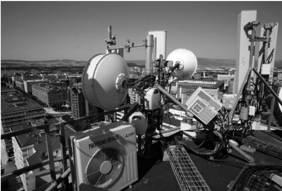
Antenas de datos 5G situadas sobre la Torre Basoko en Pamplona.