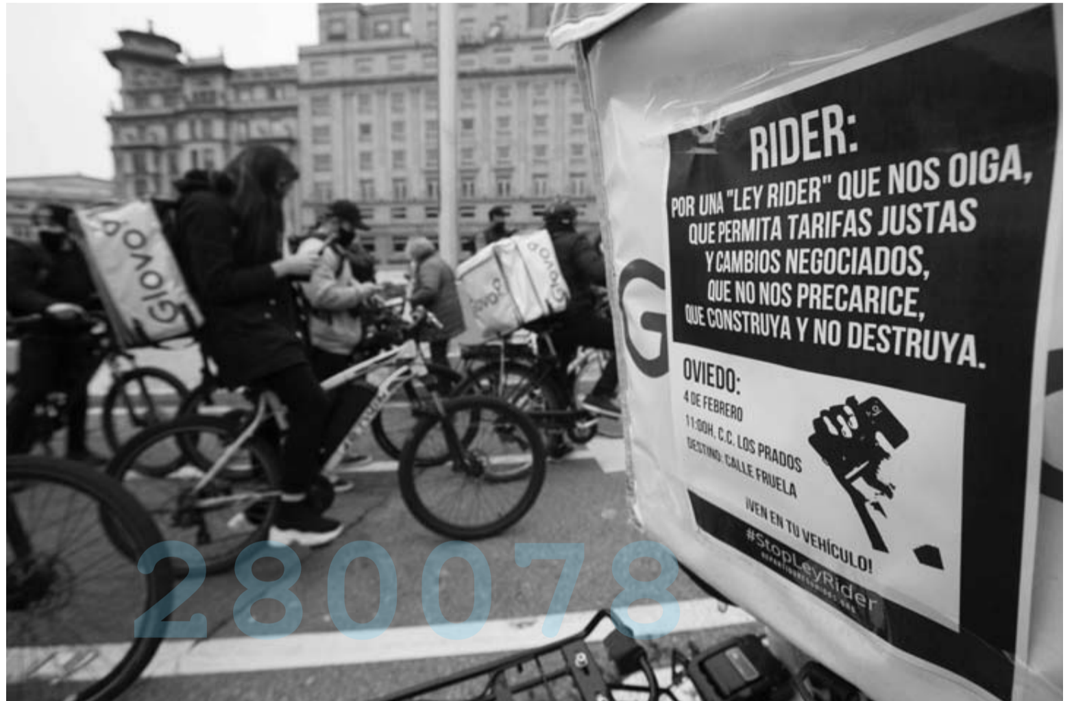
Un grupo de repartidores secunda una protesta a principios de este mes en Oviedo (Asturias).

Pero antes el Consejo de Ministros habrá de aprobar la nueva norma cuya redacción final